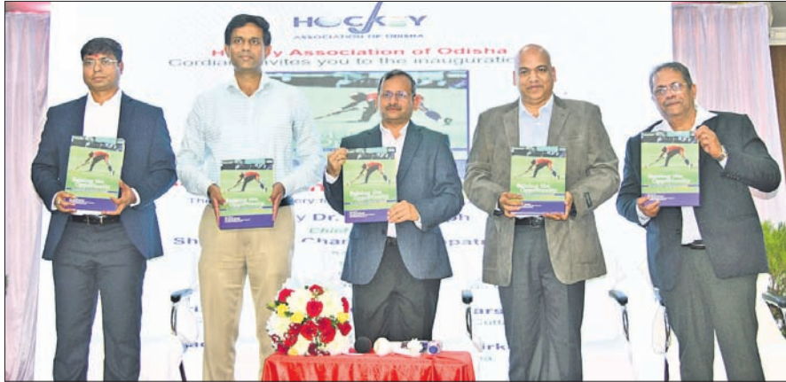
'ସିଜି' ଦି ଅପରୁନିଟି' ପୁସ୍ତକ ଉଦ୍ଘୋଷଣ ଅବସରରେ ଅତିଥିମାନେ।

ଗୋଲରେ ପରାସ୍ତ କରିଥିଲା। ତେବେ ସେମିଫାଇନାଲରେ ଦଳ ଆକ୍ସେଣ୍ସନା ନିକଟରୁ ୦-୩ ଗୋଲରେ ହାରିଯିବାକୁ କ୍ରମାଗତ ତୃତୀୟ ଥରପାଇଁ ପ୍ରତିଯୋଗିତାର ଫାଇନାଲରେ ପ୍ରବେଶକୁ ବଞ୍ଚେଇ ହୋଇଥିଲା। ଚାଲିଚଳୁଥିବା ଉଦ୍ଘୋଷଣ ଆଶା ଧୂଳିସାତ ହୋଇଯାଇଥିବାବେଳେ ଦଳ ଆଗାମୀ ମ୍ୟାଚ ଜିତି ତୃତୀୟ ଘ୍ରାଣରେ ରହି ପ୍ରତିଯୋଗିତା ଶେଷ କରିବା ଯୋଜନାରେ ରହିଛି।