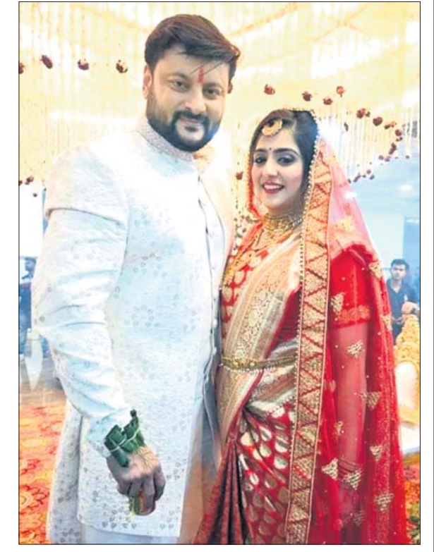
ଭାଇରାଲ ହୋଇଥିବା ଅନୁଭବଙ୍କ ବରବେଶି ଫଟୋ।