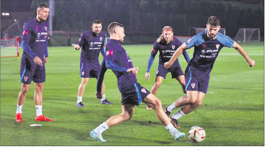
ଖଳିଫା ଇଣ୍ଡରମ୍ୟାଗନାଲ ଷ୍ଟାଡ଼ିୟମରେ ଶୁକ୍ରବାର ଅଭ୍ୟାସରେ କ୍ରୋଏସିଆ ଦଳ।

ବୋହା, ୧୬/୧୨ ଚଳିତ ଫିଫା ବିଶ୍ୱକପର ତୃତୀୟ ଘ୍ରାଣ ପାଇଁ ଫ୍ଲୋ-ଅପ୍ ମ୍ୟାଟ ଶନିବାର ଘ୍ରାଣୀୟ ଖଳିଫା ଇଣ୍ଡରମ୍ୟାଗନାଲ ଷ୍ଟାଡ଼ିୟମରେ ଅନୁଷ୍ଠିତ ହେବ। ପରାଜିତ ହୁଇ ସେମିଫାଇନାଲିଷ୍ଟ ଦଳ ମରଲୋ ଓ କ୍ରୋଏସିଆ ଏହି ମ୍ୟାଚରେ ପରସ୍ପରର ମୁକାବିଲା କରିବେ। ପ୍ରଥମ ଆଫ୍ରିକୀୟ ଦଳଭାବେ ମରଲୋ କୌଣସି ଫିଫା ବିଶ୍ୱକପର ଫ୍ଲୋ-ଅପ୍ ଖେଳିବାକୁ ଯାଉଛି। ତେଣୁ ଯଥା ସମ୍ଭବ ମଥା ଉଜ୍ଜ୍ୱଳ କରି ଏହି ଦଳ ପ୍ରତିଯୋଗିତା ଶେଷ କରିବା ଲକ୍ଷ୍ୟରେ ରହିଛି। ଅନ୍ୟପକ୍ଷରେ ଗତଥରର ଉତ୍ତରାଧିକାରୀ କ୍ରୋଏସିଆ ଏହାକୁ ମିଶାଇ ୨ୟ ଥର ପାଇଁ ଫ୍ଲୋ-ଅପ୍ ଖେଳିବ। ୧୯୯୮ ବିଶ୍ୱକପରେ ଏହି ଦଳ ପ୍ରଥମେ ଫ୍ଲୋ-ଅପ୍ ଖେଳିଥିଲା ଏବଂ ନେଦରଲ୍ୟାଣ୍ଡକୁ ୨-୧ ଗୋଲରେ ହରାଇ ତୃତୀୟଘ୍ରାଣ ଅଧିକାର କରିଥିଲା। ତେଣୁ ଆଗାମୀ ମ୍ୟାଚରେ ମଧ୍ୟ ଦଳ ଅନୁରୂପ ପ୍ରଦର୍ଶନ ଆଶା ରଖିଛି। ବିଶ୍ୱକପର ପୂର୍ବ ୧୯ଟି ସଂସ୍କରଣରେ ଫ୍ଲୋ-ଅପ୍ ମ୍ୟାଟ କେବେହେଲେ ପେନାଲ୍ଟି ଶୁଟଆଉଟ ପର୍ଯ୍ୟାୟକୁ ଯାଇନାହିଁ। ୧୯୮୬ରେ କେବଳ ଥରେ ଫ୍ରାନ୍ସ-ବେଲଜିୟମ ମ୍ୟାଚ ଅତିରିକ୍ତ