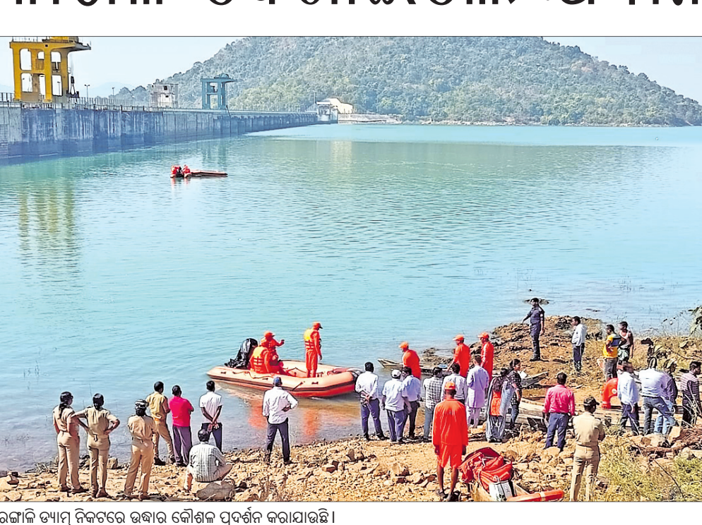
ରେଙ୍ଗାଳି ଡ୍ୟାମ୍ ନିକଟରେ ଉଦ୍ଧାର କୌଶଳ ପ୍ରଦର୍ଶନ କରାଯାଇଛି।