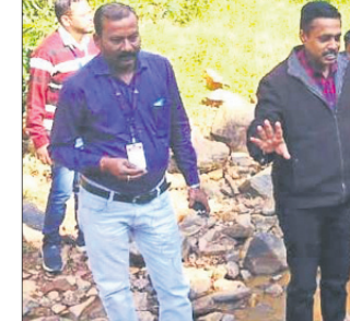
ପୁରୁପାଳ ଗ୍ରାମ ରାସ୍ତାରେ ଜିଲ୍ଲାପାଳ, ଜିଲ୍ଲା ବନଖଣ୍ଡ ଅଧିକାରୀଙ୍କ ସମେତ ଅନ୍ୟମାନେ।

ଡେକାନାଲ ଜିଲ୍ଲା ବନ ବିଭାଗକୁ ଘାରିଛି ସାମାନ୍ତରା ଉପାନ୍ତ ଅଞ୍ଚଳର ଜଙ୍ଗଲ ସୁରକ୍ଷା ଚିତ୍ରା। ବାହାର ଜିଲ୍ଲାର ଶିକାରୀଙ୍କ ଉପଦ୍ରବ ରୋକିବା, ବନାଗ୍ନି କବଳକୁ ଅରଣ୍ୟ ଏବଂ ବନ୍ୟଜନ୍ତୁକୁ ସୁରକ୍ଷା ଦେବା ଲାଗି ଏବେ ଉଦ୍ୟମ ଆରମ୍ଭ ହୋଇଛି। ଏଥିରେ ସ୍ଥାନୀୟ ଅଞ୍ଚଳର ଯୁବକଙ୍କୁ ନିୟୋଜିତ କରାଯିବ। ପ୍ରାରମ୍ଭିକ ପର୍ଯ୍ୟାୟରେ ୫ଜଣଙ୍କୁ ପ୍ରଶିକ୍ଷଣ ଦିଆଯିବ। ଆଗାମୀ ଦିନରେ ଏହି ସଂଖ୍ୟା ବୃଦ୍ଧି କରାଯିବ ବୋଲି ବନ ବିଭାଗ ପକ୍ଷରୁ ସୂଚନା ଦିଆଯାଇଛି। ଆଦିବାସୀ ବହୁଳ କଳଡ଼ାହାଡ଼