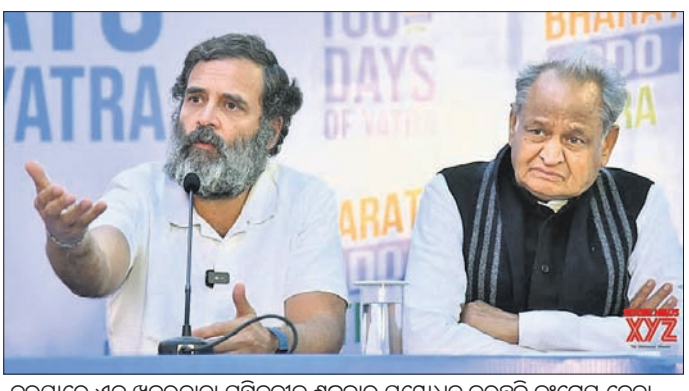
ଦତ୍ତପାରେ ଏକ ଖବରଦାତା ସମ୍ମିଳନୀକୁ ଶୁକ୍ରବାର ସମ୍ବୋଧିତ କରୁଛନ୍ତି କଂଗ୍ରେସ ନେତା ରାଷ୍ଟ୍ରଲ ଗାନ୍ଧୀ। ନିକଟରେ ଅଛନ୍ତି ରାଜସ୍ଥାନ ମୁଖ୍ୟମନ୍ତ୍ରୀ ଅଶୋକ ଚେହଲଟ।

କନ୍ୟପୁର/ଭୁଆଦିଲୀ, ୧୬।୧୨ ଭାରତ ସହ ମୁଦ୍‌ ପାଇଁ ଚାଇନା ପ୍ରସ୍ତୁତ ଚଳାଇଛି। ପ୍ରକୃତ ନିୟନ୍ତ୍ରଣରେଖା (ଏଲ୍‌ଏସି) ସଂଲଗ୍ନ ଅଞ୍ଚଳରେ ସୈନ୍ୟ ଓ ଅସ୍ତ୍ରଶସ୍ତ୍ର ଠୁଳକୁ ବେଶ୍‌ଲେ ଏହା ବୁଝାପଡ଼ୁଛି। କିନ୍ତୁ ଆମ ସରକାର ଏହାକୁ ଗ୍ରହଣ କରିବାକୁ ନାହାନ୍ତି। ମୋଦି ସରକାର ଉତ୍ତରୀଣ ଉପରେ କାର୍ଯ୍ୟ କରିବା ପରିବର୍ତ୍ତେ ଇଭେଣ୍ଟ ମ୍ୟାନେଜମେଣ୍ଟରେ ବ୍ୟସ୍ତ ବୋଲି ଶୁକ୍ରବାର କଂଗ୍ରେସ ନେତା ରାଷ୍ଟ୍ରଲ ଗାନ୍ଧୀ କେନ୍ଦ୍ରକୁ ଚାର୍ଜେଟ କରିଛନ୍ତି। ସପ୍ତାହେ ତଳେ ଅଭିଶାପକ ପ୍ରଦେଶର ତତ୍ତ୍ୱାବଳରେ ଚାଇନାର ପିପୁଲ୍‌ସ୍‌ ଲିବରେଶନ ଆର୍ମି (ପିଏଲ୍‌ଏ) ସୈନ୍ୟଙ୍କ ଆକ୍ରମଣରେ ୬ ଭାରତୀୟ ଯବାନ ଆହତ ହେବା ପରେ ଏହାକୁ ନେଇ ପାଲିମେଣ୍ଟ ଭିତରେ ଓ ବାହାରେ ବଡ଼ ବିତର୍କ ସୃଷ୍ଟି ହୋଇଛି। ତତ୍ତ୍ୱାବଳ ସେକ୍ଟରରେ ପିଏଲ୍‌ଏ ସ୍ଥିରାବଳ୍ତା ପରିବର୍ତ୍ତନ ପାଇଁ ଉଦ୍ୟମ କରିଥିବାବେଳେ ଭାରତର ଇଚ୍ଛା ଭୂମି କେନ୍ଦ୍ର ନେଇପାରିବେ ନାହିଁ ବୋଲି ସରକାର ବାହୁଡ଼େଇତ ମାଗୁଛନ୍ତି। ଏହି ପରିପ୍ରେକ୍ଷାରେ ରାଷ୍ଟ୍ରଲଙ୍କ ମାତ୍ର ବ୍ୟବସ୍ଥା ବିଶେଷ ଗୁରୁତ୍ୱ ବହନ କରିଛି।