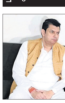
ଖବରଦାତା ସମ୍ମିଳନୀରେ ଭାଗପା ଏମ୍ପି।