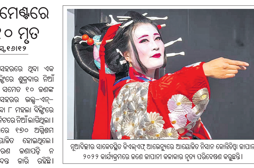
ନୂଆଦିଲ୍ଲୀର ସାକେଟସ୍ଥିତ ଡିଏଲ୍‌ଏସ୍ ଆଇଡିଏରେ ଆୟୋଜିତ ନିଧାନ କୋରିଡି଼ଓ କାପାନ୍ ୨୦୨୨ କାର୍ଯ୍ୟକ୍ରମରେ ଜଣେ କାପାନ୍ କଳାକାର ନୃତ୍ୟ ପରିବେଷଣ କରୁଛନ୍ତି।

ଫ୍ରାନ୍ସର ଲିଓନ୍ ସହରରେ ଥିବା ଏକ ଆପାର୍ଟମେଣ୍ଟ ବ୍ଲକ୍‌ରେ ଶୁକ୍ରବାର ନିଆଁ ଲାଗି ୫ ଶିଶୁଙ୍କ ସମେତ ୧୦ ଜଣଙ୍କ ମୃତ୍ୟୁ ଘଟିଛି। ସହରର ଭଲ୍-ଏନ୍-ଡେଭିଲ୍‌ଓରେ ଥିବା ୮ ମହଲା ବ୍ଲକ୍‌ରେ ରାତି ୩.୧୨ ମିନିଟରେ ନିଆଁ ଲାଗିଥିଲା। ନିଆଁଲିଆ କାର୍ଯ୍ୟରେ ୧୬୦ ଅଗ୍ନିଶମ କର୍ମଚାରୀ ନିୟୋଜିତ ହୋଇଥିଲେ। ଅଗ୍ନିଶମକାରୀଙ୍କୁ ନିଆଁ ଲାଗିଥିବା ଆପାର୍ଟମେଣ୍ଟରୁ ବାହାରିବାକୁ ଦିଆଯାଇଥିଲା। ୧୦ ଜଣଙ୍କ ମୃତ୍ୟୁ ହେବାରୁ ତଦନ୍ତ ଆରମ୍ଭ ହୋଇଛି।