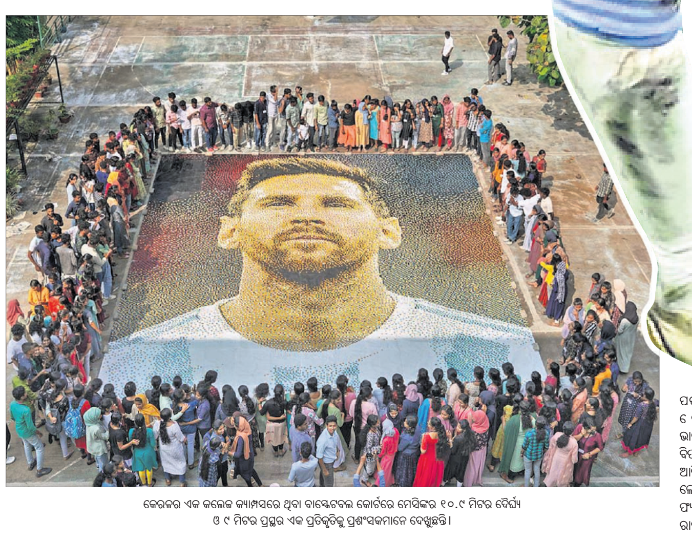
କେରଳର ଏକ କଲେଜ କ୍ୟାମ୍ପସରେ ଥିବା ବାୟୋଟେକ୍ନୋଲୋଜି କୋର୍ସରେ ମେସିଙ୍କର ୧୦.୯ ମିଟର ଦୈର୍ଘ୍ୟ ଓ ୯ ମିଟର ପ୍ରସ୍ଥର ଏକ ପ୍ରତିକୃତିକୁ ପ୍ରଶଂସକମାନେ ଦେଖୁଛନ୍ତି।