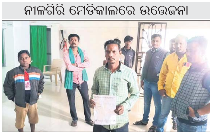
ନୀଳଗିରି ମେଡିକାଲରେ ଉତ୍ତେଜନା

ଦିନିକ ସମୟରେ ଚିକିତ୍ସାରେ ଅବହେଳା ଲାଗି ବିବାଦରେ ରହିଆସିଥିବା ବାଲେଶ୍ଵର ଜିଲ୍ଲା ନୀଳଗିରି ଉପଖଣ୍ଡ ଚିକିତ୍ସାଳୟ ପୁଣି ଚର୍ଚ୍ଚାକୁ ଆସିଛି। ହାତ କଟିଯାଇଥିବା ଜଣେ ନାରୀଙ୍କୁ ଚିତ୍ରାନ୍ତ ବଦଳରେ କୁକୁର କାମୁଡ଼ା ଇଞ୍ଜେକ୍ସନ ଦିଆଯିବାକୁ ନେଇ ହସ୍ପିଟାଲରେ ଉତ୍ତେଜନା ଦେଖାଦେଇଥିଲା। ସେଠାରେ ଉପସ୍ଥିତ ଶିଶୁ ବିଶେଷଜ୍ଞ କୁକୁର କାମୁଡ଼ା ଇଞ୍ଜେକ୍ସନ କିଛି ଖରାପ କରିବ ନାହିଁ ବୋଲି କହିବା ପରେ ପରିସ୍ଥିତି ଶାନ୍ତ ପଡ଼ିଥିଲା। ପରେ ନାରୀଙ୍କ ପରିବାର ଲୋକେ ଉକ୍ତ ଫାର୍ମାସିଷ୍ଟ ବିରୋଧରେ କାର୍ଯ୍ୟାନୁଷ୍ଠାନ ଲାଗି ଉପଜିଲ୍ଲାପାଳଠାରେ ଲିଖିତ ଅଭିଯୋଗ କରିଛନ୍ତି।