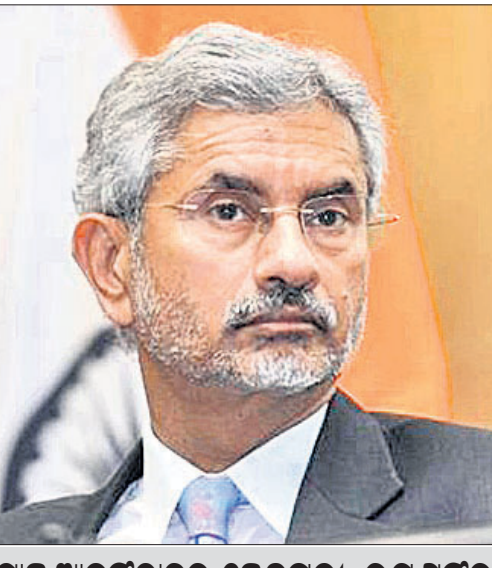
ପାକ୍ ଆତଙ୍କବାଦର କେନ୍ଦ୍ରସ୍ଥଳ: ଜୟଶଙ୍କର

ଶୁଦ୍ଧତା ଆଣି ଏକ ଭଲ ପଡ଼ୋଶୀ ହେବାକୁ ଉଦ୍ୟମ କରିବା ଉଚିତ। ଆତଙ୍କବାଦର ଉତ୍ପତ୍ତି କେଉଁଠୁ ହୋଇଛି ତାହା ବିଷ୍ଣୁ ଭୁଲିନାହିଁ। ଏହି ଅବସରରେ ସେ ଇସ୍ଲାମାବାଦ ଉଦ୍ଦେଶ୍ୟରେ ଆତଙ୍କବାଦର ମାଷ୍ଟରମାଇଣ୍ଡ ଲାଡେନଙ୍କୁ ସୁରକ୍ଷା ପ୍ରଦାନ କରିଥିଲା, ସେହି ରାସ୍ତା ଏବେ ଜାତିସଂଘରେ ପ୍ରବଚନ ଦେବାର ବିଷୟନାୟକ ହୋଇଛି। ସାରା ବିଶ୍ୱ ପାକିସ୍ତାନକୁ ‘ଆତଙ୍କବାଦର କେନ୍ଦ୍ରସ୍ଥଳ’ ଭାବେ ଦେଖୁଛି। ପାକିସ୍ତାନ ନିଜ କର୍ମରେ