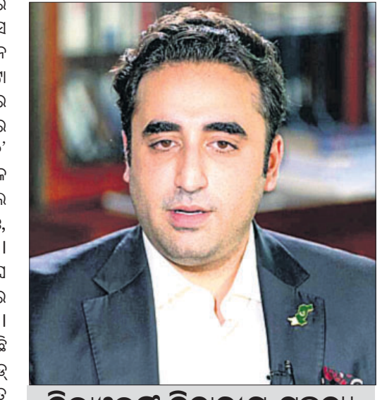
ବିଲାଓୁଲ୍ ବିବାଦୀୟ ମନ୍ତ୍ରବ୍ୟ