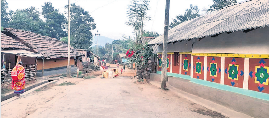
ଆଦିବାସୀ ଗ୍ରାମ ମାଝିଆସି।

ଡେକାନାଲ ସଦର ବ୍ଲକ୍ ସପ୍ତଶଯ୍ୟା ପଞ୍ଚାୟତର ବଣପାହାଡ଼ ଘେରା ଜଙ୍ଗଲ ଅଧିକାର ଆଦିବାସୀ ଗାଁ ମାଝିଆସି। ଜନସଂଖ୍ୟା ପାଖାପାଖି ୫୦୦। ଚମାଟୋ ଚାଷରେ ଜିଲ୍ଲାକୁ ଷ୍ଟର ଫିରତର ଦେଇଥିବା ଏହି ଗ୍ରାମରେ ପୂର୍ଣ୍ଣାଙ୍ଗ ପଢ଼ିଛନ୍ତି ବିକାଶ। ପ୍ରଶାସନିକ ଅବହେଳା ଯୋଗୁ ଶିକ୍ଷା, ସାମ୍ପ୍ୟ ଏବଂ କୃଷିରେ ଏହି ଅଞ୍ଚଳ ପଛୁଆ ହୋଇଯାଇଛି ବୋଲି ଆଖାଜନକ ଉଦ୍‌ଘାଟନ ହେଲା। ହେଲେ ଏହାକୁ ସଂରକ୍ଷଣ ପାଇଁ ଶୀତଳଭଣ୍ଡାର