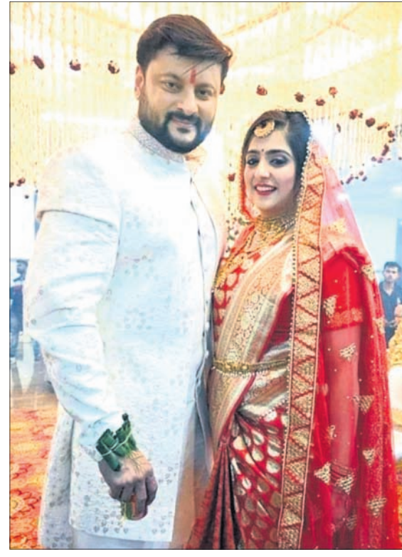
ଭାଇଭାଉସି ହୋଇଥିବା ଅନୁଭବଙ୍କ ବରବେଶି ଫଟୋ।

ଓଡ଼ିଆ ସିନେ ତାରକା ତଥା କେନ୍ଦ୍ରାପଡ଼ା ଏମ୍ପି ଅନୁଭବ ମହାନ୍ତିଙ୍କ ଏକ ବରବେଶି ଫଟୋ ଓ ଭିଡିଓକୁ ନେଇ ଚର୍ଚ୍ଚା ଜୋର ଧରିଛି।