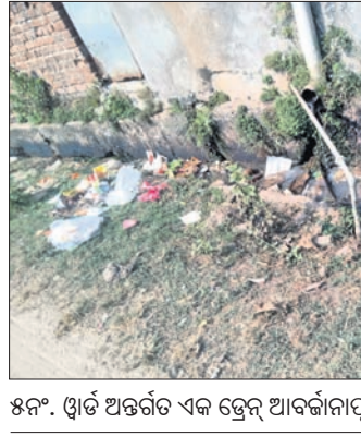
୫୫୫. ଓଡ଼ିଆ ଅଞ୍ଚଳର ଏକ ଡ୍ରେନ୍ ଆବର୍ଜନାପୁଷ୍ଟି ।

ପରାରିବାକୁ ସେ କହିଛନ୍ତି, ୨୫ ବର୍ଷ ହେଲା ଅଞ୍ଚଳରେ ଡ୍ରେନ୍ ସଫେଇ ହେଉନାହିଁ। ଡ୍ରେନ୍ ବୁଦ୍ଧିକରେ ଡ୍ରେନ୍ ପଡ଼ିବା ଦିନଠାରୁ ଡ୍ରେନ୍ ବାହାର କରାଯାଇ କେବେ ମଧ୍ୟ ସଫା କରାଯାଉନାହିଁ।