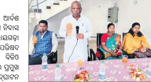
କାର୍ଯ୍ୟକ୍ରମରେ ଉପସ୍ଥିତ ରାୟଗଡ଼ା ବିଧାନସଭା ସଭ୍ୟ ଅତିଥିମାନେ।

ରାୟଗଡ଼ା ଜିଲ୍ଲା କାଶୀପୁର ବ୍ଲକ୍ ଆର୍ଦ୍ଧଶ ବିଦ୍ୟାଳୟରେ ୧୦୦ ଶଯ୍ୟା ବିଶିଷ୍ଟ ଛାତ୍ରୀ ନିବାସ ଉଦ୍‌ଘାଟିତ ହୋଇଯାଇଛି।