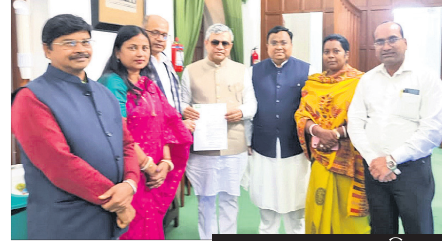
ଭୁବନେଶ୍ଵର, ୧୬.୧୨.୨୨ (ବୁଧବାର)