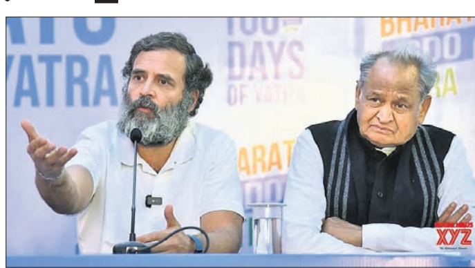
ଦତ୍ତପାରେ ଏକ ଖବରଦାତା ସମ୍ମିଳନୀକୁ ଶୁକ୍ରବାର ସମ୍ବୋଧିତ କରିଛନ୍ତି କଂଗ୍ରେସ ନେତା ରାହୁଲ ଗାନ୍ଧୀ। ନିକଟରେ ଅଛନ୍ତି ରାଜସ୍ଥାନ ମୁଖ୍ୟମନ୍ତ୍ରୀ ଅଶୋକ ଗେହଲଟ।

କନ୍ୟାପୁର/ଭୁଆଦିଲୀ, ୧୬।୧୨ ଭାରତ ସହ ମୁଦ୍‌ ପାଇଁ ଚାଇନା ପ୍ରସ୍ତୁତ ଚଳାଇଛି। ପ୍ରକୃତ ନିୟନ୍ତ୍ରଣରେଖା (ଏଲଏସି) ସଂଳାପ ଅଞ୍ଚଳରେ ସୈନ୍ୟ ଓ ଅସୁଶସ୍ତ୍ର ଫୁଲକୁ ଦେଖିଲେ ଏହା ବୁଝାପଡ଼ୁଛି। କିନ୍ତୁ ଆମ ସରକାର ଏହାକୁ ଗ୍ରହଣ କରିବାକୁ ନାହାନ୍ତି। ମୋଦି ସରକାର ଉତ୍ତରୀଣ ଉପରେ କାର୍ଯ୍ୟ କରିବା ପରିବର୍ତ୍ତେ ଇଭେଣ୍ଟ ମ୍ୟାନେଜମେଣ୍ଟରେ ବ୍ୟସ୍ତ ବୋଲି ଶୁକ୍ରବାର କଂଗ୍ରେସ ନେତା ରାହୁଲ ଗାନ୍ଧୀ କେନ୍ଦ୍ରକୁ ଚାର୍ଜେଟ କରିଛନ୍ତି। ସପ୍ତାହେ ତଳେ ଅଭିଶାପକ ପ୍ରଦେଶର ତଥ୍ୟରେ ଚାଇନାର ପିପୁଲ୍‌ସ୍ ଲିବରେଶନ ଆର୍ମି (ପିଏଲଏ) ସୈନ୍ୟଙ୍କ ଆକ୍ରମଣରେ ୬ ଭାରତୀୟ ଯବାନ ଆହତ ହେବା ପରେ ଏହାକୁ ନେଇ ପାର୍ଲିମେଣ୍ଟ ଭିତରେ ଓ ବାହାରେ ବଡ଼ ବିତର୍କ ସୃଷ୍ଟି ହୋଇଛି। ତଥ୍ୟକ୍ଷେତ୍ରରେ ପିଏଲଏ ସ୍ଥିରାବଳ୍ମ ପରିବର୍ତ୍ତନ ପାଇଁ ଉଦ୍ୟମ କରିଥିବାବେଳେ ଭାରତର ଇଚ୍ଛା ଭୂମି କେନ୍ଦ୍ର ନେଇପାରିବେ ନାହିଁ ବୋଲି ସରକାର ବାହୁଡ଼େଇତ ମାଗୁଛନ୍ତି। ଏହି ପରିପ୍ରେକ୍ଷାରେ ରାହୁଲଙ୍କ ମାତ୍ର ବ୍ୟବସ୍ଥା ବିଶେଷ ଗୁରୁତ୍ୱ ବହନ କରିଛି।