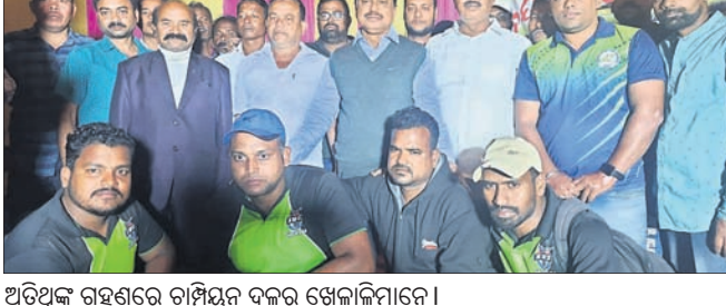
ଅତିଥିକ ଗହଣରେ ଚାମ୍ପିୟନ ଦଳର ଖେଳାଳିମାନେ।