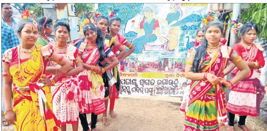
ଧନୁପୂଜା ମହୋତ୍ସବରେ ପିଲାମାନେ ନୃତ୍ୟ ପ୍ରଦର୍ଶନ କରୁଛନ୍ତି।