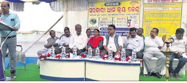
ମଣ୍ଡି ଉଦଘାଟନ ଅବସରରେ ଉପଜିଲ୍ଲାପାଳ ଓ ଅନ୍ୟ ଅତିଥିମାନେ।

ଶେରଗଡ଼, ୧୬.୧୨.୨୨ (ଡି.ଏନ୍.ଏ.) ଶେରଗଡ଼ କୁଳର ଡେଫାଏଟର ସମବାୟ ସମିତିରେ ଧାନ ମଣ୍ଡିର ଶୁଭାରମ୍ଭ କରିଛନ୍ତି ଉପଜିଲ୍ଲାପାଳ।