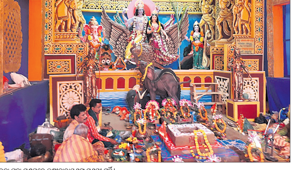
ଜାରକା ପୂଜା ମଣ୍ଡପରେ ଲକ୍ଷ୍ମୀନାରାୟଣଙ୍କ ମୁଖ୍ୟ ପୂଜା।

ଧର୍ମଶାଳା, ୧୬୧୨ (ଡି.ଏନ.ଏ.) ଧର୍ମଶାଳା ମହୋତ୍ସବ ପୂଜା କର୍ମିତ ପକ୍ଷରୁ ଶୁକ୍ରବାର ଧନୁ ସଂକ୍ରାନ୍ତିଠାରୁ ଜାରକା ପୂଜା ମଣ୍ଡପରେ ଲକ୍ଷ୍ମୀନାରାୟଣଙ୍କ ପୂଜା ଆରମ୍ଭ ହୋଇଛି। ସକାଳେ ବ୍ରାହ୍ମଣୀ ନଦୀରୁ କଳସରେ କଳ ଆଣାଯାଇ ପୂଜା ମଣ୍ଡପରେ ରଖାଯାଇ ପୂଜାର୍ଚ୍ଚନା କରାଯାଇଥିଲା। ମଣ୍ଡପ ସମ୍ମୁଖରେ ହୁଡ଼ିତ ଚୋରଣ ସାଜକୁ ପ୍ରଦର୍ଶନ କରାଯାଇଛି। ଶନିବାର ପୂର୍ଣ୍ଣିମା, ହୋମ, ମହାଦୀପ ଓ ଆଳତି ହୋଇଛି। ଘାତୀୟ ଅଞ୍ଚଳରେ ଶତାଧିକ ଶ୍ରଦ୍ଧାଳୁ ମଣ୍ଡପରେ ଲକ୍ଷ୍ମୀନାରାୟଣଙ୍କୁ ବର୍ଷକରିବାର ସୁଯୋଗ ପାଇଛନ୍ତି। ଏହି ପୂଜା ୩ ଦିନ ବ୍ୟାପୀ ଅନୁଷ୍ଠିତ ହେବ। ରବିବାର ରାତିରେ ଘଟବିଧାନ କରାଯିବ।