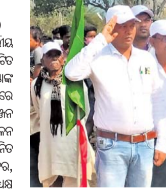
ଆର.ଉଦୟଗିରି କୁଳ କେ.ଏମ.ଭାଲିଆ ସାହିତ୍ୟରେ ଅନୁଷ୍ଠିତ କ୍ରୀଡ଼ା ଉତ୍ସବରେ ଉପସ୍ଥିତ ଅତିଥି।

ଚିକିତ୍ସା ଆର.ଉଦୟଗିରି/ ଗୋପାଳପୁର, ୧୬.୧୨.୨୨ (ଡି.ଏନ୍.ଏ.) ଚିକିତ୍ସା ପେଣ୍ଡୁର ମନିଷ୍ଟ୍ରାୟମରେ କୁଳସ୍ତରୀୟ କ୍ରୀଡ଼ା ମହୋତ୍ସବ ୨୦୨୨-୨୩ ଉଦଘାଟିତ ହୋଇଯାଇଛି।