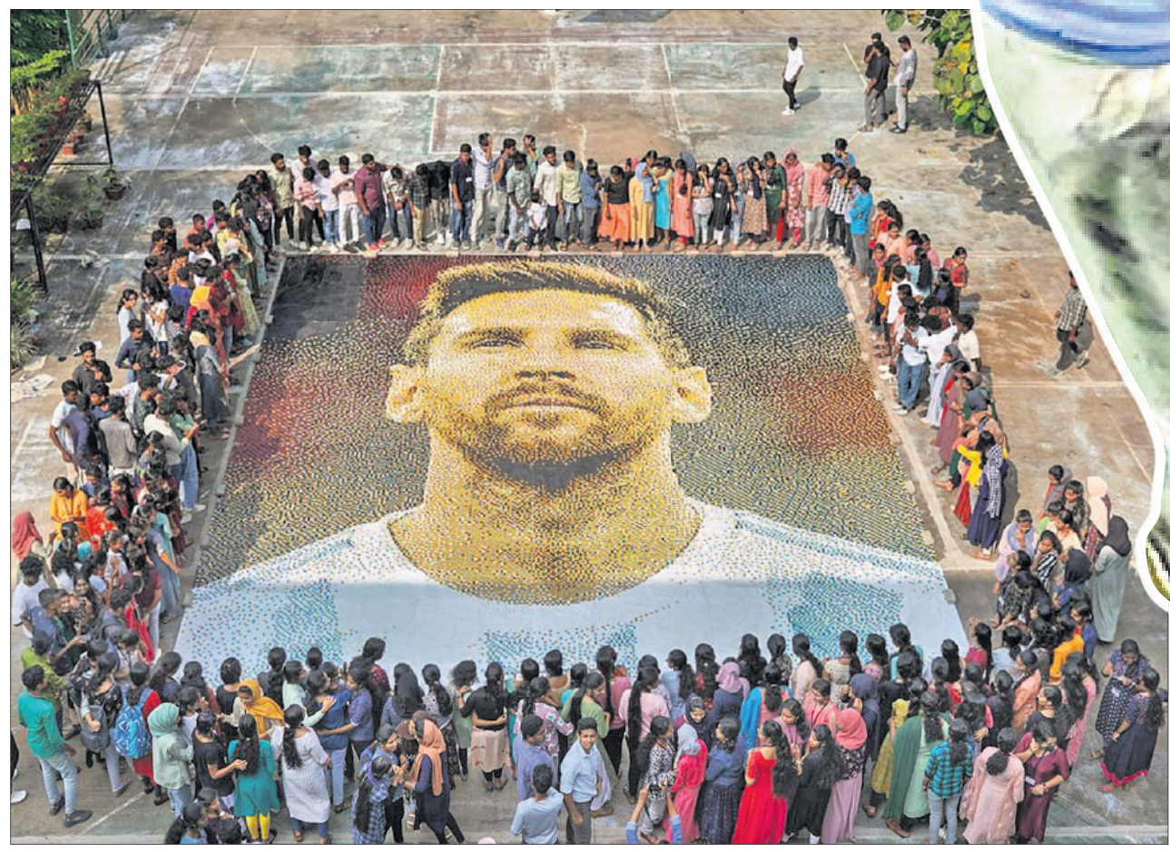
କେରଳର ଏକ କଲେଜ କ୍ୟାମ୍ପସରେ ଥିବା ବାୟୋଟେକ୍ନୋଲୋଜି କୋର୍ସରେ ମେସିଙ୍କର ୧୦.୯ ମିଟର ଦୈର୍ଘ୍ୟ ଓ ୯ ମିଟର ପ୍ରସ୍ଥର ଏକ ପ୍ରତିକୃତିକୁ ପ୍ରଶଂସକମାନେ ଦେଖୁଛନ୍ତି।