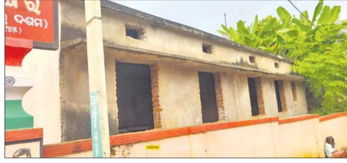
ଅଧ୍ୟାପକ ଶ୍ରୀମତୀ ଶ୍ରୀମତୀ

ସାତ ବର୍ଷ ପୂର୍ବେ ଗଞ୍ଜାମ ଜିଲ୍ଲାରେ ଶ୍ରୀମତୀ ଶ୍ରୀମତୀଙ୍କ ଶିକ୍ଷା ଆରମ୍ଭ ହୋଇଥିଲା। ଅଧ୍ୟାପକ ଶ୍ରୀମତୀଙ୍କ ପତ୍ନୀଙ୍କର ପରଲୋକ ହେବାରୁ ଶ୍ରୀମତୀଙ୍କ ଶିକ୍ଷା ଆରମ୍ଭ ହୋଇଥିଲା।