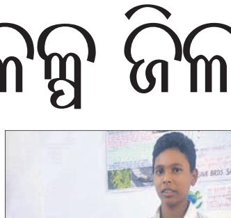
ଜଣେ ଛାତ୍ର ପ୍ରକଳ୍ପ ପ୍ରଦର୍ଶନ କରୁଛନ୍ତି।

ନୟାଗଡ଼ ଅଫିସ, ୧୬.୧୨.୧୨ ନୟାଗଡ଼ ବ୍ଲକ୍‌ସ୍ତରୀୟ ୨୭ତମ ବିଜ୍ଞାନ ମେଳା କର୍ପିତେସ୍ୱର ବିଦ୍ୟାପୀଠ ଶିଖିଲରେ ଶୁକ୍ରବାର ଅନୁଷ୍ଠିତ ହୋଇଯାଇଛି।