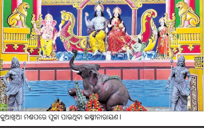
କୁଆଖିଆ ମଣ୍ଡପରେ ପୂଜା ପାଉଥିବା ଲକ୍ଷ୍ମୀନାରାୟଣ।

୬୮ତମ କୁଆଖିଆ ଲକ୍ଷ୍ମୀନାରାୟଣ ପୂଜା ଶୁକ୍ରବାର ସମ୍ପାଦନେ ଆରମ୍ଭ ହୋଇଛି। ଘାତୀୟ ଓରାଳି ପୁଷ୍କରିଣୀକୁ କଳସପୂର୍ଣ୍ଣ କଳସ ଆଣାଯାଇ ପୂଜାମଣ୍ଡପରେ ଘଟ ସ୍ଥାପନ କରାଯାଇ ପୂଜାକାର୍ଯ୍ୟ ଆରମ୍ଭ ହୋଇଥିଲା। ନାନା ପୂଜାବିଧିକୁ ପାଳନ କରାଯାଇ ପ୍ରଭୁ ଲକ୍ଷ୍ମୀନାରାୟଣଙ୍କ ଯୁବାଳ ପୂର୍ଣ୍ଣିମା ଚନ୍ଦ୍ରବିନୟନ କରାଯାଇଥିଲା। ଠାକୁରଙ୍କ ନିକଟରେ ଶୋଭା ଉପସାଧି ପୂଜା, ହୋମାଦି ମଧ୍ୟ କାର୍ଯ୍ୟ ସମ୍ପନ୍ନ କରାଯାଇଥିଲା। ବଜାର କର୍ମିତ ପ୍ରତ୍ୟେକ ତତ୍ତ୍ୱାବଧାନରେ ଆୟୋଜିତ ଉତ୍ସବକୁ ସରସ ସୁନ୍ଦର ସକାଶେ ପୂଜା ମଣ୍ଡପ ନିକଟରେ ମଧ୍ୟ କାର୍ଯ୍ୟ ସମ୍ପନ୍ନ କରାଯାଇଥିଲା। ବଜାର କର୍ମିତ ପ୍ରତ୍ୟେକ ତତ୍ତ୍ୱାବଧାନରେ ଆୟୋଜିତ ଉତ୍ସବକୁ ସରସ ସୁନ୍ଦର ସକାଶେ ପୂଜା ମଣ୍ଡପ ନିକଟରେ ମଧ୍ୟ କାର୍ଯ୍ୟ ସମ୍ପନ୍ନ କରାଯାଇଥିଲା। ବଜାର କର୍ମିତ ପ୍ରତ୍ୟେକ ତତ୍ତ୍ୱାବଧାନରେ ଆୟୋଜିତ ଉତ୍ସବକୁ ସରସ ସୁନ୍ଦର ସକାଶେ ପୂଜା ମଣ୍ଡପ ନିକଟରେ ମଧ୍ୟ କାର୍ଯ୍ୟ ସମ୍ପନ୍ନ କରାଯାଇଥିଲା।