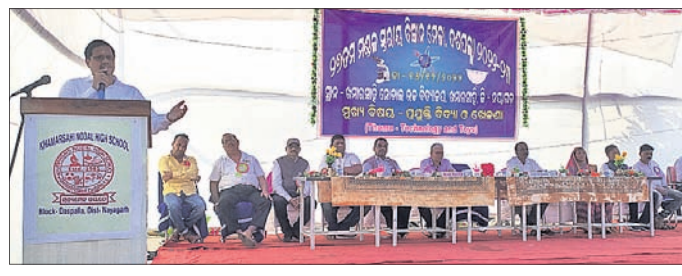
ପ୍ରତିଯୋଗିତାର ଉଦ୍‌ଘାଟନା ଭଣ୍ଡବରେ ମଞ୍ଚାଧୀନ ଅତିଥି।

ଦଶପଲ୍ଲୀ, ୧୬.୧୨.୧୨ (ଡି.ଏନ୍.ଏ.) ଶୁକ୍ରବାର ଦଶପଲ୍ଲୀ ବ୍ଲକ୍ ଖମ୍ବାରସାହି ପଞ୍ଚାୟତର ନୋଡାଲ ହାଲ୍‌ସ୍ଥଳୀରେ ଛାତ୍ରାଛାତ୍ରୀଙ୍କ ମଧ୍ୟରେ ଖେଳଣୀ ଓ ପ୍ରୟୁକ୍ତି ବିଦ୍ୟା ପ୍ରତିଯୋଗିତା ଅନୁଷ୍ଠିତ ହୋଇଯାଇଛି।