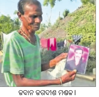
ଜବାନ ଜବାନ ମଣ୍ଡଳ ।

ଆଜକାଳେ ପୁଲିସ୍ତେସା ହେଉଛନ୍ତି କେନ୍ଦ୍ରାପଡ଼ା ଜିଲ୍ଲା ମହାକାଳପଡ଼ା ବ୍ଲକ୍ ଗୁଲୁଆ ଗ୍ରାମର ଜବାନ ମଣ୍ଡଳ । ବାଲାଦେଶ ପୁଲିସ୍ତେସା ହେଉଛନ୍ତି ସେନାରେ ଯାମିଲ ହୋଇଥିଲେ ସେନାରେ ଅନୁଭୂତି ବଞ୍ଚାଣତି ସେ, ପାଳିସ୍ଥାନ ସେନା ପୂର୍ବ ପାଳିସ୍ଥାନରେ ଦେଇ ଭାରତ ସାମା ଅଭିଯାନ କରିଥିଲେ ଏହାପରେ ପ୍ରାୟ ୪୦ ଦିନ ସେନାରେ ନରସଂହାର ଚଳାଇଥିଲେ । ସମ୍ପର୍କୀୟ ଆଖି ଆଗରେ ପାଳିସ୍ଥାନ ଜବାନମାନେ ପାଳିସ୍ଥାନ ସେନା ପୂର୍ବ ପାଳିସ୍ଥାନରେ ଥିବା ପୋଲ, ରାସ୍ତାଗୁଡ଼ିକ ନଷ୍ଟ କରୁଥିଲେ । ଏହାକୁ ଭାରତୀୟ ସେନାମାନେ ନିର୍ମାଣ କରି ଚଳାଇବା ସହିତ ଖାସ୍ତା ସାମାଗ୍ରୀ ବାଲାଦେଶର ଡାକାଠାରେ ପହଞ୍ଚାଇ ଥିଲେ । ଉଭୟ ଲଢ଼େଇ ଉତ୍ସବ ପାଳିସ୍ଥାନରେ ବେଳେ ହିଲାଇ, କୁଟାବୁକ୍ଷ, ଶିଶୁଙ୍କ ମୁଖାହତ୍ୟା