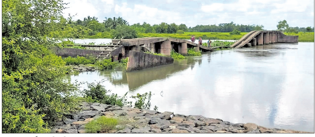
ଉଦ୍ଘାଟନ ପୂର୍ବରୁ ଭାଙ୍ଗି ପଡିଥିବା ଭାରତେଶୀ ପୁଲ୍ ।