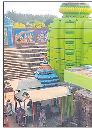
ବଚେଶ୍ୱର ପୀଠ ।

ଗଛ ଲଗାଯାଇଥିବା ବେଳେ ଆକର୍ଷଣୀୟ ଆଲୋକ ମାଳାରେ ଝଲି ଝଲି ପୋଖରୀ, ଯାହା ପର୍ଯ୍ୟଟକଙ୍କୁ ବିମୋହିତ କରୁଛି ।