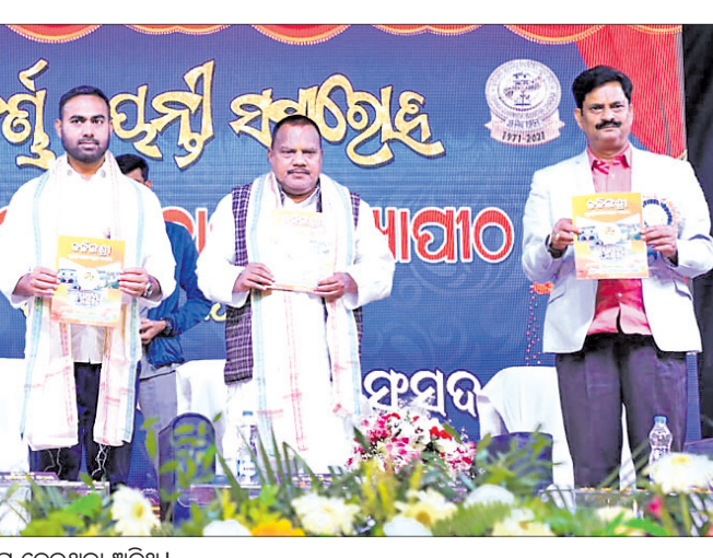
ବିଦ୍ୟାପୀଠ ସୁବର୍ଣ୍ଣ ଜୟନ୍ତୀ ସମାରୋହରେ ଯୋଗ ଦେଇଥିବା ଅତିଥି ।