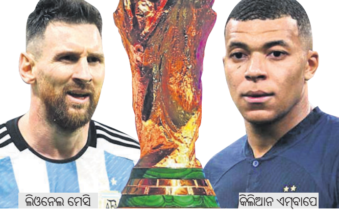
ଲିଓନେଲ ମେସି (ଘା) କିଲିଆନ ଏମ୍ବାପେ (ଘା)

ଦେହା, ୧୭୧୨ ଚଳିତ ଫିଫା ବିଶ୍ୱକପର ମେଚା ଫାଇନାଲ ରବିବାର ଲୁସେଲ ଷ୍ଟାଡ଼ିୟମରେ ଅନୁଷ୍ଠିତ ହେବ। ଚାଲିଚଲ ଲୁସେଲରେ ପରସ୍ପରର ସମ୍ମୁଖୀନ ହେବେ ଲିଓନେଲ ମେସି ଆର୍ଜେଣ୍ଟିନା ଓ ଗତଥରର ଚାମ୍ପିୟନ ଫ୍ରାନ୍ସ। ଫ୍ରାନ୍ସ ଚାଲିଚଲ ବଜାୟ ରଖିବା ଲକ୍ଷ୍ୟରେ ଥିବାବେଳେ କ୍ୟାରିୟରର ସାୟାହୁରେ ପହଞ୍ଚୁଥିବା ମେସି ନିଜ ସ୍ୱପ୍ନ ସାକାର କରିବା ଆଶାରେ ରହିଛନ୍ତି। ସେମିଫାଇନାଲରେ ଆର୍ଜେଣ୍ଟିନା ୩-୦ ଗୋଲରେ କ୍ରୋଏସିଆକୁ ହରାଇଥିବାବେଳେ ଫ୍ରାନ୍ସ ୨-୦ ଗୋଲରେ ମରୋକ୍କୋକୁ ମାଟ୍ ଦେଇ ଫାଇନାଲରେ ପହଞ୍ଚିଛି।