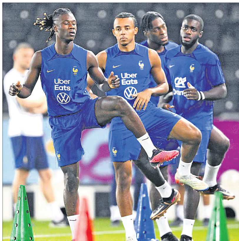
ଫିଫା ବିଶ୍ୱକପର ପାଇନାଲ ପୂର୍ବରୁ ଶନିବାର ଆର୍ଜେଣ୍ଟିନା ଓ ଫ୍ରାନ୍ସ ଦଳର ଅଭ୍ୟାସ।