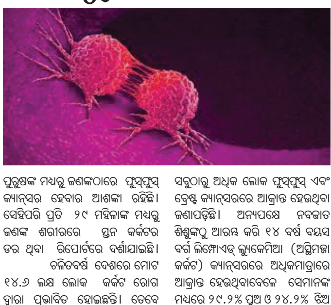
ପୁରୁଷଙ୍କ ମଧ୍ୟରୁ ଜଣକଠାରେ ଯୁବୟୁବ କ୍ୟାନ୍ସର ହେବାର ଆଶଙ୍କା ରହିଛି। ସେହିପରି ପ୍ରତି ୨୯ ମହିଳାଙ୍କ ମଧ୍ୟରୁ ଜଣକ ଶରୀରରେ ଯୁବ କର୍କଟର ଡର ଥିବା ରିପୋର୍ଟରେ ବର୍ଣ୍ଣାଯାଇଛି।

ଭାରତରେ ପ୍ରତିବର୍ଷ କ୍ୟାନ୍ସର ଆକ୍ରାନ୍ତ ସଂଖ୍ୟା ବଢ଼ିବାରେ ଲାଗିଛି। ପ୍ରତି ୯ ଜଣଙ୍କ ମଧ୍ୟରୁ ଜଣେ ଭାରତୀୟଙ୍କ ଶରୀରରେ କ୍ୟାନ୍ସର ବିକଶିତ ହେଉଥିବା ନ୍ୟାଶନାଲ୍ ସେଣ୍ଟର ଫର୍ ଡିଜିଜ୍ ଇନ୍‌ଫରମେସନ୍ ଆଣ୍ଡ୍ ରିସର୍ଚ୍ଚ (ଏନ୍‌ସିଆଇଆର୍) ଏବଂ ଆଇସିଏମ୍‌ଆର୍ ପକ୍ଷରୁ କରାଯାଇଥିବା ନିକଟ ଅଧ୍ୟୟନ ରିପୋର୍ଟରେ ଉଲ୍ଲେଖ କରାଯାଇଛି।