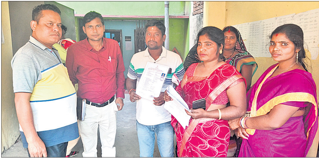
ମହିଳା ଶ୍ରମିକମାନେ ଦାବିପତ୍ର ପ୍ରଦାନ କରୁଛନ୍ତି ।

ନିର୍ମାଣ ଶ୍ରମିକ ଓ ଅଣ ସଙ୍ଗଠିତ ପରିଚୟ ପତ୍ର ପାଇଁ ଶ୍ରମିକମାନେ ଠକାମିର ଶିକାର ହୋଇ ଚାଲିଛନ୍ତି । ଏତେବେଳେ ଅଭାବରୁ ଏପରି ହେଉଥିବା କୁହାଯାଉଛି ।