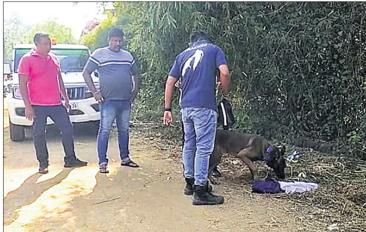
ଡର ସ୍ୱାଭ ପ୍ରାଣୀ ଚକ୍ର ଚଳାଇ ।