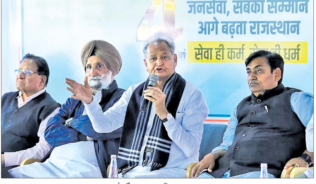
ରାଜସ୍ଥାନର କମ୍ପ୍ୟୁଟର କଂଗ୍ରେସ ସରକାରଙ୍କ ଧର୍ମ ପୂର୍ଣ୍ଣ ଅବସରରେ ଶନିବାର ମୁଖ୍ୟମନ୍ତ୍ରୀ ଅଶୋକ ଗେହଲଟଙ୍କ ସହ ଦଳୀୟ ନେତାମାନେ।