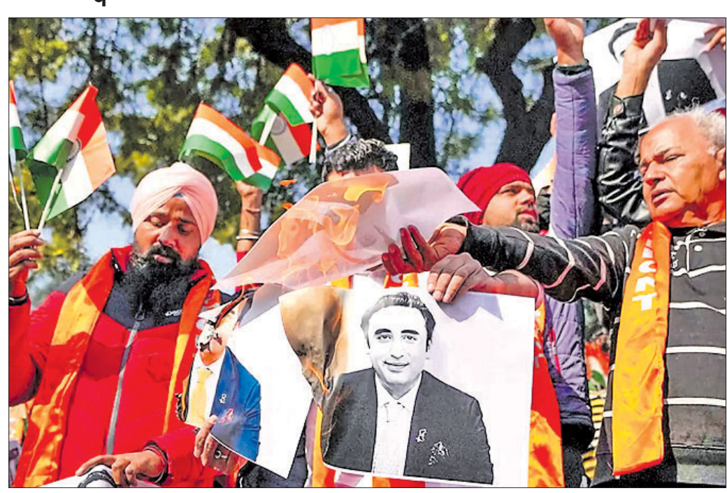
କମ୍ବୁରେ ପାକିସ୍ତାନ ବହିଷ୍କାର ପତ୍ତା ବିଲ୍ମାଫୁଲ ଭୂଜୋ ଜର୍ଦାନିକ ବିରୋଧରେ ତୋପ୍ରା ପ୍ରଫୁ ଓ ଶିବସେନା ପକ୍ଷରୁ ବିସୋଭ ପ୍ରଦର୍ଶନ।

ପ୍ରଧାନମନ୍ତ୍ରୀଙ୍କୁ ଖାର୍ଚ୍ଚକ ପ୍ରଶ୍ନ ସାମରିକ ଉପସ୍ଥିତି ବୃଦ୍ଧି ଉତ୍ତରପୂର୍ବୀଞ୍ଚଳ ରାଜ୍ୟର ପ୍ରବେଶ ପଥ ସିଲ୍ଲୁଡ଼ି କରିବାର ପ୍ରତି ବିପଦ ସୃଷ୍ଟି କରିବା ସହ ଜାତୀୟ ସୁରକ୍ଷାକୁ ନେଇ ଚିନ୍ତା ବଢ଼ାଇଛି।