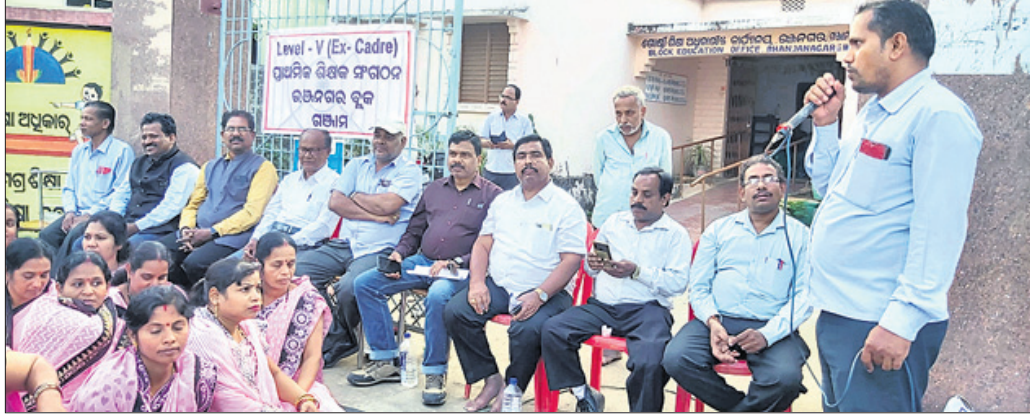
ଶିକ୍ଷକମାନେ ବିକ୍ଷୋଭ ପ୍ରଦର୍ଶନ କରୁଛନ୍ତି ।