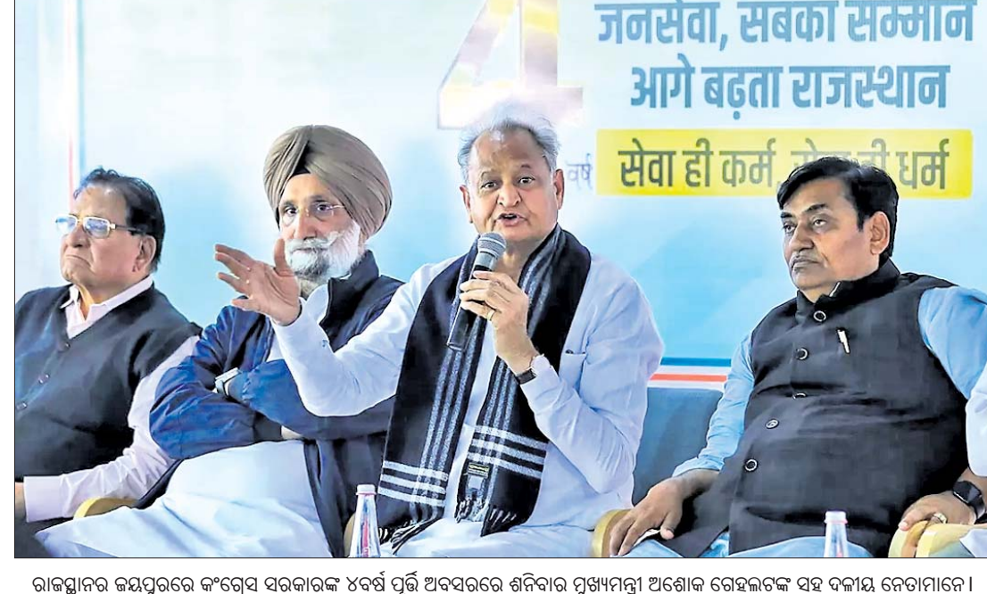
ରାଜସ୍ଥାନର ଜୟପୁରରେ କଂଗ୍ରେସ ସରକାରଙ୍କ ୪୯ତମ ପୂର୍ଣ୍ଣ ଅବସରରେ ଶନିବାର ମୁଖ୍ୟମନ୍ତ୍ରୀ ଅଶୋକ ଚୋରାଇଙ୍କ ସହ ଦଳୀୟ ନେତାମାନେ।

ଉପନିର୍ବାଚନ: ବିଜେଡି-ଭାଜପା ମୁହାଁମୁହଁ ବିଜେଡି ଲାଗି ପଦ୍ମପୁର ମଡେଲ ହେଲେ ଭାଜପା ପାଇଁ ଧ୍ୟାନଗର: ଧର୍ମେନ୍ଦ୍ର ବିଜେଡିର ମଡେଲ ଓଡ଼ିଶାର ସାଡ଼େ ୪ କୋଟି ଲୋକଙ୍କ ସେବା: ସମ୍ମିତ