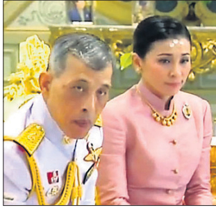
ଆଇଏଏନଏସ୍ରେ କୋଭିଡ୍ ସଂକ୍ରମଣ ବୃଦ୍ଧି ପାଇଛି। ସେଠାର ରାଜା ମହା ବାଜିରାଲୋକ୍‌କର୍ଣ୍ଣ ପ୍ରା ବାଜିରାଲୋକ୍‌କର୍ଣ୍ଣରୁ ସୁଅା ଏବଂ ରାଣୀ ସୁଅା ବକ୍ସାସୁଧାବିମାଳାମନା କୋଭିଡ୍ ପଜିଟିଭ୍ ଚିହ୍ନିତ ହୋଇଥିବା ରାଜପରିବାର ପକ୍ଷରୁ କୁହାଯାଇଛି।

ଅସତ୍ୟ ଏବଂ ଅଭୂତିକର ମନ୍ତବ୍ୟକୁ ନିନ୍ଦା କରିବା ଲାଗି ସାରା ଦେଶ ଏକାଠି ହୋଇଥିବା ଭାଜପା ପକ୍ଷରୁ କୁହାଯାଇଛି।