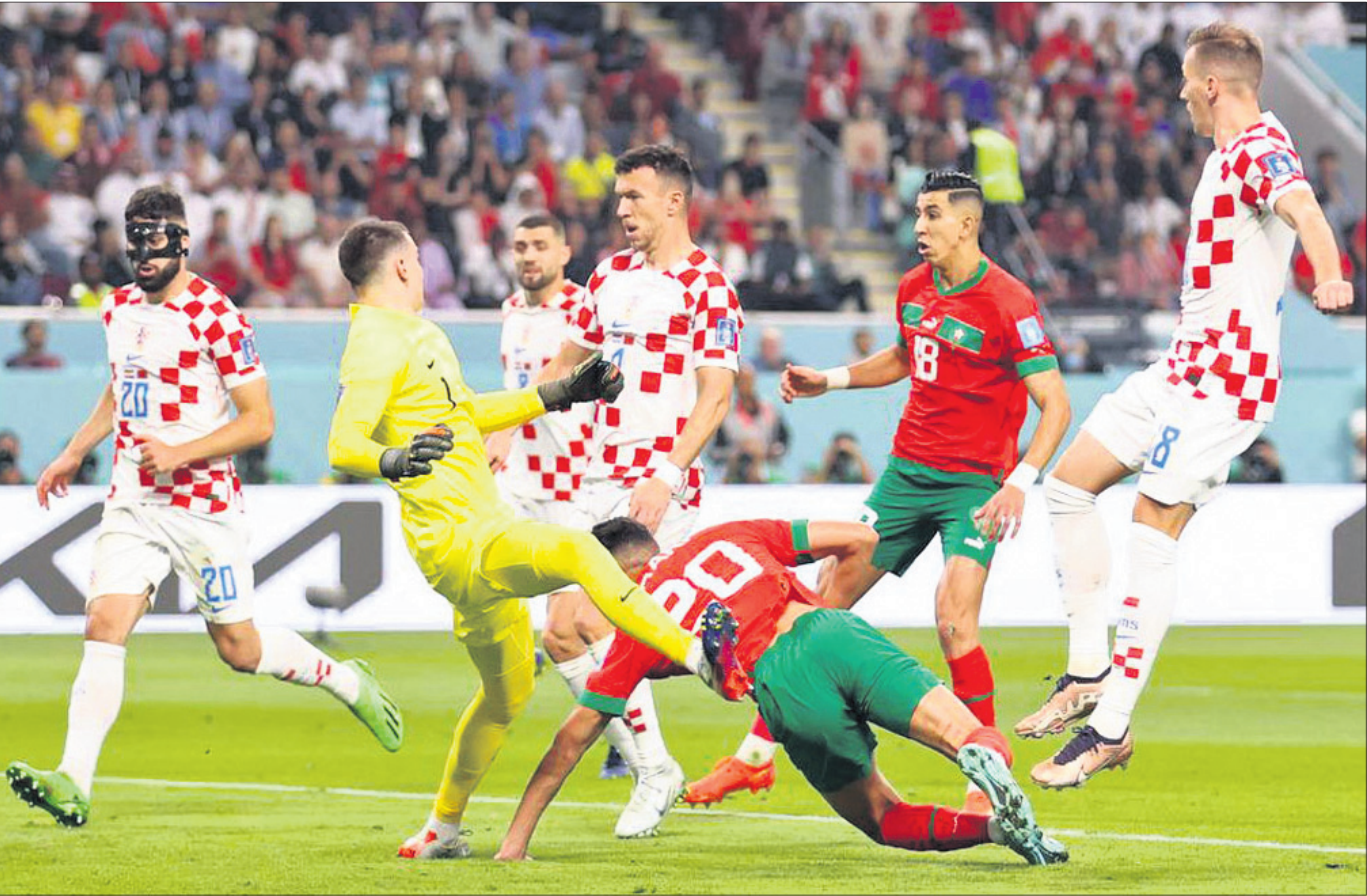
ଫିଫା ବିଶ୍ୱକପରେ ଶନିବାର କ୍ରୋଏସିଆ ଓ ମରକ୍କୋ ମଧ୍ୟରେ ଅନୁଷ୍ଠିତ ଫ୍ଲୋ-ଅଫ୍ ମ୍ୟାଚର ଏକ ସଂଘର୍ଷପୂର୍ଣ୍ଣ ମୁହୂର୍ତ୍ତ।