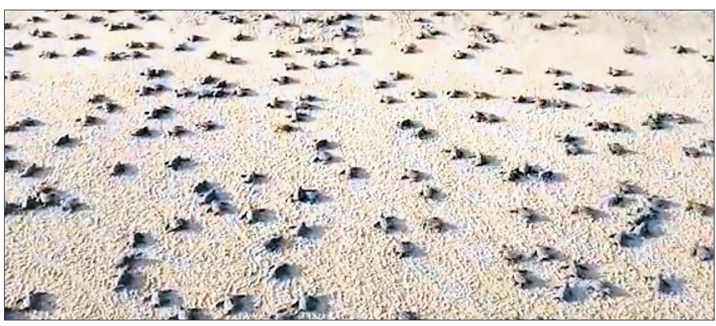
ଗହୀରମଥାରେ ଅଭିଭବିତଲେ ଶାବକ ।

ବିଶ୍ଵ ପ୍ରସିଦ୍ଧ ଗହୀରମଥା ସାମୁଦ୍ରିକ ଅଞ୍ଚଳରେ ବିରଳ ଅଲିଭ ରିଡଲେ କଇଁଛ ଠୁଲ ହୋଇଛନ୍ତି । ଆଇ.ୟୁ.ସି.ଏନ୍.ରେ ଉଚ୍ଚ ଡାକା ବୁକ୍ସରେ ଥିବା ଏହି ବିରଳ ପ୍ରଜାତିଙ୍କ ପ୍ରଜନନ ସ୍ଥଳ ତତକ୍ଷଣାତ ଯୋଗୁ କମିବାରେ ଲାଗିଛି । କଟକଶା ସଭେ ଏହି ସାମୁଦ୍ରିକ ଅଞ୍ଚଳରେ ବୋଟ୍, ଟ୍ରଲର ଚଳାଚଳ ହେଉଛି । ଏହି ସମୟରେ ପ୍ରତିରକ୍ଷା ବିଭାଗ ପାଇଁ ଅନ୍ଧାଧିକାରୀମାନେ ବାଲିଖିଳ ମିଶାଇଲ ଅଗ୍ରି ୫ର ରାତ୍ରୀକାଳୀନ ପରୀକ୍ଷଣ ଗତ ୧୫ ତାରିଖରେ ହୁଲଲର ଦ୍ଵୀପକୁ କରାଯାଇଛି । ଡିସେମ୍ବରରେ ଏହି ପରୀକ୍ଷା ବ୍ୟତୀତ ଦି ତିନୋଟିସ ରିଭର୍ଡ ଆଣ୍ଡ ଡେଭଲପମେଣ୍ଟ ଅର୍ଗାନାଇଜେସନ (ଡିଆରଡିଓ) ପକ୍ଷରୁ ଗତ ଦୁଇମାସ ମଧ୍ୟରେ ଏଠାରେ ଲାଗାତର ମିଆଇଲ ପରୀକ୍ଷଣ କାରି ରହିଛି । ଏହି ପରୀକ୍ଷଣ ଜାତୀୟ ଉଦ୍ୟାନ ଭିତରକନିକା ନିକଟ ହୁଲଲର ଦ୍ଵୀପ (ଡ. ଅବଦୁଲ କାଲାମ ଦ୍ଵୀପ)ରେ କରାଯାଇଛି । ନିୟୁତ୍ଵର ଉପରେ ପଢୁଛି । ଫଳରେ ଚଳିତବର୍ଷ ଆସିଥିବା କଇଁଛଙ୍କ ଉପରେ ପ୍ରଭାବ ପକାଇବ ବୋଲି ପରିବେଶବିତମାନେ ଆଶଙ୍କା ବ୍ୟକ୍ତ କରିଛନ୍ତି ।