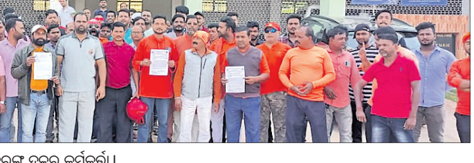
ଜିଲାପାଳଙ୍କୁ ଦାବିପତ୍ର ଦେବାକୁ ଆସିଥିବା ବକରଙ୍ଗ ବନ୍ଦର କର୍ମକର୍ମୀ ।