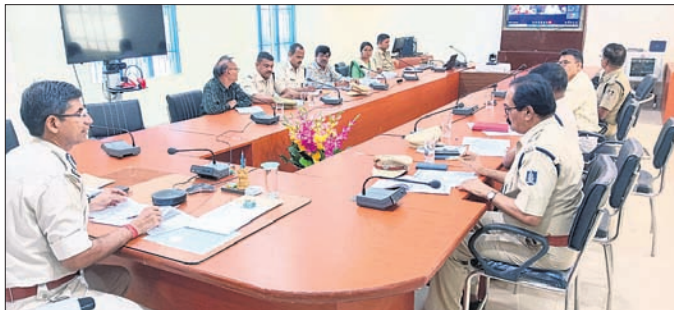
ଜିଲ୍ଲା ସମାକ୍ଷା ବୈଠକରେ ଏସ୍ପି ଓ ଅନ୍ୟ ପୋଲିସ ଅଧିକାରୀମାନେ ।