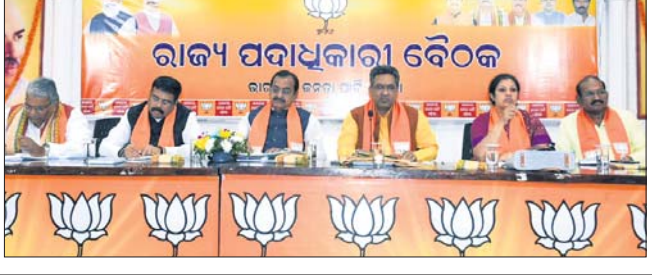
ରାଜ୍ୟ ପଦାଧିକାରୀ ବୈଠକ