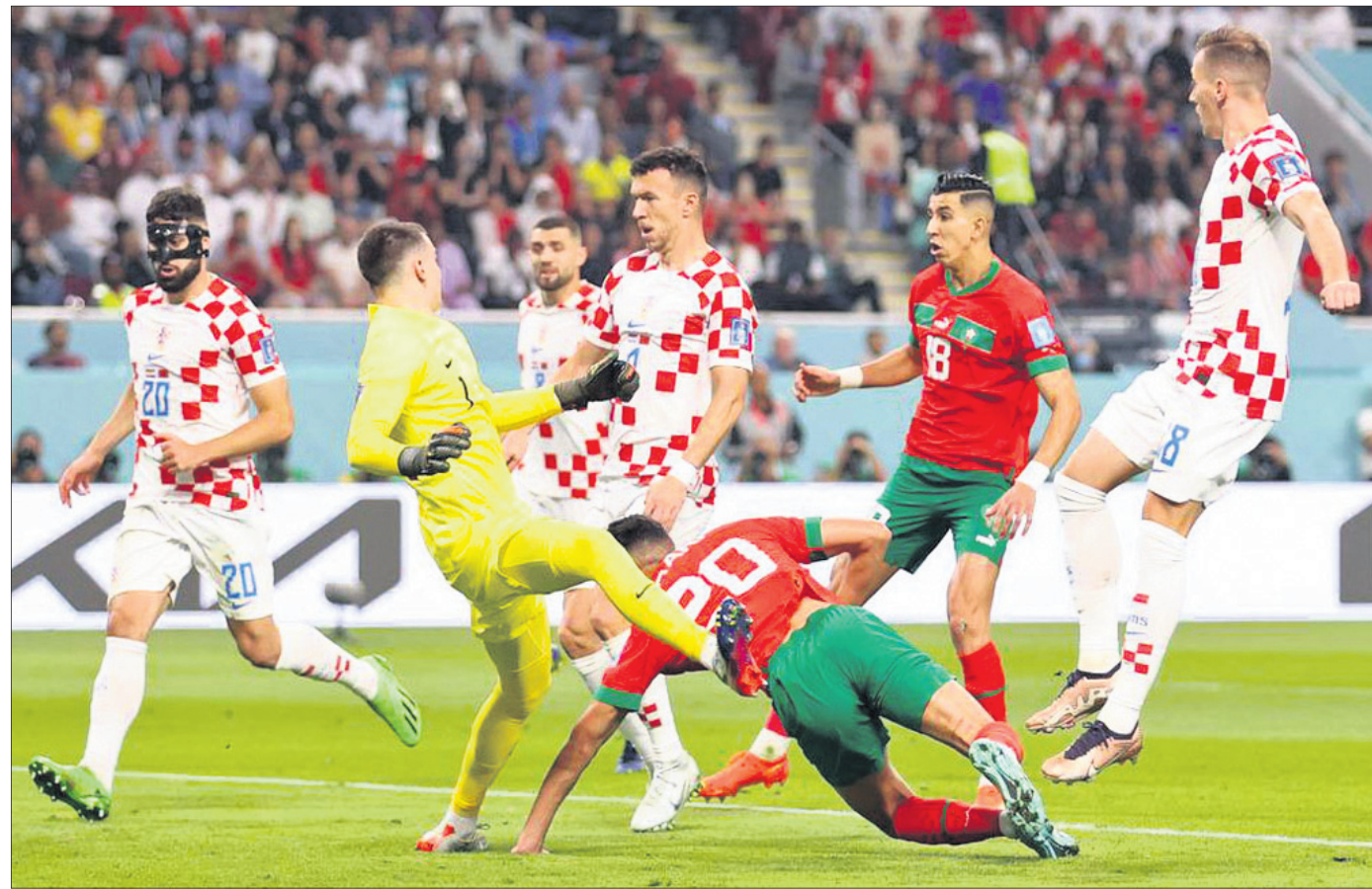
ଫିଫା ବିଶ୍ୱକପରେ ଶନିବାର କ୍ରୋଏସିଆ ଓ ମରକ୍କୋ ମଧ୍ୟରେ ଅନୁଷ୍ଠିତ ଫ୍ଲୋ-ଅଫ୍ ମ୍ୟାଚର ଏକ ସଂଘର୍ଷପୂର୍ଣ୍ଣ ମୁହୂର୍ତ୍ତ।