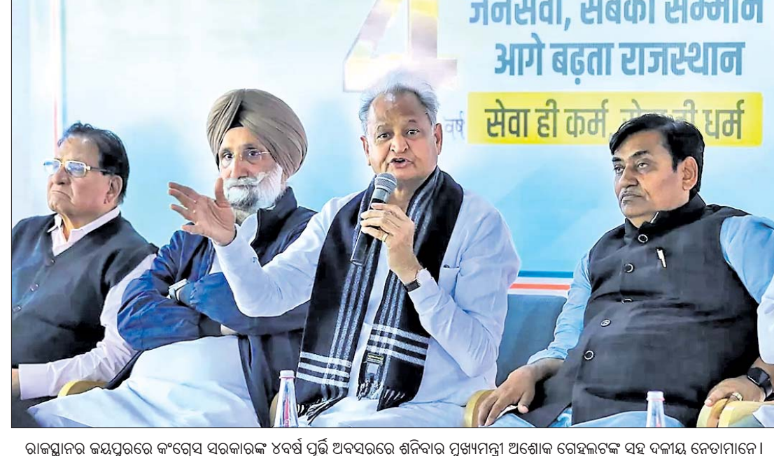
ରାଜସ୍ଥାନର କମପୁରରେ କଂଗ୍ରେସ ସରକାରଙ୍କ ୪ ବର୍ଷ ପୂର୍ତ୍ତି ଅବସରରେ ଶନିବାର ମୁଖ୍ୟମନ୍ତ୍ରୀ ଅଶୋକ ଚେହେରଙ୍କ ସହ ଦଳୀୟ ନେତାମାନେ।

ସମ୍ପାଦନା ମଜଭୁତ ସହ ସରକାରଙ୍କ ଜନବିରୋଧୀ ନୀତି ବିରୋଧରେ ରୋଡ଼ମାଫ ହୋଇଛି: ପୃଥ୍ୱୀରାଜ କୁଳରେ ଜିଏସ୍ ଠକେଇ ହେଉଛି। ବିଜୁ ଉପଭୋକ୍ତାଙ୍କୁ ବିଜେ ଆକ୍ଷେପ ଶୋଷଣ କରାଯାଉଛି।