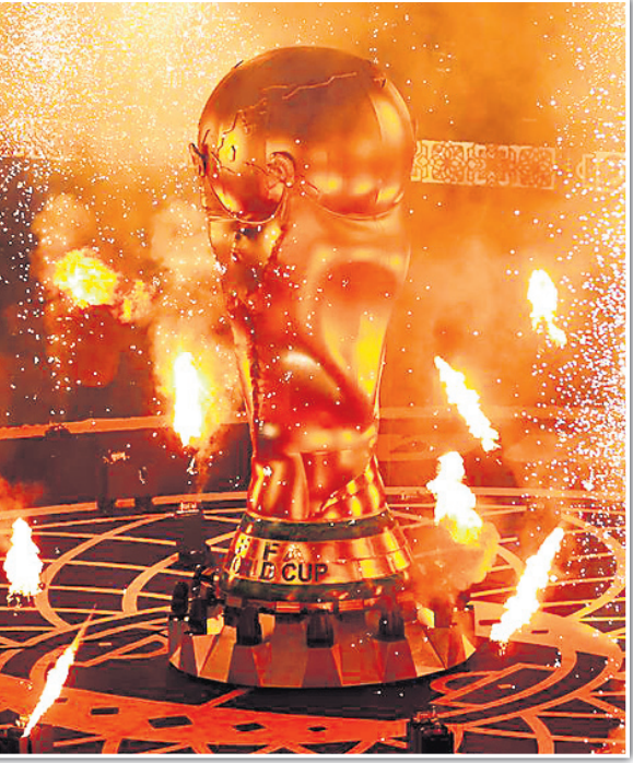
ଉଦ୍‌ଯାପନୀ ଉତ୍ସବରେ ବିଶ୍ୱକପ ପ୍ରତିକୃତି।