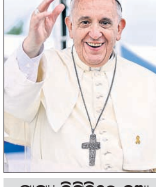
ସ୍ଵାସ୍ଥ୍ୟ ବିଗିଡ଼ିଲେ ନୂଆ ଧର୍ମଗୁରୁ ରୟନ ପରାମର୍ଶ

୨୦୧୩ରେ କ୍ୟାଥୋଲିକ୍ ଧର୍ମଗୁରୁ ପୋପ୍ ଫ୍ରାନ୍ସିସ୍ ଦାୟିତ୍ଵ ଗ୍ରହଣ କରିବା ପରେ ଏକ ଇସ୍ତଫା ପତ୍ର ଲେଖି ରଖିଥିବା ସଦ୍ୟ ସାକ୍ଷାତ୍କାରରେ କହିଛନ୍ତି । ଆଗାମୀ ଦିନରେ ଯେତେବେଳେ ସ୍ଵାସ୍ଥ୍ୟଗତ ସମସ୍ୟା ପାଇଁ ସେ କାର୍ଯ୍ୟ କରିବାକୁ ଅସମର୍ଥ ହେବେ, ସେତେବେଳେ ସେ ନିଜ ପଦରୁ ଓହ୍ଲାଇ ପାରିବେ ବୋଲି ଉଚ୍ଚ ଇସ୍ତଫା ପତ୍ରରେ ଉଲ୍ଲେଖ କରିଛନ୍ତି । ସ୍ଵେଚ୍ଛା ଖବରକାରୀଙ୍କ ଏବିସିକୁ ଦେଇଥିବା ସାକ୍ଷାତ୍କାରରେ ପୋପ୍ କହିଛନ୍ତି, ଏ ପ୍ରକାର ଘୃଷ୍ଣିତ ଉପକ୍ରମେ ସେ ଉଚ୍ଚ ଇସ୍ତଫା ପତ୍ରକୁ କାର୍ତ୍ତନାଲ ଚାହିଁସି ଯେତେବେଳେ ସ୍ଵାସ୍ଥ୍ୟଗତ କରିବା ପରେ ସେ ଏହାକୁ ଷ୍ଟେଟ୍‌ମେଣ୍ଟ ଭର୍ତ୍ତିକାଲ ସେକ୍ରେଟାରିଆଟ୍ ପ୍ରଦାନ କରିବେ । ଗତ ଶନିବାର ଫ୍ରାନ୍ସିସ୍ ୮୬ ବର୍ଷରେ ପଦାର୍ପଣ କରିଛନ୍ତି । ପଚଟକନିତ ସମସ୍ୟା ଭୋଗୁଥିବା ଫ୍ରାନ୍ସିସ୍କର ୨୦୨୧ରେ ଏକ ଅସ୍ତ୍ରୋପଚାର କରାଯାଇଥିଲା, ଯାହାପରେ ସେ ପରେ ଘୋଷଣା ଅଭିଯୋଗ ଗ୍ରହଣ କରି ତାଙ୍କ ବିରୋଧରେ ଆଇପିସିର ବିଜ୍ଞାନ ଧାରା ସମେତ ପୋକ୍ସୋ ଆଇନରେ ମାମଲା ରୁଜୁ କରିଛି ।