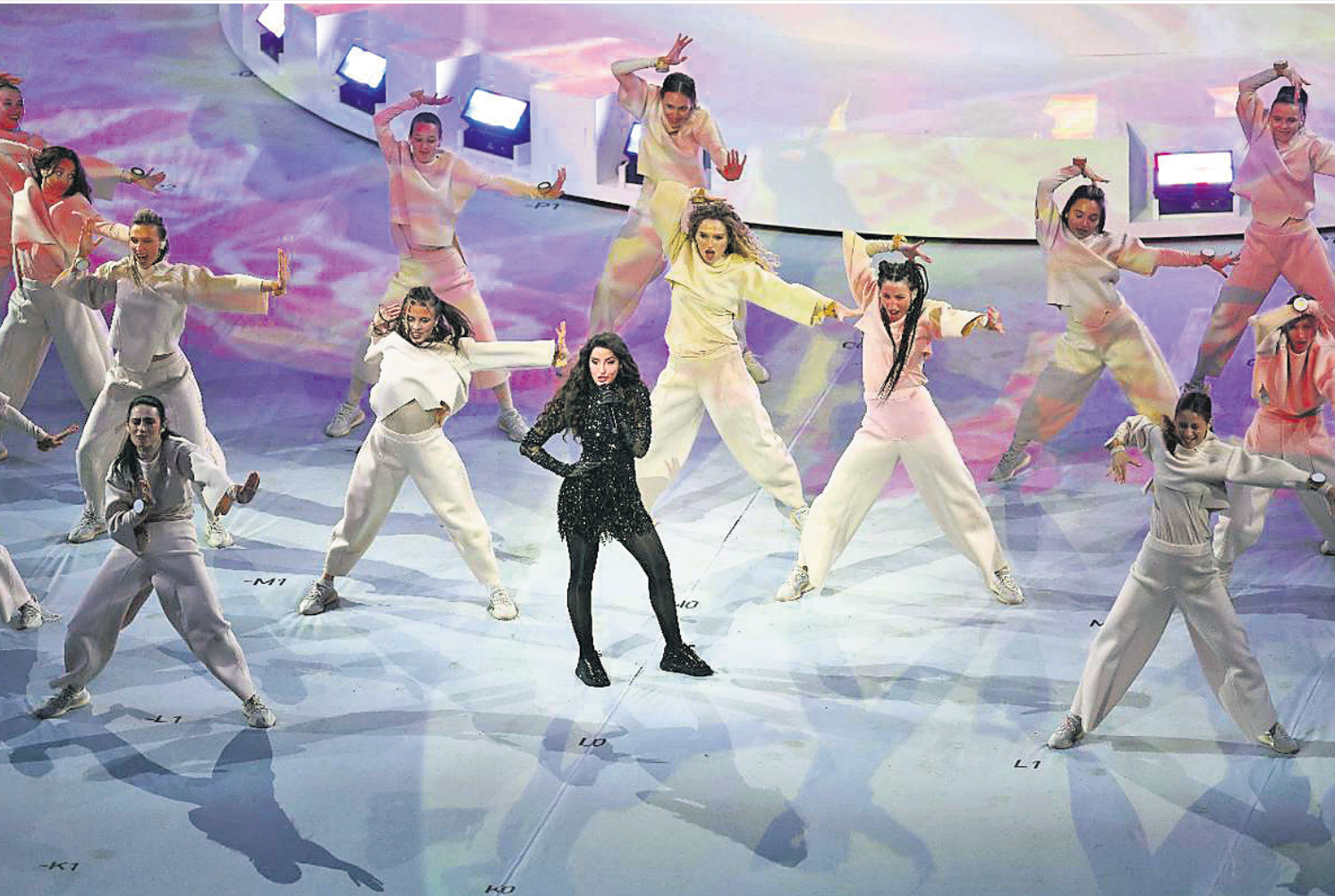
ଏ ନାଇଟ୍ ଟୁ ରିମେମ୍ବର ଗୀତରେ ନୋରା ଫତେହି ଓ ଅନ୍ୟ କଳାକାରଙ୍କ ନୃତ୍ୟ ପରିବେଷଣ।