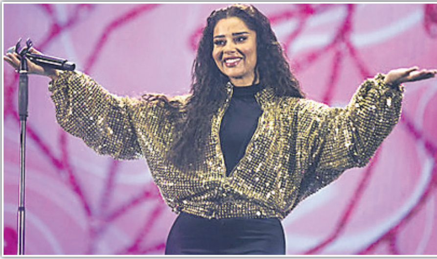
ଏମିରେଟ୍ କଣ୍ଠଶିଳ୍ପୀ ବାଲକିସ୍ ଫାଆ।