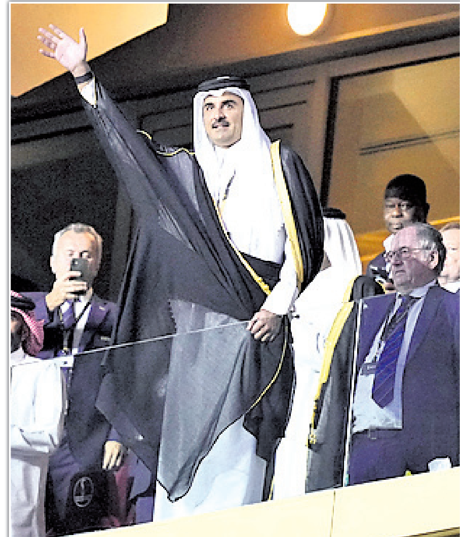
ଲୁସେଲ ଷ୍ଟାଡିୟମରେ କାତାରର ଏମିର ଶେଖ୍ ତମିମ୍ ବିନ୍ ହମାଦ।