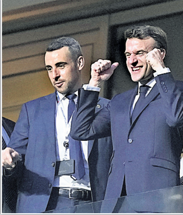
ଷ୍ଟାଡିୟମରେ ପ୍ରାନ୍ତ ରାଷ୍ଟ୍ରପତି ଇମାନ୍‌ଖଲ ମାକ୍‌ର୍ (ଡାହାଣ)।