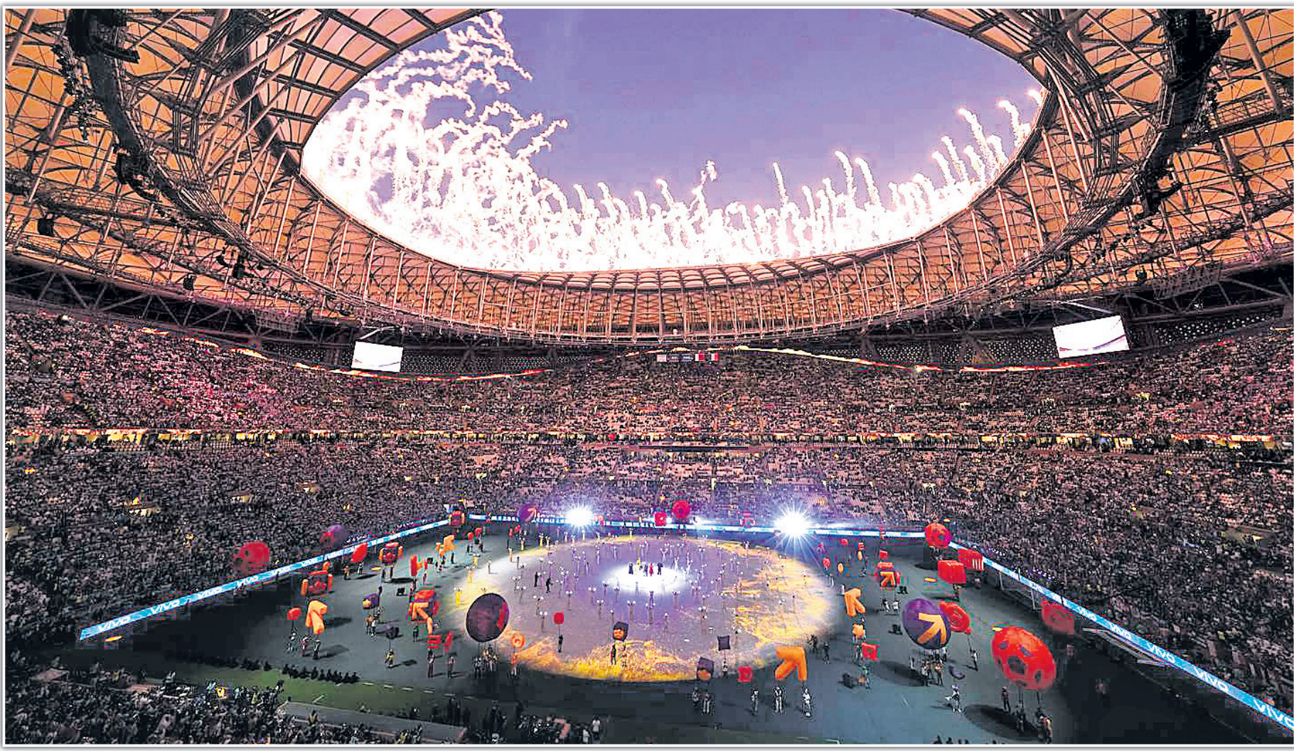
ଲୁସେଲ ଷ୍ଟାଡିୟମରେ ଉଦ୍‌ଯାପନୀ ଉତ୍ସବ।

ଆରବ ଜଗତରେ ପ୍ରଥମଥର ପାଇଁ ସଫଳତାର ସହ ଆୟୋଜିତ ହୋଇଛି ଫିଫା ବିଶ୍ୱକପ। ନଭେମ୍ବର ୨୦ରୁ ଆରମ୍ଭ ହୋଇଥିବା ଏହି ପୁଟବଳ ମହାକୁସ୍ମ ରବିବାର ଉଦ୍‌ଯାପିତ ହୋଇଛି। ଉଦ୍‌ଯାପନୀ ଉତ୍ସବର ରଙ୍ଗାରଙ୍ଗ କାର୍ଯ୍ୟକ୍ରମ ମନ ମୋହିଥିବାବେଳେ ଆକର୍ଷଣୀୟ ଓ ପ୍ରାନ୍ତ ମଧ୍ୟରେ ଫାଇନାଲ ବେଶ୍ ରୋମାଞ୍ଚିକ ହୋଇଥିଲା। ଉଦ୍‌ଯାପନୀ ଦିବସରେ ବିଶ୍ୱର ବହୁ ବଡ଼ ନେତା ଯୋଗ ଦେଇଥିଲେ। କଳାକାରଙ୍କ ମଧ୍ୟରେ ବଲିଉଡ ଅଭିନେତ୍ରୀ ଦୀପିକା ପାଦୁକୋନ ଓ ନୋରା ଫତେହି ଆକର୍ଷଣର କେନ୍ଦ୍ରରେ ରହିଥିଲେ।