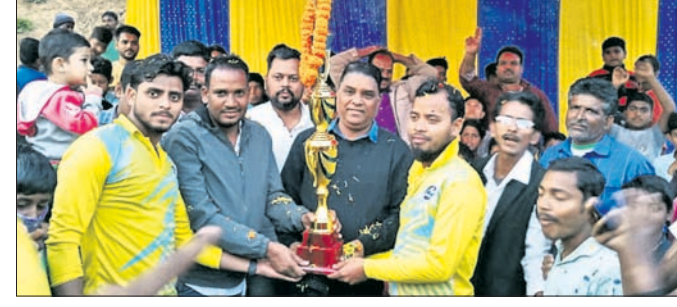
ଅତିଥିକଠାରୁ ଟ୍ରଫି ଗ୍ରହଣ କରୁଛି ଚାମ୍ପିୟନ ଟିମ୍। ଧାମନଗର, ୧୮୧୨ (ଡି.ଏନ.ଏ.)