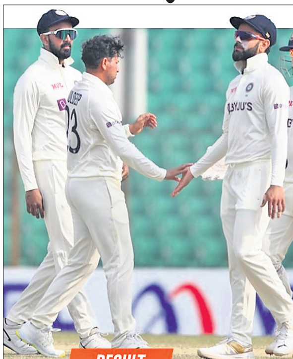
ଉଇକେଟ ନେବା ପରେ କୁଲଦୀପ ଯାଦବଙ୍କୁ ସାଥୀ ଖେଳାଳିଙ୍କ ବଧେଇ।

ବାଲାଦେଶ ବିପକ୍ଷ ପ୍ରଥମ ଟେଷ୍ଟ ମ୍ୟାଚକୁ ୧୮୮ ରନର ବୃହତ୍ ବ୍ୟବଧାନରେ ଜିତି ନେଇଛି ଭାରତ। ୫୧୩ ରନ ବିଶାଳ ଲକ୍ଷ୍ୟର ପିଛା କରୁଥିବା ବାଲାଦେଶ ୩୨୪ରନରେ ଅଲଆଉଟ ହେବା ସହିତ ଭାରତ ବିଜୟ ହୋଇଥିଲା। ଏହି ବିଜୟ ସହିତ ଭାରତ ବିଶ୍ଵ ଟେଷ୍ଟ ଚାମ୍ପିୟନଶିପ୍(ଡବ୍ଲ୍ୟୁଟିସି) ପଦ୍ମ ଟେବଲର ଦ୍ଵିତୀୟ ସ୍ଥାନକୁ ଉନ୍ନତ ହୋଇଛି। ଅଷ୍ଟ୍ରେଲିଆ ବିପକ୍ଷ ପ୍ରଥମ ଟେଷ୍ଟରେ ଦକ୍ଷିଣ ଆଫ୍ରିକା ପରାଜିତ ହେବା ସହିତ ଭାରତ ଦ୍ଵିତୀୟ ସ୍ଥାନକୁ ଉନ୍ନତ ହୋଇଛି। ଦକ୍ଷିଣ ଆଫ୍ରିକା ତୃତୀୟ ସ୍ଥାନକୁ ଖସି ଆସିଛି। ଚତୁର୍ଥ ଦିନର