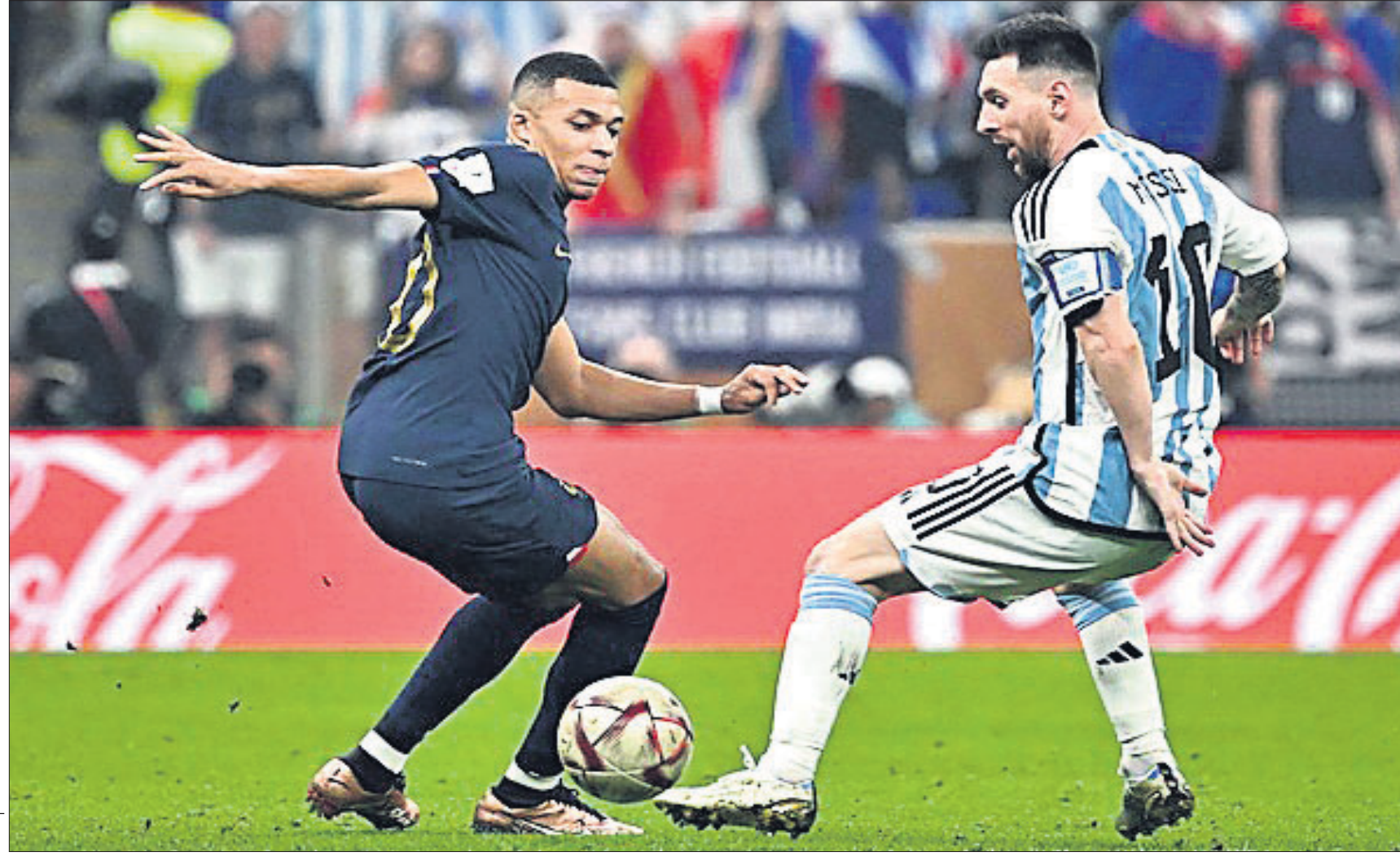
ଲୁସେଲ ଷ୍ଟାଡ଼ିୟମରେ ରବିବାର ଅନୁଷ୍ଠିତ ଫିଫା ବିଶ୍ଵକପ୍‌ର ଫାଇନାଲରେ ଫ୍ରାନ୍ସର କିଲିଆନ୍ ଏମ୍‌ବାପେ ଓ ଆର୍ଜେଣ୍ଟିନାର ଲିଓନେଲ ମେସିଙ୍କ ମଧ୍ୟରେ ବଲ୍ ପାଇଁ ସଂଘର୍ଷ।