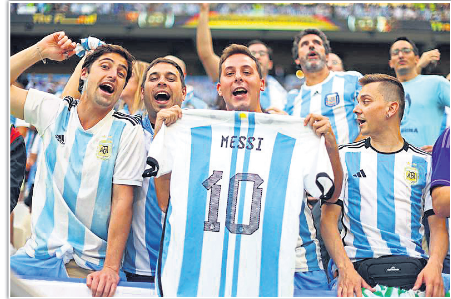
ମ୍ୟାଚ ପୂର୍ବରୁ ଲିଓନେଲ ମେସିଙ୍କ ସମର୍ଥକ।