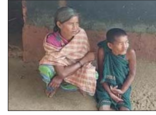
ବଡ଼ ଭଉଣୀ ପୁଅକୁ ସହ ସିନା।