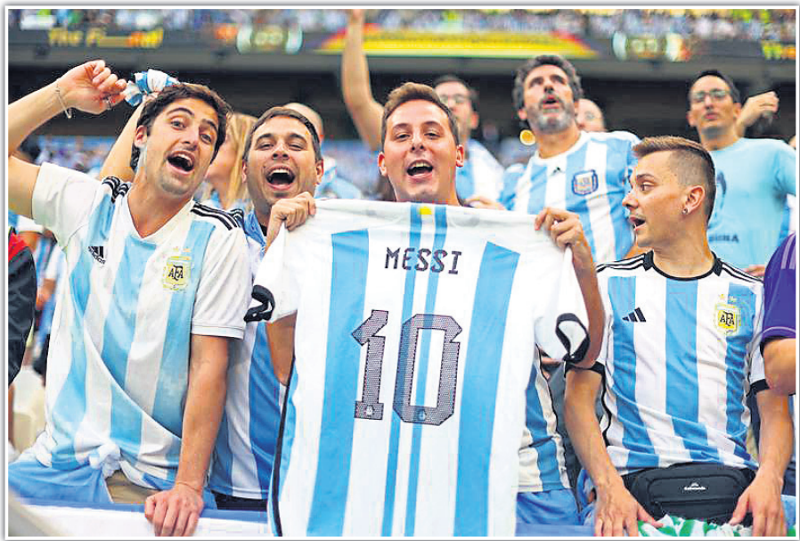
ମ୍ୟାଚ ପୂର୍ବରୁ ଲିଓନେଲ ମେସିଙ୍କ ସମର୍ଥକ।