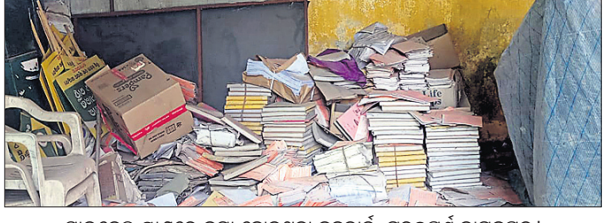
ସାଇକେଲ ଷ୍ଟାଣ୍ଡରେ କଳା ହୋଇଥିବା ବୃଦ୍ଧକାଠ, ଗୁରୁପୂର୍ଣ୍ଣ କାଗଜପତ୍ର।

କଟକ ସହର, ୧୮ ଡି.ଏନ୍.ଏ. : ବୁକ କାର୍ଯ୍ୟାଳୟ ପରିସରରେ ଥିବା ସାଇକେଲ ଷ୍ଟାଣ୍ଡରେ ବହୁ ଗୁରୁପୂର୍ଣ୍ଣ କାଗଜପତ୍ର, ବୃଦ୍ଧକାଠ ଓ ବହି ଜଳା କରାଯାଇଥିବା ଦେଖିବାକୁ ମିଳିଛି। ହେଲେ ଏଥିପ୍ରତି କେହି ଦୃଷ୍ଟି ଦେଉନାହାନ୍ତି। ଚରକାର ବେଳେ ଏହି କାଗଜପତ୍ର