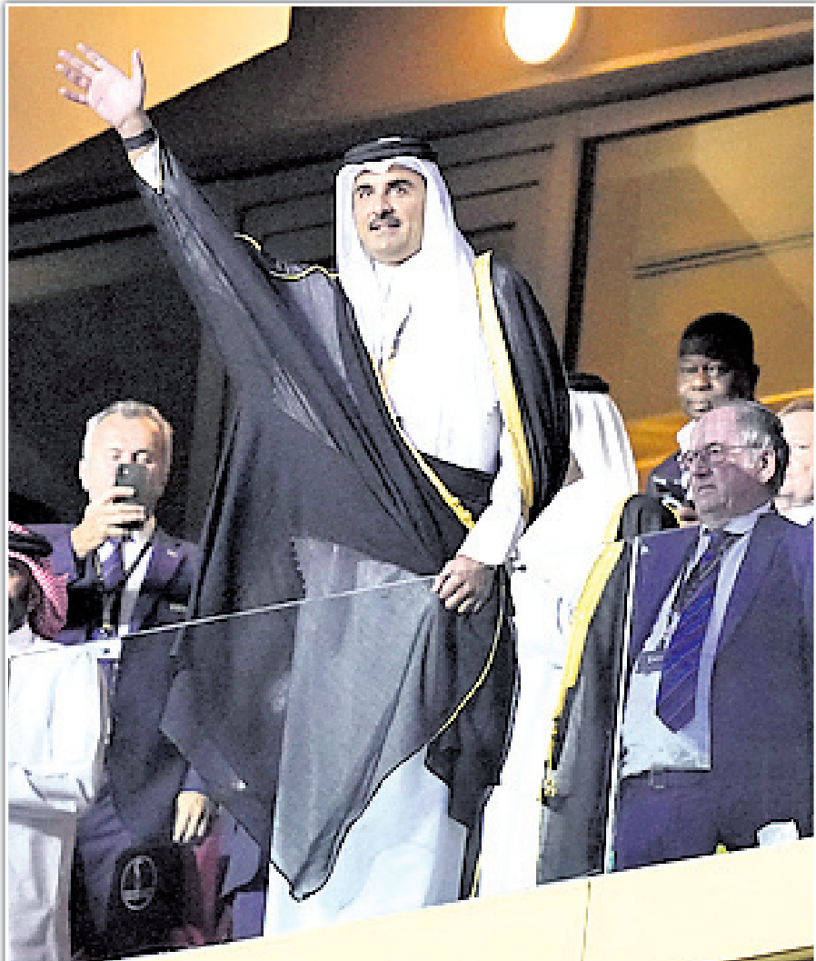
ଲୁସେଲ ଷ୍ଟାଡିୟମରେ କାତାରର ଏମିର ଶେଖ୍ ତମିମ୍ ବିନ୍ ହମାଦ।