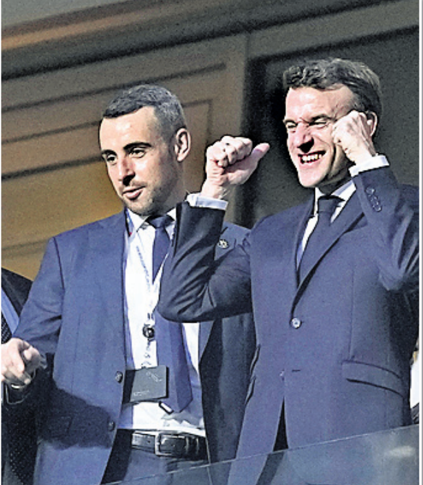
ଷ୍ଟାଡିୟମରେ ପ୍ରାନ୍ତ ରାଷ୍ଟ୍ରପତି ଇମାନ୍‌ଉଏଲ ମାକ୍‌ର୍ (ଡାହାଣ)।