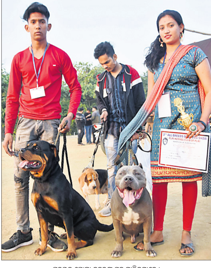
ପୁରସ୍କୃତ ପୋଷା କୁକୁରଙ୍କ ସହ ମାଲିକମାନେ।

ଭୁବନେଶ୍ୱର, ୧୮୧୨୨ (କ୍ୟୁ.ପ୍ର.) ଅଟୋରେ ବ୍ରାଉନିଂଗାର ବେପାର କରୁଥିବା ଜଣେ ବ୍ୟକ୍ତିଙ୍କୁ ଶହାଦନଗର ଥାନା ପୋଲିସ୍ ଗିରଫ କରି କୋର୍ଟ ଦାଖଲ କରିଛନ୍ତି।