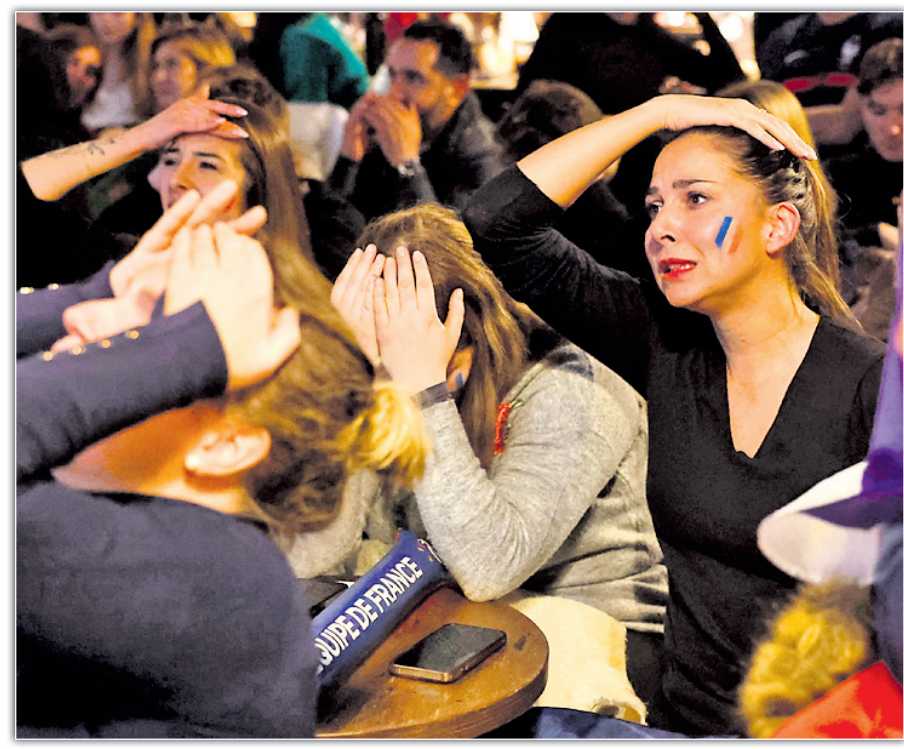
ହୁଖରେ ପ୍ରିୟମାଣୁ ପ୍ରାୟ ସମର୍ଥକ।