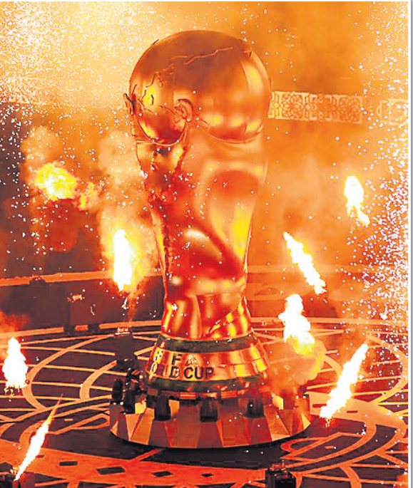
ଉଦ୍‌ଯାପନୀ ଉତ୍ସବରେ ବିଶ୍ୱକପ ପ୍ରତିକୃତି।