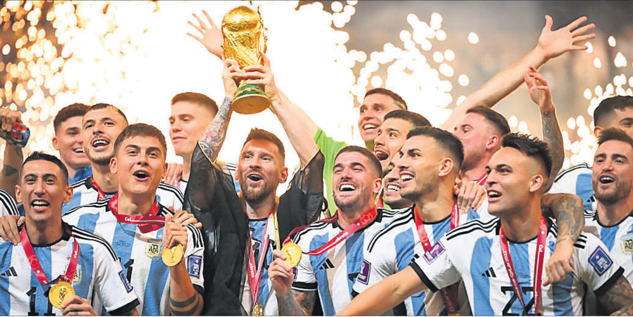
ଲୁସେଲ ଷ୍ଟାଡ଼ିୟମରେ ରବିବାର ଅନୁଷ୍ଠିତ ଫିଫା ବିଶ୍ୱକପ୍ ଫାଇନାଲରେ ଚାମ୍ପିୟନ ଆର୍ଜେଣ୍ଟିନା ଦଳର ଖେଳାଳିମାନେ ଟ୍ରଫି ସହ।

ଅନୁଷ୍ଠିତ ହେବ। ଭାରତୀୟ ହକିର ମୁଖ୍ୟ ଆକର୍ଷଣ ରାଉରକେଲା ବର୍ଷାମୁଣ୍ଡା ଷ୍ଟାଡ଼ିୟମର ଦର୍ଶକ କ୍ଷମତା ୨୦,୦୦୦ରୁ ଅଧିକ ରହିଥିବାବେଳେ ଆଇକନିକ୍ ଭୁବନେଶ୍ୱର କଳିଙ୍ଗ ଷ୍ଟାଡ଼ିୟମର ଦର୍ଶକ କ୍ଷମତା ୧୫,୦୦୦ରୁ ଉର୍ଦ୍ଧ୍ୱ। ଟି.ପୁ.ସି-୪