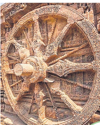
କୋଶାଳ ମନ୍ଦିରର ଚକ। (ଗୋଧରୀ ମହାପାତ୍ର ଏହାର ନକ୍ସା କରିଥିଲେ।)

■ ଦାୟିତ୍ୱରେ ଥିଲେ ଶ୍ରୀପଦ୍ମକୋଳ କ୍ଷେତ୍ରର ପରିବର୍ତ୍ତକ ■ ଶିଳ୍ପୀଙ୍କ ତିନିସା ପାଇଁ ଖୋର୍ଦ୍ଧା ହଳଦିଆ ଗାଁରୁ ଆସିଥିଲେ ବୈଦ୍ୟ