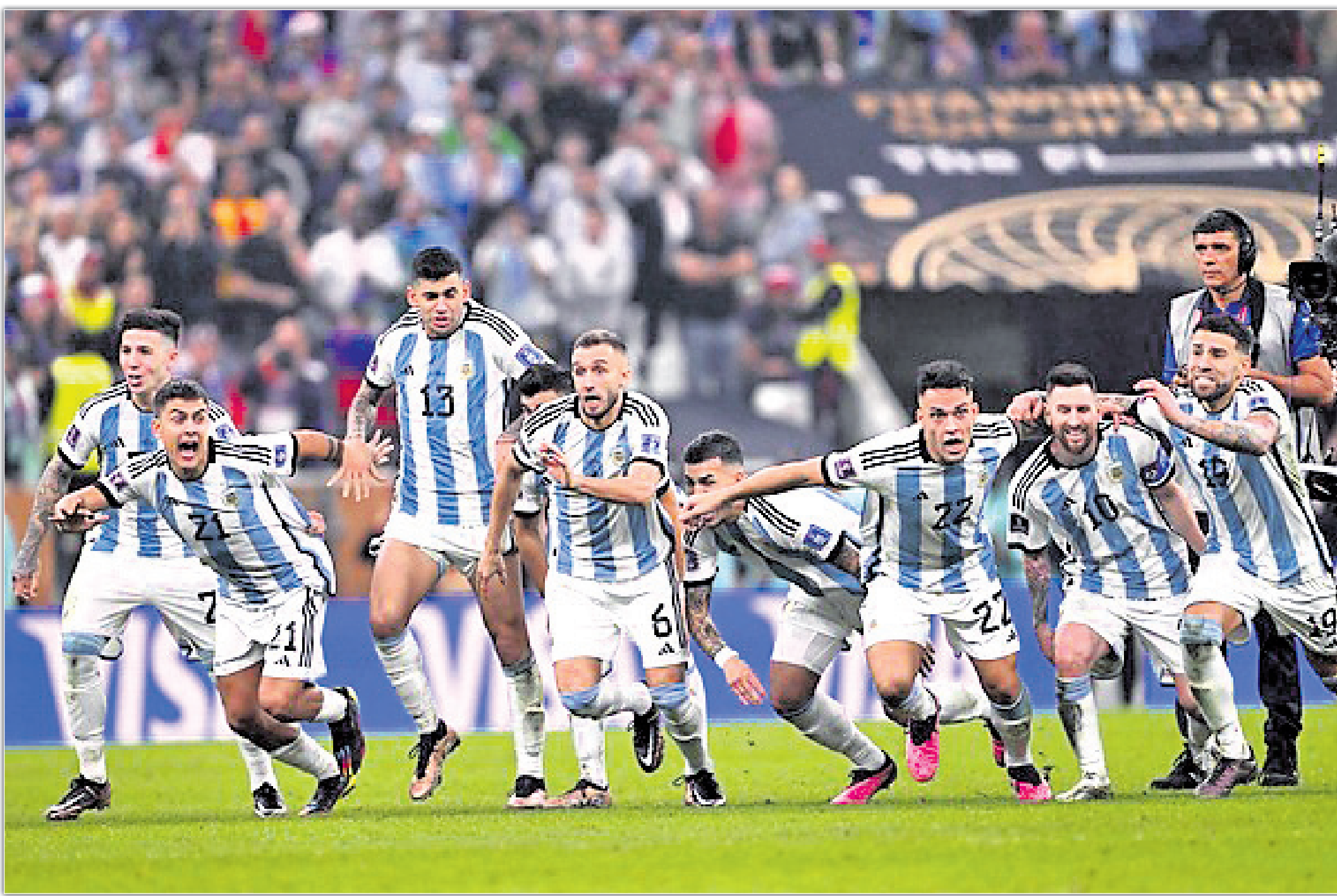
ବିଜୟରେ ଭଲସିତ ଆର୍ଜେଣ୍ଟିନା ଦଳ।

୨୦ ବର୍ଷ ପରେ ଏକ ଦକ୍ଷିଣ ଆମେରିକୀୟ ଦଳ ୨ ଥର ଗାମ୍ଭୀର୍ଯ୍ୟ ଗୋଲ ହାସଲ କରିଥିଲା।