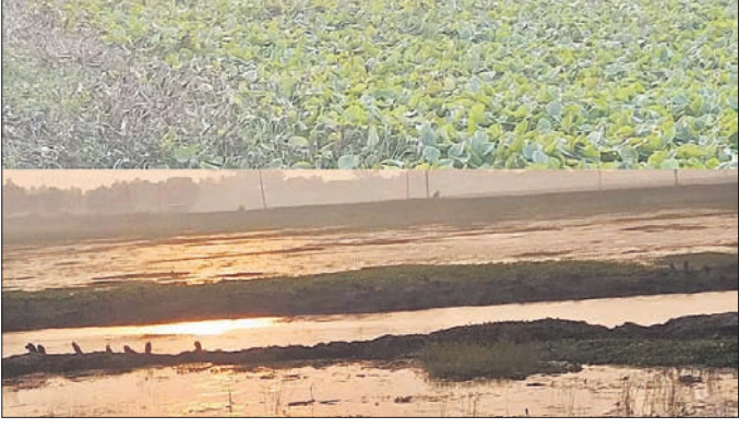
ଅନାବନା ଦଳରେ ପୋଡ଼ି ହୋଇପଡ଼ିଥିବା ନାଳ।

କଣାସ ବ୍ଲକର ସୁହାଗପୁର ଓ ଖରଖରା ନାଳରେ ପହଞ୍ଚିବାପରେ ଚିଲିକାକୁ ନିଶ୍ଚାସନ ହୋଇଥାଏ।