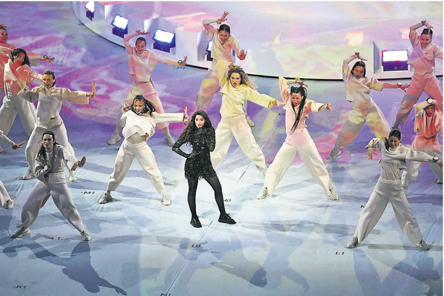
‘ଏ ନାଇଟ୍ ଟୁ ରିମେମ୍ବର’ ଗୀତରେ ନୋରା ଫତେହି ଓ ଅନ୍ୟ କଳାକାରଙ୍କ ନୃତ୍ୟ ପରିବେଷଣ।