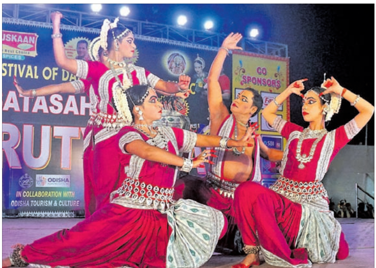
କଟକ ଉପର ବାଲିଯାତ୍ରା ପଡ଼ିଆରେ ସାତସାହି କଟକ ନୃତ୍ୟାସନରେ ରବିବାର ଉନ୍ମତ୍ତପ୍ରସାଦ ସନ୍ଧ୍ୟାରେ କଳାବିକାଶ କେନ୍ଦ୍ରର ନୃତ୍ୟଶିଳ୍ପୀଙ୍କ ଦ୍ୱାରା ପରିବେଷିତ ଓଡ଼ିଶା ନୃତ୍ୟ।