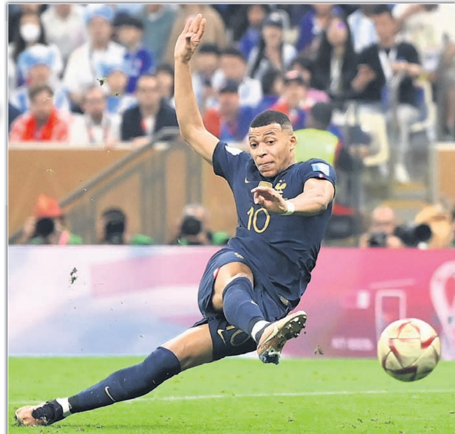
ସ୍ୱାଡିଲ୍ ଗୋଲ ଖେଳିବା ପାଇଁ ଆଣ୍ଡ ଖେଳାଳି।

ଏକ ବିଶ୍ୱକପ ଗାମ୍ଭୀର୍ଯ୍ୟ ଡିଲି। ପୂର୍ବରୁ ୨୦୦୨ ବିଶ୍ୱକପ ପାଇବାପରେ ପ୍ରାୟ ୨-୦ ଗୋଲରେ କର୍ମୀମାନଙ୍କୁ ପରାସ୍ତ କରିଥିଲା।