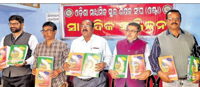
ଖବରଦାତା ସମ୍ମିଳନୀରେ ଓଷ୍ଟା ଟେଷ୍ଟପେପର ଉନ୍ମୋଚନ କରାଯାଇଛି।

କଟକ ଅସିଏ, ୧୮ ଡି.ଏନ୍.ଏ. : ଓଷ୍ଟା ପକ୍ଷରୁ ସମର୍ଥନ କରାଯିବ। ଏହି ଉତ୍ସବ ଆୟତ୍ତା ୨୬ରୁ ୨୯ ଚାମ୍ପିୟନ ପର୍ଯ୍ୟନ୍ତ କଟକ ସହାୟକ ସରକାରଙ୍କୁ ପ୍ରଦାନ କରିବା ପାଇଁ ପ୍ରସ୍ତୁତ ହେବ। ରାଜ୍ୟର ବିଭିନ୍ନ ସ୍କୁଲ ଛାତ୍ରାଛାତ୍ରୀଙ୍କ ମଧ୍ୟରେ ପ୍ରତିଭାକୁ ଲୁଚାଇ ନ ଥିବାରୁ ପ୍ରତିଭାକୁ ଲୋକଲୋଚନକୁ ଆଣିବା ସହ ସମ୍ମାନ ଜଣାଇବା ଉଦ୍ଦେଶ୍ୟରେ ପ୍ରତିବର୍ଷ ଏହି ଉତ୍ସବ ଆୟୋଜନ କରାଯାଇଛି। ବିଦ୍ୟାଳୟଗୁଡ଼ିକରେ ଚର୍ଚ୍ଚ, ସଙ୍ଗୀତ, ବିଦ୍ୟାଳୟର ସମସ୍ତ ଶିକ୍ଷକଙ୍କୁ ଲଗାତାର ପଢ଼ି ଉଚ୍ଚ ଶିକ୍ଷା ପ୍ରତିଯୋଗିତା ହୋଇଥାଏ। ସମସ୍ତ କୃତୀ ପ୍ରତିଯୋଗୀଙ୍କୁ ଓଷ୍ଟା ପକ୍ଷରୁ ସମର୍ଥନ କରାଯିବ। ସହ ଉପକ୍ରମରେ ନବୀନ କାର୍ଯ୍ୟକ୍ରମ ରହିଛି ବୋଲି ନୟାସଡ଼କସ୍ଥିତ ଓଷ୍ଟା କାର୍ଯ୍ୟାଳୟ ସଭାଗୁହରେ ଓଷ୍ଟା ପକ୍ଷରୁ ରବିବାର ଆୟୋଜିତ ଖବରଦାତା ସମ୍ମିଳନୀରେ ସୂଚନା ଦିଆଯାଇଛି। ଏହି ଅବସରରେ ଚଳିତ ଶିକ୍ଷାବର୍ଷ ମାଟ୍ରିକ ସମ୍ପର୍କିତ ୨ ପାଠ୍ୟ ଓଷ୍ଟା ପକ୍ଷରୁ ଟେଷ୍ଟପେପର ଉନ୍ମୋଚିତ ହୋଇଥିଲା। ଦୀର୍ଘବର୍ଷ ଧରି ଶିକ୍ଷାର ମାନ ବୃଦ୍ଧି ସହିତ ଛାତ୍ରାଛାତ୍ରୀଙ୍କ ପାଇଁ ଓଷ୍ଟା ଟେଷ୍ଟପେପର ସମ୍ପୂର୍ଣ୍ଣ ଉପାଦେୟ ହୋଇଛି ବୋଲି ସଂଘ ରିପ୍ତାକ୍ତ ଇତ୍ୟାଦି ପ୍ରତିଯୋଗିତା