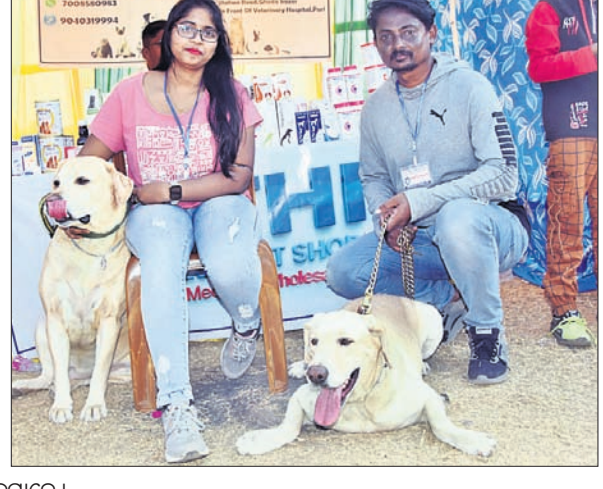
ନିଜ ପୋଷା କୁକୁରଙ୍କ ସହ ମାଲିକମାନେ।