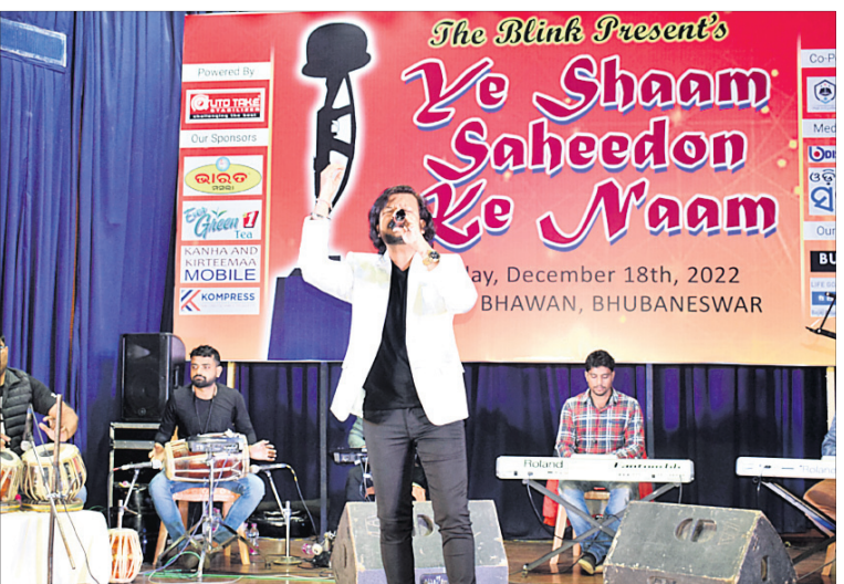
ଡିଏଲ୍ ପକ୍ଷରୁ ଭୁବନେଶ୍ୱର ସୁନା ଭବନରେ ରବିବାର ଅନୁଷ୍ଠିତ ସମ୍ପାଦନା କାର୍ଯ୍ୟକ୍ରମ 'ସେ ଶାମ୍ ସହିଦୋଁ କା ନାମ'ର ଜଣେ କଣ୍ଠଶିଳ୍ପୀ ସମ୍ପାଦକ ପରିବେଷଣ କରୁଛନ୍ତି।

ଆପଣମାନେ ପରିବାର ସଦସ୍ୟ, ସାଙ୍ଗ କିମ୍ବା ସମ୍ପର୍କୀୟଙ୍କ ଗହଣରେ ଉଠାଉଥିବା ସେଲ୍ଫିକୁ ପଠାଇବା ସମୟରେ ନିଜର ନାମ ଏବଂ ମୋବାଇଲ ନମ୍ବର ଦେବାକୁ ଭୁଲନ୍ତୁ ନାହିଁ। ଯୋଗ୍ୟ ବିବେଚିତ ଫଟୋ ପ୍ରକାଶ ପାଇବ।