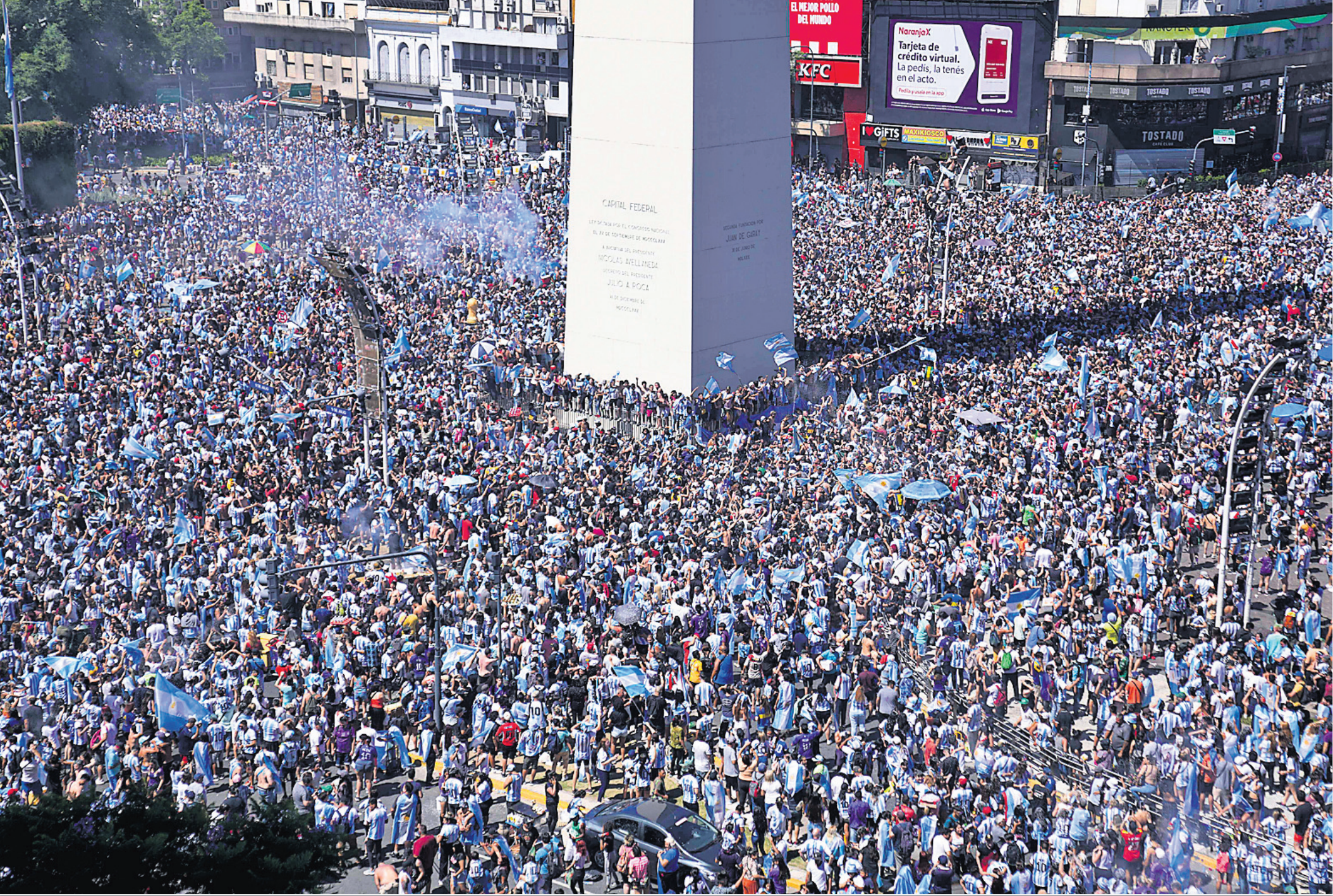
ଆର୍ଜେଣ୍ଟିନାର ହୁଖରେ ଏହାର ପୁରସ୍କାର ପ୍ରଦାନ ବିନ୍ଦୁ।