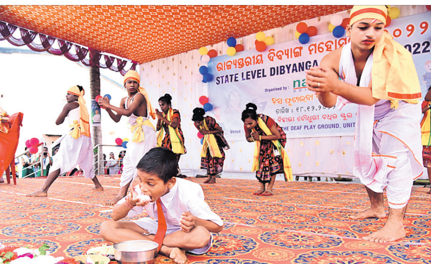
ଭୁବନେଶ୍ୱରସ୍ଥିତ ବିପିନ ବିହାରୀ ଚୌଧୁରୀ ବ୍ୟବସ୍ଥାପିତା ପଡ଼ିଆରେ ରବିବାର ଅନୁଷ୍ଠିତ ରାଜ୍ୟସ୍ତରୀୟ ବିଦ୍ୟାଳୟ ମହୋତ୍ସବରେ ଛାତ୍ରଛାତ୍ରୀମାନେ କଳା ପ୍ରଦର୍ଶନ କରୁଛନ୍ତି।