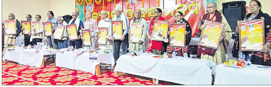
ବିଶ୍ୱାସର ବିଦ୍ୟାପୀ ୧୯୮୩ ମାସର ବ୍ୟାପକ ପକ୍ଷରୁ ପୂଜ୍ୟପୂଜା ସମ୍ମାନ ଉତ୍ସବରେ ସମ୍ବର୍ଦ୍ଧିତ ଶିକ୍ଷକମାନେ।

ବୁଦ୍ଧିଷ୍ଣୁ ଟ୍ୟାଲୋଗ୍ରେ ଏକାଡେମୀ ପକ୍ଷରୁ ପୁସ୍ତକ ଶିଖାର ଓ ଉପଯୁକ୍ତ ପୁସ୍ତକର ଖାଦ୍ୟ ସଂକ୍ରାନ୍ତ ଏକ ଚିକିତ୍ସା ଶିବିର ଆୟୋଜିତ ହୋଇପାରିବ।