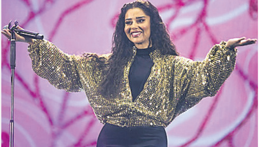
ଏମିରେଟ୍ କଣ୍ଠଶିଳ୍ପୀ ବାଲକିସ୍ ଫାଆ।