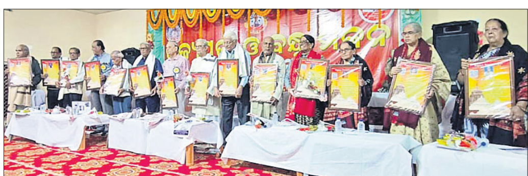
ପୁରୀ: ରବିବାର ଅନୁଷ୍ଠିତ ପୂଜ୍ୟପୂଜା ସମ୍ମାନ ଉତ୍ସବରେ ସମ୍ମାନିତ ଶିକ୍ଷୟିତ୍ରୀ ଶିକ୍ଷକମାନେ।

ଶ୍ରୀମନ୍ଦିର ପ୍ରଶାସନ ପକ୍ଷରୁ ସୋମବାର ପିନ୍-ପର୍ଯ୍ୟନ୍ତ ଶ୍ରୀମନ୍ଦିର ସେବାୟତ ଓ ତାଙ୍କ ପରିବାର ନିମନ୍ତେ ଏକ ନିଶ୍ଚଳ ସ୍ୱାସ୍ଥ୍ୟ ଶିବିର ଆୟୋଜିତ ହେବ।