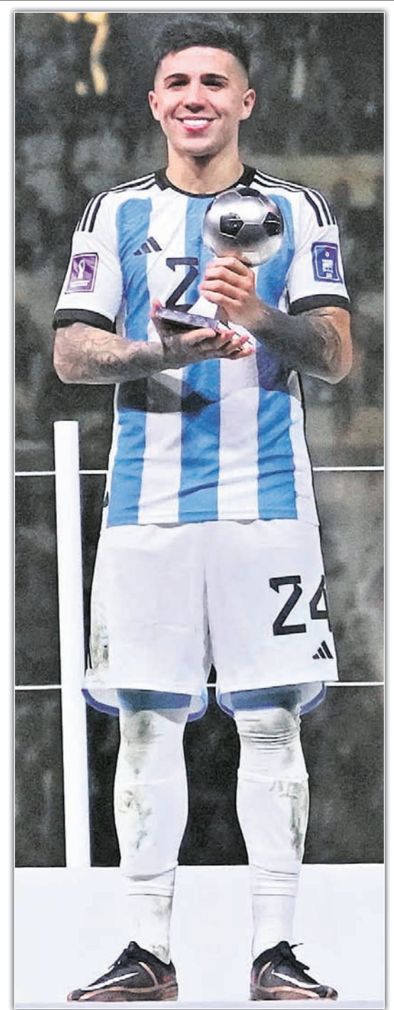
ସର୍ବ ପୁରୁଷ ଅର୍ପୁ ବ ଟୁର୍ନାମେଣ୍ଟ ଏଜୋ ପର୍ନାଣେସ୍।