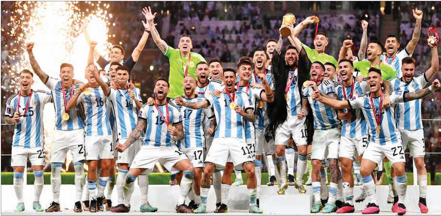
କାଗାରରେ ଅନୁଷ୍ଠିତ ପିଫା ବିଶ୍ୱକପ ଚାମ୍ପିୟନ ଆର୍ଜେଣ୍ଟିନା ଦଳ ।

ପାଇଁ ଇଂଲଣ୍ଡ ଆହୁରି ୫୫ ରନ ଆବଶ୍ୟକ କରୁଛି। ଗତ ସପ୍ତାହରେ ମୁଲତାନଠାରେ ଦଳ ୨୬ ରନରେ ରୋମାଞ୍ଚକ ବିଜୟ ହାସଲ କରିଥିଲା। ଏହାପୂର୍ବରୁ ଇଂଲଣ୍ଡ ରାଞ୍ଜିତପୁରଠାରେ ଅନୁଷ୍ଠିତ ପ୍ରଥମ ଟେଷ୍ଟ ମ୍ୟାଚକୁ ୭୪ ରନରେ ଛିଟିନେଇଥିଲା। ସଂକ୍ଷିପ୍ତ ସ୍ଵର ପାକିସ୍ତାନ ପ୍ରଥମ ଇନିଂସ: ୩୦୪ ଇଂଲଣ୍ଡ ପ୍ରଥମ ଇନିଂସ: ୩୫୪ ପାକିସ୍ତାନ ଦ୍ୱିତୀୟ ଇନିଂସ: ୨୧୬ (ବାବର ଆଜାମ-୫୪, ସାଉଦ୍ ଶକିଲ-୫୩, ଅଦ୍‌ହୁଲ୍‌ ସାଦି-୨୬); ରେହାନ ଅହମ୍ମଦ-୫/୪୮, ଜ୍ୟାକ୍ ଲିର୍-୩/୭୨)। ଇଂଲଣ୍ଡ ଦ୍ୱିତୀୟ ଇନିଂସ: ୧୧୨/୨ (ବେନ୍‌ଡକେଟ-୫୦*, ଜ୍ୟାକ୍‌କ୍ରୁଲି-୪୧, ଅସ୍ତ୍ରାର ଅହମ୍ମଦ-୨/୪୩)।