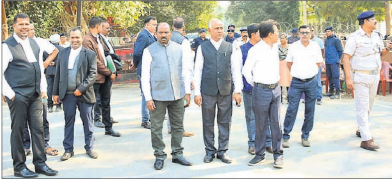
ଜିଲ୍ଲା କୋର୍ଟ ପରିସରରେ ଓକିଲଙ୍କ ପ୍ରତିନିଧି ଦଳ।

କାର୍ଯ୍ୟକାରୀ ହେଉନି ସ୍ଵପ୍ନକୋର୍ଟଙ୍କ ନିର୍ଦ୍ଦେଶ ସମ୍ବଲପୁରରେ ବିଭିନ୍ନ ଜିଲାର ଓକିଲ ପ୍ରତିନିଧି ଦଳ