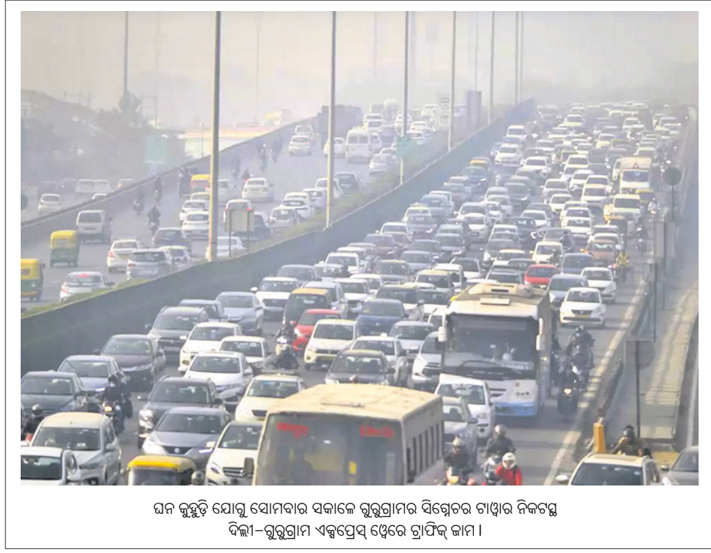
ଘନ କୁହୁଡ଼ି ଯୋଗୁଁ ସୋମବାର ସକାଳେ ଗୁରୁଗ୍ରାମର ସିଗ୍ନେଚର ଗାଁରେ ନିକଟସ୍ଥ ଦିଲ୍ଲୀ-ଗୁରୁଗ୍ରାମ ଏକ୍ସପ୍ରେସ୍ ଝେର ଟ୍ରାଫିକ୍ ଜାମ।

ରବିବାର କହିଥିବାବେଳେ ଏ ନେଇ ତାଙ୍କର ପ୍ରତିକ୍ରିୟା ମିଳିପାରି ନାହିଁ। ମସ୍କ ଟୁଇଟରର ପୋଲ୍‌କୁ ଅନୁକରଣ କରି ଆମେରିକୀୟ ରାଜ୍ୟର ସୁପ୍ରିମ ଟର୍ ଏହି ମାଲ୍‌କୋରୁଟି ଆପ୍ ପରିଚାଳନା କରିବା ଲାଗି ଟୁଇଟରଙ୍କ ମତ ଲୋଡ଼ିଛନ୍ତି। ଏଥିଲାଗି ସୋମବାର ସୁପ୍ରିମ ଟୁଇଟରର ପୋଲ୍ କରିଛନ୍ତି। ବର୍ତ୍ତମାନ ମସ୍କ ୧୦ ଲକ୍ଷ ଟୁଇଟରଙ୍କ ମତ ପଡ଼ିଛି। ଏଥିରୁ ୮୦ ପ୍ରତିଶତ ଟୁଇଟର ସୁପ୍ରିମ ଟୁଇଟର ପରିଚାଳନା ଦାୟିତ୍ୱ ଗ୍ରହଣ କରନ୍ତୁ ବୋଲି ମତ ଦେଇଛନ୍ତି।