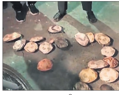
ଉଦ୍ଧାର କରାଯାଇଛି। ପାରଳାଖେମୁଣ୍ଡି, ୧୯୧୨ (ଡି.ଏନ୍.ଏ.)

ଗଜପତି ଜିଲ୍ଲା ପାରଳାଖେମୁଣ୍ଡିରେ ଜିଲ୍ଲା ମହାସ୍ଵ ବିଭାଗ ପୋଖରୀରୁ କଇଁଛ ଚୋରାଚାଲାଣ ହେଉଥିବା ବେଳେ ବନବିଭାଗ ଉଦ୍ଧାର କରିଛି। ମହାସ୍ଵ ବିଭାଗ ପୋଖରୀରେ ଦିନମୁକ୍ତିଆ ଭାବେ କାମ କରୁଥିବା