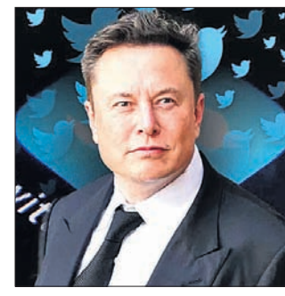
ମାଡ୍ରାସ୍, ୧୯ ଡିସେମ୍ବର

ସୋସିଆଲ ମିଡିଆ ଜାଏଣ୍ଟ ଟୁଇଟରର ସିଲ୍‌ଓ ଏକ ମସ୍କ ଉପରେ ଖୁସି ନାହାନ୍ତି। ଟୁଇଟରର ମାଲିକାନା ଏକ ମସ୍କ ହାତକୁ ଯିବା ପରେ କମ୍ପାନୀର କର୍ମଚାରୀଙ୍କୁ ଆରମ୍ଭ କରି ଟୁଇଟର ଅଧିକାରୀ ଥିବା ଜଣାପଡ଼ିଛି। ରବିବାର ସନ୍ଧ୍ୟାରେ ମସ୍କ ଟୁଇଟରର ସିଲ୍‌ଓ ପଦରେ ରହିବା ଉଚିତ୍ କି ନୁହେଁ ସେଥିଲାଗି ଟୁଇଟରର ପୋଲ୍ କରିଥିଲେ। ଟୁଇଟରର ମସ୍କଙ୍କୁ ମତ ଦେଇଥିଲେ। ସୋମବାର ଏହାର ଫଳ ପ୍ରକାଶ ପାଇଛି, ଯେଉଁଥିରେ ୫୭.୫% ଟୁଇଟରର ମସ୍କଙ୍କୁ ସିଲ୍‌ଓ ପଦରୁ ଓହରାଯିବା ପରେ ବୋଲି ମତ ଦେଇଥିବାବେଳେ