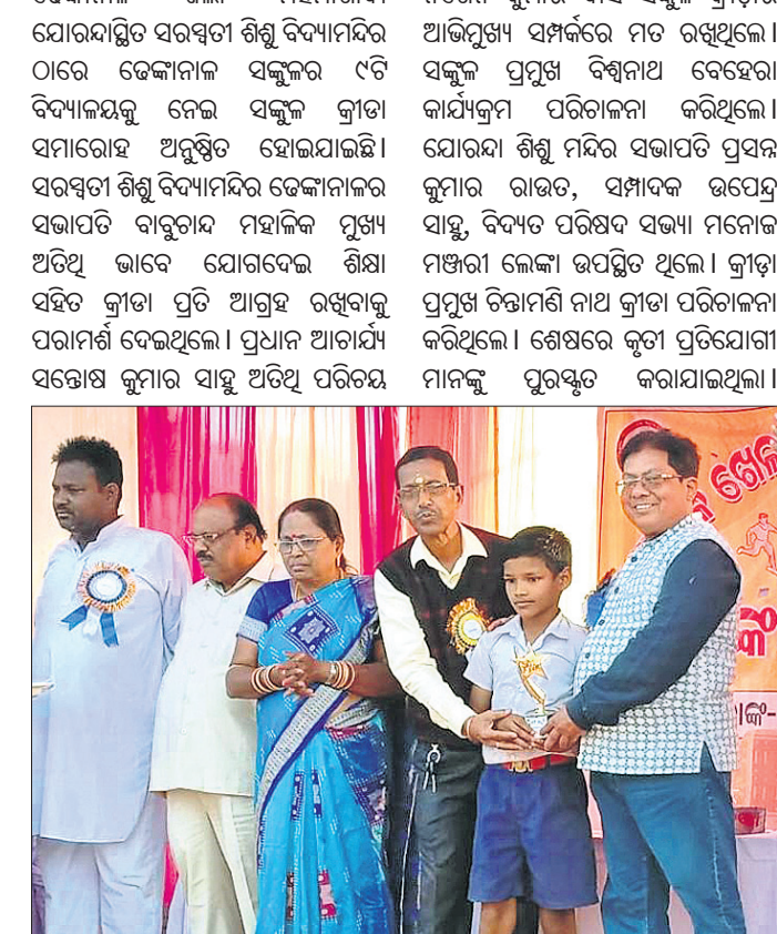
ସଙ୍କୁଳ କ୍ରୀଡ଼ା ସମାରୋହରେ ଅତିଥି ପୁରସ୍କାର ପ୍ରଦାନ କରୁଛନ୍ତି।