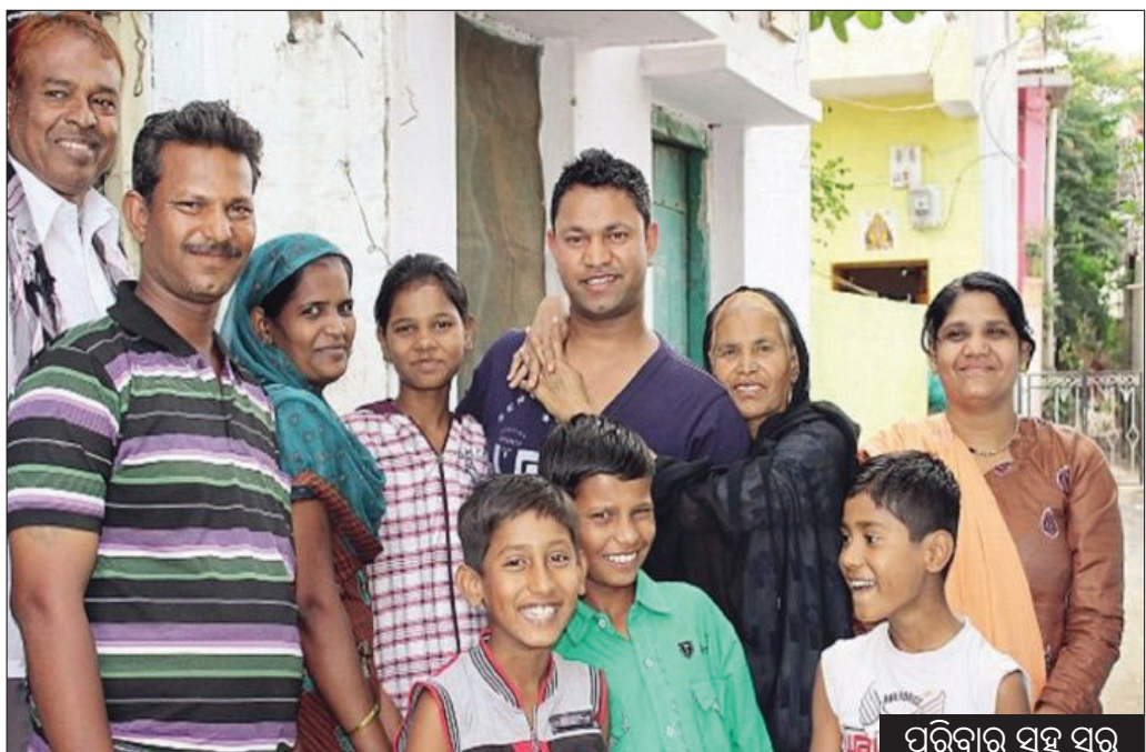
ପରିବାର ସହ ସବୁ

କାନବେରା: ସୋସିଆଲ ମିଡିଆ ହେଉ ଅବା ଇଣ୍ଟରନେଟ ଅନେକଙ୍କୁ ଗୋଟିଏ ଡୋମେନ୍ ବାନ୍ଧି ରଖିଛି ଏହି ଅତ୍ୟାଧୁନିକ ନେଟୱାର୍କ ସେବା।