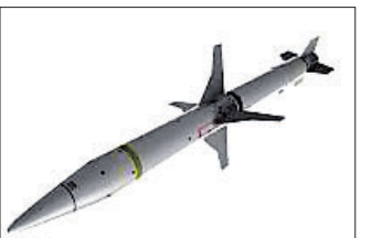
ମସ୍କୋ, ୧୯ ଡିସେମ୍ବର

ଯୁକ୍ତେନ୍ଦ୍ର ଉପରେ ରୁଷିଆ ୧୦ ମାସ ହେଲା ଆକ୍ରମଣ ତଳାଇଥିବାବେଳେ ଆମେରିକା ନିର୍ମିତ ୪ କ୍ଷେପଣାସ୍ତ୍ର ଖସାଇଥିବା ପ୍ରଥମ ଥର ପାଇଁ ମସ୍କୋ ଦାବି କରିଛି। ଯୁକ୍ତେନ୍ଦ୍ର ସୀମାକୁ ଲାଗି ରହିଥିବା ରୁଷିଆର ବେଲଗୋରୋଡ଼ ଅଞ୍ଚଳ ଉପରେ ଆମେରିକା ୪ଟି 'ହାର୍ମି' ଆଣ୍ଡି-ରାଡାର କ୍ଷେପଣାସ୍ତ୍ରକୁ ରୁଷିଆ ସୈନ୍ୟ ଖସାଇଥିଲେ ବୋଲି ଏହାର ପ୍ରତିରକ୍ଷା ମନ୍ତ୍ରାଳୟ ପକ୍ଷରୁ ସୂଚନା ଦିଆଯାଇଛି। ଯୁକ୍ତେନ୍ଦ୍ର ଆମେରିକା ସମେତ ନାଟୋ ସଦସ୍ୟ ରାଷ୍ଟ୍ରଗୁଡ଼ିକ ଅସ୍ତ୍ର ସହାୟତା ଯୋଗାଇ ଆସୁଛନ୍ତି। ବେଲଗୋରୋଡ଼ ଅଞ୍ଚଳରେ ଯୁକ୍ତେନ୍ଦ୍ର ପକ୍ଷରୁ ବାରମ୍ବାର କ୍ଷେପଣାସ୍ତ୍ର ମାଡ଼ କରାଯାଉଥିବା ରୁଷିଆ ପ୍ରତିରକ୍ଷା ମନ୍ତ୍ରାଳୟ ଏକ ବିବୃତିରେ କହିଛି।