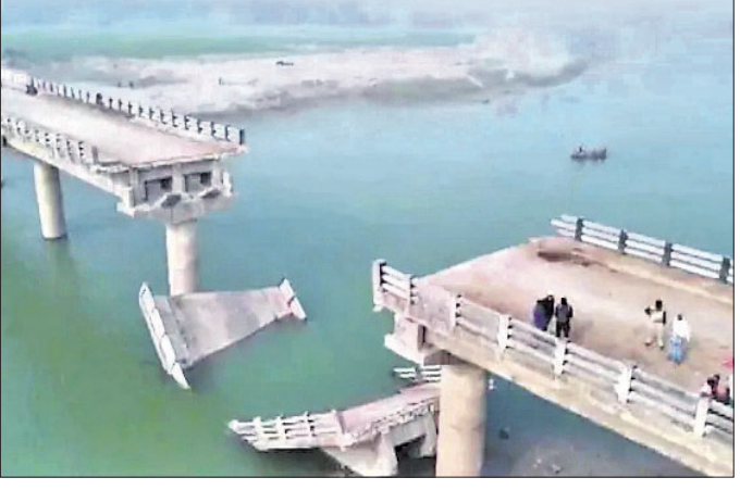
ପାଟଣା, ୧୯ ଡିସେମ୍ବର

ବିହାରରେ ନିର୍ମିତ ଏକ ପୋଲ ରବିବାର ଭୁବନେଶ୍ୱର ହୋଇ ନଦୀରେ ଖସିପଡ଼ିଛି। ବେଙ୍ଗୁରାଇ ଜିଲ୍ଲାରେ ବୁଡ଼ି ଗଲେ ନଦୀ ଉପରେ ୧୩ କୋଟି ଟଙ୍କା ବ୍ୟୟରେ ଉଚ୍ଚ ବ୍ରିଜ୍ ନିର୍ମାଣ ହୋଇଥିଲା। ଚେତେ ରବିବାର ବ୍ରିଜ୍ ଭୁବନେଶ୍ୱର ବେଳେ ସେଠାରେ କେହି ନ ଥିଲେ ବୋଲି ପ୍ରଶାସନ ପକ୍ଷରୁ କୁହାଯାଇଛି।