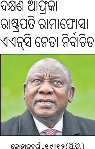
କୋହାସୁବର୍ଣ୍ଣ, ୧୯ ଡିସେମ୍ବର (ପି.ଟି.)

ରାଜ୍ୟ ନ ଶୁଣାଇବା ପର୍ଯ୍ୟନ୍ତ ଦୁଇ ରାଜ୍ୟ ସୀମାକୁ ନେଇ ଦାବି ଉଠାଇବେ ନାହିଁ ବୋଲି ଶାହାଙ୍କ ସହ ଚେତନାରେ ଦୁଇ ମୁଖ୍ୟମନ୍ତ୍ରୀ ରାଜି ହୋଇଥିଲେ। ଚେତନା ସହାୟକ ମହାରାଷ୍ଟ୍ର ଗର୍ବର ପ୍ରସଙ୍ଗ ହୋଇଥିବା କହି ଏହା ଉପରେ କେଠାର ଆଭିମୁଖ୍ୟ ଗ୍ରହଣ କରାଯିବ ବୋଲି ସୀମାରେ ମୁଖ୍ୟମନ୍ତ୍ରୀ ଏକମତ ଶିରେ କହିଛନ୍ତି। ଆମେ ଆମ ଲୋକଙ୍କ ସହ ରହିଛୁ ଏବଂ ସବୁ ଆବଶ୍ୟକତା ଯୋଗାଇ ଦେବୁ ବୋଲି ଶିରେ କହିବା ସହ କର୍ନାଟକ ମୁଖ୍ୟମନ୍ତ୍ରୀଙ୍କୁ ଚୁକ୍ତବଦ୍ଧ କରିଛନ୍ତି। ମହାରାଷ୍ଟ୍ର-କର୍ନାଟକ ସୀମା ବିବାଦ ବିଶେଷତା କର୍ମଚାରୀ ମହାରାଷ୍ଟ୍ର ଏମ୍‌ଏସ୍‌ଏ ଯୋଗୁଁ ଯେଉଁଠି ଯାହା ଯାହା ପ୍ରଦାନ ହୋଇଥିଲା ସେଇଥିରେ ଗୁପ୍ତ କରିବାକୁ ଥିବାବେଳେ ଜିଲ୍ଲା ପ୍ରଶାସନ ତାଙ୍କୁ ବାନ୍ଧି ରଖିଥିଲା। ମହାରାଷ୍ଟ୍ର ଏମ୍‌ଏସ୍‌ଏ ପ୍ରବେଶ ଯୋଗୁଁ ଆଇନ ଶୁଖିଲା ସ୍ଥିତି ଉପସ୍ଥିତରେ ବୋଲି ପୋଲିସ୍‌ ଏଡିଆଇ ଜୁମାର ଅଧିବେଶନ ସମୟରେ ବିଷୋଭ ପାଇଁ ୨୧୧ ସଂଖ୍ୟାରେ ଅନୁମତି ଲୋଡ଼ିଥିଲେ। ଆଇନ ଶୁଖିଲା ସ୍ଥିତି ଉପସ୍ଥିତ ଆଶଙ୍କାରେ ବେଲଗାଭିରେ ୬ ଏସ୍‌ପି, ୧୧ ଏଏସ୍‌ପି, ୪୩ ଡିଏସ୍‌ପିଏସ୍‌ ସମେତ ୪,୦୦୦ରୁ ଊର୍ଦ୍ଧ୍ୱ ପୋଲିସ୍‌ ପୁତୁରା ହୋଇଛି।