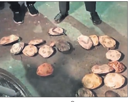
ଉଦ୍ଧାର କରାଯାଇଥିବା ୨୦ଟି କଇଁଛ।

ଗଜପତି ଜିଲ୍ଲା ପାରଳାଖେମୁଣ୍ଡିରେ ଜିଲ୍ଲା ମହାସ୍ଵାସ୍ଥ୍ୟ ବିଭାଗ ପୋଖରୀରୁ କଇଁଛ ଚୋରାଚାଲାଣ ହେଉଥିବା ବେଳେ ବନବିଭାଗ ଉଦ୍ଧାର କରିଛି। ମହାସ୍ଵାସ୍ଥ୍ୟ ବିଭାଗ ପୋଖରୀରେ ଦିନମଜୁରିଆ ଭାବେ କାମ କରୁଥିବା