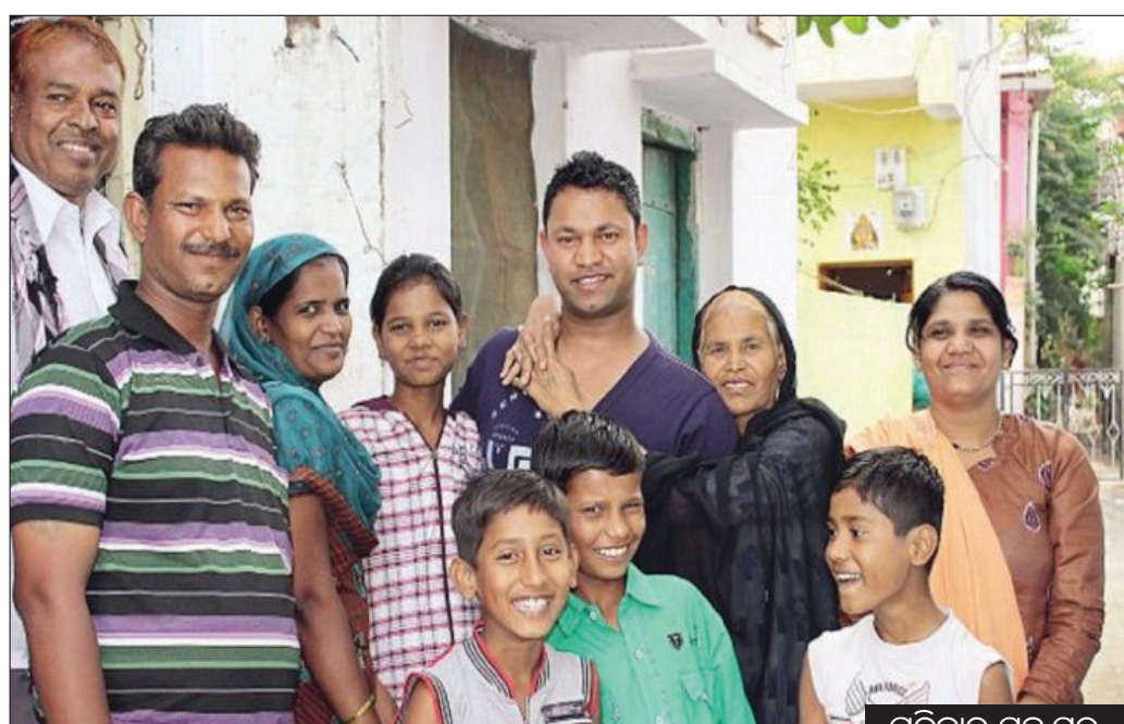
ପରିବାର ସହ ସବୁ