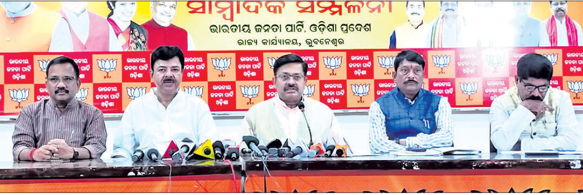
ଖବରଦାତା ସମ୍ମିଳନୀରେ ଭାଜପା ନେତୃମଣ୍ଡଳ