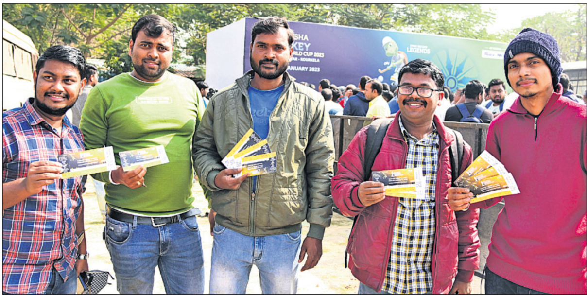
କଳିଙ୍ଗ ସ୍ୱାସ୍ଥ୍ୟ ନିକଟସ୍ଥ ବନ୍ଧୁ ଅଫିସରୁ ଚିକିତ୍ସା କରାଯାଇ ପରେ ହାଲୁକା ହେଲେ।

ଭୁବନେଶ୍ୱର, ୧୯୧୨ (କ୍ରୀଡ଼ା ପ୍ରତିନିଧି) ଭୁବନେଶ୍ୱର ଓ ରାଉରକେଲାରେ ୨୦୨୩ ଜାନୁଆରୀ ୧୩ରୁ ଆରମ୍ଭ ହେବାକୁ ଯାଉଥିବା ହଳି ବିଶ୍ୱକପ ପାଇଁ ଯୋଜନାକାରୀ ବନ୍ଧୁ ଅଫିସ ଚିକିତ୍ସା ବିକ୍ର ହୋଇଛି। ଅନୁଲୋଚନାରେ ଉପଲବ୍ଧ ସମସ୍ତ ଚିକିତ୍ସା ବିକ୍ର ସମସ୍ତଙ୍କୁ ବନ୍ଧୁ ଅଫିସରୁ ଚିକିତ୍ସା କରାଯାଇ ପାରେ। ଦର୍ଶକଙ୍କ ମଧ୍ୟରେ ଅନୁସାରେ ପରିଚାଳିତ ହୋଇଛି। ଭୁବନେଶ୍ୱର କଳିଙ୍ଗ ହଳି ସ୍ୱାସ୍ଥ୍ୟ ନିକଟସ୍ଥ ୮ ନମ୍ବର ରୋଡ୍ରେ ଚିକିତ୍ସା ପୋଲିସ୍ କ୍ଲିନିକ୍ ଗ୍ରାଉଣ୍ଡ ପଡ଼ିଆରେ ଖୋଲାଯାଇଥିବା ବନ୍ଧୁ ଅଫିସରେ ସକାଳୁ ଦର୍ଶକଙ୍କ ଭିଡ଼ ପରିଲକ୍ଷିତ ହୋଇଥିଲା। ରାଉରକେଲାର ବିଧିପୁଷ୍ପା ହଳି ସ୍ୱାସ୍ଥ୍ୟ ନିକଟସ୍ଥ ୬ ନମ୍ବର