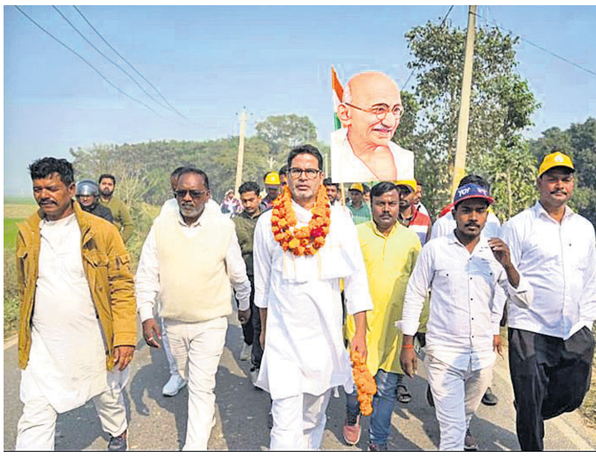
ବିହାର ଶେଠିହାରରେ ଯୋଗଦାନ କରୁଥିବା ଖାର୍ଚ୍ଚେଙ୍କ ସହିତ ବିଜେପି ଲେଡରମାନେ ।

କଂଗ୍ରେସ ଅତି ନିମ୍ନସ୍ତରର ରାଜନୀତି କରୁଥିବା ବେଳେ ଖାର୍ଚ୍ଚେ କହିଛନ୍ତି । ଖାର୍ଚ୍ଚେ କହିଛନ୍ତି ଯେ କଂଗ୍ରେସ ଗୋଟିଏ ବଡ଼ ପାର୍ଟି ନୁହେଁ । ଶକ୍ତି ଲାଭ କରିବା ପାଇଁ ୨୦୨୪ରେ ଲୋକ ସଭା ନିର୍ବାଚନ ଆମେ ଜିତିବୁ । ରାଜସ୍ଥାନର ଅଧିକାଂଶ କ୍ଷେତ୍ରରେ ଖାର୍ଚ୍ଚେ ଉପସ୍ଥିତ ରହିବେ ।