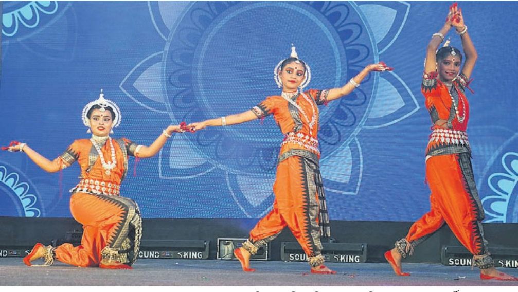
ସୋମବାର କଟକ ବାରବାଟୀ ଷ୍ଟାଡ଼ିୟମ ପରିସରସ୍ଥିତ ସେଠା ଡାକ୍ତରୀ ହାଲ୍‌ସ୍କୁଲର ବାର୍ଷିକ ଉତ୍ସବରେ ଛାତ୍ରୀମାନେ ଓଡ଼ିଶା ନୃତ୍ୟ ପରିବେଷଣ କରୁଛନ୍ତି।