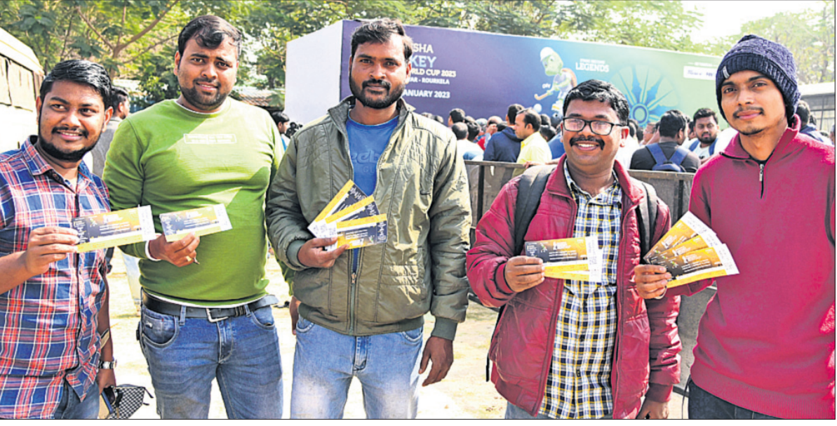
କଳିଙ୍ଗ ଷ୍ଟାଡ଼ିୟମ ନିକଟସ୍ଥ ବନ୍ଧୁ ଅଫିସରୁ ଟିକେଟ କିଣିବା ପରେ ହକିପ୍ରେମୀ ।

ଭୁବନେଶ୍ୱର, ୧୯।୧୨ (କ୍ରୀଡ଼ା ପ୍ରତିନିଧି) ଭୁବନେଶ୍ୱର ଓ ରାଉରକେଲାରେ ୨୦୨୩ ଜାନ୍ୟୁଆରୀ ୧୩ରୁ ଆରମ୍ଭ ହେବାକୁ ଯାଉଥିବା ହକି ବିଶ୍ୱକପ ପାଇଁ ସୋମବାରଠାରୁ ବନ୍ଧୁ ଅଫିସ ଟିକେଟ ବିକ୍ରି ହୋଇଛି । ଅନୁଲୋକନରେ ଉପଲବ୍ଧ ସମସ୍ତ ଟିକେଟ ବିକ୍ରି ସରିଥିବାରୁ ବନ୍ଧୁ ଅଫିସରୁ ଟିକେଟ କିଣିବା ପାଇଁ ଦର୍ଶକଙ୍କ ମଧ୍ୟରେ ଅହେତୁକ ଆଗ୍ରହ ପରିଲକ୍ଷିତ ହୋଇଛି । ଭୁବନେଶ୍ୱର କଳିଙ୍ଗ ହକି ଷ୍ଟାଡ଼ିୟମର ୮ ନମ୍ବର ଗେଟ୍‌ରେ ଟିକେଟ ପୋଲିସ ଲାଭନ୍ ଗ୍ରାଉଣ୍ଡ ପଡ଼ିଆରେ ଖୋଲାଯାଇଥିବା ବନ୍ଧୁ ଅଫିସରେ ସକାଳୁ ଦର୍ଶକଙ୍କ ଭିଡ଼ ପରିଲକ୍ଷିତ ହୋଇଥିଲା । ରାଉରକେଲାର ବିର୍ସାପୁଣ୍ଡା ହକି ଷ୍ଟାଡ଼ିୟମର ୬ ନମ୍ବର