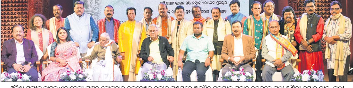
ଓଡ଼ିଶା ସଙ୍ଗୀତ ନାଟକ ଏକାଡେମୀ ପକ୍ଷରୁ ସୋମବାର ଭୁବନେଶ୍ୱର ରବୀନ୍ଦ୍ର ମଞ୍ଚପରେ ଅନୁଷ୍ଠିତ ପୁରସ୍କାର ପ୍ରଦାନ ଉତ୍ସବରେ ମନ୍ତ୍ରୀ ଅଶ୍ୱିନୀ କୁମାର ପାତ୍ର, ମନ୍ତ୍ରୀ ଗୁଣାଧରକାନ୍ତି ବେହେରା ଓ ଅନ୍ୟ ଅତିଥିଙ୍କ ଗହଣରେ ୨୦୨୧ (ଉପର) ଓ ୨୦୨୨ ବର୍ଷ ପାଇଁ ସମ୍ମାନ ଓ ପୁରସ୍କାର ପାଇଥିବା କଳାକାରମାନେ।