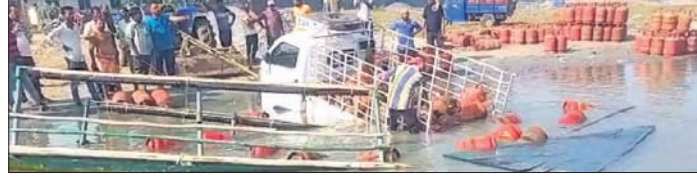
ପିକଅପ୍ ଭ୍ୟାନ ଭାରସାମ୍ୟ ହରାଇ ତଙ୍ଗାରେ ପିଟି ହେବା ପରେ ପାଣିକୁ ଖସିପଡ଼ିଛି।

ଭୁବନେଶ୍ୱର, ୧୯୧୨ (ବ୍ୟୁରୋ): ରାଜ୍ୟରେ ଶୀତଳ ପ୍ରକୋପ ବୃଦ୍ଧି ପାଇଛି। ପାରବ ତଳପୁହୁଁ ହୋଇଛି। ସର୍ବନିମ୍ନ ତାପମାତ୍ରା ୮ ଡିଗ୍ରୀ ତଳକୁ ଖସି ଯାଇଛି। ରାଜ୍ୟର ୬ଟି ସ୍ଥାନରେ ସର୍ବନିମ୍ନ ତାପମାତ୍ରା ୧୦ ଡିଗ୍ରୀ ସେଲ୍ସିୟସ୍ ତଳେ ରହିଛି। ଉତ୍ତର ପୂର୍ବ ଦିଗରୁ ରାଜ୍ୟକୁ ଥଣ୍ଡା ବାୟୁ ପ୍ରବାହିତ ହୋଇଛି। ଏହାର ପ୍ରଭାବରେ ଶୀତ ବଢ଼ିଛି। ଗତ ଦୁଇଦିନ ମଧ୍ୟରେ ସର୍ବନିମ୍ନ ତାପମାତ୍ରା ୪ରୁ ୫ ଡିଗ୍ରୀ ସେଲ୍ସିୟସ୍ ହ୍ରାସ ପାଇଛି।