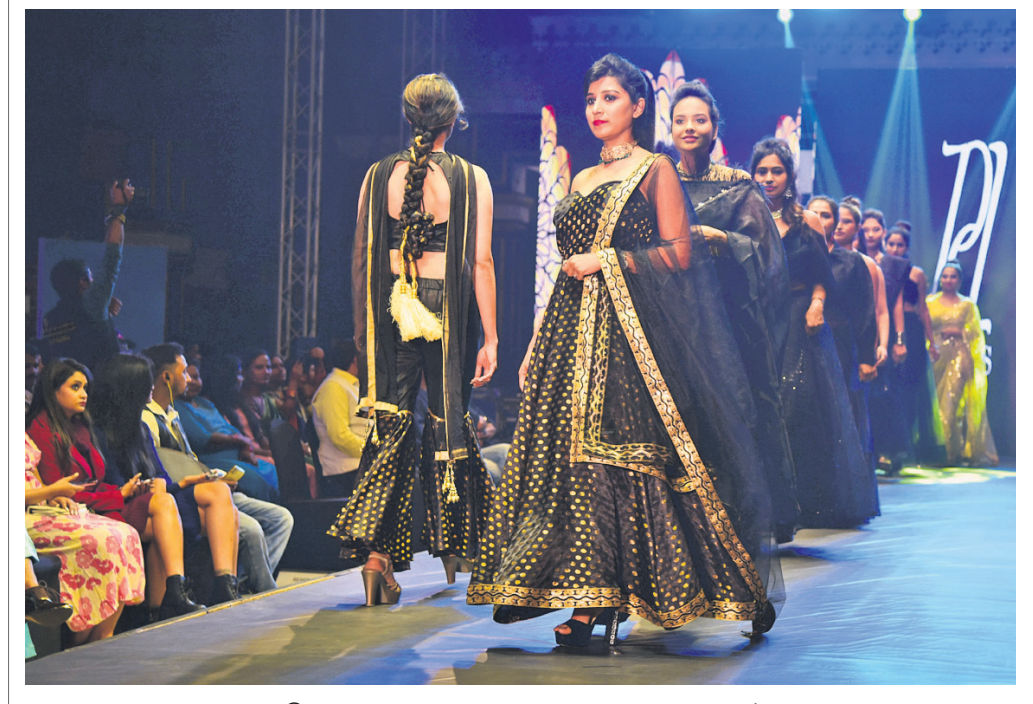
ଇଭୋସ୍ ବିଲ୍ଡିଂ ଓ ମେଗାଲ ମାଙ୍କୁ ପକ୍ଷରୁ ସୋମବାର ଭୁବନେଶ୍ୱର ମେ'ଫେୟାର ହୋଟେଲରେ ଅନୁଷ୍ଠିତ ଫ୍ୟାଶନ ଶୋ। (ଫଟୋ-ବିକାଶ)

ଅର୍ଦ୍ଧନା ସହଯୋଗ କରି ନ ଥିବା ଓ ଏହି ମାମଲାରେ କିଛି କହୁ ନ ଥିବା ଇଡି ସୂଚନା ଦେଉଥିବାରୁ ସନ୍ଦେହ ଦୂରୀଭୂତ ହୋଇଛି। ସୂଚନାଯୋଗ୍ୟ, ପ୍ରଥମ ପର୍ଯ୍ୟାୟରେ ୭ ଦିନ ଓ ଦ୍ୱିତୀୟ ପର୍ଯ୍ୟାୟରେ ୬ଦିନ ପାଇଁ ରିମାଣ୍ଡରେ ଆସି ଅର୍ଦ୍ଧନା ରୁପ୍ତ ରହିଥିଲେ। ତେଣୁ ଆଉ ୨ ଦିନ ରିମାଣ୍ଡରେ ନେଇ କିଛି ପ୍ରମାଣ ପାଇବାକୁ ଇଡି ଆଶା ରଖୁଥିଲା। ହେଲେ କୋର୍ଟ ଏହି ଆବେଦନକୁ ଖାରଜ କରିବା ପରେ ଇଡିର ଯୋଜନା ଫୋଲ୍ ମାରିଛି। ଅପରପକ୍ଷରେ ଅର୍ଦ୍ଧନାଙ୍କ ସାମାଜିକ ଜୀବନ ଚାଲିଛି। ସେ ଗତ ୧୪ ତାରିଖରୁ ରିମାଣ୍ଡରେ ଆସି ଜେରା ସମ୍ମୁଖୀନ ହେଉଛନ୍ତି। ଆଗାମୀ ବୁଧବାର ଡାକ୍ତର ରିମାଣ୍ଡ ସରିବ। ଏହି ସମୟ ମଧ୍ୟରେ ଜଗବନ୍ଧୁଙ୍କଠାରୁ ଅଧିକ ତଥ୍ୟ ହାସଲ କରିବାକୁ ଇଡି ଶେଷ ଆଶା ରଖୁଛି।