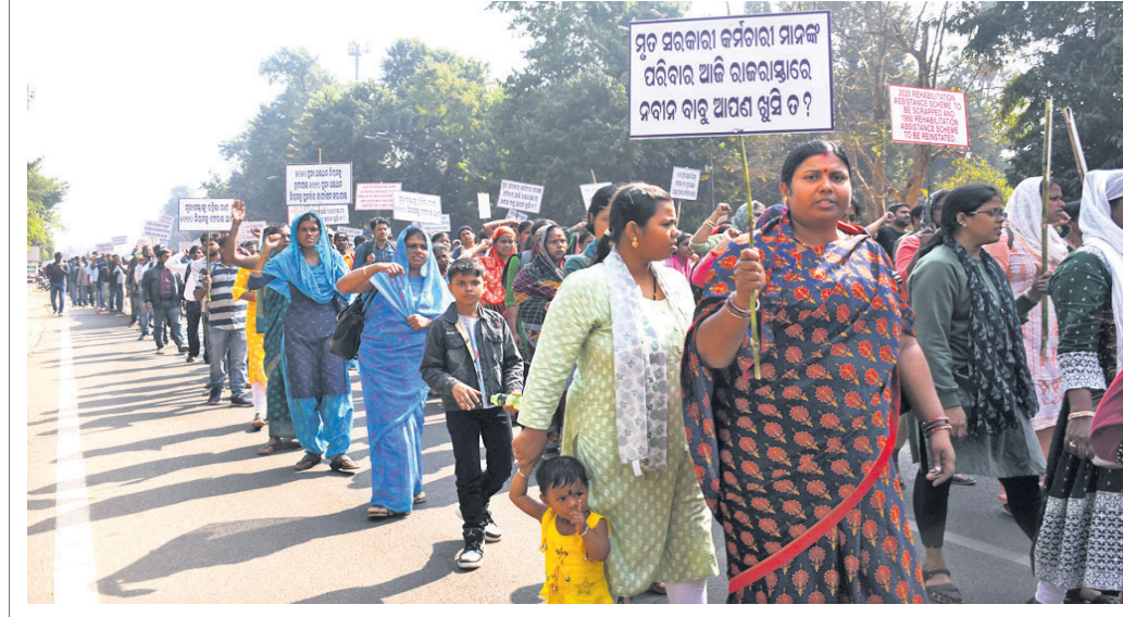
ଓଡ଼ିଶା ପୁନଃ ଅଭିଯାନ ନିୟମ ୧୯୯୦କୁ ପୁନଃ କାର୍ଯ୍ୟକାରୀ କରିବା, ମୃତ ସରକାରୀ କର୍ମଚାରୀଙ୍କ ପରିବାରର ଜଣାକୁ ନିୟୁକ୍ତି ଆଦି ବିଭିନ୍ନ ଦାବି ନେଇ ରାଜ୍ୟ କର୍ମଚାରୀ ଅଭିଯାନ ଆନ୍ଦୋଳନ ସଂଘ ପକ୍ଷରୁ ସୋମବାର ଭୁବନେଶ୍ୱର ଲୋୟର ପିଏମ୍‌ଡିରେ ବିଷୋଭ ଶୋଭାଯାତ୍ରା।

କାର୍ଯ୍ୟ କରାଯାଇଛି। ଏହି ବେଆଇନ କାର୍ଯ୍ୟକୁ ବନ୍ଦ କରିବା ପାଇଁ ଏବଂ ଆଇନ ଚିଠି କରିଥିଲେ ମଧ୍ୟ ସେଥିପ୍ରତି ଦୃଷ୍ଟି ଦିଆଯାଉ ନାହିଁ, ଯାହା ପୂର୍ଣ୍ଣାଙ୍ଗୀର ବିଷୟ। ଭୁବନେଶ୍ୱର ବେଆଇନ ନିର୍ମାଣ କାର୍ଯ୍ୟକୁ ବନ୍ଦ କରିବା ସହ ସମ୍ପୂର୍ଣ୍ଣ ଅଧିକାରୀମାନଙ୍କ ବିରୋଧରେ ଦୃଢ଼ କାର୍ଯ୍ୟାନୁଷ୍ଠାନ ଗ୍ରହଣ କରାଯିବାକୁ ବରାଳ ଦାବି କରିଛନ୍ତି। ଅନ୍ୟପକ୍ଷରେ ଏଭଳି ଅଭିଯୋଗ ନେଇ ଶ୍ରୀମନ୍ଦିର ପ୍ରଶାସନ କିମ୍ବା ଓସିସି ପକ୍ଷରୁ କୌଣସି ପ୍ରତିକ୍ରିୟା ମିଳିପାରିନାହିଁ।