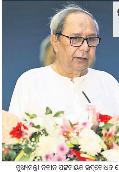
ମୁଖ୍ୟମନ୍ତ୍ରୀ ନବୀନ ପଟ୍ଟନାୟକ ଉଦ୍‌ଘୋଷଣା କରୁଛନ୍ତି।