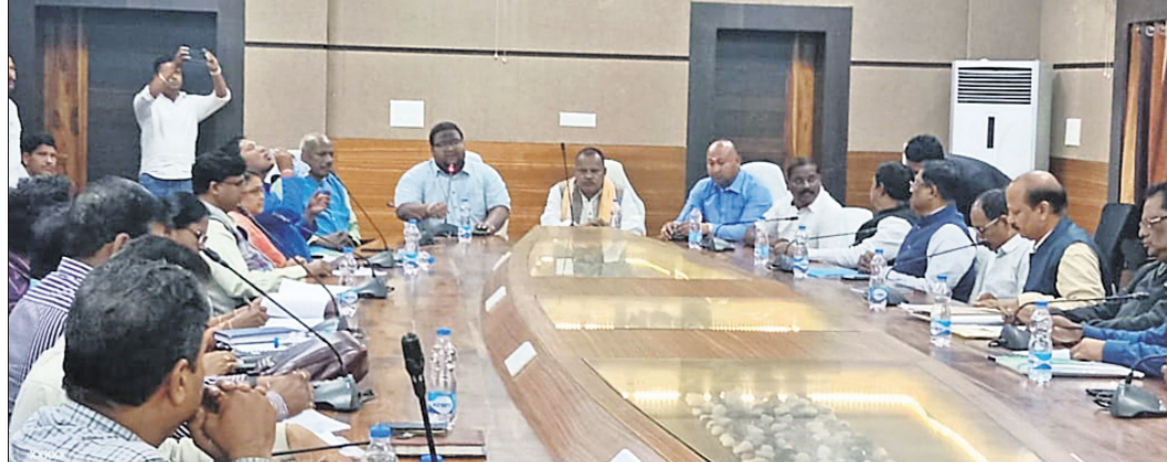
ବୈଠକରେ ଜନପ୍ରତିନିଧିମାନଙ୍କ ସହ ଅଧିକାରୀମାନେ।

ଆସନ୍ତା ଜାନୁୟାରୀ ୧୦ରୁ ୧୩ ତାରିଖ ପର୍ଯ୍ୟନ୍ତ ଏହି ମେଳା ଅନୁଗୋଳ ବିଜୁ ମଲହାରୀରେ ଅନୁଷ୍ଠିତ ହେବ। ଏହି ମେଳାରେ ବିଭିନ୍ନ ନିର୍ମାଣ ଓ ଯୋଗାଣକାରୀ ବ୍ୟସ୍ତା ଯୋଗଦେବେ। ମେଳା ସ୍ଥାନରେ କୃଷକମାନେ ଓଡ଼ିଶା ଲାଇଭଲିହୁଡ୍ ମିଶନରେ ବିଭିନ୍ନ ସର୍ବିସ ପାଇବା ନିମନ୍ତେ ଆବେଦନ କରିପାରିବେ। ପୁଞ୍ଜିମାତ୍ରୀ କୃଷି ଉଦ୍ୟୋଗୀ ଯୋଜନାରେ ୪ଜଣ ହିତାଧିକାରୀଙ୍କୁ ଗୋ