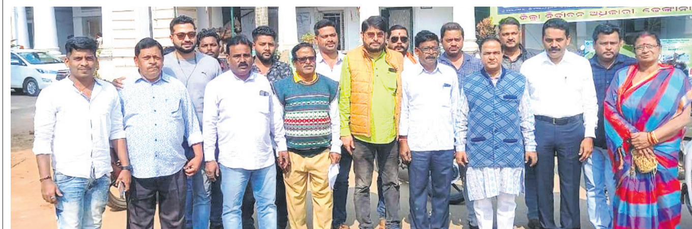
ଦେଢ଼ାମାଲରେ ଭାଜପା ନେତୃତ୍ୱ ଜିଲ୍ଲାପାଳଙ୍କୁ ସ୍ମାରକପତ୍ର ପ୍ରଦାନ କରି ଫେରୁଛନ୍ତି।