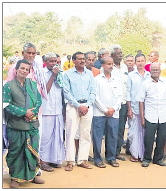
ସମ୍ମିଳନୀରେ ଯୋଗଦେଇଥିବା କେଜେ ମା' ଓ କେଜେ ବାପା ମାନେ।