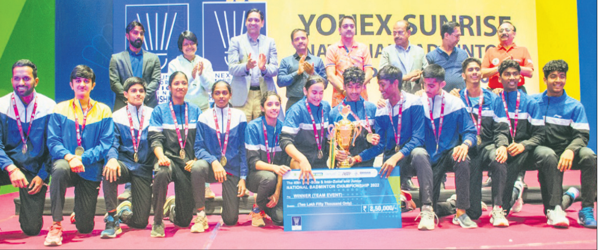
ଜାତୀୟ ଜୁନିୟର ବ୍ୟାଡ୍‌ମିଣ୍ଟନ ଚାମ୍ପିୟନଶିପ୍‌ରେ ଦକ୍ଷିଣ ପ୍ରତିଯୋଗିତା ତାମିଲନାଡୁ ଦଳ ଅତିଥିକ ଗହଣରେ।