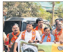
ଭୁବନେଶ୍ୱର ଉପଜିଲ୍ଲାପାଳଙ୍କ ଦାବିପତ୍ର ଦେବାକୁ ଯାଉଥିବା ଭାଜପା ନେତା ଓ କର୍ମୀ।

ଭାବେ ଉକ୍ତ କଥା ସେମାନେ କହିଛନ୍ତି। ତେଣୁ ସେମାନଙ୍କ ବିରୋଧରେ ଶୁଖିଲାକାଗଜ କାର୍ଯ୍ୟାନୁଷ୍ଠାନ ନିଆଯିବ ବୋଲି କିଶୋର କହିଛନ୍ତି।