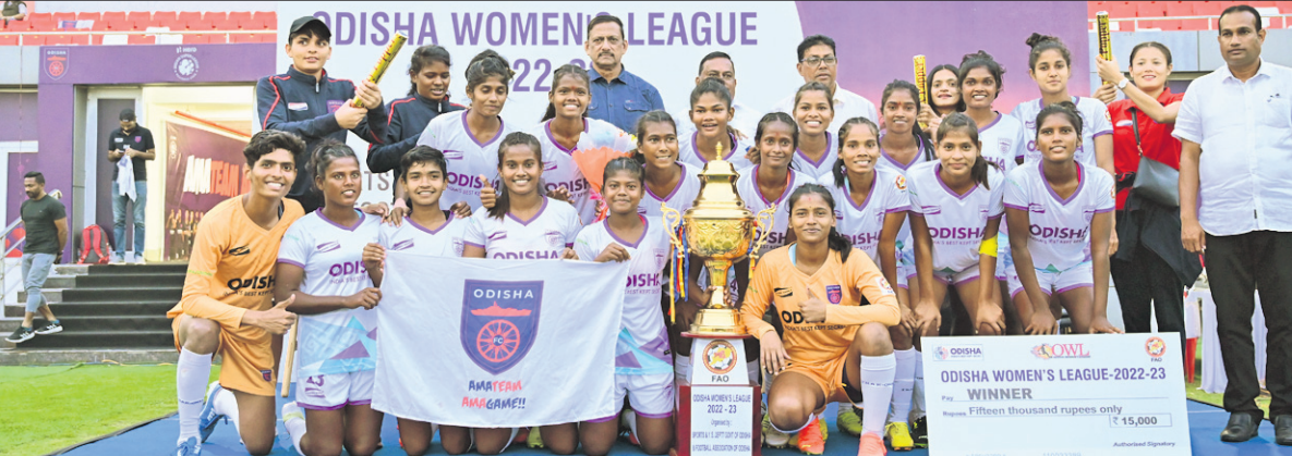
ଅତିଥିକଠାରୁ ଟ୍ରଫି ଗ୍ରହଣ ଅବସରରେ ଓଡ଼ିଶା ଓମେନ୍ସ ଲିଗ୍ ଚାମ୍ପିୟନ ଓଡ଼ିଶା ଏସ୍‌ସି ଦଳର ଖେଳାଳିମାନେ।