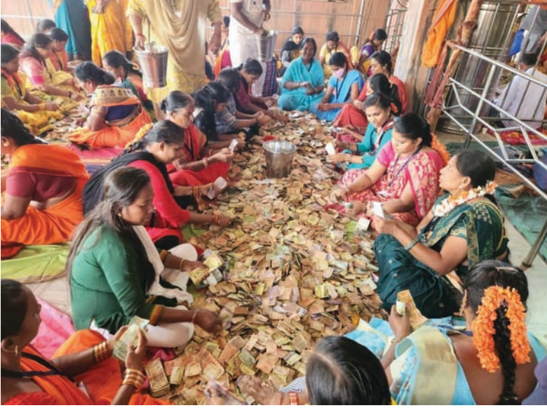
ସେଇସେବାମାନେ ଦାନଟଙ୍କା ଗଣତି କରୁଛନ୍ତି ।

ରାୟଗଡ଼ା ଜିଲାର ଅଧିଷ୍ଠାତ୍ରୀ ଦେବୀ ମାଁ ମଝିଘରିଆଣୀଙ୍କ ମନ୍ଦିର ହୁଣ୍ଡିରୁ ଗୁଧବାର ଖୋଲାଯାଇଛି । ଚଳିତ ବର୍ଷ ଚେନ୍ଦ୍ରଯାତ୍ରା ପୂର୍ବରୁ ମାଁଙ୍କ ହୁଣ୍ଡି ଖୋଲାଯିବାର ନିୟମ ରହିଥିବା ବେଳେ ସେହି କ୍ରମରେ ଖୋଲି ଗଣତି କରାଯାଇଥିଲା । ହୁଣ୍ଡିରୁ ମୋଟ ୬୨ ଲକ୍ଷ ୨୨ ହଜାର ୫୯ ଟଙ୍କା ବାହାରିଛି । ସେହିପରି ୪୬ ଗ୍ରାମ ସୁନା, ୧୭୬୫ ଗ୍ରାମ ରୂପା ସମେତ ଆମେରିକା, ଅଷ୍ଟ୍ରେଲିଆ, ଆଫ୍ରିକା ଦେଶର ୪୮ଟି ମୁଦ୍ରା ମଧ୍ୟ ହୁଣ୍ଡିରୁ ବାହାରିଛି । ସକାଳେ ମାଲିଶ୍ଵେତ ଏବଂ ପୋଲିସ ଉପସ୍ଥିତରେ ମନ୍ଦିର ପରିଚାଳନା କମିଟି ପକ୍ଷରୁ ହୁଣ୍ଡି ଖୋଲାଯାଇ ଗଣତି ଆରମ୍ଭ ହୋଇଥିଲା । ୮ ଘଣ୍ଟା ଧରି ଗଣତି ହୋଇଥିଲା । ଏଥିପୂର୍ବରୁ ଅଗଷ୍ଟ ୨୪ରେ ଦଶହରା ପୂର୍ବରୁ ମନ୍ଦିର ହୁଣ୍ଡି ଖୋଲାଯାଇଥିଲା । ସେହି ସମୟରେ ହୁଣ୍ଡିରୁ ୧ କୋଟି ୧ ଲକ୍ଷ ୨୩ ହଜାର ଟଙ୍କା ସମେତ ୧୦୪ ଗ୍ରାମ ସୁନା, ୨୬୭୦ ଗ୍ରାମ ରୂପା ବାହାରିଥିଲା । ବିଭିନ୍ନ ଅଞ୍ଚଳରୁ ଆସୁଥିବା ମାଁଙ୍କ ଶ୍ରଦ୍ଧାଳୁ ପ୍ରତ୍ୟେକ