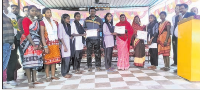
ଛାତ୍ରାଛାତ୍ରୀଙ୍କୁ ପୁରସ୍କାର, ମାନପତ୍ର ପ୍ରଦାନ କରାଯାଇଛି।