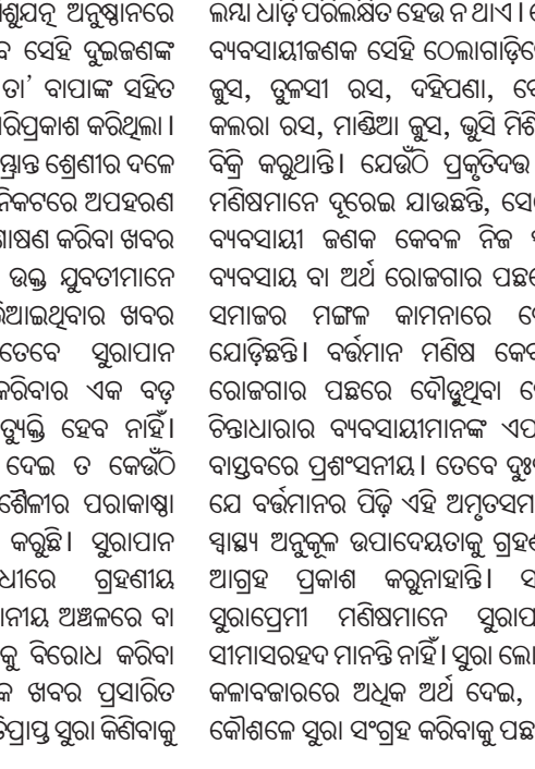
ଲକ୍ଷ୍ୟ ଧାଡ଼ି ପରିଲକ୍ଷିତ ହେଉ ନ ଥାଏ । ତେବେ ଉକ୍ତ ବ୍ୟବସାୟୀଜଣକ ସେହି ଠେଲାଗାଡ଼ିରେ ଭୁଲ୍ଲିଲ୍ଲି ଲୁସ, ଲୁଲୁସୀ ରସ, ଦହିପଣା, ବେଲ ପଣା, କଲଗା ରସ, ମାଞ୍ଜିଆ ଲୁସ, ଭୁସି ମିଶିରି ଇତ୍ୟାଦି ବିକ୍ରି କରୁଥାନ୍ତି । ଯେଉଁଠି ପ୍ରକୃତିଦତ୍ତ ଦ୍ରବ୍ୟଠାରୁ ମଣିଷମାନେ ଦୂରେଇ ଯାଉଛନ୍ତି, ସେଠାରେ ଏହି ବ୍ୟବସାୟୀ ଜଣକ କେବଳ ନିଜ ସ୍ୱାର୍ଥକ୍ଷେତ୍ର ବ୍ୟବସାୟ ବା ଅର୍ଥ ରୋଜଗାର ପଛରେ ନ ପଡ଼ି ସମାଜର ମଙ୍ଗଳ କାମନାରେ ରୋଜଗାରକୁ ଯୋଡ଼ିଛନ୍ତି । ବର୍ତ୍ତମାନ ମଣିଷ କେବଳ ଅଧିକ ରୋଜଗାର ପଛରେ ବୋଧହୁଏ ବେଳେ ଏହି ଚିନ୍ତାଧାରାର ବ୍ୟବସାୟୀମାନଙ୍କ ଏପରି ପ୍ରୟାସ ବାସ୍ତବରେ ପ୍ରଶଂସନୀୟ । ତେବେ ଦୁଃଖର ବିଷୟ ଯେ ବର୍ତ୍ତମାନର ପିଢ଼ି ଏହି ଅନୁତସମ ପାନୀୟର ସାମ୍ବ୍ୟ ଅନୁକୂଳ ଉପଦେୟତାକୁ ଗ୍ରହଣ କରିବାକୁ ଆଗ୍ରହ ପ୍ରକାଶ କରୁନାହାନ୍ତି । ସାଧାରଣତଃ ପୁରୀପ୍ରୋମା ମଣିଷମାନେ ସୁରାପାନ ପାଇଁ ସାମାସରସ୍ୱ ମାନନ୍ତି ନାହିଁ । ସୁରା ଲୋଡ଼ା ପଡ଼ିଲେ କଳାବଜାରରେ ଅଧିକ ଅର୍ଥ ଦେଇ, କଳେବଳେ କୌଣସିକ ସୁରା ସଂଗ୍ରହ କରିବାକୁ ପଛୁଛନ୍ତି । ଦିଅନ୍ତି