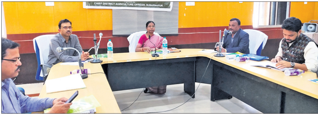
ଜିଲ୍ଲାସ୍ତରୀୟ କୃଷି କୌଶଳ ନିର୍ଦ୍ଧାରଣ କମିଟି ବୈଠକରେ ମହାଧିକାରୀ ଅତିଥି କୁ।