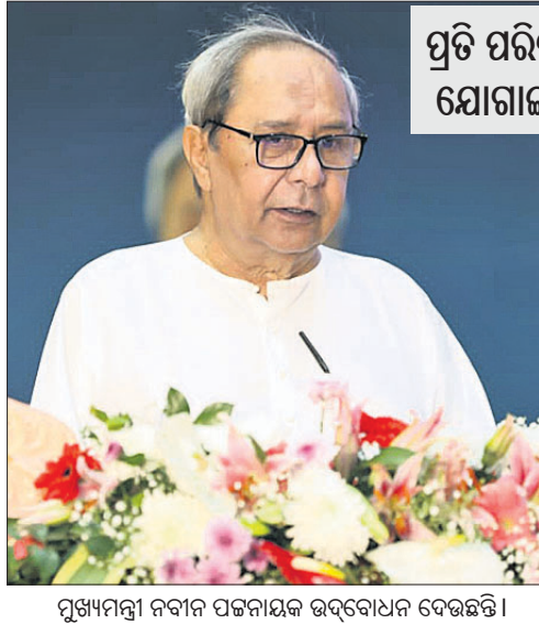
ପ୍ରତି ପରିବାରକୁ ଭଲ ପିଇବା ପାଣି ଯୋଗାଇବା ପ୍ରାଥମିକତା: ନବୀନ