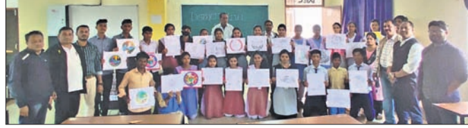
ଲୋଗୋ ପ୍ରତିଯୋଗିତାରେ ଅଂଶଗ୍ରହଣ କରିଥିବା ଛାତ୍ରାଛାତ୍ରୀ।

'ଉତ୍ସବ ପ୍ରଧାନପାଟ' ନିମନ୍ତେ ଦେବଗଡ଼ ଜିଲ୍ଲା ସଂସ୍କୃତି ପରିଷଦ ପକ୍ଷରୁ ସ୍ଥାନୀୟ ମଡେଲ ଡ୍ରାମା କଲେଜଠାରେ ବୁଧବାର ଏକ ଲୋଗୋ ପ୍ରତିଯୋଗିତା ଅନୁଷ୍ଠିତ ହୋଇଯାଇଛି। ଏଥିରେ ଜିଲ୍ଲାର ବିଭିନ୍ନ ବିଦ୍ୟାଳୟ, ମହାବିଦ୍ୟାଳୟରୁ ମନୋନୀତ ହୋଇ ୬୦ ଛାତ୍ରାଛାତ୍ରୀ ଜିଲ୍ଲାସ୍ତରରେ ଅଂଶଗ୍ରହଣ କରିଥିଲେ। ଏଥିରୁ ଶ୍ରେଷ୍ଠ ବିବେଚିତ ପ୍ରତିଯୋଗୀଙ୍କୁ ପୁରସ୍କୃତ କରାଯିବା ସହ ଲୋଗୋକୁ ଆଗାମୀ