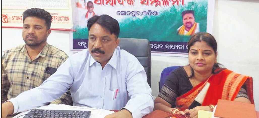
ଖବରଦାତା ସମ୍ମିଳନୀରେ ଜନସଂଖ୍ୟା ସମାଧାନ ପାଇଁ ଉଦ୍ଦେଶ୍ୟ ସୁବର୍ଣ୍ଣପୁର ଜିଲ୍ଲା ଶାଖା କର୍ମଚାରୀମାନେ ସୂଚନା ଦେଇଛନ୍ତି।