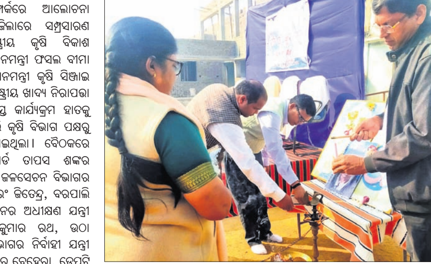
ଗାୟତ୍ରୀ ଆବିଷ୍କରଣ ଶିକ୍ଷା ନିକେତନରେ ଅନୁଷ୍ଠିତ ବିଜ୍ଞାନ ମେଳାରେ ଅତିଥି।

ଜମିରେ ଗହମ ଓ ୩୦ ହେକ୍ଟର ଜମିରେ ଆଖୁ ଚାଷ କରାଯିବାର ଲକ୍ଷ୍ୟ ରଖାଯାଇଛି। ଚଳିତ ରବିରେ ୬୦,୦୦୩ ହେକ୍ଟର ଜମିକୁ ବୃହତ୍, କ୍ଷୁଦ୍ର, ମଧ୍ୟମ, ବୃହତ୍ ଉଠା ଜଳସେଚନ, ଉଠାଜଳସେଚନ, ଡାମ୍ ଓ ଅନ୍ୟାନ୍ୟ ଉତ୍ତରୁ ଜଳଯୋଗାଣ କରାଯିବ ବୋଲି ଜଳସେଚନ ବିଭାଗ ଜମିରେ ଟେକବାଜ, ୧୨, ୪୨୯ ହେକ୍ଟର ଜମିରେ ପନିପରିବା, ୩,୫୬୨ ହେକ୍ଟର ଜମିରେ ମସଲାଜାତୀୟ ଓ ୨୪ ହେକ୍ଟର ଜମିରେ ଆଖୁଚାଷ ହୋଇଥିଲା। ଚଳିତ ରବିରେ ୩୫ ହଜାର ୧୮୦ ହେକ୍ଟର ଜମିରେ ତାଳି ଜାତୀୟ, ୬ ହଜାର ୬୨୦ ହେକ୍ଟର ଜମିରେ ଟେକବାଜ, ୨୦,୬୭୦ ହେକ୍ଟର ଜମିରେ ପନିପରିବା, ୨,୬୮୦ ହେକ୍ଟର ଜମିରେ ମସଲା