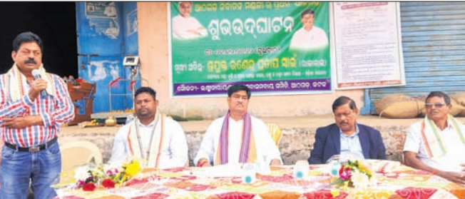
ମଣ୍ଡି ଉଦ୍ଘାଟନ ଉତ୍ସବରେ ମନ୍ତ୍ରୀ ରଣେନ୍ଦ୍ର ପ୍ରତାପ ସାହୁ ଓ ଅନ୍ୟମାନେ।