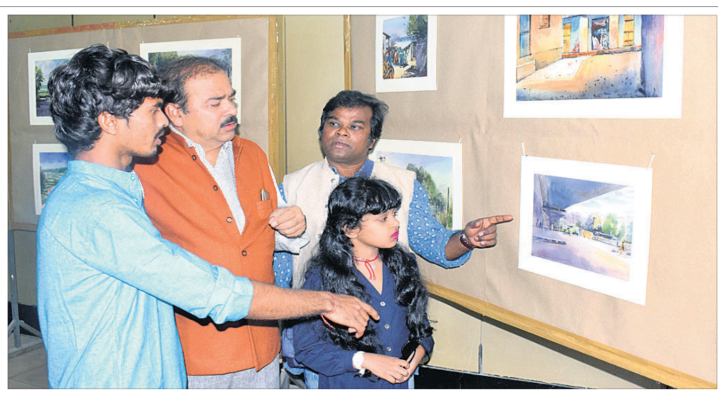
ଗୁରୁବର ଅନୁଷ୍ଠାନ ପକ୍ଷରୁ ଭୁବନେଶ୍ୱର ସୂଚନା ଭବନରେ ରୁଧିବାର ଅନୁଷ୍ଠିତ ଚିତ୍ରରଞ୍ଜନ ମହାତ୍ତ୍ୱ ଏକକ ଚିତ୍ରକଳା ପ୍ରଦର୍ଶନୀକୁ ଲୋକେ ଦୂଳି ଦେଖୁଛନ୍ତି ।

ଆପଣମାନେ ପରିବାର ସଦସ୍ୟ, ସାଙ୍ଗ କିମ୍ବା ସମ୍ପର୍କୀୟଙ୍କ ଗହଣରେ ଉଠାଇଥିବା ସେଲ୍ଫିକୁ ପଠାଇବା ସମୟରେ ନିଜର ନାମ ଏବଂ ମୋବାଇଲ ନମ୍ବର ଦେବାକୁ ଭୁଲନ୍ତୁ ନାହିଁ । ଯୋଗ୍ୟ ବିବେଚିତ ଫଟୋ ପ୍ରକାଶ ପାଇବ ।