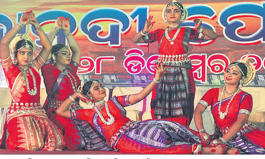
ମହାନଦୀ ଫେଷ୍ଟିଭାଲରେ କଳାକାରମାନେ ଓଡ଼ିଶା ନୃତ୍ୟ ପରିବେଷଣ କରୁଛନ୍ତି।