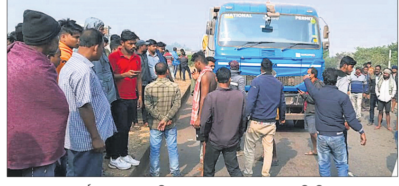
ଦୁର୍ଘଟଣା ପରେ ଉତ୍ତରାଧିକାରୀ ଲୋକମାନେ ରାସ୍ତା ଅବରୋଧ କରିଛନ୍ତି।

ଭୁବନେଶ୍ୱର, ୨୧.୧୨.୨୨(ସ.ପ୍ର.) କେନ୍ଦ୍ରାପଡ଼ା ଜିଲ୍ଲା ଭେରାବିଶି ଆନା ଅଧୀନ ୫୩ ନଂ.(କ) ଜାତୀୟ ରାଜପଥରେ ଗାଡ଼ି ଯାଅ ସମୟରେ ଏକ ଅଭାବନା ଘଟଣା ଘଟିଛି। ଏହି ଯାଅରେ ନିୟୋଜିତ ଜଣେ ହୋମଗାର୍ଡଙ୍କ ଉପରକୁ ଏକ ପିକଅପ୍ ଭ୍ୟାନ୍ ମାଡ଼ି ଯିବାରୁ ତାଙ୍କର ଘଟଣାସ୍ଥଳରେ ମୃତ୍ୟୁ ଘଟିଛି। ଏହାରୁ ନେଇ ଉତ୍ତରାଧିକାରୀ ପ୍ରକାଶ ପାଇଥିଲା। ଗୁମାସ୍ତା ଲୋକେ ଜାତୀୟ ରାଜପଥକୁ ପ୍ରାୟ ୩ ଘଣ୍ଟା ଅବରୋଧ କରିବାରୁ ରାସ୍ତାର ଦୁଇପାର୍ଶ୍ୱରେ ଶତାଧିକ ଗାଡ଼ି ଅଟକି ରହିଥିଲା। ଶେଷରେ ପୋଲିସ୍ ଘଟଣାସ୍ଥଳରେ ପହଞ୍ଚି ପିକଅପ୍ ଭ୍ୟାନ୍ ଆଧିକାରୀଙ୍କୁ ଆକ୍ରମଣ କରିଥିଲା। ସୂଚନା ଅନୁଯାୟୀ, ଦୁଆହାଟଠାରେ ରୁସ୍ତାବାର ଭୋରୁ କେନ୍ଦ୍ରାପଡ଼ା ଆଞ୍ଚଳିକ ପରିବହନ ଅଧିକାରୀଙ୍କ ଦ୍ୱାରା ଉଭୟ ଲୋଡ଼ି ଟ୍ରକ୍ ସମେତ ଅନ୍ୟ ଯାନବାହନ ଯାଅ ଚାଲିଥିଲା। ରୁସ୍ତାବାର