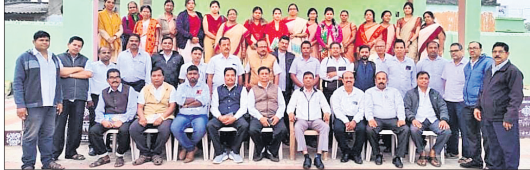
ତାଲିଖ ଶିବିରରେ ପ୍ରଶିକ୍ଷକଙ୍କ ଗହଣରେ ପ୍ରଶିକ୍ଷାଆମାନେ।