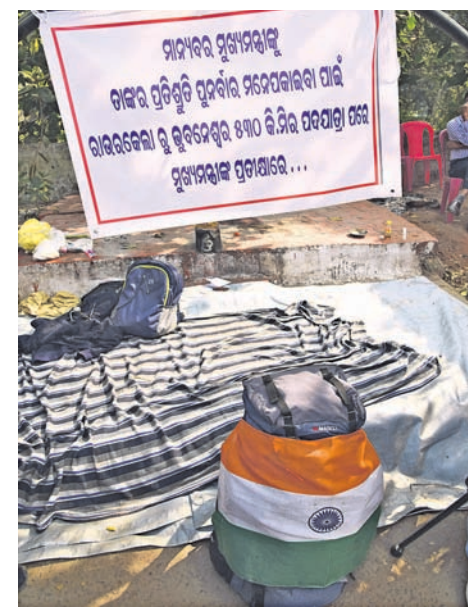
ଶିଶୁ ଭବନ ଛକସ୍ଥିତ ପୁଲିକାନ୍ତଙ୍କ ଧାରଣାସ୍ଥଳ ।

ଶିଶୁଭବନ ଛକ ସବୁଠୁ ଗୁରୁତ୍ୱପୂର୍ଣ୍ଣ ସ୍ଥାନ ହୋଇଥିବା ବେଳେ ଅଧିକାଂଶ ସମୟ ଲୋକେ ଆନ୍ଦୋଳନ କରିଥାନ୍ତି । ପୁଲିକାନ୍ତ ମଧ୍ୟ ସେଠାରେ ୭ ଦିନ ଧରି ଧାରଣାରେ ବସିଥିଲେ । ଉକ୍ତ ସ୍ଥାନରେ ଏକ ପୋଲିସ ଏଡ ପୋଷ୍ଟ ମଧ୍ୟ ରହିଛି । ବୁଧବାର କିଛି ପୋଲିସ କର୍ମଚାରୀ ମଧ୍ୟ ଉପସ୍ଥିତ ଥିଲେ । ହେଲେ ପୁଲିକାନ୍ତ ଗାଧେରବାକୁ ଯାଇ ହୋର୍ଟି ଉପରେ ଚଢିଯାଇଥିଲେ ମଧ୍ୟ ଉପସ୍ଥିତ ଥିବା ପୋଲିସ କର୍ମଚାରୀଙ୍କ ଧ୍ୟାନ ନପଡିବା ବଡ ଆଶ୍ଚର୍ଯ୍ୟ ଲାଗୁଛି । ତେଣୁ ପୋଲିସ କର୍ମଚାରୀଙ୍କ କର୍ତ୍ତବ୍ୟରେ ଅବହେଳା ଯୋଗୁ ପୁଲିକାନ୍ତ ଚଢିବାକୁ ସମୟ ପାଇଥିବା ସ୍ଥାନୀୟ ଲୋକେ ଅଭିଯୋଗ କରିଛନ୍ତି ।