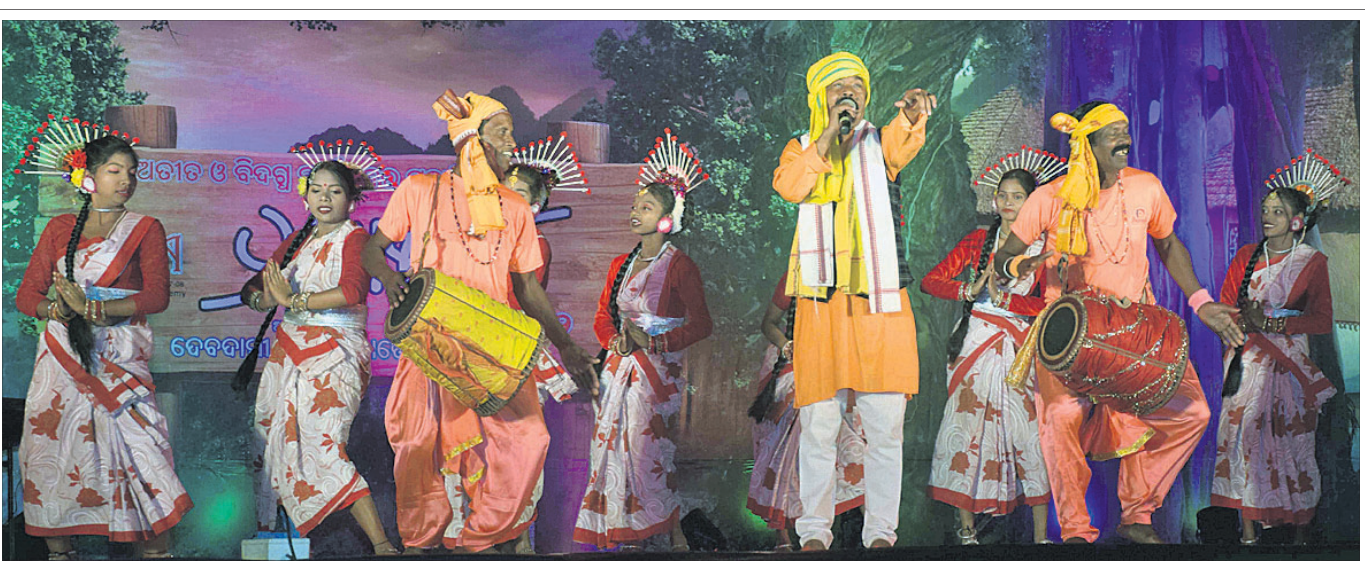
କଟକ ବାଲିଆପାଠ ଉପର ପଟିଆରେ ଦେବଦାସୀ ଡ୍ୟାନ୍ସ ଏକତ୍ରେନୀ ପକ୍ଷରୁ ରୁଧିବାର ଅନୁଷ୍ଠିତ ପ୍ରତ୍ୟାବର୍ତ୍ତନ-୨୦୧୨ କାର୍ଯ୍ୟକ୍ରମରେ ସ୍ଥୁମ୍ଭର କଳାକାରମାନେ ନୃତ୍ୟ ପରିବେଷଣ କରୁଛନ୍ତି ।