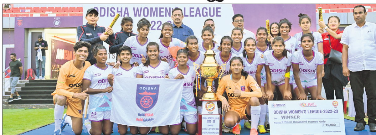
ଅତିଥିକଠାରୁ ଟ୍ରଫି ଗ୍ରହଣ ଅବସରରେ ଓଡ଼ିଶା ଓମେନ୍ସ ଲିଗ୍ ଚାମ୍ପିୟନ ଓଡ଼ିଶା ଏଫସି ଦଳର ଖେଳାଳିମାନେ।