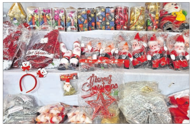
କଟକ ଅଫିସ, ୨୧୧୨୨

ଆସନ୍ତା ୨୫ ତାରିଖରେ ବଡ଼ଦିନ। ହାତରେ ଆଉ ମାତ୍ର କେଜିଟା ଦିନ। ଏହିଦିନ ପ୍ରକୃତ ସିନ୍ଧୁଗ୍ରୀଷ୍ମକ ଧରାବତରଣ ଉତ୍ସବ ପାଳନ ନେଇ ଖ୍ରୀଷ୍ଟ ଧର୍ମାବଲମ୍ବୀମାନଙ୍କ ମଧ୍ୟରେ ଚପ୍ପରତା ପ୍ରକାଶ ପାଇଛି। ଲୋକମାନେ ବଡ଼ଦିନକୁ ଜାକଜମକରେ ପାଳନ କରିବା ଲାଗି ଏବେଠୁ ଯୋଜନା ପ୍ରସ୍ତୁତ କରିସାରିଲେଣି। ବଜାରରେ ବଡ଼ଦିନର ସାମଗ୍ରୀ ଉପଲବ୍ଧ ହେଲାଣି। ମିଶନ ରୋଡ୍, ବକ୍ସିବଜାର, ଚଣ୍ଡା ଛକ, କଲେଜ ଛକ ସମେତ ସହରର ବିଭିନ୍ନ ଅଞ୍ଚଳରେ ବଡ଼ଦିନ ପାଇଁ ସ୍ୱତନ୍ତ୍ର ଷ୍ଟଲ୍ ଖୋଲାଯାଇଛି। ବ୍ୟବସାୟମାନେ ବଡ଼ଦିନର ଆବଶ୍ୟକତାକୁ ଦୃଷ୍ଟିରେ ରଖି କର୍ମ ମୂଲ୍ୟକୁ ଆରମ୍ଭ କରି ଦାମିକା