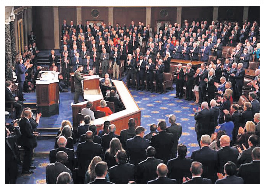
ଆମେରିକା କଂଗ୍ରେସର ମିଳିତ ବୈଠକରେ ଯୁକ୍ତେନ୍ଦ୍ର ରାଷ୍ଟ୍ରପତି ଭୋଲୋଡ଼ିମିର ଜେଲେନ୍ସ୍କିଙ୍କୁ ସ୍ଵାଖି ଓବେଶନ୍ ଦିଆଯାଇଛି।

ସାମା ବିବାଦ ସୃଷ୍ଟି ହୁଏ, ତେବେ ଏହାର ସୁରକ୍ଷା ଲାଗି ଦଳଗତ ନିର୍ଦ୍ଦେଶରେ ସାମାଧାନିକ ଓ ଆଇନଗତ ପଦକ୍ଷେପ ନିଆଯିବ ବୋଲି ବିଧାନସଭାରେ ସଂକଳ୍ପ କରାଯାଇଛି। ଏହା ପୃଷ୍ଠାମନ୍ତ୍ରୀ ବାସବରାଜ ବୋମାଳ ପ୍ରସାଦ ଆଣ୍ଡ୍‌ସୋଭେକେ ଧ୍ଵନିତରେ ଏହା ଗୃହୀତ ହୋଇଥିଲା। ମହାରାଷ୍ଟ୍ର ବାବା ସାମାରେ ବିବାଦ ସୃଷ୍ଟି କରାଯାଉଥିବାରୁ ଏହାକୁ ନିନ୍ଦା କରାଯାଇଛି। କର୍ମାଚକର ଭୂମି, ଜଳ, ଭାଷା ଏବଂ କନଟମାନଙ୍କ ସ୍ଵାର୍ଥ ସହ କଦାବି ସାଲିସ କରାଯିବ ନାହିଁ ବୋଲି ପ୍ରସ୍ତାବରେ ଉଲ୍ଲେଖ ରହିଛି। ଯଦି ରାଜ୍ୟ ଓ ରାଜ୍ୟବାସୀଙ୍କ ସ୍ଵାର୍ଥରେ ବାଧା