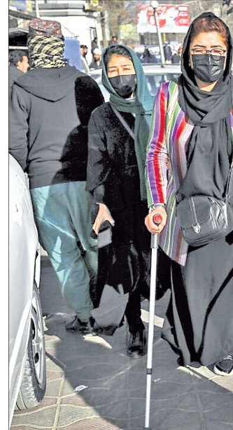
ଔପାନିକ ଉଚ୍ଚଶିକ୍ଷା ନିଷେଧ ବିରୋଧରେ କାବୁଲରେ ବିକ୍ଷୋଭ କରୁଥିବା ଛାତ୍ରୀ।

ପରବର୍ତ୍ତୀ ସମୟରେ ବିକ୍ଷୋଭର ଛାତ୍ରୀଙ୍କୁ ମହିଳା ପୋଲିସ ଗିରଫ କରିନେଇଥିଲା। ଗୁରୁବାର ଶତାଧିକ ହିଜାବିଆ ଛାତ୍ରୀ ଘଣ୍ଟା ଘଣ୍ଟା ଧରି ଯୁନିଭର୍ସିଟି ଫାଟକ ଆଗରେ ଛିଡ଼ାହୋଇ ରହିଥିଲେ। ପୁରୁଷା ଗାଡ଼ି ସେମାନଙ୍କୁ ଯୁନିଭର୍ସିଟି ପରିସର ମଧ୍ୟକୁ ପ୍ରବେଶ ଅନୁମତି ଦେଇ ନ ଥିଲେ। ପରେ ଛାତ୍ରୀମାନେ ଫେସ୍‌ବୁକ୍ ଓ ଟୁଇଟରରେ କରୁଥିବା ଏହା ବିରୋଧରେ ପ୍ରତିବାଦ ଆରମ୍ଭ କରିଥିଲେ। ଏକ ଶ୍ରେଣୀଗୃହରେ