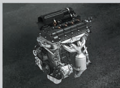
1.2L VVT Petrol Engine