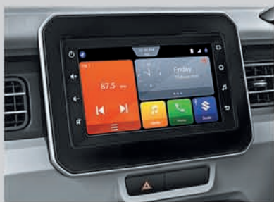
17.78 cm Smartplay Studio (Available from Zeta variant onwards)