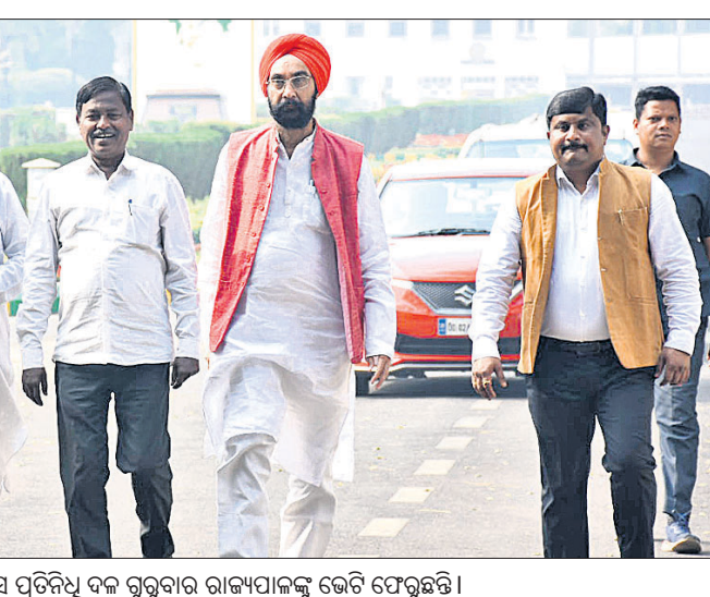
କଂଗ୍ରେସ ପ୍ରତିନିଧି ଦଳ ଗୁରୁବାର ରାଜ୍ୟପାଳଙ୍କୁ ଭେଟି ଫେରୁଛନ୍ତି।