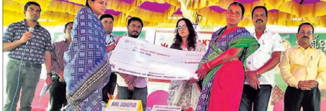
ଜିଲ୍ଲାପାଳ ହରତଖୋଲ ଗାଁର ଜୟ ଶ୍ରୀମାର ଏସଏଚ୍‌ଜିଙ୍କୁ ୫ ଲକ୍ଷ ଚକ୍ରା ରଣ ପ୍ରଦାନ କରୁଛନ୍ତି।