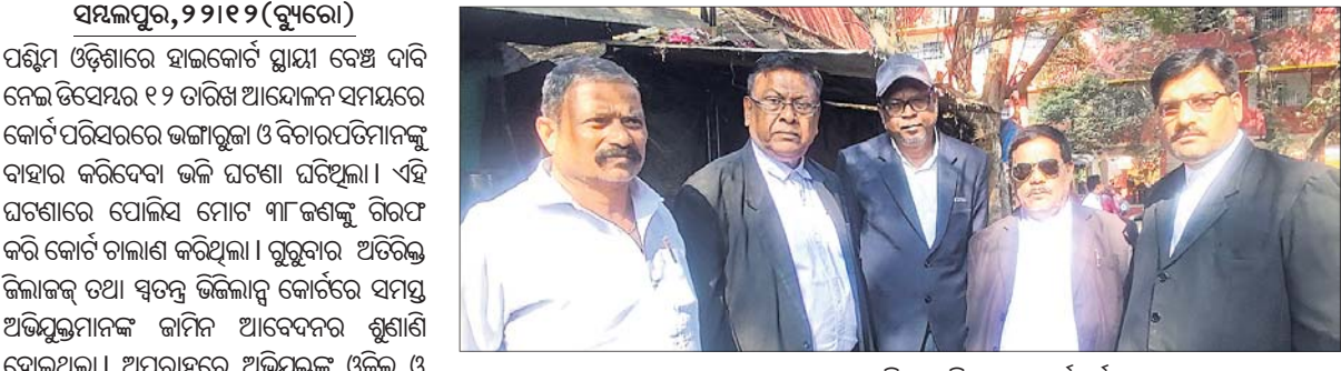
ସମଲପୁରରେ ବରଗଡ଼ ଜିଲ୍ଲା ଓକିଲସଂଘ କର୍ମକର୍ମା।

ସମଲପୁର, ୨୨।୧୨ (ବ୍ୟବହାର) ପଶ୍ଚିମ ଓଡ଼ିଶାରେ ହାଇକୋର୍ଟ ଘୋଷା ଦେଖି ଦାବି ନେଇ ଡିସେମ୍ବର ୧୨ ତାରିଖ ଆନ୍ଦୋଳନ ସମୟରେ କୋର୍ଟ ପରିସରରେ ଭଙ୍ଗାଚୁରା ଓ ବିଚାରପତିମାନଙ୍କୁ ବାହାର କରିଦେବା ଭଳି ଘଟଣା ଘଟିଥିଲା। ଏହି ଘଟଣାରେ ପୋଲିସ୍ ମୋଟ ୩୮ ଜଣଙ୍କୁ ଗିରଫ କରି କୋର୍ଟ ଚାଲାଣ କରିଥିଲା। ଗୁରୁତାର ଅତିରିକ୍ତ ଜିଲ୍ଲାଜଜ୍ ତଥା ସ୍ୱତନ୍ତ୍ର ଜିଲ୍ଲାମାଜିଷ୍ଟ୍ରେଟ୍ କୋର୍ଟରେ ସମସ୍ତ ଅଭିଯୁକ୍ତମାନଙ୍କ ଜାମିନ ଆବେଦନର ଶୁଣାଣି ହୋଇଥିଲା। ଅପରାହ୍ଣରେ ଅଭିଯୁକ୍ତଙ୍କ ଓକିଲ ଓ ସରକାରୀ ଓକିଲ ନିଜ ପକ୍ଷ ରଖୁଥିଲେ। ଗିରଫ ସମସ୍ତ ୩୮ ଜଣଙ୍କ ଜାମିନ ଆବେଦନ ଖାରଜ ହୋଇଥିବା ନେଇ କୋର୍ଟ ରାୟ ଶୁଣାଇଛନ୍ତି। ଅଭିଯୁକ୍ତ ପକ୍ଷଙ୍କ ଓକିଲ ତଥା ସିଏସ୍ ସିଏସ୍ ପ୍ରମୋଦ ଦାସ କହିଛନ୍ତି, ସମସ୍ତ ତଥ୍ୟ ଦେଇ ଜାମିନ ଆବେଦନ କରାଯାଇଥିଲା। ବିଚାରପତି ଜାମିନ ଆବେଦନକୁ ଖାରଜ କରିଦେଇଛନ୍ତି। ଆଗକୁ କି ପଦକ୍ଷେପ ନିଆଯିବ ସେ ନେଇ ସିଏସ୍ ସିଏସ୍ ପରେ ନିଷ୍ପତ୍ତି ନିଆଯିବ ବୋଲି କହିଛନ୍ତି। ପୂର୍ବରୁ ଗତ ୧୭ତର ଏସ୍ପିଜେଏସ୍ କୋର୍ଟରେ ଜାମିନ ଆବେଦନ ଖାରଜ ହୋଇଥିଲା। ଏବେ ପୁଣି ଜାମିନ ଆବେଦନ ଖାରଜ ହେବା ପରେ ସମସ୍ତଙ୍କମାନେ ନିରାଶ ହୋଇଛନ୍ତି। ସେମାନଙ୍କ କହିବା କଥା କୋର୍ଟ ରାୟକୁ ସ୍ୱାଗତ କରାଯାଉଛି, ହେଲେ ସରକାରୀ