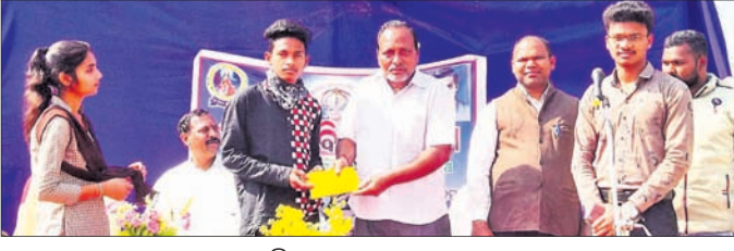
ଜଣେ ଛାତ୍ରଙ୍କୁ ପୁରସ୍କୃତ କରାଯାଇଛି।

ସୁବର୍ଣ୍ଣପୁର ଜିଲ୍ଲା ବାରମହାରାଜପୁର ଉପଖଣ୍ଡ ଇନ୍ଦ୍ରାପୁଷ୍ପିତ ଗାୟତ୍ରୀ ଆବାସିକ ଶିକ୍ଷାନୁଷ୍ଠାନରେ ଗଣିତ ଓ ବିଜ୍ଞାନ ମେଳା ଉଦ୍ଘାଟିତ ହୋଇଯାଇଛି। ଏଥିରେ କେନଡିଆପାଲି ଉଚ୍ଚ ବିଦ୍ୟାଳୟ, ଗଣିତ ଶିକ୍ଷକ ଦୀନବନ୍ଧୁ ପ୍ରଧାନ ମୁଖ୍ୟ ଅତିଥି, ବଳାଙ୍ଗୀରର ବିଭାଗ ପ୍ରଚାରକ ପ୍ରଣବ ନାଏକ ସମ୍ମାନୀତ ଅତିଥିଭାବେ ଯୋଗ ଦେଇଥିଲେ। ପ୍ରଦର୍ଶିତ ପ୍ରକଳ୍ପଗୁଡ଼ିକ ମଧ୍ୟରୁ ୧୦ଟି ପ୍ରକଳ୍ପକୁ ଚୟନ କରାଯାଇଥିଲା। ଏହି ଅବସରରେ ଗଣିତ ଓ ବିଜ୍ଞାନଭିତ୍ତିକ ପ୍ରକଳ୍ପ କାର୍ଯ୍ୟକ୍ରମ ତିନୋଟି ବିଭାଗରେ