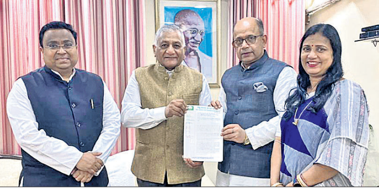
ଜାତୀୟ ରାଜପଥ ରାଷ୍ଟ୍ରମନ୍ତ୍ରୀ ଭି.କେ. ସିଂଙ୍କୁ ଗୁରୁବାର ବିଜେଡି ସଂସଦୀୟ ଚିତ୍ର ଦାବି ପତ୍ର ପ୍ରଦାନ କରୁଛନ୍ତି।

କେନ୍ଦ୍ର ପଞ୍ଚାଙ୍ଗ ଭେଟିଲା ବିଜେଡି ସଂସଦୀୟ ଚିତ୍ର ଭୁବନେଶ୍ୱର, ୨୨ ଡିସେମ୍ବର (ଭୁବନେ) ରାଜ୍ୟରେ ଅନେକ ଜାତୀୟ ରାଜପଥ ପ୍ରକଳ୍ପ ଦୀର୍ଘଦିନ ଧରି ପଡ଼ିରହିଛି। ସେଗୁଡ଼ିକର କାର୍ଯ୍ୟ ଅତ୍ୟନ୍ତ ମନ୍ଦର ଗତିରେ ଚାଲୁଛି। ଏହାକୁ ନେଇ ଚିତ୍ରାପ୍ରକଳ୍ପ କରିବା ସହ ରାଜପଥ ନିର୍ମାଣ କାର୍ଯ୍ୟ ଦ୍ରବୀଭୂତ କରିବା, ଓଡ଼ିଶା ଦେଇ ଯାଇଥିବା ରାଜପଥ ରକ୍ଷଣାବେକ୍ଷଣ ଏବଂ ପୁଣି ରାଜପଥ ଯୋଗାଣ କରିବାକୁ ଓଡ଼ିଶା ସରକାର କେନ୍ଦ୍ର ନିକଟରେ ଦାବି କରିଛନ୍ତି। ଏ ନେଇ ବିଜେଡି ସଂସଦୀୟ ଚିତ୍ର ଗୁରୁବାର କେନ୍ଦ୍ର ସଭା ପରିଷଦ, ଜାତୀୟ ରାଜପଥ ରାଷ୍ଟ୍ରମନ୍ତ୍ରୀ ଜେନେରାଲ (ଅବସରପ୍ରାପ୍ତ) ଭି.କେ. ସିଂଙ୍କୁ ଭେଟି ଦାବିପତ୍ର ପ୍ରଦାନ କରିଛନ୍ତି।