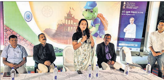
ହକି ବିଶ୍ୱକପ୍ ଅବସରରେ ଜିଲ୍ଲାରେ ଆୟୋଜିତ ହେବାକୁ ଥିବା କାର୍ଯ୍ୟକ୍ରମ ସମ୍ପର୍କରେ ଜିଲ୍ଲାପାଳ ସୂଚନା ଦେଉଛନ୍ତି।