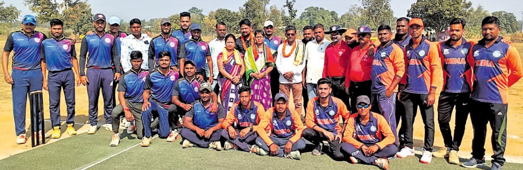
ଅତିଥିଙ୍କ ସହିତ ଉଭୟ ଦଳର ଖେଳାଳି।