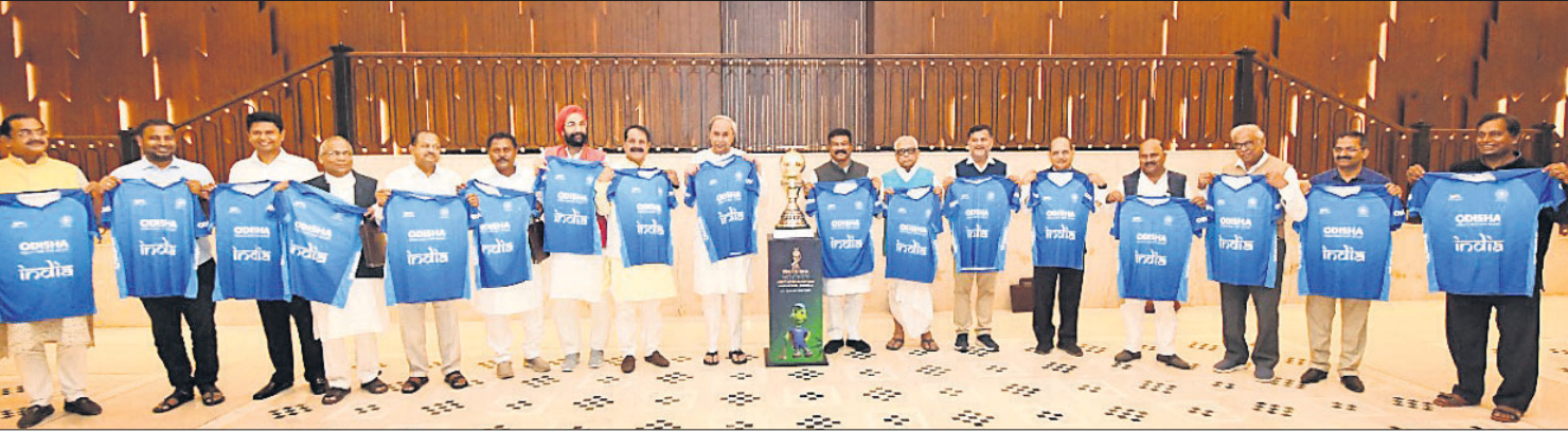
ଲୋକସେବା ଭବନର କର୍ମଚାରୀମାନେ ସେଠାରେ ଗୁରୁବାର ସର୍ବଦଳାୟକ ବୈଠକ ପରେ ମୁଖ୍ୟମନ୍ତ୍ରୀ ନବୀନ ପଟ୍ଟନାୟକ ଓ ବିଭିନ୍ନ ଦଳର ନେତାମାନେ କର୍ଯ୍ୟ ପ୍ରଦର୍ଶନ କରୁଛନ୍ତି ।

ଭୁବନେଶ୍ୱର, ୨୨.୧୨.୨୨(ବ୍ୟୁରୋ) ଆସନ୍ତା କାର୍ଯ୍ୟକ୍ରମରେ ଭୁବନେଶ୍ୱର ଓ ରାଉରକେଲାରେ ପୁରୁଷ ହକି ବିଶ୍ୱକପ-୨୦୨୩ ଆୟୋଜିତ ହେବ । ଏହି କାର୍ଯ୍ୟକ୍ରମରେ ଯୋଗଦେବା ପାଇଁ ସବୁ ରାଜ୍ୟର ମୁଖ୍ୟମନ୍ତ୍ରୀମାନଙ୍କୁ ଆମନ୍ତ୍ରଣ କରାଯିବ । ବିଶ୍ୱକପ ଆୟୋଜନ ଏବଂ ସୁପରିଚାଳନା ନିମନ୍ତେ ଗୁରୁବାର ଲୋକସେବା ଭବନର କର୍ମଚାରୀମାନେ ସେଠାରେ ଅନୁଷ୍ଠିତ ସର୍ବଦଳାୟକ ବୈଠକରେ ମୁଖ୍ୟମନ୍ତ୍ରୀ ନବୀନ ପଟ୍ଟନାୟକ ଏହି ଘୋଷଣା କରିଛନ୍ତି । ବୈଠକରେ ଅଧିକାରୀମାନେ ଉପସ୍ଥିତ ରହି ଗୁରୁବାର ଲୋକସେବା ଭବନର କର୍ମଚାରୀମାନେ ସେଠାରେ ଅନୁଷ୍ଠିତ ସର୍ବଦଳାୟକ ବୈଠକରେ ମୁଖ୍ୟମନ୍ତ୍ରୀ ନବୀନ ପଟ୍ଟନାୟକ ଏହି ଘୋଷଣା କରିଛନ୍ତି । ବୈଠକରେ ଅଧିକାରୀମାନେ ଉପସ୍ଥିତ ରହି ଗୁରୁବାର ଲୋକସେବା ଭବନର କର୍ମଚାରୀମାନେ ସେଠାରେ ଅନୁଷ୍ଠିତ ସର୍ବଦଳାୟକ ବୈଠକରେ ମୁଖ୍ୟମନ୍ତ୍ରୀ ନବୀନ ପଟ୍ଟନାୟକ ଏହି ଘୋଷଣା କରିଛନ୍ତି ।