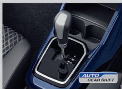
Auto Gear Shift