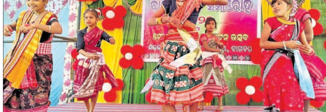
ଛାତ୍ରୀମାନେ ସଂସ୍କୃତିକ କାର୍ଯ୍ୟକ୍ରମ ପରିବେଷଣ କରୁଛନ୍ତି।