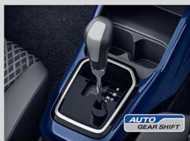
Auto Gear Shift