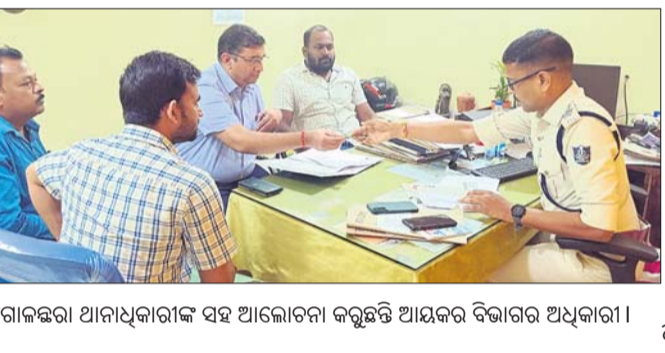
ଗୋପାଳପୁର, ୨୩ ୧୨ (ଡି.ଏନ.ଏ.)

ଗୋପାଳପୁର, ୨୩ ୧୨ (ଡି.ଏନ.ଏ.) ଗୋପାଳପୁର ବେଳାଭୂମି ମହୋତ୍ସବରେ ବ୍ୟାପକ ବ୍ୟବସ୍ଥା କରାଯାଇଛି।