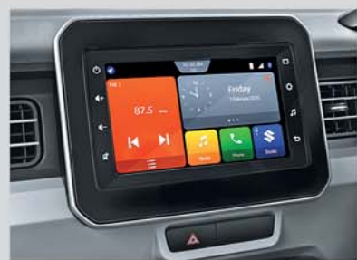
17.78 cm Smartplay Studio (Available from Zeta variant onwards)