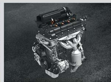
1.2L VVT Petrol Engine