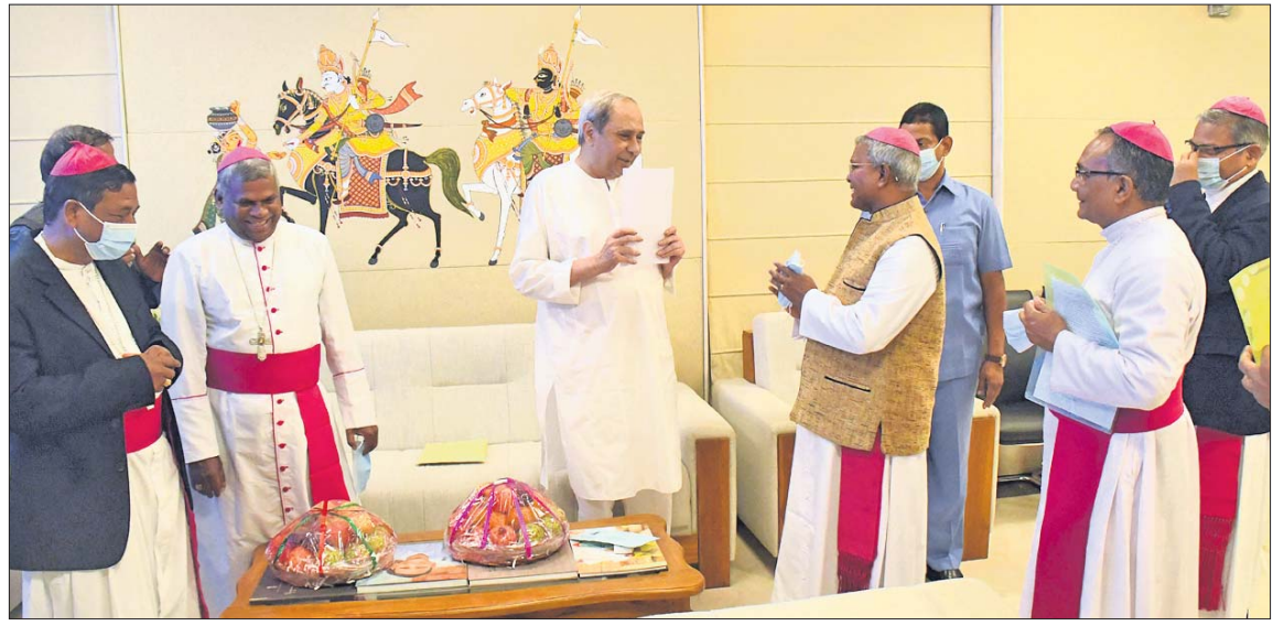
ଭୁବନେଶ୍ୱର କ୍ୟାଥୋଲିକ୍ ଚର୍ଚ୍ଚର ନବୀକରଣ କାର୍ଯ୍ୟ ଉଦ୍‌ଯାଚନ ପାଇଁ ମୁଖ୍ୟମନ୍ତ୍ରୀ ନବୀନ ପଟ୍ଟନାୟକଙ୍କୁ ଅନୁଷ୍ଠାନ ଖ୍ରୀଷ୍ଟିଆନ ଧର୍ମଯାଜକମାନେ ଶୁକ୍ରବାର ନବୀନ ନିବାସକୁ ନିମନ୍ତ୍ରଣ କରିବାକୁ ଆସିଛନ୍ତି।