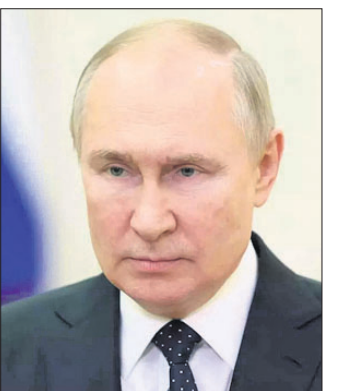
କହିଛନ୍ତି। କିନ୍ତୁ ସହ ଆଲୋଚନା ପାଇଁ ମଧ୍ୟ ଆଗ୍ରହୀ ବୋଲି କିଛି ମାସ ହେଲା ଏହାର ଅଧିକାରୀମାନେ

ଭାରତ ବାୟୋଟେକ୍‌ର ଇଣ୍ଡାନାଜାଲ କୋଭିଡ୍ ଭାଙ୍ଗିନୁ ରୁଷ୍ଟର ଡୋଲ୍ ଭାବେ କେନ୍ଦ୍ର ସ୍ୱାସ୍ଥ୍ୟ ମନ୍ତ୍ରାଳୟ ଶୁକ୍ରବାର ମଞ୍ଜୁରୀ ପ୍ରଦାନ କରିଛି। ଏହି ଡୋଲ୍ ଏବେ କୋ-ଓ୍ରେନ୍ ଆପ୍ରେ ଉପଲବ୍ଧ ହୋଇଛି। ଯେଉଁମାନେ କୋଭିଡ୍‌ରୁ ଏବଂ କୋଭାକ୍ସିନ୍ ଡୋଲ୍ ନେଇଛନ୍ତି, ସେମାନେ ନାଜାଲ ଭାଙ୍ଗିନୁ ରୁଷ୍ଟର ଡୋଲ୍ ଭାବେ ନେଇପାରିବେ। ତାହା ୧୮ ବର୍ଷରୁ ଊର୍ଦ୍ଧ୍ୱକୁ ରୁଷ୍ଟର ଡୋଲ୍ ଭାବେ ବିଭିନ୍ନ ୧୫୪ ନାଜାଲ ଭାଙ୍ଗିନୁ କରୁଥିବା ଗୁଡ଼ିରେ ଦେବା ଲାଗି ଗତ ନଭେମ୍ବରରେ ଭାରତରେ ରୁଷ୍ଟର ଡୋଲ୍ ଡୋଲ୍‌କରଣ କାର୍ଯ୍ୟକ୍ରମକୁ ବଢ଼ାଇବା ପାଇଁ ସରକାର