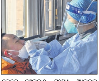
ତେବେ ସଂକ୍ରମଣ ସଂଖ୍ୟା ଆକଳନ ପ୍ରକ୍ରିୟା ଅସ୍ପଷ୍ଟ ରହିଥିବା କୁହାଯାଇଛି। ପ୍ରକୃତରେ କୋଭିଡ୍‌ରେ କେତେଜଣଙ୍କର ମୃତ୍ୟୁ ଘଟିଲାଣି, ତାହା ଆକଳନ କରାଯାଇ ନାହିଁ। ଆଗରୁ ରାଜନୀତି ସଂକ୍ରମଣ ଅଧିକ କୋରୋନା ହେବାକୁ ଯାଉଛି। ଏଥିପାଇଁ ପ୍ରଭୃତ ରହିବାକୁ ସରକାରଙ୍କ ପକ୍ଷରୁ ପରାମର୍ଶ ଦିଆଯାଇଛି। ତେବେ ଦୈନିକ ସଂକ୍ରମଣ ୩,୦୪୯ ବୋଲି ସରକାରୀ ଭାବେ କୁହାଯାଇଛି।

ରାଜନୀତିରେ ଚଳିତ ସପ୍ତାହର ଗୋଟିଏ ଦିନରେ ପାଖାପାଖି ୩.୭ କୋଟି ଲୋକ କୋଭିଡ୍ ସଂକ୍ରମିତ ହୋଇଥିବା ସ୍ୱାସ୍ଥ୍ୟ ବିଭାଗ ପକ୍ଷରୁ ଆକଳନ କରାଯାଇଛି। ଏହା ବର୍ତ୍ତମାନ ପୁଣ୍ୟା ବିଶ୍ୱରେ ସର୍ବାଧିକ ସଂକ୍ରମଣ। ତିବେସର ମାସର ପ୍ରଥମ ୨୦ ଦିନରେ ରାଜନୀତି ଜନସଂଖ୍ୟାରେ ପ୍ରାୟ ୧୮ ପ୍ରତିଶତ ଏହି ଭୂତାଣୁ ଦ୍ୱାରା ସଂକ୍ରମିତ ହୋଇଯାଇଛି। ଗତ ଜାନୁଆରୀରେ ସର୍ବାଧିକ ଦୈନିକ ସଂକ୍ରମଣ ୪୦ ଲକ୍ଷ ଥିଲା ବୋଲି ରାଜନୀତି ନ୍ୟାଶନାଲ୍ ହେଲ୍ଥ କମିଶନ (ଏନ୍‌ଏସ୍‌ସି)ର ଏକ ରିପୋର୍ଟ ଜଣାପଡ଼ିଛି। ଜିରୋ-କୋଭିଡ୍ କଟକଣା ହଟିବା ପରେ ଦ୍ରୁତ ସଂକ୍ରମଣ ଓପିକ୍ରମ ଭାରିଆଖି ଯୋଗୁଁ ଦୈନିକ ସଂକ୍ରମଣ ସର୍ବାଧିକ ବୃଦ୍ଧି ପାଇଛି। ସିଡ୍‌ଆନ ପ୍ରଦେଶ ଏବଂ ରାଜଧାନୀ ବେଙ୍ଗଲ୍ ଅଧା ଲୋକ କୋଭିଡ୍ ସଂକ୍ରମିତ ହୋଇଯାଇଛନ୍ତି।