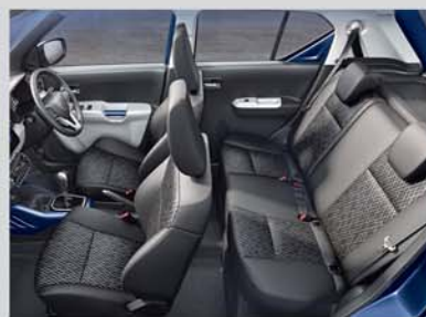
Spacious and Comfortable Interiors