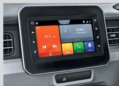
17.78 cm Smartplay Studio (Available from Zeta variant onwards)