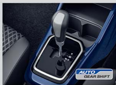
Auto Gear Shift