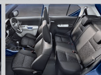
Spacious and Comfortable Interiors