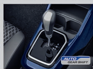
Auto Gear Shift