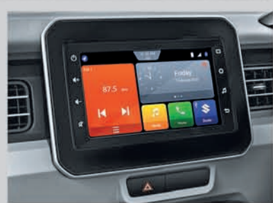
17.78 cm Smartplay Studio (Available from Zeta variant onwards)