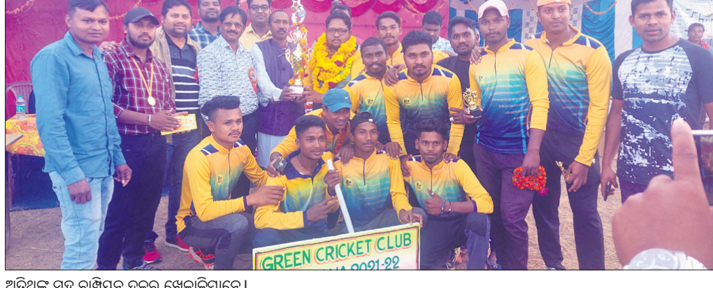
ଅତିଥି ସହ ଚାମ୍ପିୟନ ଦଳର ଖେଳାଳିମାନେ।