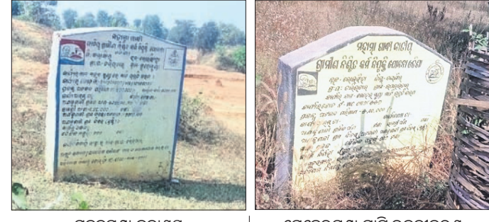
ମହନପୁରା କଳାଶୟ ମାଟି ଉନ୍ନୟନକାରୀ ଫଳକ।