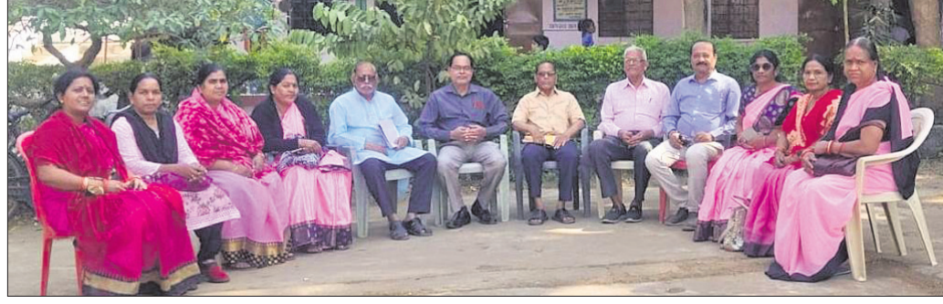
ନାଗରିକ କର୍ମଚାରୀଙ୍କୁ ସଦସ୍ୟମାନେ ସ୍ତୁଳ ଶିକ୍ଷକ ସହ ଆଲୋଚନା କରୁଛନ୍ତି।