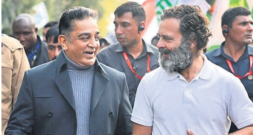
କଂଗ୍ରେସ ନେତା ରାହୁଲ ଗାନ୍ଧୀଙ୍କ ସହ ଏମ୍‌କେଏମ୍ ମୁଖ୍ୟ କମଳ ହାସନ ।