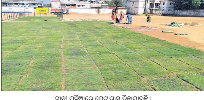
ଗାନ୍ଧୀ ପଡିଆରେ ଫ୍ଲୋଟ ଗ୍ରାସ ବିଛାଯାଇଛି ।

କ୍ରିକେଟ ରୁନାମେଷ୍ଟ ଆୟୋଜନ ହେବାକୁ ଥିବା ବେଳେ ପଡିଆ କାର୍ଯ୍ୟ ସୁଚ୍ଚକାଳୀନ ଭିତ୍ତିରେ ଜାରି ରହିଛି । କରୋନା ମହାମାରୀ ପାଇଁ ୨ବର୍ଷ ଧରି ଲୀଳାମନି ରୁନାମେଷ୍ଟ ବନ୍ଦ ଥିଲା । ଚଳିତ ବର୍ଷ ଦର୍ଶକ ଗ୍ୟାଲେରି, ଚର୍ଚ୍ଚିତ ଉଇକେଟ ଓ ଘାସ ପଡିଆରେ ରୁନାମେଷ୍ଟକୁ ଉପଭୋଗ କରିବା ପାଇଁ କ୍ରିକେଟ ପ୍ରେମୀ ଉତ୍ସୁକତା ସହ ଅପେକ୍ଷା କରିଛନ୍ତି । ପ୍ରକାଶ ଯେ, ଏହି ପଡିଆରେ ପୂର୍ବରୁ ବିଶେଷ ସୁବିଧା ଲୀଳା କ୍ରିକେଟ ସଂଘ ଓ ଓଡ଼ିଶା କ୍ରିକେଟ ସଂଘର ମିଳିତ ସହଯୋଗରେ ଏହି କାର୍ଯ୍ୟ ଚାଲିଛି । ଆଗକୁ ପୌର ପରିଷଦ ଆୟୋଜିତ ହେବାର ମିଳିତ ସହଯୋଗରେ ଏହି କାର୍ଯ୍ୟ ଚାଲିଛି । ଆଗକୁ ପୌର ପରିଷଦ ଉଦ୍ଘାଟନା ଜାତୀୟ କ୍ରିକେଟ ଖେଳାଳି କାର୍ଯ୍ୟ କରାଯିବ । ଜାମୁୟାରୀ ମାସ ଖେଳି ଦର୍ଶକଙ୍କ ଶେଷ ସମ୍ପାଦନ ସମ୍ମାନଜନକ ଲୀଳାମନି