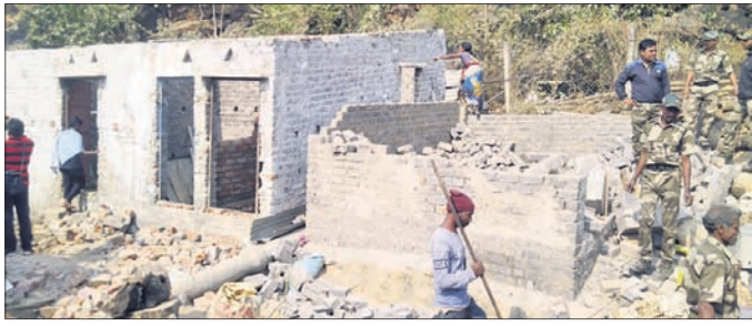
ବନ ବିଭାଗ ପକ୍ଷରୁ ଘରଗୁଡ଼ିକୁ ଉଚ୍ଛେଦ କରାଯାଇଛି।

ରାଉରକେଲା ଗୋପବନ୍ଧୁପାଲି ସ୍ଥିତ ବୈଷ୍ଣବଦେବୀ ମନ୍ଦିର ନିକଟ ତେଲିପଡ଼ା ବନ୍ଧୁରେ କିଛି ଘରକୁ ରାଉରକେଲା ବନ ବିଭାଗ ଶନିବାର ଉଚ୍ଛେଦ କରିଛି। ତେଲିପଡ଼ା ବନ୍ଧୁର ଦୁର୍ଗାପୁର ପାହାଡ଼ ଉପରେ ସ୍ଥାନୀୟ ଲୋକେ ଜଙ୍ଗଲ ଜମି ଜବରଦଖଲ କରି ଘର ନିର୍ମାଣ କରୁଥିଲେ। ସୂଚନା ପାଇ ରାଉରକେଲା ବନଖଣ୍ଡ ଅଧିକାରୀ ଯଶୋବନ୍ତ ସେଠୀ ଶନିବାର ସାଞ୍ଜ ୧୧ଟାରେ ସେଠାରେ