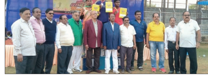
ଅତିଥିମାନଙ୍କ ଗହଣରେ କ୍ରୀଡା ପ୍ରତିଯୋଗୀଙ୍କୁ ପୁରସ୍କୃତ କରାଯାଇଛି।