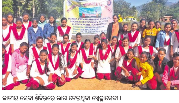
ଜାତୀୟ ସେବା ଶିବିରରେ ଭାଗ ନେଇଥିବା ସ୍ୱେଚ୍ଛାସେବୀ।

ଜି.ଉପପତି, ୨୪.୧୨ (ଡି.ଏନ୍.ଏ.) ଜି.ଉପପତି ସ୍ଥିତ କନ୍ଦିରା ପ୍ରିୟଦର୍ଶିନୀ ମହିଳା ମହା ବିଦ୍ୟାଳୟର ଜାତୀୟ ସେବା ଯୋଜନା ତରଫରୁ ପୋଷ୍ୟ ଗ୍ରାମ ପାଠାଳୟରେ ଶୀତ କାଳୀନ ଶିବିର ଉଦ୍‌ଘାଟିତ ହୋଇଯାଇଛି।