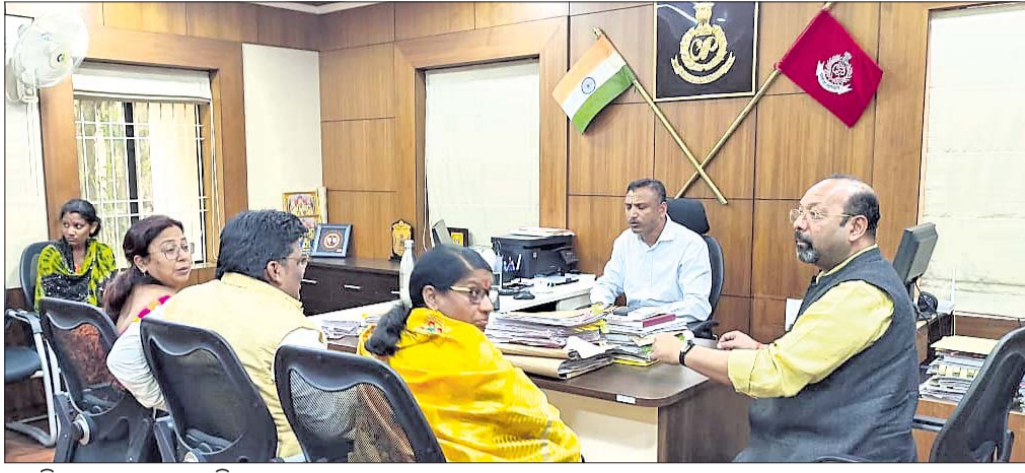
ଆଇଜିଙ୍କୁ ଫେରାଦ ହେଉଛନ୍ତି ଭାଜପା ନେତୃବୃନ୍ଦ।

ପାତ୍ରପୁର ରୁକ୍ଷ ସାମାଜିକ ଆନ୍ଦୋଳନ ସଂଗଠନ ଆଇଜିଙ୍କୁ ଫେରାଦ କରିବାକୁ ନିର୍ଦ୍ଦେଶ ଦେଇଛନ୍ତି।