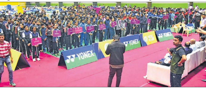
ଜାତୀୟ ସର୍ବଭୂମିୟର ବ୍ୟାଡ଼ମିଣ୍ଟନ ଚାମ୍ପିୟନଶିପ୍ରେ ଭାଗ ନେଇଥିବା ପ୍ରତିଯୋଗୀ।