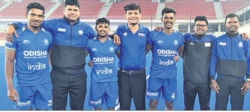
ଭାରତ ଓ କୋରିଆ ଭୁବନେଶ୍ଵର ଦଳର ମ୍ୟାଚ୍ ପରେ ଓଡ଼ିଆ ଅଧିପତ୍ୟାଳୟ ସହ ଓଡ଼ିଶା ଖେଳାଳି।

ଭୁବନେଶ୍ଵର, ୨୬.୧୨ (ସୋର୍ସ୍ ଟୁଡ଼ା) ରାଉଣ୍ଡରେ ଭାରତ ଭୁବନେଶ୍ଵର ହକି ଦଳ କୋରିଆ ବିପକ୍ଷରେ ବୃହତ ବିଜୟ ହାସଲ କରିଛି। ୧୩ ଚାରିଖରେ ଭାରତ ସ୍କୋର ବିପକ୍ଷରେ ଅଭିଯାନ ଆରମ୍ଭ କରିବ। ଏହାର ଫୁଲ୍ ଦିନ ପରେ ଦଳ ଇଲ୍ ଓ ଫ୍ରେଲ୍ ପ୍ରଥମ ଦୁଇ ମ୍ୟାଚ୍ ରାଉଣ୍ଡରେ ଖେଳିବା ପରେ ୧୯ ଚାରିଖରେ ଅଧିକ ଗୁପ୍ତ ପର୍ଯ୍ୟାୟ ମ୍ୟାଚ୍ ଦଳ ଭୁବନେଶ୍ଵରରେ ଖେଳିବ।