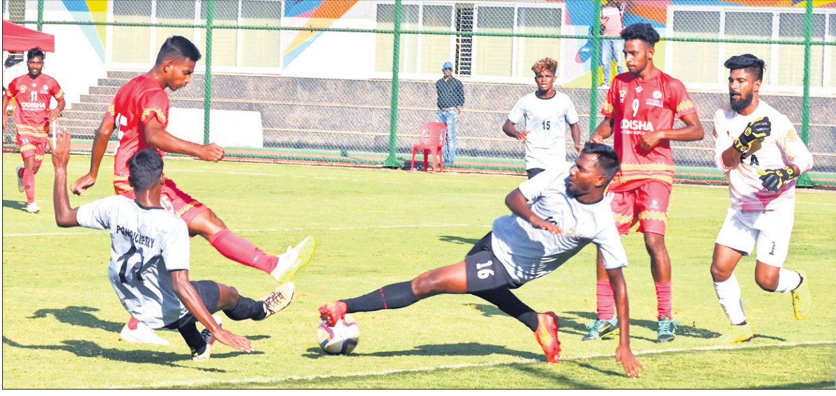
ଓଡ଼ିଶା ଓ ପଶ୍ଚିମବଙ୍ଗ ମଧ୍ୟରେ ଅନୁଷ୍ଠିତ ମ୍ୟାଚ୍ ର ଉତ୍ସାହୀ ପୂର୍ଣ୍ଣସୂଚୀ

ସବୁଜ ଫୁଟ୍ବଲ ଆନ୍ଦୋଳନରେ କାନ୍ଦାସିନି ପ୍ରତିଯୋଗିତାରେ ପୁରୁଷ ଫୁଟ୍ବଲ ଚାମ୍ପିୟନଶିପ୍ ସମାପ୍ତ ହେବା ପରେ ଓଡ଼ିଶା ୫-୦ ଗୋଲରେ