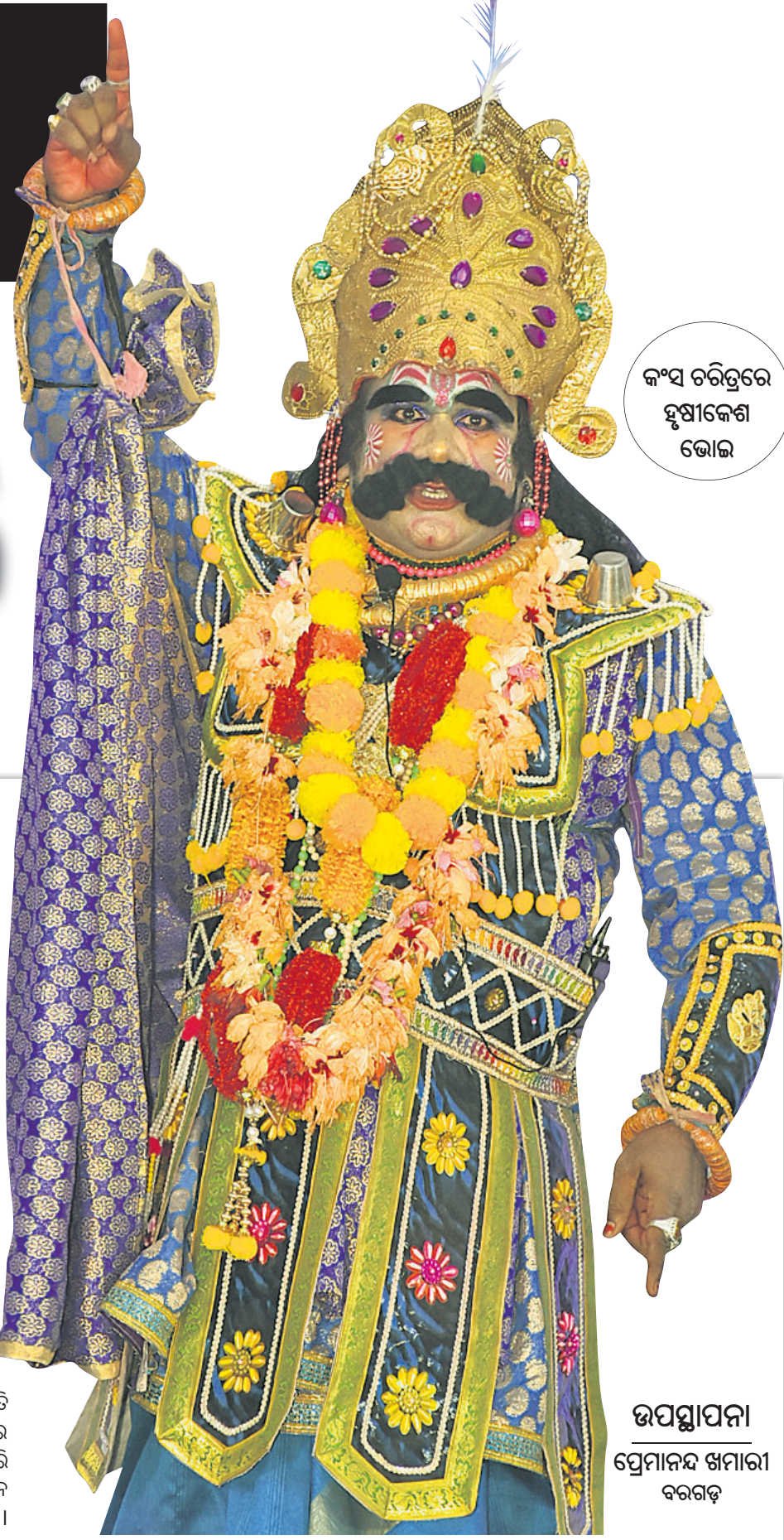
କଂସ ଚରିତ୍ରରେ ହୃଷୀକେଶ ଭୋଇ