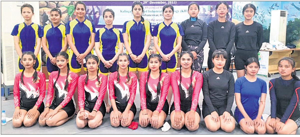
ଚାମ୍ପିୟନଶିପ୍ରେ ଭାଗ ନେଇଥିବା ପ୍ରତିଯୋଗୀ

କିଟ୍, କିସ୍ରେ ଯୋଗାସନ ଓ ସନ୍ତରଣ ଚାମ୍ପିୟନଶିପ୍ ହେଉଛି ଏକ ବଡ଼ ଚିନ୍ତା। କିଟ୍, କିସ୍ରେ ଯୋଗାସନ ଓ ସନ୍ତରଣ ଚାମ୍ପିୟନଶିପ୍ ହେଉଛି ଏକ ବଡ଼ ଚିନ୍ତା।