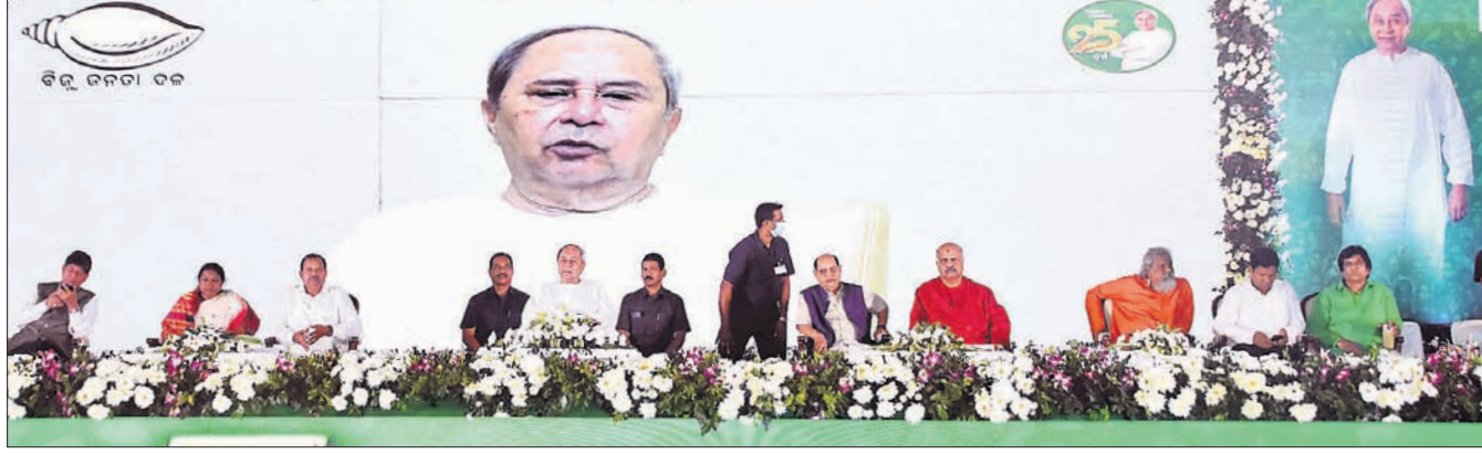
ଭୁବନେଶ୍ୱର, ୨୬ ଡିସେମ୍ବର (ଭୁବନେଶ୍ୱର)

ଆଗାମୀ ସାଧାରଣ ନିର୍ବାଚନ ପାଇଁ ବିଜେଡି ରୋପ୍ୟ ଜୟନ୍ତୀକୁ ବିଭୁଳ ପୁଲିସ୍। ୨୦୧୯ ନିର୍ବାଚନରେ ବିଜୟଲାଭ କରି ବିଜେଡି ସମଗ୍ର ଦେଶରେ ଏକ ନୂତନ କାର୍ଯ୍ୟକ୍ରମ ଗ୍ରହଣ କରିବାକୁ ଲକ୍ଷ୍ୟ ରଖିଛି। ଏହି ଲକ୍ଷ୍ୟରେ ବିଜେଡି ରାଜନୀତି ପ୍ରସ୍ତୁତ କରିବା ଆରମ୍ଭ କରିଦେଇଛି। ନିର୍ବାଚନରେ ନିର୍ଣ୍ଣାୟକ ଭୂମିକା ନେଉଥିବା ମହିଳାମାନଙ୍କୁ ଅଧିକ ଅଧିକ ସାମିଲ କରିବା ଆରମ୍ଭ କରିଦେଇଛି। ନିର୍ବାଚନରେ ନିର୍ଣ୍ଣାୟକ ଭୂମିକା ନେଉଥିବା ମହିଳାମାନଙ୍କୁ ଅଧିକ ଅଧିକ ସାମିଲ କରିବା ଆରମ୍ଭ କରିଦେଇଛି। ନିର୍ବାଚନରେ ନିର୍ଣ୍ଣାୟକ ଭୂମିକା ନେଉଥିବା ମହିଳାମାନଙ୍କୁ ଅଧିକ ଅଧିକ ସାମିଲ କରିବା ଆରମ୍ଭ କରିଦେଇଛି।