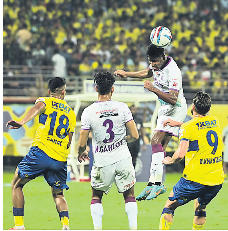
ଓଡ଼ିଶା ଏଫସି ଓ କେରଳ ଖେଳାଳୀ ମଧ୍ୟରେ ଅନୁଷ୍ଠିତ ମ୍ୟାଚ୍

ଓଏଫସି ଦଳ କେରଳ ଦଳରୁ ହାରିଥିଲା। ଓଏଫସି ଦଳ କେରଳ ଦଳରୁ ହାରିଥିଲା।