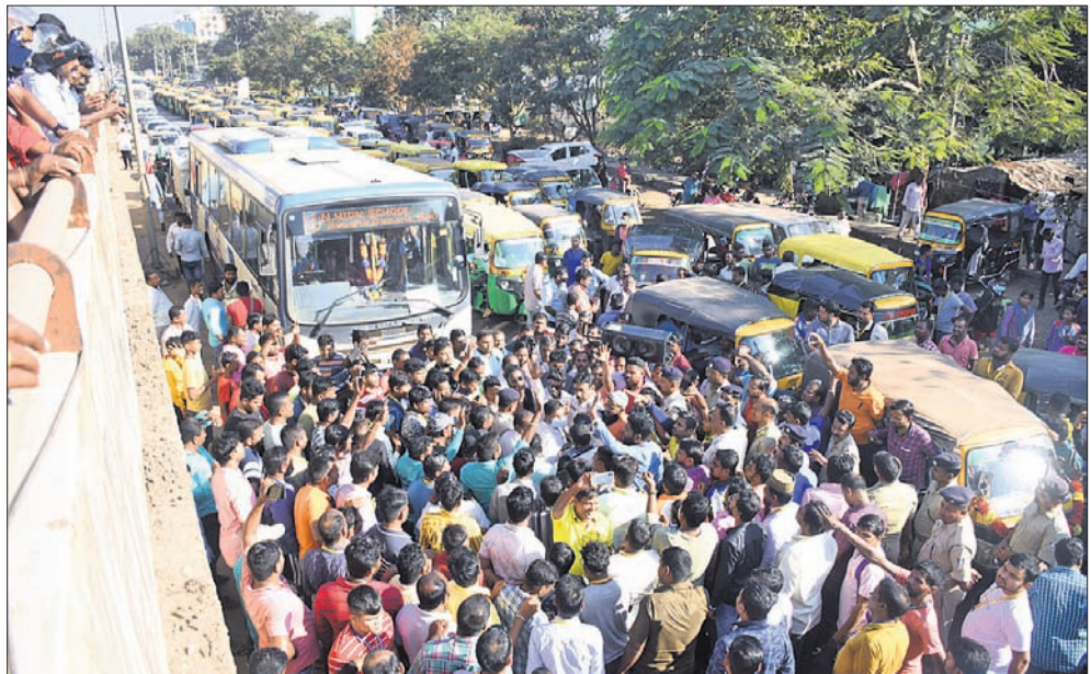
ଓଲା, ଓବେର, ରାପିଡୋ ବାଇକ୍ କମର୍ସିଆଲ ପରମିଟ୍, ଫିଟନେସ୍, ଇନ୍ସୁରାନ୍ସ, ଲାଇସେନ୍ସ ନ ଥିବା ଦଣ୍ଡାଳ କାର୍ଯ୍ୟାଳୟର ଦାବିରେ ସ୍ମାର୍ଟସିଟି ଅନୁଲାଇନ୍ ଅଟୋ ସଂଘ ପକ୍ଷରୁ ସୋମବାର ଆରମ୍ଭିତ ଘେରାଉ ସମୟରେ କାଟୋଇ ରାଜପଥ ଉପରେ ଶୋକ ପ୍ରତିବାଦ କରାଯିବାକୁ ଗାଡିମୋଟର ଅଟକି ରହିଛି ।