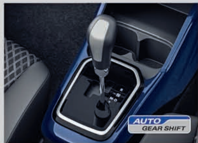
Auto Gear Shift