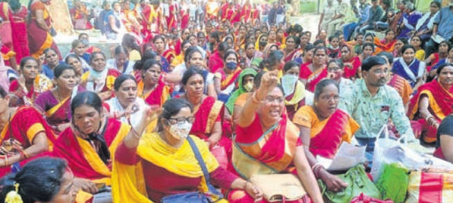
ଜିଲ୍ଲାପାଳଙ୍କ ଅତିସ ସମ୍ମୁଖରେ ଅର୍ଜନୀତି କର୍ମାଙ୍କ ବିଷୋଭ।

ମାସିକ ୧୫ ହଜାର ଟଙ୍କା ବରମା ପ୍ରଦାନ ସହ ନିଜ ଅର୍ଜନୀତି କର୍ମାଙ୍କୁ ଅର୍ଜନୀତି କର୍ମାର ମାନ୍ୟତା ଭଳି ୮ଦିନାଦି ଦାବି ନେଇ ଜିଲ୍ଲାପାଳଙ୍କ କାର୍ଯ୍ୟକ୍ରମ ସମ୍ମୁଖରେ ବିଷୋଭ ପ୍ରଦର୍ଶନ କରିଛନ୍ତି। ପ୍ରଥମେ ଭବନୀପାଟଣା ବଲାଙ୍ଗି ମନ୍ଦିରଠାରୁ ୫୫କାରରୁ ଉର୍ଦ୍ଧ୍ଵ ଅର୍ଜନୀତି କର୍ମା, ପାଟିକା ସାମିଲ ହୋଇ ଏକ ବିଶାଳ ବିଷୋଭ ଶୋଭାଯାତ୍ରା କରିଥିଲେ। ରାଜଭାଷ୍ଟ୍ରରେ ବିଷୋଭ ପ୍ରଦର୍ଶନ ଯୋଗୁଁ ସହରରେ ଦୀର୍ଘ ୩ ଦିନ ଧରି ଚଳିଥିବା ଅର୍ଜନୀତି କର୍ମା ଓ ପାଟିକା ରାଜ୍ୟ ସରକାର ପ୍ରଥମେ ଉତ୍ତର କରାଯାଇ ଅର୍ଜନୀତି କର୍ମାଙ୍କୁ ସରକାରୀ କର୍ମଚାରୀ ମାନ୍ୟତା ଦେବାକୁ ଦାବି ହୋଇଛି।