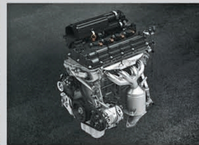
1.2L VVT Petrol Engine