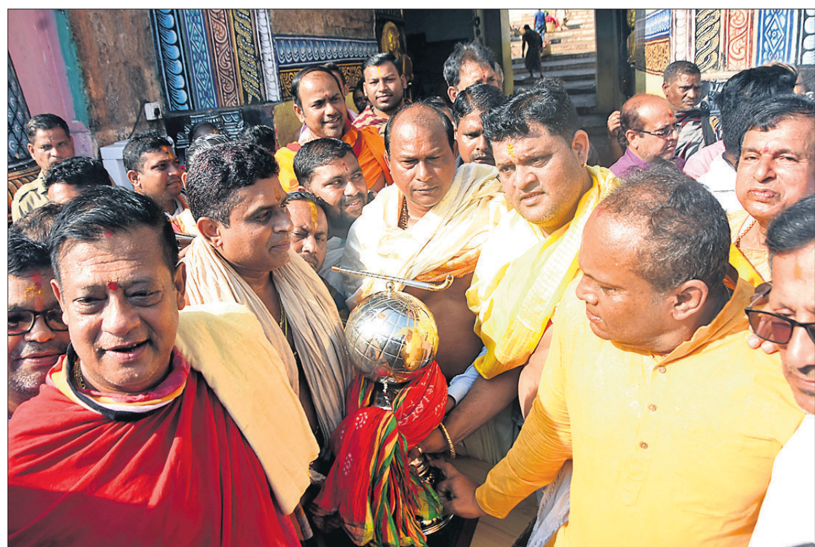
ଶ୍ରୀମନ୍ଦିର ସିଂହଦ୍ବାର ସମ୍ମୁଖରେ ମଙ୍ଗଳବାର ଶ୍ରୀମନ୍ଦିର ପ୍ରଶାସନ ଓ ସେବାୟତଙ୍କ ପକ୍ଷରୁ ହରି ବିଶ୍ୱକର୍ମ ଟ୍ରଷ୍ଟକୁ ଖଣ୍ଡିଆ ପାଟ ଅର୍ପଣ ପୂର୍ବକ ସ୍ମାରଣ କରାଯାଇଛି।