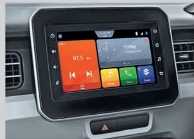
17.78 cm Smartplay Studio (Available from Zeta variant onwards)