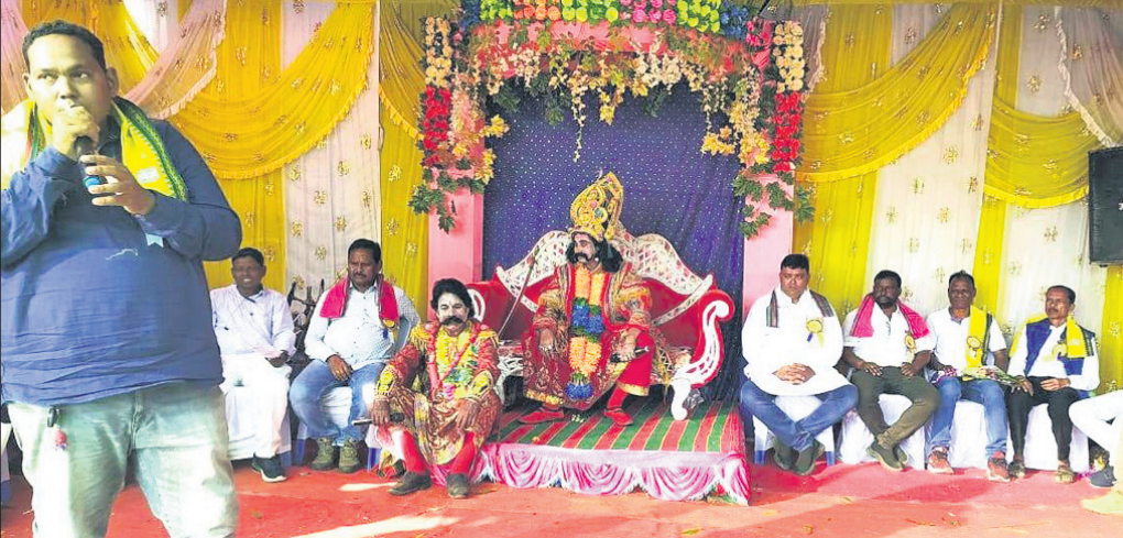
ରାବଣ ଦରବାରରେ ମହାସ୍ଥାନ ଅତିଥି।

ବଲାଙ୍ଗୀର ଜିଲ୍ଲା ଦେଓଗାଁ ବ୍ଲକ୍ ଜୁଲିଆପଡା ଅନ୍ତର୍ଗତ ଖାରବେଣ୍ଡା ଗ୍ରାମରେ ଶୁଲିଆ ମହୋତ୍ସବ ପାହାଚ ପାଦଦେଶରେ ୩ଦିନ ଧରି ଚାଲିଥିବା ୨ୟ ଶୁଲିଆ ମହୋତ୍ସବ ମଙ୍ଗଳବାର ଉଦ୍‌ଯାପିତ ହୋଇଯାଇଛି।