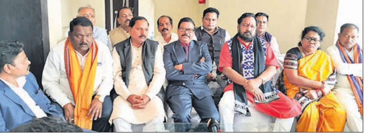
ଖବରଦାତା ସମ୍ମିଳନୀରେ ସୁରେଶ ପୂଜାରୀଙ୍କୁ ଭାଜପାଳ ଦଳର ଘୋଷଣା ପ୍ରାଥମୀ ସମ୍ବନ୍ଧରେ ସମୀକ୍ଷା କରାଯାଇଛି ।