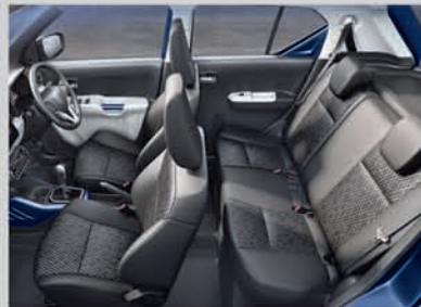
Spacious and Comfortable Interiors