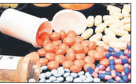
ସମସ୍ତ ମେଡିସିନ୍ ଉତ୍ତର ପ୍ରଦେଶ ବାରାଣସୀର ୩ଟି ଫାର୍ମରୁ ପ୍ରସ୍ତୁତ ହୋଇଥିବା ମୁଖ୍ୟ କମ୍ପାନୀ ପକ୍ଷରୁ ସଂଗୃହଣ କରାଯାଇଛି। ତେବେ ମେଡିସିନ୍ ପ୍ରସ୍ତୁତ କରୁଥିବା ସମ୍ପୂର୍ଣ୍ଣ ଫାର୍ମର ଡ୍ରଗ୍ ଲାଇସେନ୍ସ ରଦ୍ଦ ହୋଇଥିବା ଉତ୍ତରପ୍ରଦେଶ ସରକାରଙ୍କ ପକ୍ଷରୁ ସଂଗୃହଣ କରାଯାଇଛି।

■ ବାରାଣସୀସ୍ଥିତ ୩ ଫାର୍ମର ଲାଇସେନ୍ସ ରଦ୍ଦ କଲେ ସ୍ଥାନୀୟ ସରକାର ■ ଓଡ଼ିଶାର ଅନ୍ୟ ଅଞ୍ଚଳରେ ନକଲି ଔଷଧ ବିକ୍ରି ହେଉଥିବା ସନ୍ଦେହ ନକଲି ଔଷଧ ରାଜ୍ୟର ଅନ୍ୟ ଅଞ୍ଚଳରେ ବିକ୍ରି ହେଉଥିବା ଆଶଙ୍କା କରାଯାଉଥିବାରୁ ସେସବୁକୁ ଜବତ କରିବା ପାଇଁ ଦିଆଯାଇଥିଲା ବୋଲି କମିଶନାରୀ କହିଛନ୍ତି। ପୂର୍ବରୁ ଭୁବନେଶ୍ୱର, କଟକ, ରାଉରକେଲାକୁ ବିଦ୍ରୁକ ନକଲି ଔଷଧ ଜବତ ହେବା ସହ ଏସବୁ ମାମଲାରେ କାର୍ଯ୍ୟାନୁଷ୍ଠାନ ଜାରି ରହିଛି।