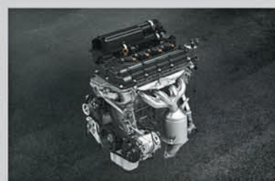
1.2L VVT Petrol Engine