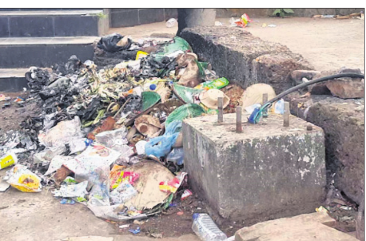
ଖୋର୍ଦ୍ଧା ଅଫିସ୍, ୨୭.୧୨

ଦିଆଯାଇନାହିଁ । ଏଠାରେ ବିବାହ ଆବାସ ହେଉଥିବା ଅର୍ଥ କେଉଁ ଭୋଜି ଆୟୋଜନ ଲାଗି ପୌର ପ୍ରଶାସନ ଅଧୀନରେ ବୁଜିତ ମଣ୍ଡପ ରହିଛି । ବିବାହ ଉତ୍ସବ ଆୟୋଜନ ତେବେ ଜିଲ୍ଲାର ପ୍ରମୁଖ ପର୍ଯ୍ୟଟନ ଏବଂ ବଣଭୋଜି ଲାଗି ପୌର ପ୍ରଶାସନ ପକ୍ଷରୁ ଡିଏସ୍ ଆବାସ ଅବହେଳା କରାଯାଇଛି । ତେବେ ବର୍ଷସାରା ସାଧାରଣରେ ପ୍ରତିକାଶ ପାଇଛି ।