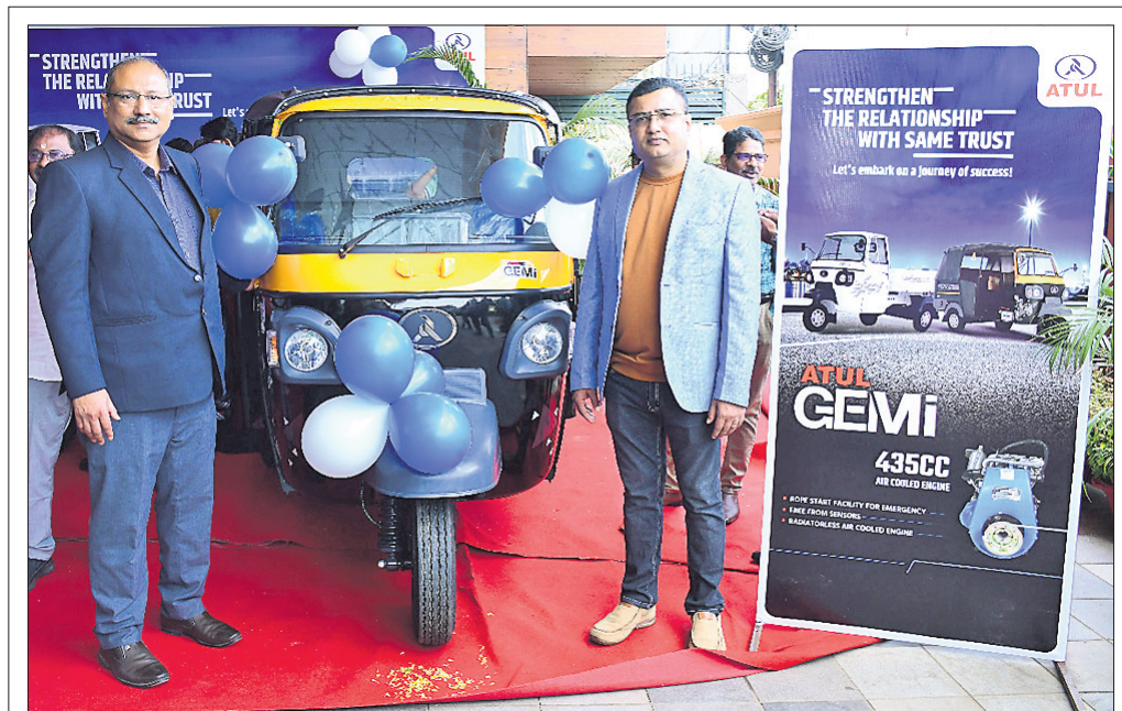
ଅତୁଲ ଶାଓମି ଲିମିଟେଡ୍ ପକ୍ଷରୁ ମଙ୍ଗଳବାର ଭୁବନେଶ୍ୱରର ଏକ ହୋଟେଲ ପରିସରରେ କମ୍ପାନୀର ୨ଟି ଅତ୍ୟାଧୁନିକ ଗାଡ଼ିକିଆ ଯାନ ତଥା କମ୍ପାନୀ ୪୩୫୫ସିଏ ମଡେଲର କାର୍ଡୋ ଓ ପାସେଞ୍ଜର ଯାନର ଅନାବରଣ କରାଯାଇଛି।