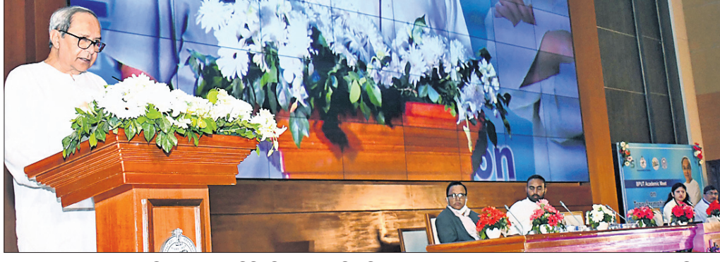
ଲୋକସେବା ଭବନ ସମ୍ମିଳନୀ କକ୍ଷରେ ବିପ୍ଳୟ ଶିଳ୍ପୀଙ୍କୁ ଏକାଡେମିକ ମିଟ୍‌ରେ ପୁଷ୍ପମନ୍ତ୍ରୀ ନବୀନ ପଟ୍ଟନାୟକ ଉଦ୍‌ଘାଟନା ଦେଇଛନ୍ତି।

ଭୁବନେଶ୍ୱର, ୨୭।୧୨(କୁୁରୋ) ଏକବିଂଶ ଶତାବ୍ଦୀରେ ପରିବର୍ତ୍ତନ ପାଇଁ ପ୍ରୟତ୍ନବିଦ୍ୟାଳୁ ଧ୍ୟାନ ଦେବାର ଆବଶ୍ୟକତା ରହିଛି। ପ୍ରଫୁଲ୍ଲବିଦ୍ୟା ଆମ ସମାଜର ପ୍ରତ୍ୟେକ ଅଂଶ ଉପରେ ପ୍ରାଧାନ୍ୟ ବିସ୍ତାର କରୁଛି। ସଭ୍ୟତାର ଭବିଷ୍ୟତ ହିଁ ଶିକ୍ଷାର ଦିଗ ଓ ରୁଣ୍ଡବଳା ଉପରେ ନିର୍ଭର କର ବୋଲି ପୁଷ୍ପମନ୍ତ୍ରୀ ନବୀନ ପଟ୍ଟନାୟକ କହିଛନ୍ତି। ମଙ୍ଗଳାବାର ଲୋକସେବା ଭବନ ସମ୍ମିଳନୀ କକ୍ଷରେ ବିଜୁ ପଟ୍ଟନାୟକ ଯୁକ୍ତିକର୍ତ୍ତା ଅଫ୍‌ଟେକ୍ନୋଲୋଜି(ବିପ୍ଳୟ)ର ଏକାଡେମିକ ମିଟ୍‌ରେ ଯୋଗଦେଇ ପୁଷ୍ପମନ୍ତ୍ରୀ ପଟ୍ଟନାୟକ ‘ନୂତନ ଶିକ୍ଷାନୀତି ୨୦୨୦ରେ ବିଶ୍ୱାସୀ ତଥା ଦୃଢ଼ିତର ଦିଆଯିବ ବୋଲି ଲିଖିତ ଆକାରରେ ମତ ଜଣାଇଥିଲେ। କିନ୍ତୁ ମଧ୍ୟରେ ୧୯୯୪ ଫାଲ୍ ଗଣା ହୋଇଯାଇଥିଲେ ସୁଦ୍ଧା ତଥ୍ୟ ମିଳିନାହିଁ। ବ୍ଲକ୍ କାର୍ଯ୍ୟକ୍ରମରୁ ଫାଇଲ ଗାଏବ ହେବା ଭଲ ଜବାବ ବ୍ଲକ୍ ପ୍ରଶାସନ ଦେବା ଘଟଣା ସାଧାରଣରେ ଅସନ୍ତୋଷ ସୃଷ୍ଟି କରିଛି।