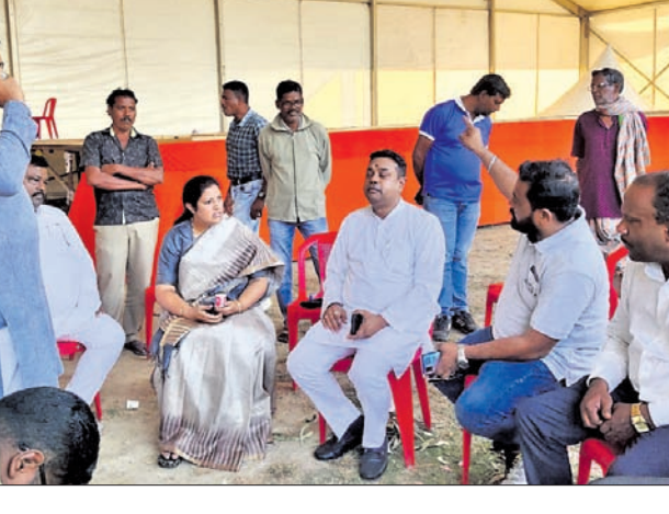
ବାଣପୁର/ଗମ୍ଭୀରାପୁର, ୨୭.୧୨ (ଡି.ଏନ୍.ଏ.):