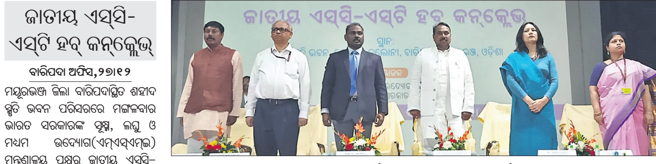
ମୁଖ୍ୟମନ୍ତ୍ରୀ ସିଦ୍ଧିଚନ୍ଦ୍ର ମହାପାତ୍ରଙ୍କ ସମେତ ଅନ୍ୟମାନେ।