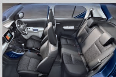
Spacious and Comfortable Interiors