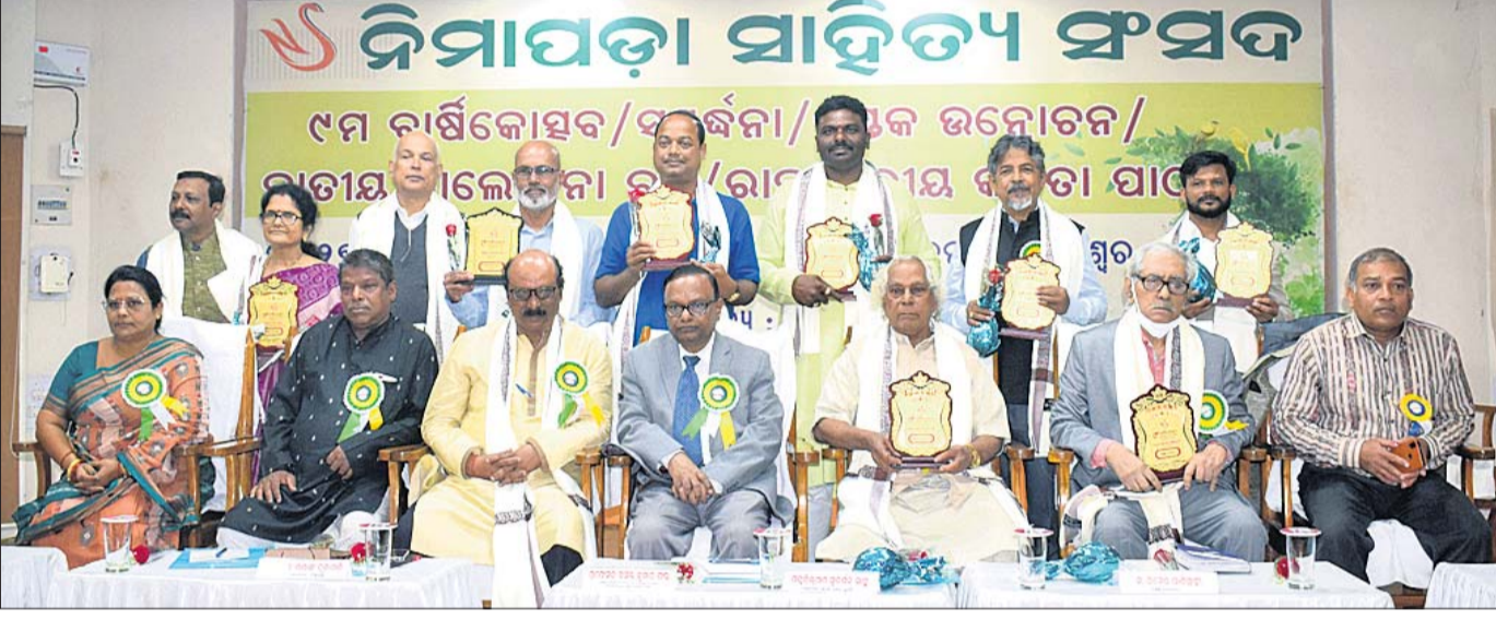
ଭୁବନେଶ୍ୱର ଗୀତଗୋବିନ୍ଦ ସଦନରେ ମଙ୍ଗଳବାର ନିମାପତ୍ତା ସାହିତ୍ୟ ସଂସଦର ବାର୍ଷିକୋତ୍ସବରେ ସମ୍ପର୍କିତ ବ୍ୟକ୍ତିତ୍ୱଙ୍କ ସହ ଅତିଥିମାନେ।

ମାଷ୍ଟରକ୍ୟାଣ୍ଟିନର ଷ୍ଟାଲକିଂ ଫୋର୍ସ ନିୟୋଜିତ କରାଯିବ। ସେହିପରି ପର୍ଯ୍ୟଟନ ସ୍ଥଳୀଗୁଡ଼ିକରେ ଜନଗହଳକୁ ନଜରରେ ରଖି ୧୦ ସେକ୍ଟର ପୋଲିସ୍ ଫୋର୍ସ ମୁତୟନ କରାଯିବ। କାଉଣ୍ଟରଟର ବଜାଜା ପାଇଁ ଖାଲିଗ୍ଲାନରେ ରାତି ୧୦ଟା ଏବଂ ହୋଟେଲ ଆଦିରେ ରାତି ୧୨ଟା ପର୍ଯ୍ୟନ୍ତ ବିଭିନ୍ନ କାର୍ଯ୍ୟକ୍ରମକୁ ଅନୁମତି ଦିଆଯାଇଛି। ଜିଲ୍ଲା ନାଜର କାର୍ଯ୍ୟକ୍ରମରେ ସ୍ୱତନ୍ତ୍ର ପୋଲିସ୍ ନିୟୋଜିତ ରହିବେ ବୋଲି ଡିସିପି ସିଂ କହିଛନ୍ତି। ତେବେ ଏହି ସମୟରେ ସହରରେ ବ୍ରାଉନ୍ସୁଗାର, ବେଆଇନ ମଦ କାରବାର, ଦୁର୍ଗତଚିତ୍ରେ ଗାଡ଼ିଚାଳନା ଉପରେ ବିଶେଷ ନଜର ରଖାଯାଇଛି। ଏଥିପାଇଁ ଶନିବାର ସନ୍ଧ୍ୟାକୁ ମଧ୍ୟ ଭୁବନେଶ୍ୱରରେ ଯାତ୍ର ଆରମ୍ଭ ହୋଇଛି।