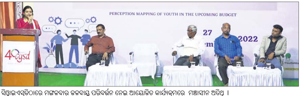
ସିଧାଲସର୍ବଟିରେ ମଙ୍ଗଳବାର ଜଳବାୟୁ ପରିବର୍ତ୍ତନ ନେଇ ଆୟୋଜିତ କାର୍ଯ୍ୟକ୍ରମରେ ମହାସ୍ୱରାଜ୍ୟ ଅତିଥି ।