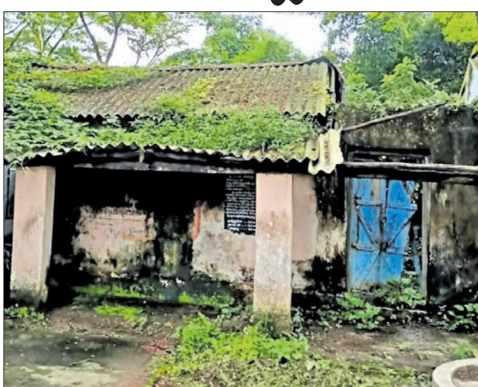
ପଡ଼ିବାକୁ ବାଧ୍ୟ ହେଉଛନ୍ତି ଅଙ୍ଗନୂଡ଼ାତି ଗୃହ ନିର୍ମାଣ ପାଇଁ ୨୦୧୯ରେ ୧୨ ଲକ୍ଷ ଟଙ୍କା ମଞ୍ଜୁର ହୋଇଥିବା ବେଳେ ନୂଆ ଜାଗା ଚିହ୍ନଟ ହୋଇଛି। କିନ୍ତୁ ପ୍ରଶାସନ

ପିଲାମାନଙ୍କୁ ଉନ୍ନତ ଶିକ୍ଷା ଯୋଗାଇ ଦେବା ପାଇଁ ସରକାର ବିଭିନ୍ନ ଯୋଜନା ପ୍ରଣୟନ କରୁଛନ୍ତି। ମାତ୍ର ବିଭାଗୀୟ ଅଧିକାରୀଙ୍କ ଖାମୋଶାଳି ନୀତି ଯୋଗୁଁ ଏସବୁ ଯୋଜନା ଲାଭ ପିଲାମାନେ ଉଠାଇପାରୁନାହାନ୍ତି। ଏହାର ଉଦ୍‌ଘାଟନା ସାଲେପୁର ବ୍ଲକ୍ ଅନ୍ତର୍ଗତ ସତ୍ୟଭାମାପୁର ପଞ୍ଚାୟତର ଗଣେଶ୍ୱରପୁର ପ୍ରାଥମିକ ବିଦ୍ୟାଳୟରେ ଦେଖିବାକୁ ମିଳିଛି। ଏଠାରେ ଚାଲିଥିବା ଅଙ୍ଗନୂଡ଼ାତି କେନ୍ଦ୍ରଗୃହ ବିପଦସଙ୍କୁଳ ହୋଇପଡ଼ିଛି। ଏନେଇ ୭ ବର୍ଷ ହେବ ପିଲାମାନେ ବାରଣ୍ଡାରେ ବସି ପାଠ ପଢୁଛନ୍ତି। ମାତ୍ର ବିଦ୍ୟାଳୟ ଗୃହକୁ ଭାଙ୍ଗି ନୂତନ ନିର୍ମାଣ କରାଯାଇ ନାହିଁ। ଫଳରେ କୁଟି ପିଲାମାନେ ବିଭିନ୍ନ ଅସୁବିଧାର ସମ୍ମୁଖୀନ ହେଉଛନ୍ତି। ଗୃହ ନ ଥିବାରୁ ସେମାନେ ଖରା, ବର୍ଷା ଓ ଶୀତରେ ପାଠ