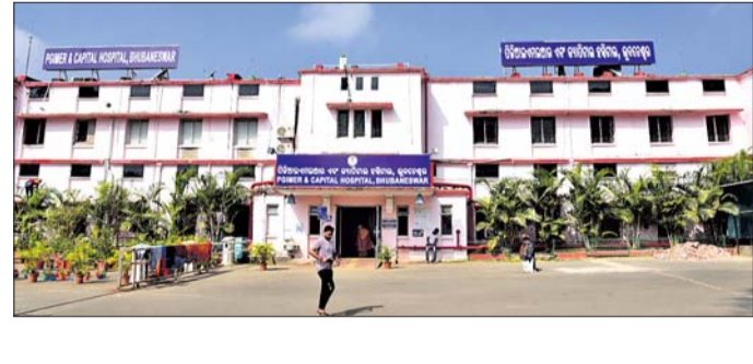
କ୍ୟାମ୍ପିଗାଲ ହସ୍ପିଟାଲରେ ମଙ୍ଗଳବାର ଚିକିତ୍ସା ପାଇଁ କାଉଣ୍ଟରରେ ଲୋକ ଭିଡ।