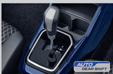
Auto Gear Shift