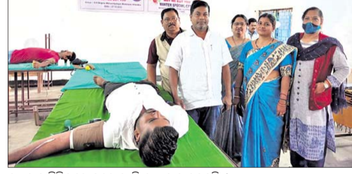
ରତ୍ନଦାନ ଶିବିରରେ ଜଣେ ବ୍ୟକ୍ତି ରତ୍ନ ଦାନ କରୁଛନ୍ତି।

ଦମାଣ୍ଡେ ଥାନା ଅନ୍ତର୍ଗତ ସନାତନ ହରିଚନ୍ଦନ ତ୍ରିଶ୍ରୀ ମହାବିଦ୍ୟାଳୟ ମଦନପୁର ପକ୍ଷରୁ ଜାତୀୟ ସେବା ଯୋଜନାର ଶୀତକାଳୀନ ସ୍ୱତନ୍ତ୍ର ଶିବିର ଆରମ୍ଭ ହୋଇଯାଇଛି। ଏହି ଶିବିର ଗତ ୨୫ରୁ ୩୧ ତାରିଖ ପର୍ଯ୍ୟନ୍ତ ଚାଲିବ। ଏଥିରେ ୧୧୦ ଜଣ ଶିବିରୀଣୀ ଯୋଗ ଦେଇଛନ୍ତି। ଏହି ଉପଲକ୍ଷେ କଲେଜ ପରିସରରେ ମଙ୍ଗଳବାର ଏନ୍.ଏସ୍.ଏସ୍ ପକ୍ଷରୁ ଏକ ରତ୍ନଦାନ ଶିବିର ଆୟୋଜିତ ହୋଇଥିଲା। ଶିବିରରୁ ୬୦ ଯୁବିନୀ ୨୦୦ ଟଙ୍କା ଶିବିରୀଣୀ ଶିକ୍ଷକ ରତ୍ନଦାନ କରିଥିଲେ।