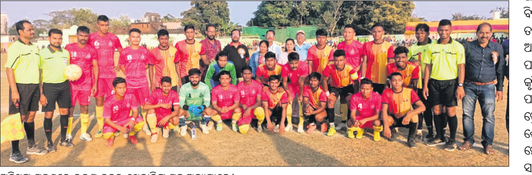
ଅତିଥିକ୍ ଗହଣାରେ ଉଭୟ ଦଳର ଖେଳାଳିଙ୍କ ସହ ଅନ୍ୟମାନେ ।