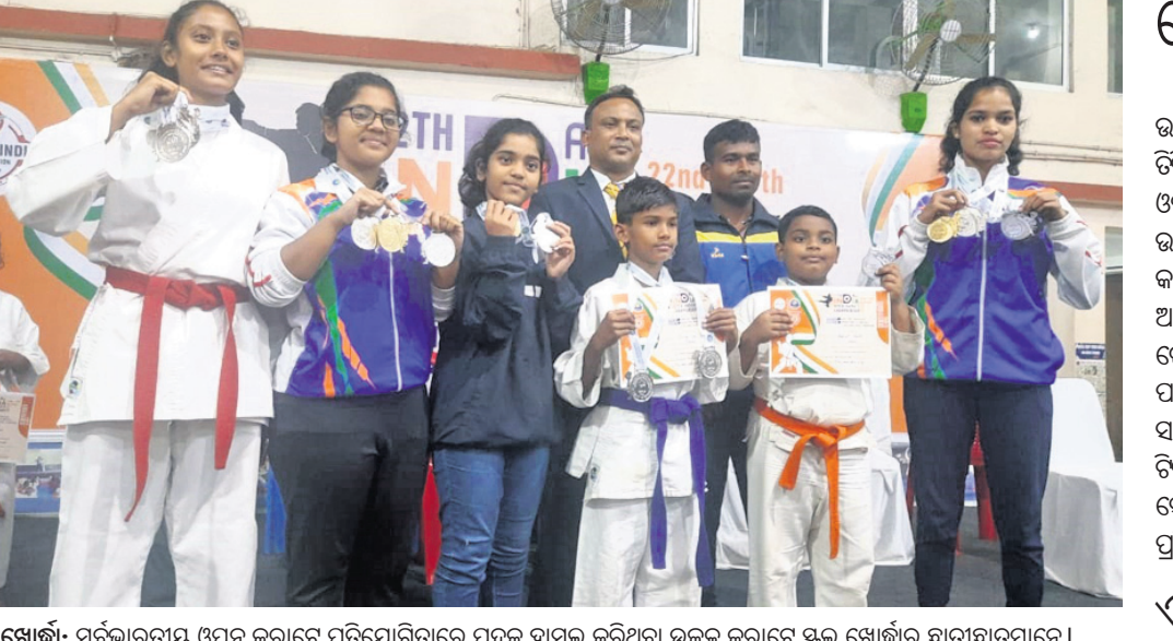
ଖୋର୍ଦ୍ଧା: ସର୍ବଭାରତୀୟ ଓପନ କରାଟେ ପ୍ରତିଯୋଗିତାରେ ପଦକ ହାସଲ କରିଥିବା ଉତ୍କଳ କରାଟେ ସ୍କୁଲ ଖୋର୍ଦ୍ଧାର ଛାତ୍ରଛାତ୍ରୀମାନେ ।