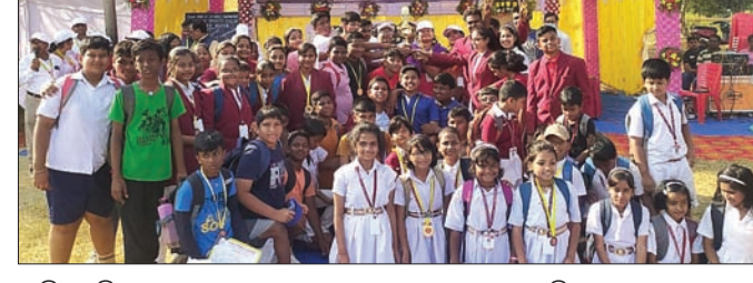
ଗାମ୍ପିୟନ ବିବେକାନନ୍ଦ ହାଉସର ଛାତ୍ରାଛାତ୍ରୀଙ୍କ ସହ ଅନ୍ୟ କୃତୀ ପ୍ରତିଯୋଗୀମାନେ।