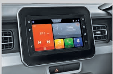
17.78 cm Smartplay Studio (Available from Zeta variant onwards)