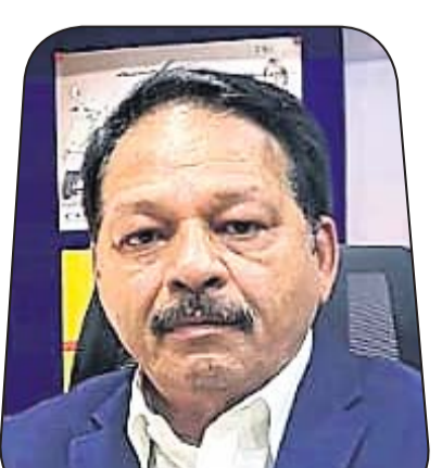
ଜ୍ୟୋତି ସ୍ୱରୂପ ନାୟାର ଯୁନିଟ୍ ରିସୋର୍ସେସ୍ ପ୍ରା.ଲି.