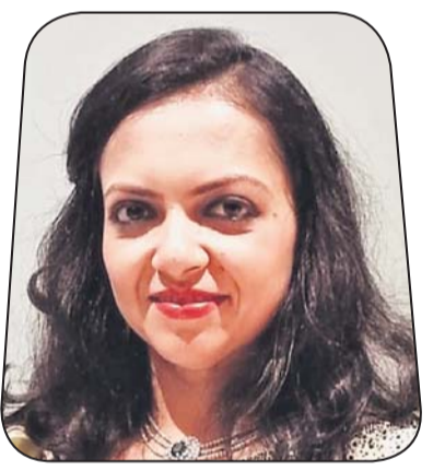
ରୁଚି କଲାନ ଓଡ଼ିଶା ମୋଟର୍ସ ପ୍ରାଇଭେଟ୍ ପ୍ରା.ଲି.