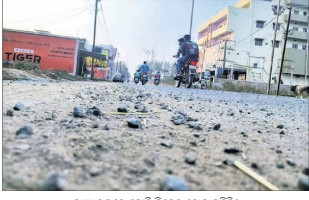
ରାସ୍ତା ଉପରେ ଗୋଡ଼ି ବିଛେଇ ହୋଇ ପଡ଼ିଛି ।

ନିଆଁ ଲଗାଇ ପରିବାର ସହ ବସିଥିଲେ। ହେଲେ ଅସାଧାରଣତା ଯୋଗୁ ତାଙ୍କ ଶାଢ଼ୀରେ ନିଆଁଲାଗି ପୋଡ଼ି ଯାଇଥିଲା। ତାଙ୍କୁ ପ୍ରଥମେ ପାପଡ଼ାହାଣ୍ଡି ଗୋଷ୍ଠୀ ସ୍ବାସ୍ଥ୍ୟକେନ୍ଦ୍ର ଓ ପରେ ଜିଲ୍ଲା ମୁଖ୍ୟ ଚିକିତ୍ସାଳୟକୁ ସ୍ଥାନାନ୍ତର କରାଯାଇଥିଲା।