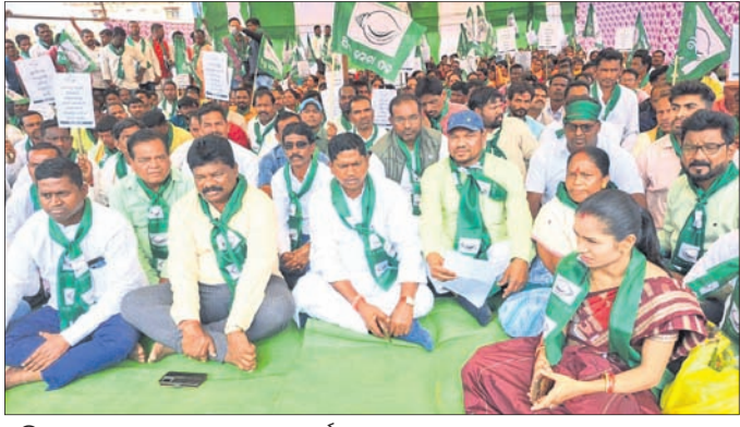
ପ୍ରତିବାଦ ସଭାରେ ଦଳୀୟ ନେତା ଓ କର୍ମୀ । ପ୍ରଦାନ କରିବା ପାଇଁ ବହୁ ବର୍ଷ ହେବ ଦାବି ଉପସ୍ଥାପନା କରାଯାଇଥିଲେ ମଧ୍ୟ କେନ୍ଦ୍ର ସରକାର ଅନୁମତି ଦେଇନାହାନ୍ତି।