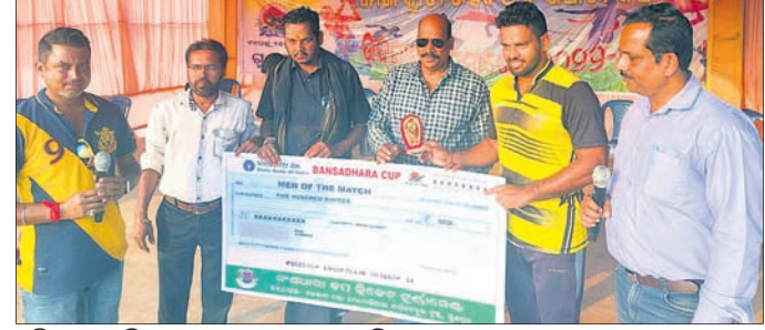
ଅତିଥିମାନେ ବିଜୟୀ ଦଳକୁ ପୁରସ୍କୃତ କରୁଛନ୍ତି ।

ଗୁରୁପୁର, ୨୮.୧୨(ଡି.ଏନ.ଏ.) ରାଉରକେଲା ଜିଲ୍ଲା ଗୁଣଗୁରୁ ମିଳିତ ଶ୍ରୀମନ୍ଦିରରେ ଚାଲିଥିବା ବନ୍ଦୁଖାରା ବଳିକେଟ ଚୁନାବଳୀରେ ରୁଧିରା ପକ୍ଷରୁ ରାଜକିଁ ଶୁଭେଷ୍ଟ କଟକ ଓ ରାଉରକେଲା ମଧ୍ୟରେ ମ୍ୟାଚ ହୋଇଥିଲା । ଏଥିରେ ରାଉରକେଲାକୁ ହରାଇ କଟକ ବିଜୟୀ ହୋଇଛି।