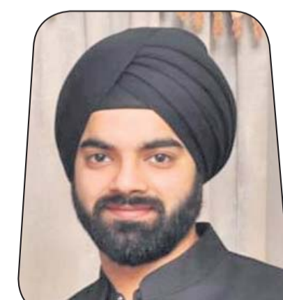
ନଉପାମ୍ ସିଂ ଇନ୍ଦିରା କୁଏଲର୍ସ ପ୍ରା.ଲି.