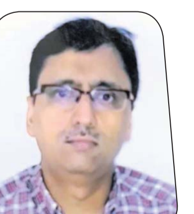
ପୁରେଶା କୁମାର ପୁରେଶା ପୁରେଶା ଗ୍ରୁପ୍ ଅଫ୍ କମ୍ପାନିଜ୍