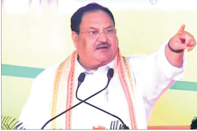
ବାଣପୁର ଭାଜପା ସମାବେଶରେ ରାଷ୍ଟ୍ରୀୟ ଅଧ୍ୟକ୍ଷ ଡ. ପି. ନିଜା ଉଦ୍‌ବୋଧନ ଦେଉଛନ୍ତି ।

ଓଡ଼ିଶା ଗସ୍ତରେ ଆସିଥିବା ଭାଜପା ରାଷ୍ଟ୍ରୀୟ ଅଧ୍ୟକ୍ଷ ଡ. ପି. ନିଜା ରାଜ୍ୟ ସରକାରଙ୍କୁ ବୁଧବାର ବିଭିନ୍ନ ପ୍ରସଙ୍ଗରେ କଡ଼ା ସମାଲୋଚନା କରିଛନ୍ତି । କନ୍ଧମାଳ ଜିଲା ଭୁମୁଡ଼ିବନ୍ଧ ଏବଂ ଖୋର୍ଦ୍ଧା ଜିଲା ବାଣପୁରଠାରେ ଦଳୀୟ ସମାବେଶରେ ଯୋଗଦେଇ ଏଠାରେ ଶାସନ କ୍ରିଏ ଚଳାଉଛନ୍ତି ବୋଲି ପ୍ରଶ୍ନ କରିଛନ୍ତି ।