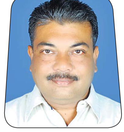
ହର୍ଷବର୍ଦ୍ଧନ ସିଂହଦେଓ ସୋମ୍ ଅଗୋ