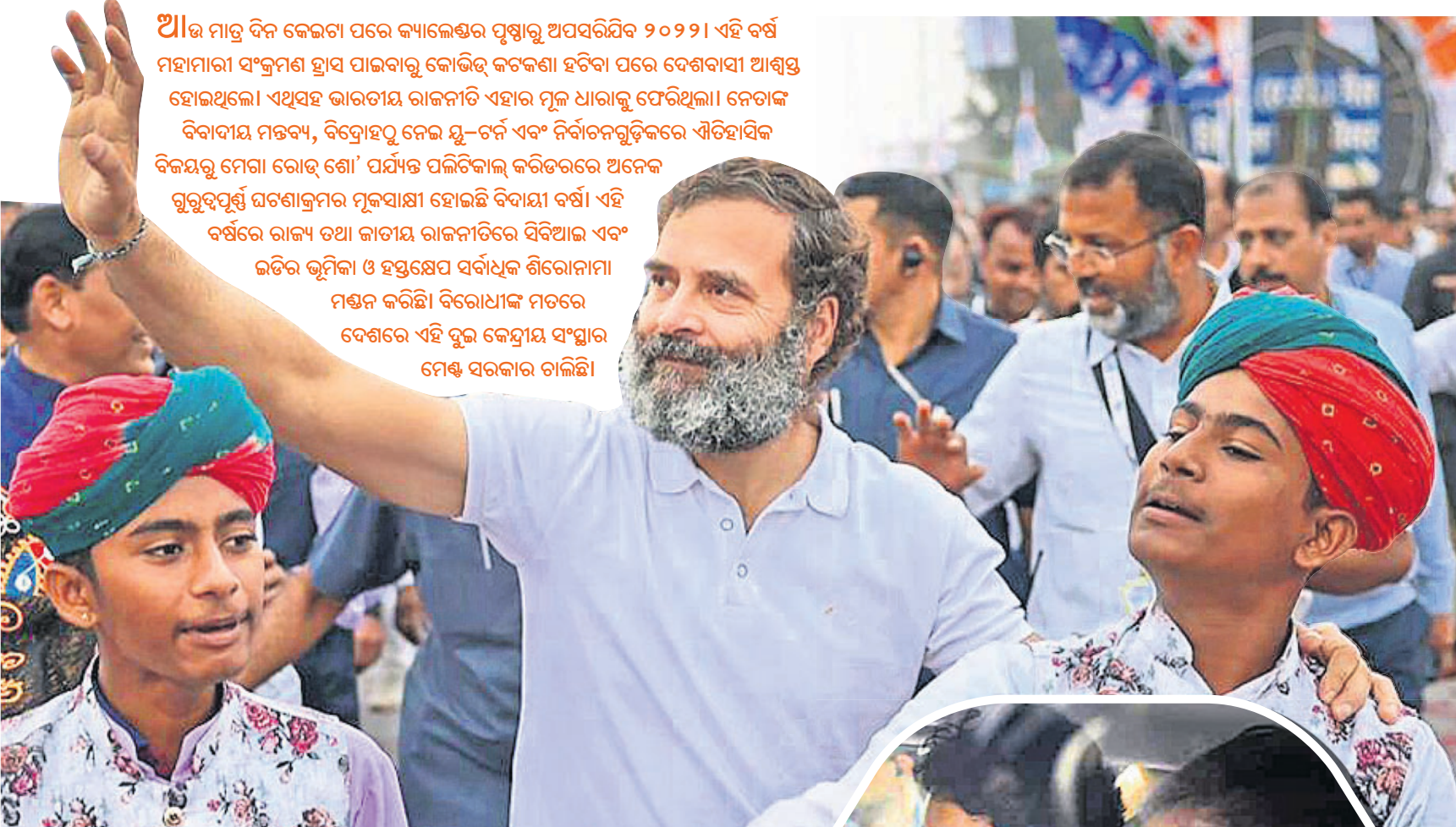
ଆଜ ମାତ୍ର ଦିନ କେଳତା ପରେ କ୍ୟାଲେଣ୍ଡର ପୃଷ୍ଠାକୁ ଅପସରିଯିବ ୨୦୨୨। ଏହି ବର୍ଷ ମହାମାରୀ ସଂକ୍ରମଣ ହ୍ରାସ ପାଇବାକୁ କୋଭିଡ଼ କଟକଣା ହଟିବା ପରେ ଦେଶବାସୀ ଆଶ୍ଚର୍ଯ୍ୟ ହୋଇଥିଲେ। ଏଥିସହ ଭାରତୀୟ ରାଜନୀତି ଏହାର ମୂଳ ଧାରାକୁ ଫେରିଥିଲା। ନେତାଙ୍କ ବିବାଦୀୟ ମତବ୍ୟ, ବିଦ୍ରୋହୀ ନେତା ଯୁ-ଚେନ ଏବଂ ନିର୍ବାଚନଗୁଡ଼ିକରେ ଏତିହାସିକ ବିକଳରୁ ମେଘା ରୋଡ଼ ଶୋ' ପର୍ଯ୍ୟନ୍ତ ପଲିଟିକାଲ୍ କରିଡରରେ ଅନେକ ଗୁରୁତ୍ୱପୂର୍ଣ୍ଣ ଘଟଣାକ୍ରମର ମୂଳସାକ୍ଷୀ ହୋଇଛି ବିବାଦୀ ବର୍ଷ। ଏହି ବର୍ଷରେ ରାଜ୍ୟ ତଥା ଜାତୀୟ ରାଜନୀତିରେ ସିଦ୍ଧିଆଳ ଏବଂ ଇତିର ଭୂମିକା ଓ ହସ୍ତକ୍ଷେପ ସର୍ବାଧିକ ଶିରୋନାମା ମଣ୍ଡନ କରିଛି। ବିରୋଧୀଙ୍କ ମତରେ ଦେଶରେ ଏହି ଦୁଇ କେନ୍ଦ୍ରୀୟ ସଂସ୍ଥାର ମେଣ୍ଟ ସରକାର ଚାଲିଛି।

ଭାରତୀୟ ନେତୃତ୍ୱାଧୀନ କେନ୍ଦ୍ରୀୟ ସରକାର ଦ୍ୱାରା ବିସ୍ତାର, ବିଭାଜନବାଦୀ ଧୂସରୀକରଣ ରାଜନୀତି ଓ ବିରୋଧୀଙ୍କୁ ଚାଲେନ୍ଜିଂ ପାଇଁ ଏକେଡ଼ିଗ୍ରେଡ଼ିକର ହୁକୁମ୍‌ଯୋଗ କରୁଥିବା ଅଭିଯୋଗ ଆଣି ଏହାକୁ ଭଙ୍ଗ କରିବା ଉଦ୍ଦେଶ୍ୟରେ କଂଗ୍ରେସ ଏକ ନୂଆ ଅଭିଯାନ ଚଳାଇଛି। କଂଗ୍ରେସ ନେତା ରାହୁଲ ଗାନ୍ଧୀଙ୍କ ନେତୃତ୍ୱରେ ସେପ୍ଟେମ୍ବର ୨୦ରେ କନ୍ୟାକୁମାରୀ ଆରମ୍ଭ ହୋଇଥିବା 'ଭାରତ ଯୋଡ଼ୋ ଯାତ୍ରା' ଆସନ୍ତା ବର୍ଷ ଜାନୁୟାରୀ ୨୬ ଯାଧାରଣତନ୍ତ୍ର ଦିବସରେ କନ୍ୟାରରେ ଶେଷ ହେବାକୁ ଥିଲା। ତେବେ ଏହି ଯାତ୍ରା ୯ ଦିନ ପାଇଁ ଶୀତକାଳୀନ ଦିବସରେ ନେଇଛି। ଜାନୁୟାରୀ ୩ରେ ପୁଣି ଆରମ୍ଭ ହୋଇ ଉତ୍ତର ପ୍ରଦେଶ, ହରିୟାଣା ଓ ପଞ୍ଜାବ ଦେଇ ଜମ୍ମୁ-କଶ୍ମୀର ଅଭିଯୋଗ ବାହାରିବ। ୧୫୦ ଦିନରେ ୩,୫୦୦ କି.ମି. ପଦଯାତ୍ରା କରିବାକୁ ଧ୍ୟାୟ କରାଯାଇଛି। ଏହି