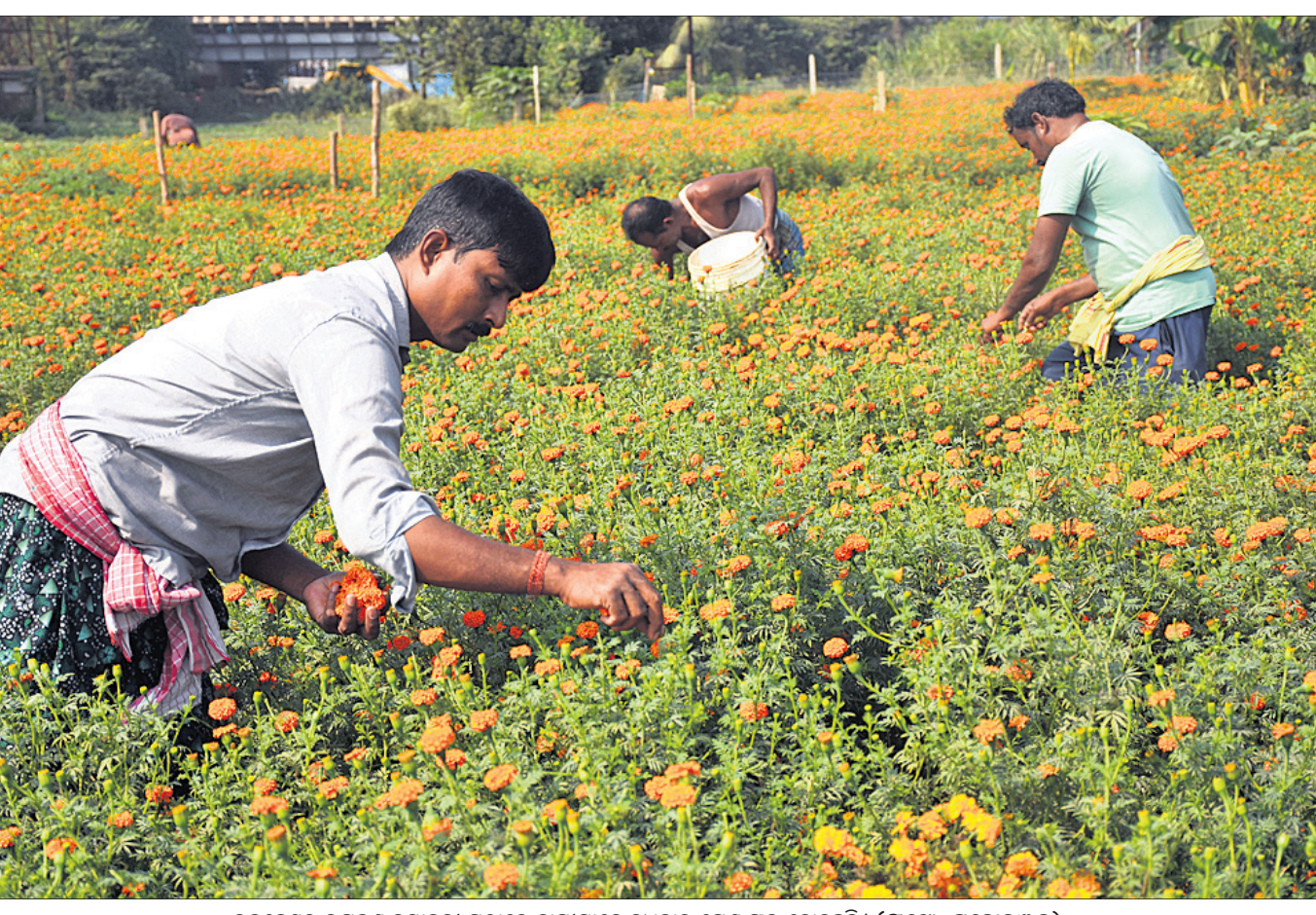
ଭୁବନେଶ୍ୱର ଉପକଣ୍ଠ ଦୟାନଦୀ ପାଠରେ ଚାଷୀମାନେ ବୁଧବାର ଗେଣ୍ଡୁ ଫୁଲ ଚୋରୁଛନ୍ତି ।

ଆଜିର ସମ୍ବାଦକାରୀ ପୁସ୍ତିକ ପ୍ରଦର୍ଶଣ ଓ ବୈଶିକ ବୁଝାମଣା