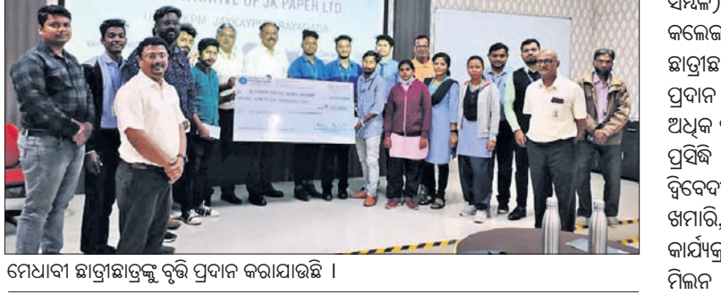
ମେଧାବୀ ଛାତ୍ରୀଛାତ୍ରଙ୍କୁ ବୃତ୍ତି ପ୍ରଦାନ କରାଯାଇଛି ।