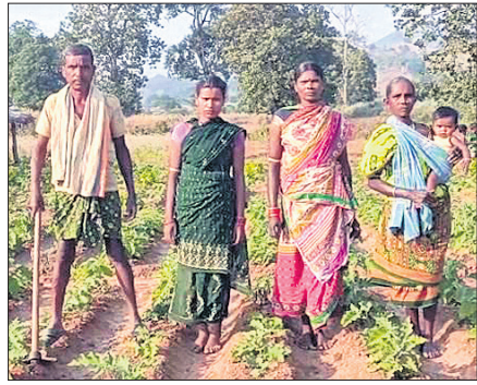
ଚାଷୀ ନିଜ ଉଦ୍ୟମରେ ଚାଷ ଜମିକୁ ପାଣି ଯିବାପାଇଁ ନାଳ କରୁଛନ୍ତି ।