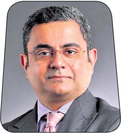
ଶୁଭକାନ୍ତ ପଟ୍ଟା ଇମ୍ପା