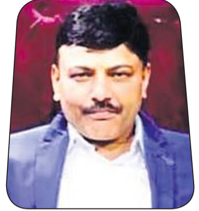
ଇ. ବାବୁରାମ ସ୍ୱାଇଁ କମର୍ସିଆଲ୍ କେମିକାଲ୍