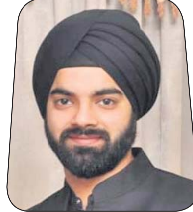
ନନ୍ଦପ୍ରାକ୍ ସିଂ ଇନ୍ଦିଆ କ୍ଲବ୍ ପ୍ରା.ଲି.