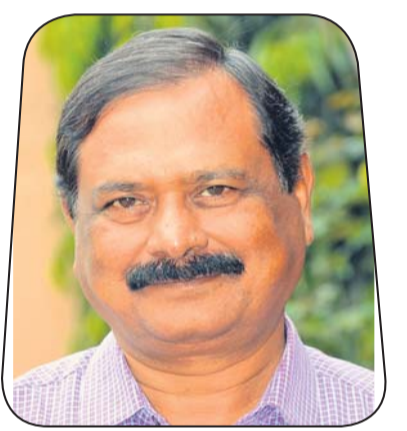
ଡ. ତେଜରାଜ ପାତ୍ର ଚ୍ୟୁନେ ଶାନ୍ତ ସେକ୍ଟୋରିଆଲ୍ ଷ୍ଟୁଲ ଅଫ୍ ସାଇଟ୍