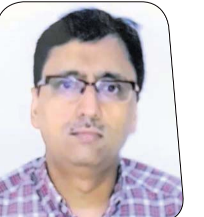
ପୁରେଶା କୁମାର ପୁରେଶା ପୁରେଶା ଗ୍ରୁପ୍ ଅଫ୍ କମ୍ପାନିଜ୍