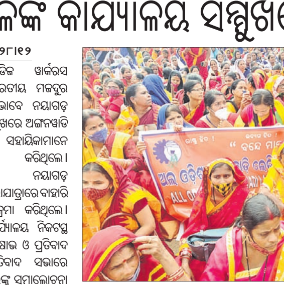
ଜିଲାପାଳଙ୍କ କାର୍ଯ୍ୟାଳୟ ସମ୍ମୁଖରେ ବିକ୍ଷୋଭ କରୁଥିବା ମହିଳାମାନଙ୍କର ଚିତ୍ର।

ନୟାଗଡ଼ ଅଫିସ୍, ୨୮.୧୨.୨୨: ଅଲ ଓଡିଶା ଲେଡିଜ୍ ସଂଘର ଆସିଷ୍ଟେଣ୍ଟ କମିଶନର ଉପସ୍ଥାପନାରେ ଲୋକପାଳଙ୍କ କାର୍ଯ୍ୟାଳୟ ସମ୍ମୁଖରେ ବିକ୍ଷୋଭ କରାଯାଇଛି।