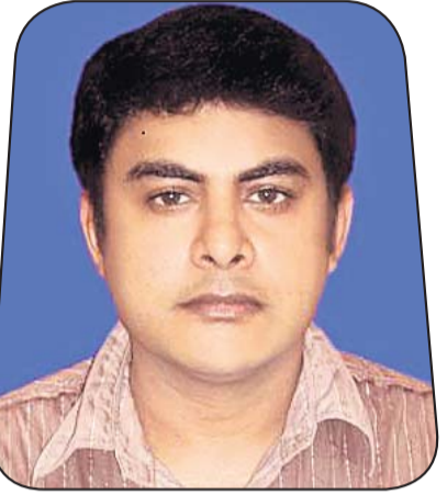
ପ୍ରଦୀପ୍ତ ବହୁଜେନା ମର୍ଚେଣ୍ଟ ଆଗ୍ରି ମୋଟର୍ସ ଆଣ୍ଡ ଟ୍ରାଡିଂ ପ୍ରା.ଲି.