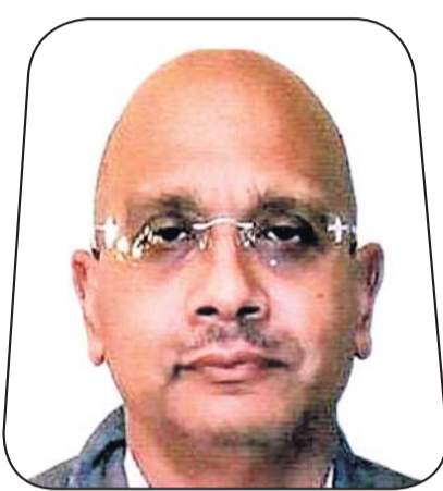
ସୋମଦତ୍ତ ବେହୁରା କେ.ଟି. ଗ୍ଲୋବାଲ ଷ୍ଟୁଲ