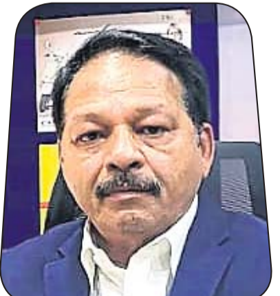
ଜ୍ୟୋତି ସ୍ୱରୂପ ନାୟାର ଯୁନିଟ୍ ରିସୋର୍ସେସ୍ ପ୍ରା.ଲି.