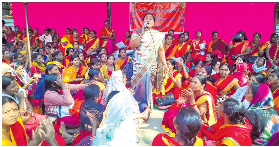
ବଲାଙ୍ଗୀର ଜିଲ୍ଲାପାଳ କାର୍ଯ୍ୟାଳୟ ସମ୍ମୁଖରେ ଜିଲ୍ଲା ଅଜ୍ଞାନଖତି କର୍ମୀ ସଂଘ ପକ୍ଷରୁ ଅନୁଷ୍ଠିତ ପ୍ରତିବାଦ ସଭା।

୮ ଦମ୍ପୀ ଦାଦି ନେଇ ଅଲ୍ ଓଡ଼ିଶା ଅଜ୍ଞାନଖତି ଲେଡିଜ୍ ଖାର୍ଚ୍ଚର ଆୟୋଜନ କରାଯାଇଛି। ଶାଖା ପକ୍ଷରୁ ଶୁକ୍ରବାର ସ୍ଥାନୀୟ ଜିଲ୍ଲାପାଳ କାର୍ଯ୍ୟାଳୟ ଯୋଗାଣ କରାଯାଇଥିଲା।