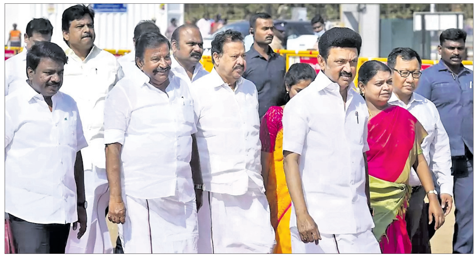
ମହିଳା ବିରୋଧୀ ହିନ୍ଦୀ ବିରୋଧରେ ସଚେତନତା ସୃଷ୍ଟି କରିବା ପାଇଁ ଚେନ୍ନାଇର ମାରିନା ବେଳାଭୂମିରେ ୧୮୧ ମହିଳା ସହାୟକ କେନ୍ଦ୍ର ଦ୍ୱାରା ପ୍ରସ୍ତୁତ ବାଲୁକା ଚିତ୍ରକଳାକୁ ଉଦ୍‌ଘାଟନ କରିବା ଲାଗି ତାମିଲନାଡୁ ମୁଖ୍ୟମନ୍ତ୍ରୀ ଏମ୍.କେ. ଷ୍ଟାଲିନ୍ ଶୁକ୍ରବାର ସେଠାରେ ପହଞ୍ଚିଥିଲେ।

ନୂଆଦିଲ୍ଲୀ, ୩୦.୧୨ ଆସକା ମନ୍ତ୍ର ସଂକ୍ରାନ୍ତି (ଜାନୁୟାରୀ ୧୪) ପରେ ପ୍ରଧାନମନ୍ତ୍ରୀ ନରେନ୍ଦ୍ର ମୋଦି ତାଙ୍କ ମନ୍ତ୍ରିମଣ୍ଡଳ ସମ୍ପ୍ରସାରଣ କରିପାରନ୍ତି ବୋଲି ରାଜନୈତିକ ମହଲରେ କଳ୍ପନା କରାଯାଇ ପ୍ରକାଶ ପାଇଛି।