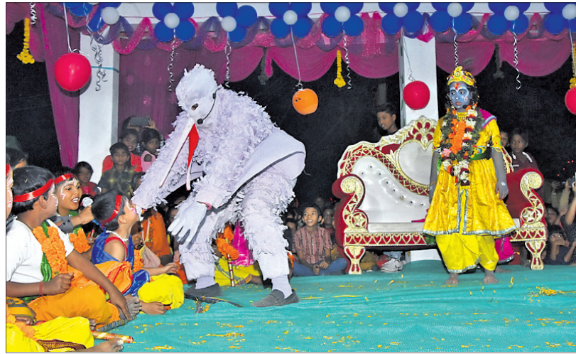
ଗୋପପୁରରେ ବକାସୁର ବଧ ।