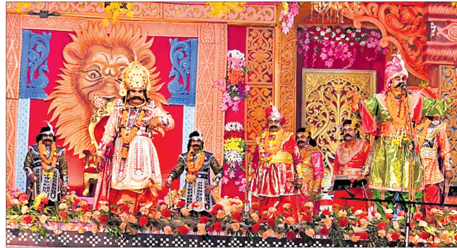
ହାତପଦାସ୍ଥିତ କ୍ୟସ ବରବାର ।