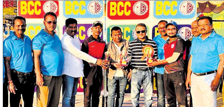
ଶ୍ରେଷ୍ଠ ବ୍ୟାଟ୍ମ୍ୟାନ ଓ ମ୍ୟାଚ ଅଫ୍ ଦି ମ୍ୟାଚ ଖେଳାଳିଙ୍କୁ ଅଭିନନ୍ଦନ ପୁରସ୍କୃତ କରୁଛନ୍ତି।

ଦେବଗଡ଼ ଜିଲ୍ଲାର ଶାନ୍ତି ଷ୍ଟାଡ଼ିୟମରେ ପ୍ରଥମ ଦିନ ମ୍ୟାଚ ଚଳିଥିଲା। ଝାରସୁଗୁଡ଼ା ଦଳ ୧୯ ରନରେ ମ୍ୟାଚ ଜିତିଥିଲା। କଟକ ଦଳ ୧୧ ରନରେ ମ୍ୟାଚ ହରାଇଥିଲା।