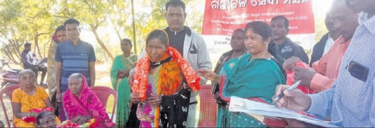
କୁନ୍ଦ୍ରା, ୩୦-୧୨ (ଡି.ଏନ.-ଏ.)

ଏହି ଉଦ୍ଘାଟନରେ ପ୍ରଶଂସା ଅଭ୍ୟାସ କରୁଛନ୍ତି। ଏହି ଉଦ୍ଘାଟନରେ ପ୍ରଶଂସା ଅଭ୍ୟାସ କରୁଛନ୍ତି।