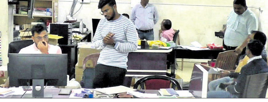
ଜିଏସ୍ଟି ବିଭାଗ ତରଫରୁ ମେଡିକାଲ ଏଜେନ୍ସିରେ ଚଢ଼ାଉ ଚାଲିଛି।

ଝାରସୁଗୁଡ଼ା ଅର୍ଥିଏ, ୩୦.୧୨ ଝାରସୁଗୁଡ଼ା ସହରରେ ଥିବା ଅମିତ ମେଡିକାଲ ଏଜେନ୍ସିରୁ କିଛିଦିନ ତଳେ ଲକ୍ଷାଧିକ ଚଳାଚଳ ନକଲି ମେଡିସିନ ଜବତ ହୋଇଥିଲା।