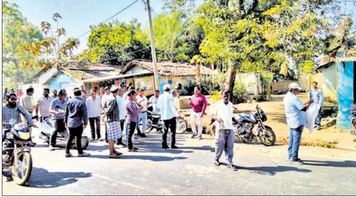
କାତୀୟ ରାଜପଥ ସମ୍ପ୍ରସାରଣ ପାଇଁ ଅଧିକାରୀମାନେ ଜାଗା ଚିହ୍ନଟ କରୁଛନ୍ତି।

କଳାହାଣ୍ଡି ଜିଲ୍ଲା କୋକସରା ବ୍ଲକ୍ ସଦର କୋକସରା ଗ୍ରାମ ଦେଇ ବରଗଡ଼କୁ ଚାଲିଯାଇଛି। ୨୬ ନମ୍ବର ଜାତୀୟ ରାଜପଥ ଯାଇଛି।