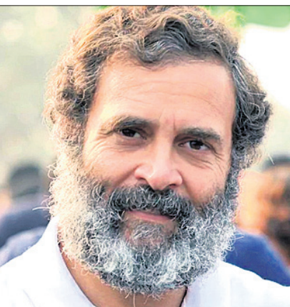
କଂଗ୍ରେସ ନେତା ରାଷ୍ଟ୍ରକୁ ଗାନ୍ଧୀ

ପ୍ରଧାନମନ୍ତ୍ରୀ ପ୍ରାର୍ଥୀ ହେବେ। ବିଶ୍ୱ ଇତିହାସରେ କୌଣସି ନେତା ଏତେଦୀର୍ଘ ପଦଯାତ୍ରା କରିନାହାନ୍ତି।