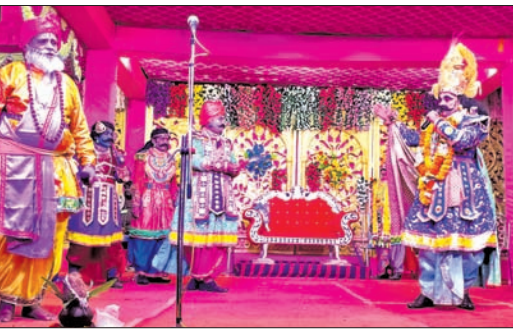
ସପ୍ତମ ସନ୍ଧ୍ୟାରେ କର୍ମସଂସ୍ଥା ଦ୍ଵାରା ପୁରାତନ ମନ୍ତ୍ରୀ ଅନୁରୁଦ୍ଧ ମହାମନ୍ତ୍ରୀ ପଦରେ ଅଭିଷିକ୍ତ ଦୁର୍ଗାଙ୍କୁ ଏକ ଖଣ୍ଡ କରାଯାଇଛି।

ଅନ୍ୟତମ ସମ୍ମାନିତ ଅତିଥି ଭାବେ ଯୋଗଦେଇ ବଲାଙ୍ଗୀର ଜିଲ୍ଲାର ଉପାଧ୍ୟକ୍ଷ ଲୀଠରେ ଅଞ୍ଚଳର ବିଭିନ୍ନ ଦିଗରୁ ଆସିଥିବା ସମସ୍ତ ଲୀଠ ଡିଷ୍ଟ୍ରିକ୍ଟର ଅଧିକାରୀଙ୍କୁ ସମ୍ମାନିତ କରିଥିବା ସହରସ୍ଥିତ ଗୋଦାମରେ ସକାଳେ ଜିଏସ୍ଟି ବିଭାଗ ପକ୍ଷରୁ ଚକ୍ରାନ୍ତ କରାଯାଇଛି।