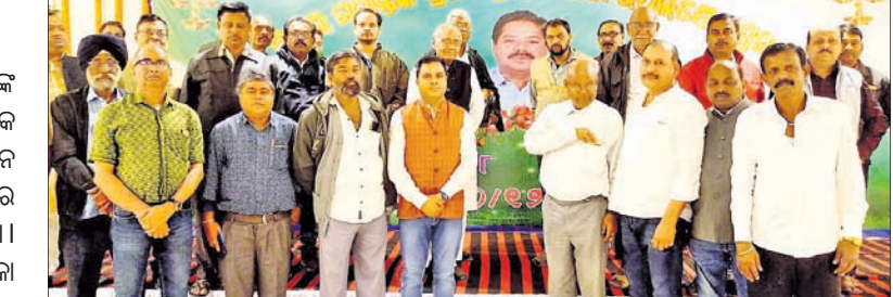
ପ୍ରାର୍ଥନା ସଭାରେ ଯୋଗଦେଇଥିବା କର୍ମକର୍ତ୍ତା।

ପୂର୍ବତନ ବାଚସ୍ପତି ସ୍ବର୍ଗତ କିଶୋର ମହାନ୍ତିଙ୍କ ପ୍ରତି ଆଜି ସର୍ବଧର୍ମ ପ୍ରାର୍ଥନା ଅନୁଷ୍ଠିତ ହେଲା।