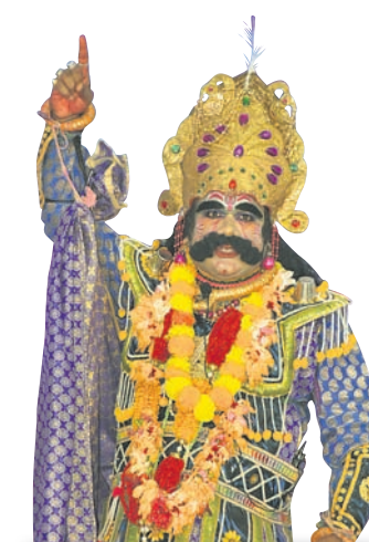
ଆଜିର ଆକର୍ଷଣ ୩୧।୧୨।୨୨ (ଶନିବାର) ମଥୁରାନଗରୀ କ୍ୟସ ମହାରାଜଙ୍କ ଗୃହଗୀରା ଅଞ୍ଚଳରେ ବିଗ୍ରହବନ୍ଧନ, ରାକ୍ଷସୀ ରାକ୍ଷସଙ୍କ ନିଧନ ଖବର ପାଇଁ କ୍ୟସ ମର୍ମାହତ, ପାରିଷଦ ବର୍ଗଙ୍କ ସହିତ ଆପାତ ବୈଠକ ।

ହୋଇପଡ଼ିଛି । ଏଭଳି ସ୍ଥିତି ଧୂଳିଠା ମେଣ୍ଟିନ ଗାଡ଼ି ବ୍ୟବହାର ସହିତ ନିୟମିତ ଦୁଇଓଢି ପୁଖ୍ୟରାସ୍ତ୍ରା ଗୁଡ଼ିକରେ ଯଥା ଯମୁନା ନଦୀ ଫେରାଦେବତା ରାସ୍ତାରେ ପାଣି ସିଞ୍ଚନ କରାଯାଉ ବୋଲି ଉଭୟ ମଥୁରା, ଗୋପବାସୀ ଦାବି କରିଛନ୍ତି ।