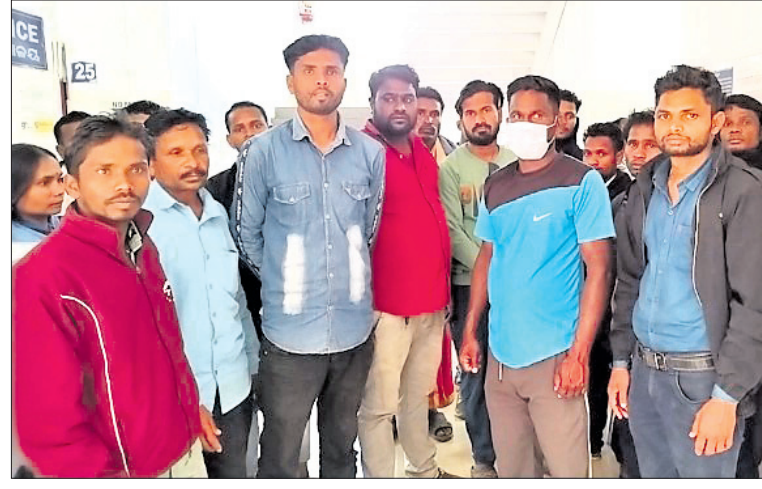
ଶିଶୁ ମୃତ୍ୟୁର ପ୍ରତିବାଦ କରୁଛନ୍ତି ଗ୍ରାମବାସୀ ।

ଜିଲ୍ଲା ମୁଖ୍ୟ ଚିକିତ୍ସାଳୟରେ ଉଦ୍ଧେଜନା ଜିଲ୍ଲା ମୁଖ୍ୟ ଚିକିତ୍ସାଧିକାରୀ ଦେଲେ ତଦତ୍ତ ନିର୍ଦ୍ଦେଶ କରପୁର, ୩୦.୧୨(ନି.ପ୍ର.)