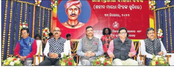
ରାଜ୍ୟସ୍ତରୀୟ ଉତ୍ସବରେ ମଞ୍ଚାସୀନ ଅତିଥିଗଣ।

ମାଧୋ ସିଂଙ୍କ ମଧ୍ୟରେ ସଂଘଟିତ ମୁକ୍ତରେ ବିଦ୍ରୋହୀମାନେ କ୍ୟାପଟେନ୍ ଉତ୍ତରକୁ ଥିଲେ । ବୀର ସୁରେନ୍ଦ୍ର ସାଧକ ପଦାଳ ଅନୁସରଣ କରି ସେ କାବନର ଶେଷ ମୁହୂର୍ତ୍ତ ପର୍ଯ୍ୟନ୍ତ ସଂଘର୍ଷ ଚଳାଇଥିଲେ । ମାତୃଭୂମିର ସ୍ୱାଧୀନତା ରକ୍ଷା ପାଇ ସେ ବିଦ୍ରୋହୀ ପାଇଥିଲେ । ୧୮୫୭ ଡିସେମ୍ବରରେ ସଂଗୋଡ଼ା ଘାଟିରେ ଇଂରେଜ ବାହିନୀ ଓ