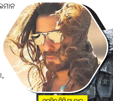
ଚଳଚ୍ଚିତ୍ର ବିସି କା ଭାବ ବିସି କି କାନ୍