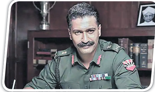
ଚଳଚ୍ଚିତ୍ର ସାମ୍ ବାହାଦୁର