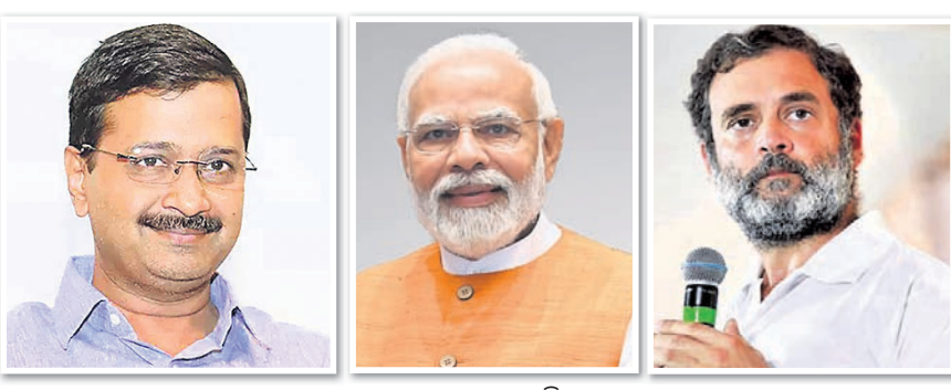
ଅରବିନ୍ଦ କେକ୍‌ରିପାଲ୍, ନରେନ୍ଦ୍ର ମୋଦି, ରାହୁଲ ଗାନ୍ଧୀ

ମହାତ୍ମା ଆତ୍ମଜ୍ଞ, ପୂଜ୍ୟାଚାର୍ଯ୍ୟ କମ୍ପାଲେକ୍ସ, ମାନ୍ୟତା ଚିହ୍ନ ଓ ଭୂଷଣ-ପୁରସ୍କାର ଲାଭ କରିବା ପାଇଁ ନବବର୍ଷକୁ ସ୍ୱାଗତ କରିଛନ୍ତି । ବିଲିୟନ ବିଶ୍ୱାସୀ । ଭୂଷଣୀୟ ମୁଖ୍ୟ ଯୋଗୁ ପୂଜ୍ୟାଚାର୍ଯ୍ୟ ଅଭିନନ୍ଦନା ଦେଇ ଗତି କରୁଥିବାବେଳେ ଭାରତ ପ୍ରଭାବଶୂନ୍ୟ ହୋଇ ରହିନାହିଁ । ଏହି ପରିପ୍ରେକ୍ଷାରେ ନୂଆବର୍ଷ ଆସିଛି ଅନେକ ସମ୍ଭାରନା ଓ ଆହ୍ୱାନ ନେଇ । ୨୦୨୩ରେ ରାଜସ୍ଥାନ, ଛତିଶଗଡ଼, ମଧ୍ୟପ୍ରଦେଶ, କର୍ନାଟକ, ତେଲଙ୍ଗାନା, ତ୍ରିପୁରା, ମେଘାଳୟ, ନାଗାଲାଣ୍ଡ ଓ ମିଜୋରାମରେ ବିଧାନସଭା ନିର୍ବାଚନ ହେବାକୁ ଯାଉଛି । ୨୦୧୯ ଅଗଷ୍ଟ ୫ରେ ସମ୍ବିଧାନର ଅନୁଚ୍ଛେଦ ୩୭୦ ଉଚ୍ଛେଦ ହେବା ପରେ ନୂଆବର୍ଷରେ କେନ୍ଦ୍ରଶାସିତ ଅଞ୍ଚଳ କମ୍ପ୍ୟୁ-କମ୍ପାନୀରେ ମଧ୍ୟ ପ୍ରଥମ ଥର ପାଇଁ ବିଧାନସଭା ଭୋଟ ହୋଇପାରେ । ଏସବୁକୁ ରାଜନୈତିକ ପଞ୍ଜିତମାନେ ୨୦୨୪ ଲୋକ ସଭା ନିର୍ବାଚନ ପୂର୍ବରୁ ସେମିପାଇଲାଇ ବୋଲି ଅଭିହିତ କରୁଛନ୍ତି । ତେଣୁ କେନ୍ଦ୍ରରେ କ୍ଷମତାସୀନ ଭାଜପା ଅଧିକାରୀଙ୍କୁ ରାଜ୍ୟ ଦଖଲ ପାଇଁ ଯଥାସାଧ୍ୟ ଉଦ୍ୟମ କରିବ । ହିମାଚଳ ପ୍ରଦେଶ ବିଧାନସଭାକୁ ଭାଜପା ହାତକୁ ଛଡ଼ାଇ ନେବା ପରେ ବିରୋଧୀ କଂଗ୍ରେସ ଶିବିରରେ ନୂଆ ଆଶା ଉଜ୍ଜୀବିତ ହୋଇଥିବାବେଳେ ପୂର୍ବତନ ଅଧ୍ୟକ୍ଷ ରାହୁଲ ଗାନ୍ଧୀଙ୍କ 'ଭାରତ ଯୋଡ଼ା ଯାତ୍ରା' ବଳକୁ ବଳ ଯୋଗାଇଛି । କଂଗ୍ରେସ ଆଗକୁ କେହି ରାଜ୍ୟରେ ସରକାର ଗଢ଼ିବାରେ ସକ୍ଷମ ହେଉଛି ତାହା ଉପରେ ନଜର ରହିବ ।