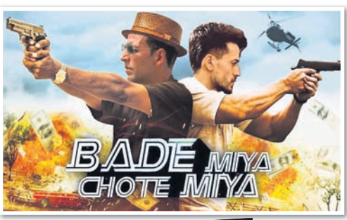
ବଡେ ମିଆଁ ଛୋଟେ ମିଆଁ