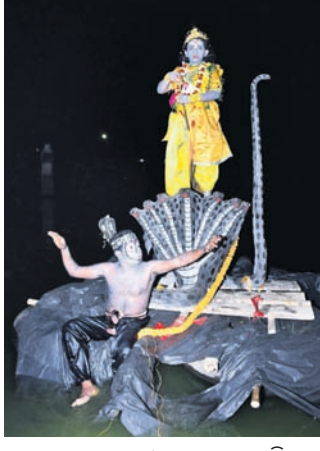
ଗୋପପୁରରେ କାଳୀୟ ଦଳନ ଦୃଶ୍ୟାଭିନୟ କରିଥିଲେ । ନାଟଗୀତରେ ମସୃଣୁଲ ହେବା ପରେ ମହାରାଜ କଂସ ହାତପଦସ୍ଥିତ

ରାଜଦରବାରକୁ ଯାଇଥିଲେ ଏବଂ ଗୋପପୁର ପ୍ରେରିତ ରାକ୍ଷସୀ, ରାକ୍ଷସକ ନିଧନ ନେଇ ପାରିଷଦ ବର୍ଗଙ୍କ ସହିତ ଆପାତ ବୈଠକ କରିଥିଲେ । ଅନ୍ୟପଟେ ଗୋପାଳନାମାରେ ଯମୁନା ପାରି ହୋଇ ମଥୁରାକୁ ବହି ବିକିବାକୁ ଯାଇଥିଲେ । ଗୋପପୁରରେ ଶ୍ରୀକୃଷ୍ଣ ଓ ବଳରାମ ଗୋପାଳ ବାଳକ, ଗୋପବାସୀଙ୍କ ଗହଣରେ ନଗର ପରିକ୍ରମା କରିଥିଲେ । ପରେ ଶ୍ରୀକୃଷ୍ଣ, ବଳରାମ ଜିରା ନଦୀ କୂଳ ବେଶୁବାବା ମଠକୁ ଯାଇଥିଲେ । ସେଠାରେ ସ୍ୱତନ୍ତ୍ର ପୂଜାର୍ଚ୍ଚନା କରାଯାଇଥିଲା । ବେଶୁବାବାଙ୍କ ମଠ ସମ୍ମୁଖରେ ଦଧିଭାଣ୍ଡ ଭଙ୍ଗା, ଶ୍ରୀକୃଷ୍ଣଙ୍କୁ ଯଶୋଦାଙ୍କ ଆକର୍ଷଣ, ଯାମଳାକୁଁଜ ଭଞ୍ଜନ, ଶ୍ରୀକୃଷ୍ଣଙ୍କୁ ବ୍ରହ୍ମାଙ୍କ ବଂଶୀ ପ୍ରଦାନ ପରେ କାଳିନ୍ଦୀ ହ୍ରଦରେ କାଳୀୟ ଦଳନ ଦୃଶ୍ୟାଭିନୟ ହୋଇଥିଲା ।