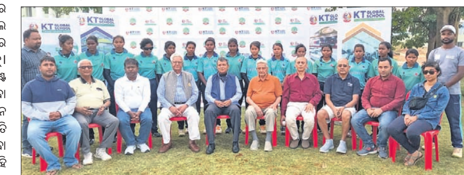
ଜାତୀୟ ଦୃଷ୍ଟି ବାଧୁତ ମହିଳା ଟି୨୦ ପାଇଁ ମନୋନୀତ ଓଡ଼ିଶା ଖେଳାଳିମାନେ କର୍ମକର୍ତ୍ତାଙ୍କ ସହ ଗହଣରେ।

କ୍ରୁନେଶ୍ୱର, ୨୧ (କ୍ରୀଡ଼ା ପ୍ରତିନିଧି) ବେଙ୍ଗାଳୁରୁଠାରେ ଚଳିତମାସ ୯ରୁ ୧୩ ପର୍ଯ୍ୟନ୍ତ ହେବାକୁଥିବା ଜାତୀୟ ଦୃଷ୍ଟିବାଧୁତ ମହିଳା ଟି୨୦ କ୍ରିକେଟ୍ ଚୁନାବେଳେ ପାଇଁ ସୋମବାର ଓଡ଼ିଶା ଦଳ ଘୋଷଣା କରାଯାଇଛି। ଏଥିପାଇଁ ଓଡ଼ିଶା ଦୃଷ୍ଟିବାଧୁତ କ୍ରିକେଟ୍ ଆସୋସିଏଶନ (କାଭି) ପକ୍ଷରୁ ଡିସେମ୍ବର ୨୭ରୁ ୩୧ ପର୍ଯ୍ୟନ୍ତ ୨୦ ଜଣ ଖେଳାଳିଙ୍କୁ ନେଇ ଏକ ଚୟନ ଗ୍ରାଧିକାର ଆୟୋଜନ କରାଯାଇଥିଲା। ଏଥିରେ ପ୍ରଦର୍ଶନ ଭିତ୍ତିରେ ୧୪ ଜଣିଆ ଦଳ ମନୋନୟନ କରାଯାଇଥିଲା। ଓଡ଼ିଶା ଦଳର କ୍ୟାପ୍ଟି ଏବେ କେଟି ଗ୍ଲୋବାଲ୍ ସ୍କୁଲ ପରିସରରେ ଚାଲିଛି। ଏହା ୬ ଚାରିଖ ପର୍ଯ୍ୟନ୍ତ ଚାଲିବ। ୬ ଚାରିଖରେ ଓଡ଼ିଶା ଦଳ ବେଙ୍ଗାଳୁରୁ