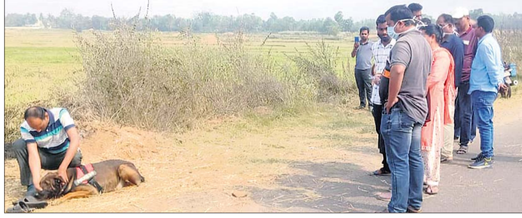
ସମାଜ କୁକୁର ସହାୟତାରେ ଚନ୍ଦ୍ର କରାଯାଇଛି ।

ପୁରୁଷୋତ୍ତମପୁର/ ଗଞ୍ଜାମ, ୨୧ (ଡି.ଏନ୍.ଏ.) ଗଞ୍ଜାମ ଜିଲ୍ଲା ରକ୍ଷା ଥାନା ଅନ୍ତର୍ଗତ ପୁରୁଷୋତ୍ତମପୁର-ଖୁମ୍ବା ପୁଖ୍ୟାସ୍ତ୍ରୀୟ ଚାଳୁଆବାଡ଼ି ଗ୍ରାମ ନିକଟ ଏକ ଧାନ ବିଲରୁ ସୋମବାର ଜଣେ ବ୍ୟକ୍ତିଙ୍କ ଅର୍ଦ୍ଧଦଗ୍ଧ ମୃତଦେହ ପୋଲିସ୍ ଜବତ କରିଛି । ମୃତକଙ୍କ ପରିଚୟ ମିଳି ନ ଥିବା ବେଳେ ତାଙ୍କୁ ହତ୍ୟା କରାଯାଇଛି କି ସେ ଆତ୍ମହତ୍ୟା କରିଛନ୍ତି ତାହା ସନ୍ଦେହଯୋଗରେ ରହିଛି । ରାସ୍ତାକଡ଼ ଜମିରେ ଅର୍ଦ୍ଧଦଗ୍ଧ ମୃତଦେହ ପଡ଼ିଥିବା ସକାଳେ ଗ୍ରାମୀଣ ଲୋକେ ଦେଖିଥିଲେ । ଉକ୍ତ ଗ୍ରାମୀଣ ପୁରୁଷୋତ୍ତମପୁର ଓ ରକ୍ଷା ମଧ୍ୟସ୍ଥ କରାଯାଇଥିବା ଉକ୍ତ ଧାନ କାଳୁଆବାଡ଼ି ଗ୍ରାମ ନିକଟ ଏକ ଧାନ ବିଲରୁ ସୋମବାର ଜଣେ ବ୍ୟକ୍ତିଙ୍କ ଅର୍ଦ୍ଧଦଗ୍ଧ ମୃତଦେହ ପୋଲିସ୍ ଜବତ କରିଛି । ମୃତକଙ୍କ ପରିଚୟ ମିଳି ନ ଥିବା ବେଳେ ତାଙ୍କୁ ହତ୍ୟା କରାଯାଇଛି କି ସେ ଆତ୍ମହତ୍ୟା କରିଛନ୍ତି ତାହା ସନ୍ଦେହଯୋଗରେ ରହିଛି । ରାସ୍ତାକଡ଼ ଜମିରେ ଅର୍ଦ୍ଧଦଗ୍ଧ