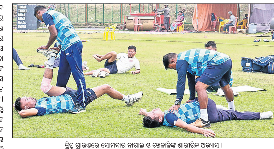
କ୍ରୀଡ଼ା ଗ୍ରାଉଣ୍ଡରେ ସୋମବାର ନାରୀଲାଣ୍ଡ ଖେଳାଳିଙ୍କ ଶାରୀରିକ ଅଭ୍ୟାସ।