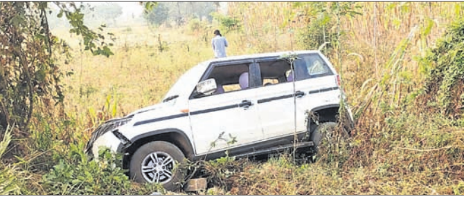
ରାତ୍ରୀ ତଳକୁ ଖସିପଡ଼ିଥିବା କାର ।

ହୋଇ ପଡିଥିଲେ। ଗ୍ଲାନାୟ ଲୋକେ ବ୍ରହ୍ମପୁରରୁ ଗଜପତି ଜିଲ୍ଲା ମୋହନା ଅଭିମୁଖେ ଯାଉଥିବା ବେଳେ ବିପରୀତ ଦିଗରୁ କୋରାପୁଟରୁ ବ୍ରହ୍ମପୁର ଆସୁଥିବା କାର (ଓଡ଼ିଶା୦୮୫୪୪୫୫) ଧକ୍କା ଦେଇଥିଲା। ଫଳରେ ଅବିନାଶ ଏକ ଗଛରେ ପଡି ହୋଇ ତେତାଣୁମ୍ୟ