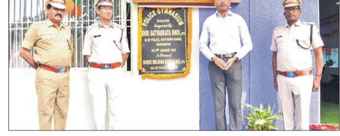
ଜିମ୍ ଉଦ୍‌ଯାପନ କରାଯାଇଛି ।