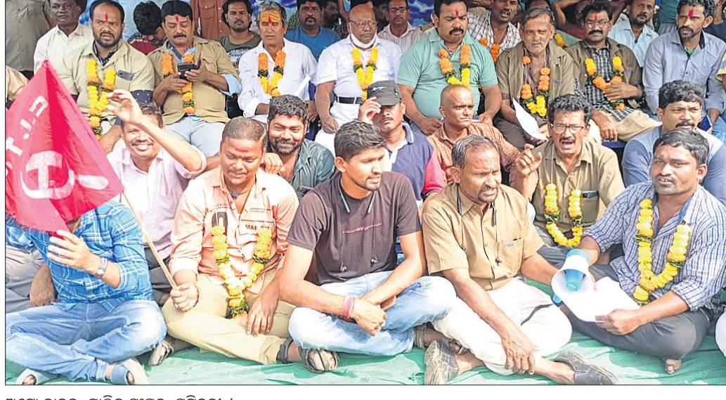
ଅଗୋ ଚାଳକ, ମାଲିକ ସଂଘର ସମିକଳନ ।