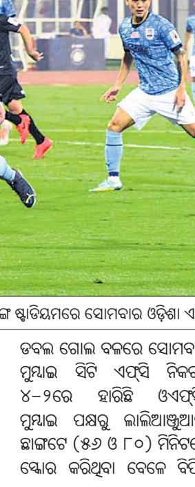
କଳିଙ୍ଗ ଷ୍ଟାଡ଼ିୟମରେ ସୋମବାର ଓଡ଼ିଶା ଏଫ୍‌ସି ଓ ମୁ୍ୟାଇ ସିଟି ଏଫ୍‌ସି ମଧ୍ୟରେ ଅନୁଷ୍ଠିତ ମ୍ୟାଚ୍।