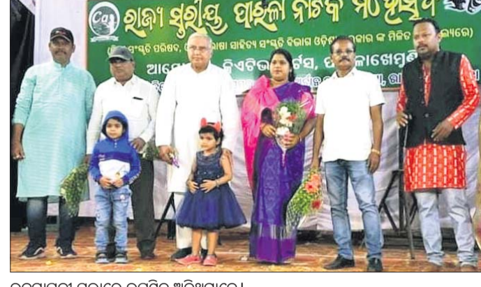
ଉଦ୍‌ଯାପନା ସଭାରେ ଉପସ୍ଥିତ ଅତିଥିମାନେ ।