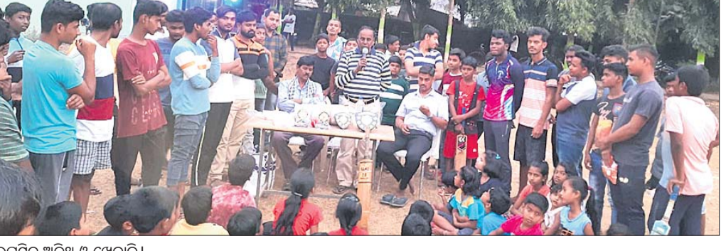
ଉପସ୍ଥିତ ଅତିଥି ଓ ଖେଳାଳି ।

ବୁଦ୍ଧପୁର, ୨୧ (ଡି.ଏନ୍.ଏ.) ବୁଦ୍ଧପୁର ବୁକ୍ ତାଳଶାଳାରେ ନବବର୍ଷ ପାଳନ ଉପଲକ୍ଷେ ଏକ ଗ୍ରାମାଞ୍ଚଳସ୍ତରୀୟ କ୍ରିକେଟ ଚୁର୍ଣ୍ଣମେଣ୍ଡ ଅନୁଷ୍ଠିତ ହୋଇଯାଇଛି । ପାଳନାଳ ମ୍ୟାଚ୍ ତାଳଶାଳାରେ ସୁପରସିକ୍ସ ଓ ରୟଲ୍