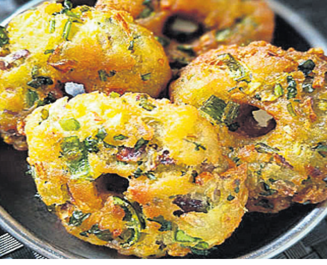
ଧନିଆଁ ଚଟଣି ସହ ପରଷିପାରିବେ ।

ସାମଗ୍ରୀକୁ ଭଲଭାବେ ମିଶାଇ ଦିଅନ୍ତୁ । ଏହା ଭଲଭାବେ ମିଶିଲା ପରେ ତାକୁ ନେଇ ଗୋଲକରି ହାତରେ ଚିକେ ଚାପି ତେପନା କରି ସେଥିରେ ଆଣ୍ଡୁ ପାହାନ୍ତରେ ଏହା ମଝିନ୍ତୁ କଣା କରି ରଖନ୍ତୁ । ଏହିପରି ଅନ୍ୟ ବରା ସବୁକୁ ତିଆରି କରନ୍ତୁ । ଏବେ ଗ୍ୟାସ୍ ବୁଲାଇ କଡେଇ ରଖନ୍ତୁ । ତାତକାଳ ପରେ ସେଥିରେ ତେଲ ଗରମ କରନ୍ତୁ । ସେଥିରେ ଗୋଟିଏ ଗୋଟିଏ ବରାକୁ ତେଲରେ ପକାଇ ତାକୁ ଛାଣିନ୍ତୁ । ଏବେ ଏହି ବରାକୁ ଧନିଆଁ ଚଟଣି ସହ ପରଷିପାରିବେ ।