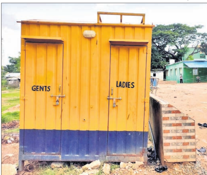
ଭ୍ରାମ୍ୟମାଣ ଶୌଚାଳୟ ।

ବୁରୁଡ଼ା ସହରର ଦୁଇଟି ସ୍ଥାନରେ ଏନ୍.ଏସି ପକ୍ଷରୁ ରଖାଯାଇଥିବା ଭ୍ରାମ୍ୟମାଣ ଶୌଚାଳୟ ପ୍ରସ୍ତୁତ ପାଇଁ ଦେଉଳି ଉର୍ଦ୍ଧ୍ୱ ହେଲା ଲୋକ ଦେଖାଣିଆ ଥିଆ ହେଇଛି ତାଲା ଖୋଲାଯାଉଛି। ଫଳରେ ଲୋକେ ପୂର୍ବରୁ ଯେଉଁ ରାସ୍ତା କଡ଼ରେ ପରିସ୍ରା କରୁଥିଲେ ଏବେ ସେମିତି ହିଁ ପରିସ୍ରା କରିବାକୁ ବାଧ୍ୟ ହେଉଛନ୍ତି। ଏମିତି ଦୃଶ୍ୟ ଦେଖିବାକୁ ମିଳିଛି ବୁରୁଡ଼ା ସହରରେ। ସହରର ପଞ୍ଚା ଗଳି ଓ ପ୍ରାଣୀ ଚିକିତ୍ସାଳୟ ପରିସରରେ ଅଧିକାଂଶ ଯାତ୍ରୀ ଓ ଜନସାଧାରଣ ପରିସ୍ରା କରୁଥିବାରୁ ଏହାକୁ ଦୃଷ୍ଟିରେ ରଖି ଏନ୍.ଏସି ପକ୍ଷରୁ ଲକ୍ଷ୍ୟାଧିକ ଚଳା ବ୍ୟୟରେ ପୁରୁଷ ଓ ମହିଳାମାନଙ୍କ ପାଇଁ ଅଲଗା ଅଲଗା ବଗରା ଥିବା ଦୁଇଟି ଭ୍ରାମ୍ୟମାଣ ଶୌଚାଳୟ ସ୍ଥାପନ କରାଯାଇଛି। ତେବେ ରଖିବା ଦିନକୁ ଆଜି ପର୍ଯ୍ୟନ୍ତ ଦର୍ବା ଦେଉଳି ଉର୍ଦ୍ଧ୍ୱ