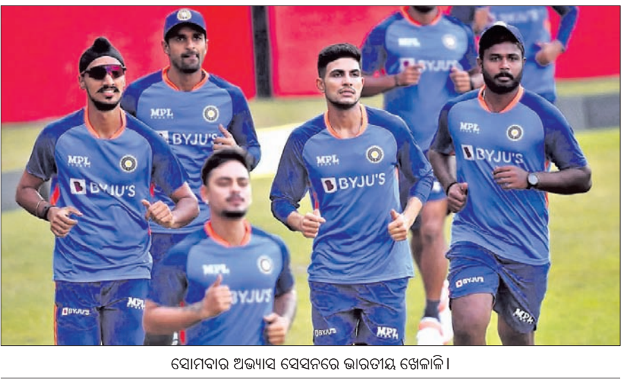
ସୋମବାର ଅଭ୍ୟାସ ସେସନରେ ଭାରତୀୟ ଖେଳାଳି।

ପୂର୍ଣ୍ଣ, ୨୧ (ପି.ଟି) ଟି୨୦ ବିଶ୍ୱକପକୁ ଆଉ ମାତ୍ର ୧୮ ମାସ ରହିଥିବା ବେଳେ ହାର୍ଦ୍ଦିକ ପାଞ୍ଚାଳ ନେତୃତ୍ୱରେ ମିଶନ୍ ୨୦୨୪ ପାଇଁ ପ୍ରସ୍ତୁତ ହେଉଛି ଭାରତ। ଭାରତୀୟ ଦଳର ୩ ବରିଷ୍ଠ ଖେଳାଳି ରୋହିତ ଶର୍ମା, ଲୋକେଶ ରାହୁଲ ଓ ବିରାଟ କୋହଲିଙ୍କ ବନା ହାର୍ଦ୍ଦିକଙ୍କ ନେତୃତ୍ୱରେ ଶ୍ରୀଲଙ୍କା ବିପକ୍ଷ ସିରିଜ ଖେଳିବ ଭାରତ। ୩ ମ୍ୟାଚ ବିଶିଷ୍ଟ ସିରିଜର ପ୍ରଥମ ଟି୨୦ ରୁପ୍ୟାର ମୁ୍ୟାଇର ଓଫିଙ୍ଗରେ ଖୁଲିଯାଉଛି ଖେଳାଳିଙ୍କ। ଦିନିଆଁ ବିଶ୍ୱକପ ବର୍ତ୍ତମାନ ଭାରତୀୟ ମ୍ୟାନେଜମେଣ୍ଟ ପାଇଁ ପ୍ରାଥମିକତା ରହିଥିବା ବେଳେ ହାର୍ଦ୍ଦିକଙ୍କ ନିକଟରେ ୨୦୨୪ର ଯୋଜନା ପ୍ରସ୍ତୁତ ପାଇଁ ସମୟ ମଧ୍ୟ ରହିଛି। ବରିଷ୍ଠ ଖେଳାଳିଙ୍କୁ ଶ୍ରୀଲଙ୍କା ସିରିଜରୁ ବାଦ ଦିଆଯାଇଥିବା ବେଳେ ଭାରତୀୟ ମ୍ୟାନେଜମେଣ୍ଟ ବର୍ତ୍ତମାନ ଭବିଷ୍ୟତ ଉପରେ ଲକ୍ଷ୍ୟ ରଖିଥିବା ସ୍ପଷ୍ଟ। ତିନି ଦିନିଆଁ ବିଶ୍ୱକପ: ଚୁକ୍ତିକାଣ୍ଡ ସିରିଜରେ ରିଷଭ ପନ୍ତ ଓ ଜଗନ୍ନାଥ କିଶନ ଓପନ କରିଥିଲେ। ଦୁର୍ଦ୍ଦିଶାରେ ସମ୍ପୂର୍ଣ୍ଣ ହୋଇଥିବା ପନ୍ତ ଏହି ସିରିଜରୁ ବାଦ ପଡ଼ିଥିବା ବେଳେ ରତ୍ନରାଜ ଗାଙ୍ଗୁଲୀଙ୍କ ଲିନିଂସ ଓପନ କରିପାରନ୍ତି। ଉଭୟ କିଶନ ଏବଂ ଗାଙ୍ଗୁଲୀଙ୍କ ଆଇପିଏଲରେ ଭଲ ପ୍ରଦର୍ଶନ କରିଛନ୍ତି। ସେହିପରି ଅନ୍ୟତମ ଓପନିଙ୍ଗ ବିକେଟ୍ ଭାବରେ ଶୁବମନ ଚିଲ୍ଲ ମଧ୍ୟ ରହିଛନ୍ତି। ୩ ନମ୍ବର ସ୍ଥାନରେ ସୂର୍ଯ୍ୟକୂମାର ଯାଦବଙ୍କ ଖେଳିବା ନିଶ୍ଚିତ ରହିଥିବା ବେଳେ ଦୀପକ ଚୁପ୍ରା ଓ ଅଧିନାୟକ ହାର୍ଦ୍ଦିକ ପାଞ୍ଚାଳ ଓ ୫ ନମ୍ବର ଖେଳାଳି ରହିବେ। ମଧ୍ୟକ୍ରମରେ ଖାଲିଥିବା ଅନ୍ୟ ଏକ ସ୍ଥାନରେ ସାୟୁସାଗର ଓ ରାହୁଲ ତ୍ରିପାଠୀଙ୍କ ମଧ୍ୟରୁ ଜଣଙ୍କୁ