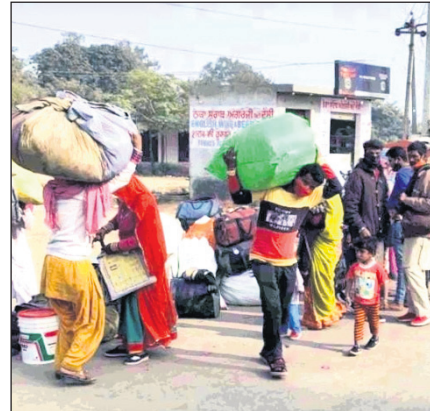
କୌଣସି ବିଭାଗରେ ନାହିଁ, ଘୁରୁ ହୋଇ ଯେ ଦାଦନ ଶ୍ରମିକଙ୍କର ସର୍ବଭାରତୀୟ ସର୍ବୋଚ୍ଚକାରୀ । ଦାୟିତ୍ୱ ଅର୍ପଣ ହେଲା ଲୋକେ ଚାହୁଁଥିଲେ । ପ୍ରବନ୍ଧ ଲେଖିଲା ବେଳକୁ ଯାହା ଖବର, ସର୍ବୋଚ୍ଚକାରୀ । କିନ୍ତୁ କେନ୍ଦ୍ର ସରକାର ପ୍ରୋକ୍ସିମିଟି ଦର୍ଶାଇଛନ୍ତି, କରୋନା ପୁରଣରେ ୪୩୭୮.୪୪ କୋଟି ଟଙ୍କାର ଆର୍ଥିକ ସହାୟତା ପ୍ରବାସୀ ଶ୍ରମିକମାନଙ୍କୁ ଦିଆଯାଇଛି, ସେମାନଙ୍କ ଇତିହାସ ଆକାଉଣ୍ଟ ମାଧ୍ୟମରେ । ଏହା ସମସ୍ୟାର ସମାଧାନ ନୁହେଁ । ଅନ୍ୟାନ୍ୟ ଯୋଜନାରେ ସେମାନଙ୍କୁ ସହାୟତା ମିଳିଛି । ପାଠକେ, ପଶ୍ଚିମ ଓଡ଼ିଶାର

୭୦ଟି ଜିଲା (ବରଗଡ଼, ସମଲପୁର, ବଲାଙ୍ଗୀର, ଝାରସୁଗୁଡ଼ା, ସୁନ୍ଦରଗଡ଼, ସୋନପୁର ଏବଂ ଦେବଗଡ଼) ରେ ସମଲପୁର ବିଶ୍ୱବିଦ୍ୟାଳୟ ଡ଼ରମାଣୁ କରାଯାଇଥିବା ଏକ ଅଧ୍ୟୟନ ଗବେଷଣା ଲିଟିଚି ଯେ ସର୍ବୋଚ୍ଚକୁ ୧୯.୮ ପ୍ରତିଶତ ପ୍ରବାସୀ ପରିବାରଙ୍କ ମାସିକ ଆୟ ୧୦,୦୦୦ ଟଙ୍କା ହୋଇଥିବା ବେଳେ ୫୮.୬ ପ୍ରତିଶତ ପ୍ରବାସୀ ରୋଜଗାର କରନ୍ତି ମାସିକ ୧୦,୦୦୦ ରୁ ୧୫,୦୦୦ ଟଙ୍କା । ୪୧ ପ୍ରତିଶତ ସର୍ବୋଚ୍ଚକୁ ପରିବାରଙ୍କ ମତ, ସେମାନଙ୍କ ଛୁଟିରେ ଖାସ୍ କିଛି ଉନ୍ନତି ନାହିଁ । 'ମାଇଗ୍ରେସନ ଇନ୍ ଇଣ୍ଡିଆ ୨୦୨୦-୨୧' ରିପୋର୍ଟ ମୁତାବକ ୫୧.୬ ପ୍ରତିଶତ ଗ୍ରାମାଞ୍ଚଳ ବାସିନ୍ଦା ରୋଜଗାର ପାଇଁ ଗାଁ ଛାଡ଼ିଥିଲେ । ୨୦୧୧ ଜନଗଣନା ତଥ୍ୟ ଅନୁସାରେ ପ୍ରାୟ ୪୫.୬ କୋଟି ଥିଲେ ଦାଦନ / ପ୍ରବାସୀ ଶ୍ରମିକ । ତେବେ ଏହା ନିର୍ଭରଯୋଗ୍ୟ ବିଶ୍ଳେଷଣ ନୁହେଁ, କାରଣ ୪୫.୬ କୋଟି ଶ୍ରମିକ କାରିକା ପାଇଁ ଗ୍ରାମାଞ୍ଚଳକୁ ବାହାରକୁ ତ ଆସୁଥିଲେ, ତେବେ ସେମାନେ ରାଜ୍ୟ ବାହାରକୁ ଯାଉଥିଲେ ନା ନାହିଁ, ଦେଶ ବାହାରକୁ କେତେ ଯାଉଥିଲେ ସେ ବାବଦରେ ତଥ୍ୟ ନାହିଁ । ଅନ୍ୟାନ୍ୟ ସ୍ୱତ୍ର ମୁଦ୍ରାବଦ୍ଧ ଭାରତରେ ଦାଦନ ଶ୍ରମିକ ସଂଖ୍ୟା ୭୦ ଲୁ ୧୯୫ ନିୟୁତ । ତଥ୍ୟ ଅନୁସାରେ (ସରକାରୀ ନୁହେଁ) ଓଡ଼ିଶାରେ ପ୍ରବାସୀ ଶ୍ରମିକଙ୍କ ସଂଖ୍ୟା ୨.୫ ନିୟୁତକୁ କମ୍ ହୁଏ । ୨୦୨୦ ରେ 'ସେକ୍ଟର ଫର୍ ମନିଟରିଂ' ଲଣ୍ଡନର ଇକୋନୋମି (CMIE) ବିଶ୍ଳେଷଣ ଅନୁସାରେ ଓଡ଼ିଶାରେ ବେରୋଜଗାରୀ ହାର ଥିଲା ୨୩.୮ ପ୍ରତିଶତ । ଭୋରା ସାଗରର ମା' ପୁଅ ବୋହୂଙ୍କ ଅପେକ୍ଷାରେ ଅଛି । ଆଖିରେ ଉଦାପନା ନାହିଁ । ଆଶା ନାହିଁ । ସବୁ ଦେହସୁସ୍ଥ ହୋଇଗଲାଣି । ଆଖି ବୁଜିବା ଯାହା ବାକି ଅଛି !