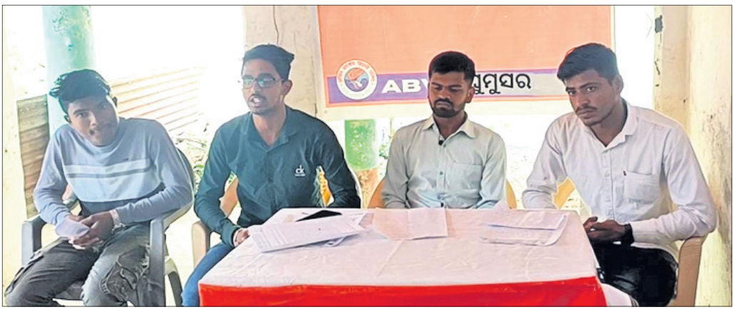
ଖବରଦାତା ସମ୍ମିଳନୀରେ ଉପସ୍ଥିତ କାର୍ଯ୍ୟକର୍ତ୍ତା ।