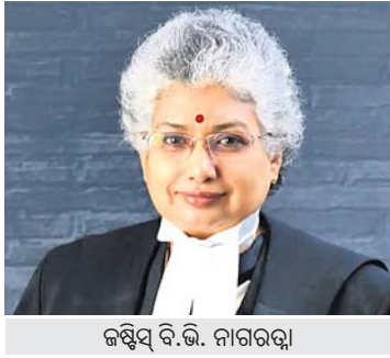
ଜଷ୍ଟିସ୍ ବି.ଭି. ନାଗରଞ୍ଜା

୨୦୧୬ ନଭେମ୍ବର ୮ରେ କେନ୍ଦ୍ର ସରକାରଙ୍କ ବିମୁକ୍ତାକରଣ ନିଷ୍ପତ୍ତିକୁ ଚାଲେଞ୍ଜ କରି ଯୁକ୍ତିମୋକ୍ଦ୍ଦେରେ ହୋଇଥିବା ୫୮ଟି ବିଚାରପତିଙ୍କ ଯୋଗଦାନ ପ୍ରକାଶ ପାଇଛି। ଜଷ୍ଟିସ୍ ଏସ୍.ଏ. ନାଜରକ ଅଧ୍ୟକ୍ଷତାରେ ବି.ଆର୍. ଗଭାଲ, ଏ.ଏସ୍. ବୋପନା, ଭି. ରାମସ୍ୱରୂପଣ୍ୟନ୍ ଏବଂ ବି.ଭି. ନାଗରଞ୍ଜାଙ୍କୁ ନେଇ ଗଠିତ ୫ଜଣିଆ ସାମ୍ବିଧାନିକ ପୀଠ ୪-୧ରେ ରାୟ ଶୁଣାଇଛନ୍ତି। ୪ଜଣ ବିଚାରପତି ନୋଟ୍‌ସ୍‌ସ୍‌ପୋର୍ଟ ନିଷ୍ପତ୍ତିକୁ ବୈଧ ବୋଲି କହିଥିବାବେଳେ ବିଚାରପତି ନାଗରଞ୍ଜା ଏଥିରେ ଅସମ୍ମତ ପ୍ରକାଶ କରିଛନ୍ତି। ବିମୁକ୍ତାକରଣ ନିଷ୍ପତ୍ତିକୁ ସେ ବେଆଇନ ବୋଲି କହିଛନ୍ତି। ପୂରୁଣା ୫୦୦ ଓ ୧,୦୦୦ ଟଙ୍କା ନୋଟ୍‌ସ୍