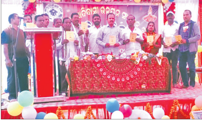
ସଭାମଞ୍ଚରେ ଉପସ୍ଥିତ ଅତିଥିବୃନ୍ଦ ।