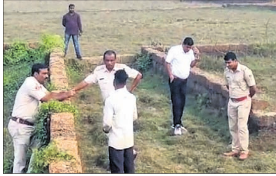
ପୋଲିସ୍ ଓ ସାମାଜିକ କର୍ମୀଙ୍କ ଉପସ୍ଥିତିରେ ଶିଳ୍ପୀ ଶିବିରର ସମୟରେ ଏକ ଖଣ୍ଡ ପଲିସ୍ଟିକ୍ କାଗଜିନୀ ମାଧ୍ୟମରେ ମହିଳାଙ୍କୁ ହତ୍ୟା ହୋଇଥିବା ଜଣାପଡିଛି।

ଭୁବନେଶ୍ୱର ମହାନଗର ପାଳିକା ଅଞ୍ଚଳ ନିର୍ବାହୀ କମିଶନର ଦ୍ୱାରା ପରିଚାଳିତ ଏକ ଶିଳ୍ପୀ ଶିବିରର ସମୟରେ ଏକ ଖଣ୍ଡ ପଲିସ୍ଟିକ୍ କାଗଜିନୀ ମାଧ୍ୟମରେ ମହିଳାଙ୍କୁ ହତ୍ୟା ହୋଇଥିବା ଜଣାପଡିଛି।