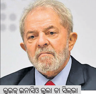
ଲୁଇଜ୍ ଜନସିଓ ଲୁଲା ତା ସିଲଭା ବ୍ରାଜିଲିଆ, ୨୧

ତୃତୀୟ ଥର ପାଇଁ ବ୍ରାଜିଲ ରାଷ୍ଟ୍ରପତି ଭାବେ ଲୁଇଜ୍ ଜନସିଓ ଲୁଲା ତା ସିଲଭା ଶପଥ ନେଇଛନ୍ତି। ସେ ଦେଶରୁ ଗରିବା ହଟାଇବା ଏବଂ ପରିବେଶ ପାଇଁ ଲଢ଼େଇ କରି ଉଦ୍ଦେଶ୍ୟ ରଖିଛନ୍ତି।