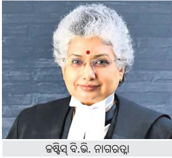
ଜଷ୍ଟିସ୍ ବି.ଭି. ନାଗରଓ

୨୦୧୬ ନଭେମ୍ବର ୮ରେ କେନ୍ଦ୍ର ସରକାରଙ୍କ ବିମୁକ୍ତାକରଣ ନିଷ୍ପତ୍ତିକୁ ଚାଲେଞ୍ଜ କରି ଯୁକ୍ତିମୋକ୍ଦ୍ଦରେ ହୋଇଥିବା ୫୮ଟି ଚିଠିଗଣର ରାୟ ଯୋଗୁଁ ପ୍ରକାଶ ପାଇଛି। ଜଷ୍ଟିସ୍ ଏସ୍.ଏ. ନାଜରକ ଅଧ୍ୟକ୍ଷତାରେ ବି.ଆର୍. ଗଭାଲ, ଏ.ଏସ୍. ବୋପନା, ଭି. ରାମସ୍ୱରୂପଣ୍ୟନ୍ ଏବଂ ବି.ଭି. ନାଗରଓଙ୍କୁ ନେଇ ଗଠିତ ୫ଜଣିଆ ସାଧିନୀୟ ପୀଠ ୪-୧ରେ ରାୟ ଶୁଣାଇଛନ୍ତି। ୪ଜଣ ବିଚାରପତି ନୋଟ୍‌ସ‌ହୀତ ନିଷ୍ପତ୍ତିକୁ ବୈଧ ବୋଲି କହିଥିବାବେଳେ ବିଚାରପତି ନାଗରଓ ଏଥିରେ ଅସହମତି ପ୍ରକାଶ କରିଛନ୍ତି। ବିମୁକ୍ତାକରଣ ନିଷ୍ପତ୍ତିକୁ ସେ ବେଆଇନ ବୋଲି କହିଛନ୍ତି। ପୂରୁଣା ୫୦୦ ଓ ୧,୦୦୦ ଟଙ୍କା ନୋଟ୍‌ର