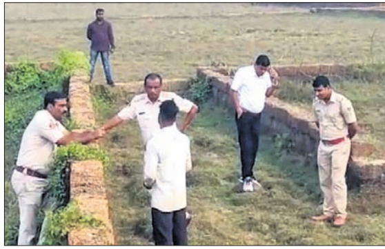
ପୋଲିସ୍ ଓ ସାହିଯୁକ୍ତ ଟିମ୍ମ୍ ଚଢ଼େଇ କରୁଛି।