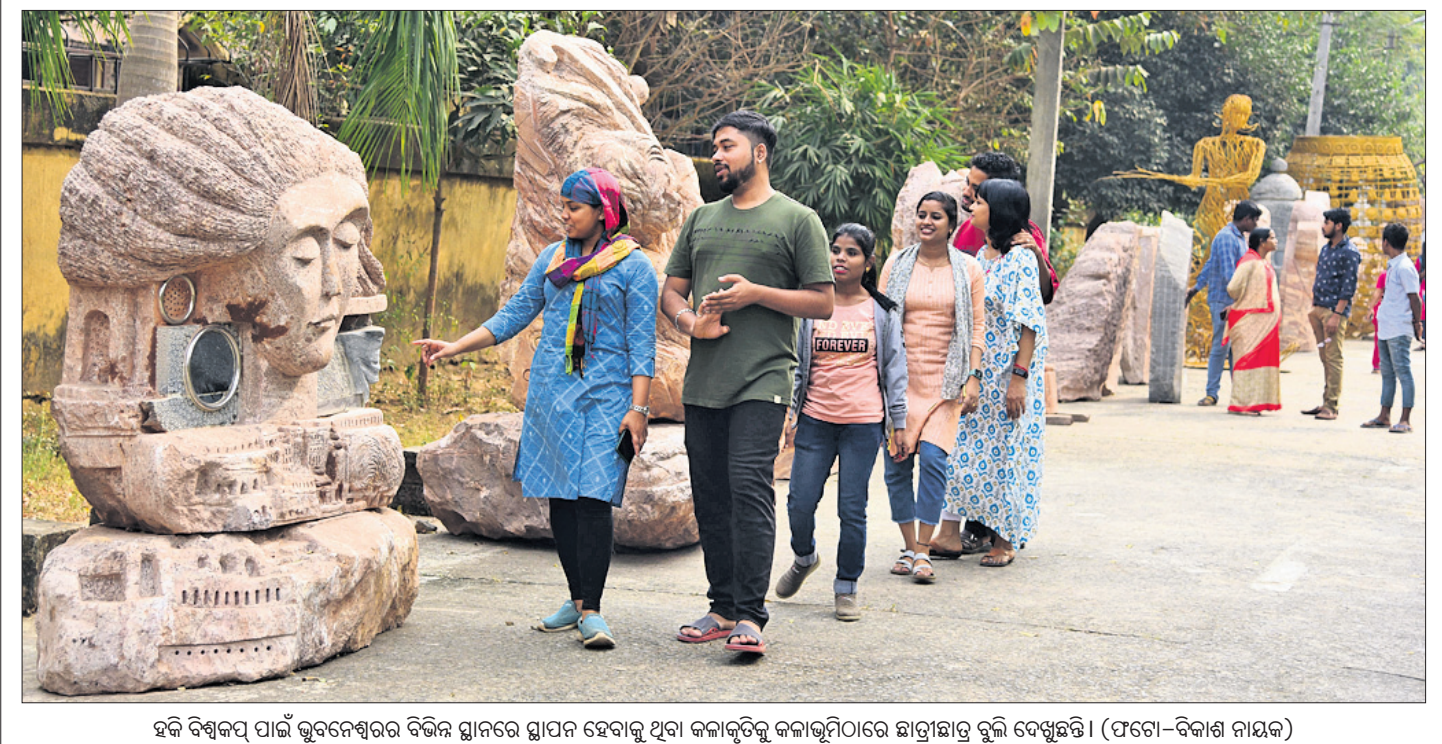
ହଳି ବିଷ୍ଣୁଙ୍କ ପାଇଁ ଭୁବନେଶ୍ୱରର ବିଭିନ୍ନ ସ୍ଥାନରେ ସ୍ଥାପନ ହେବାକୁ ଥିବା କଳାକୃତିକୁ କଳାକୃତିମାନଙ୍କ ଦ୍ୱାରା ଗ୍ରହଣ କରାଯାଇଛି।