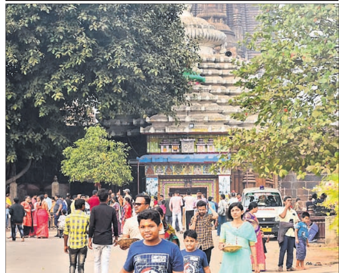
ପୁରୁଣା ଭୁବନେଶ୍ୱର, ୨୧ (ଡି.ଏନ୍.ଏ.)

ନବବର୍ଷ ୨୦୨୩ ରଥା ରବିବାରଠାରୁ ଶ୍ରୀଲିଙ୍ଗରାଜ ମନ୍ଦିରରେ ନୀତିକାନ୍ତି ଚାଲିଥିବାବେଳେ ଜଣେ ଭକ୍ତ ଭୋଗ ମଣ୍ଡପରେ ପଶିବାକୁ ଭୋଗ ମାରା ହୋଇଥିଲା। ଫଳରେ ସେବାୟତମାନେ ନୀତିକାନ୍ତି ବନ୍ଦ କରିଦେଇଥିବା ବେଳେ ସେଦିନର ସମସ୍ତ କୋଠ ଭୋଗ ଏବଂ ଜଳମାନ ଭୋଗ ଅନୁଶୀଳା କୁଆରେ