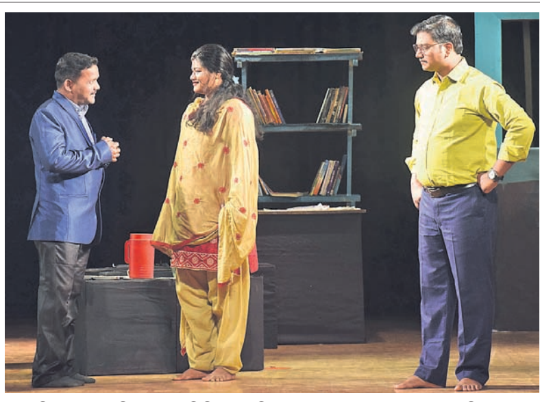
ଓଡ଼ିଆ ଭାଷା, ସାହିତ୍ୟ ଓ ସଂସ୍କୃତି ବିଭାଗ, ଓଡ଼ିଶା ସମ୍ମାନ ନାଟକ ଏକାଡେମୀ ଏବଂ ଓଡ଼ିଆ ନାଟ୍ୟ ସଂଘ ପକ୍ଷରୁ ନାଟ୍ୟଧାରାରେ ଭୁବନେଶ୍ୱର ଭଞ୍ଜକଳା ମଣ୍ଡପରେ ସୋମବାର ପରିବେଷିତ ନାଟକ 'ଶୂନ୍ୟ ପଞ୍ଜୁରୀ'ର ଏକ ଦୃଶ୍ୟ।

ସେଲ୍ଫି ପଠାଇବା ସମୟରେ ନିଜର ନାମ ଏବଂ ମୋବାଇଲ ନମ୍ବର ଦେବାକୁ ଭୁଲି ନାହିଁ। ଯୋଗ୍ୟ ବିବେଚିତ ଫଟୋ ପ୍ରକାଶ ପାଇବ।