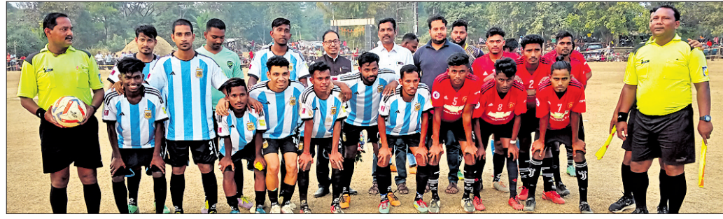
ଅତିଥିଙ୍କୁ ଗହଣରେ ଉଭୟ ଦଳର ଖେଳାଳି।