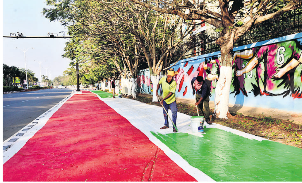
ଆସନ୍ତା ୧୩ ତାରିଖରୁ ଭୁବନେଶ୍ୱରରେ ଆରମ୍ଭ ହେବାକୁ ଥିବା ହକି ପ୍ରଦର୍ଶନ ବିଶ୍ୱକପ୍ ପାଇଁ ରାଜଧାନୀର ଫୁଟପାଥକୁ ରକ୍ଷା ଦିଆଯିବ। ସହ ପ୍ରାଚୀରକୁ ଓଡ଼ିଶାର କଳା, ସଂସ୍କୃତି ଓ ଐତିହ୍ୟ ଚିତ୍ରରେ ଚିତ୍ରିତ କରାଯାଇଛି।

ଭୁବନେଶ୍ୱର, ୨୧ (ବୁଧବେଳା) - ଆସନ୍ତା ୧୩ ତାରିଖରୁ ଓଡ଼ିଶାର ଭୁବନେଶ୍ୱର ଓ ରାଜକେଲରେ ଆରମ୍ଭ ହେବ ହକି ପ୍ରଦର୍ଶନ ବିଶ୍ୱକପ୍ ଏହାକୁ ଦୃଷ୍ଟିରେ ରଖି ସହରର ସୁରକ୍ଷା ବ୍ୟବସ୍ଥାକୁ ପୁରୁସ୍କାର ସହ ନେଇ କଳିଙ୍ଗ ଷ୍ଟାଡ଼ିୟମ ପୋଲିସ୍ ବିମାନବନ୍ଦରଠାରୁ ଆରମ୍ଭ କରି ହୋଇଛି ପର୍ଯ୍ୟନ୍ତ ସବୁଟି ସୁରକ୍ଷା ବ୍ୟବସ୍ଥା ଯାଞ୍ଚ କରାଯାଉଛି ଯୋମବାନ କଳିଙ୍ଗ ଷ୍ଟାଡ଼ିୟମ ଯାଞ୍ଚ ହୋଇଥିଲା। ଖେଳାଳି, ଅତିଥି ଓ ଦର୍ଶକ ଯେମିତି କୌଣସି ଅସୁବିଧା ନ ହୁଏ ସେନେଇ ଭୁବନେଶ୍ୱର ଡିସିପି ଷ୍ଟାଡ଼ିୟମକୁ ଯାଇ ହକି ରକ୍ଷିତ। ଓ ଖେଳ ବିଭାଗର ଅଧିକାରୀଙ୍କ ସହ ସୁରକ୍ଷା ବ୍ୟବସ୍ଥାକୁ ତଦାରଖ କରିଛନ୍ତି। ଷ୍ଟାଡ଼ିୟମରେ କ'ଣ କଣ ଚେକାପଫେକା କାମ ଚାଲିଛି, ଖେଳ ଦେଖିବାକୁ ଆସିବାକୁଥିବା ଦର୍ଶକ କେଉଁ ପଟେ ପ୍ରବେଶ ଓପ୍ରସ୍ଥାନ କରିବେ। ପାର୍କିଂ ବ୍ୟବସ୍ଥା ହୋଇଛି କି ନାହିଁ, ସାଇନ୍ ବୋର୍ଡ କେଉଁ କେଉଁ ସ୍ଥାନରେ ଲଗାଯିବ, ଜରୁରୀକାଳୀନ ଆୟୁର୍ବିଦ୍ୟାଳୟ ବ୍ୟବସ୍ଥା ଆଦି ସଂଗ୍ରହରେ ପଡ଼ାଉ ରକ୍ଷିତ। ସହ ସ୍ଥିତି ଅନୁଧ୍ୟାନ କରିଥିଲେ।