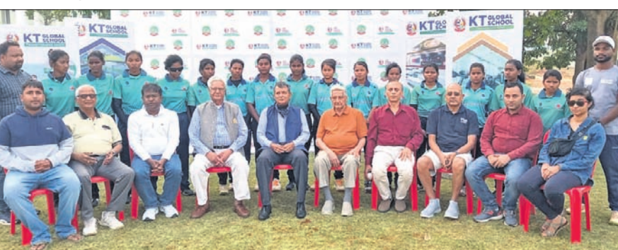
ଜାତୀୟ ଦୃଷ୍ଟି ବାଧୁତ ମହିଳା ଟି୨୦ ପାଇଁ ମନୋନୀତ ଓଡ଼ିଶା ଖେଳାଳିମାନେ କର୍ମକର୍ତ୍ତାଙ୍କ ସହ ଗଣତାଳନ।

ଭୁବନେଶ୍ୱର, ୨୧ (କ୍ରୀଡ଼ା ପ୍ରତିନିଧି) ବେଙ୍ଗାଳୁରୁଠାରେ ଚଳିତମାସ ୯ରୁ ୧୩ ପର୍ଯ୍ୟନ୍ତ ହେବାକୁଥିବା ଜାତୀୟ ଦୃଷ୍ଟିବାଧୁତ ମହିଳା ଟି୨୦ କ୍ରିକେଟ ଟୁର୍ନାମେଣ୍ଟ ପାଇଁ ସୋମବାର ଓଡ଼ିଶା ଦଳ ଘୋଷଣା କରାଯାଇଛି। ଏଥିପାଇଁ ଓଡ଼ିଶା ଦୃଷ୍ଟିବାଧୁତ କ୍ରିକେଟ ଆସୋସିଏଶନ (କାଭି) ପକ୍ଷରୁ ତିସେଇ ୨୦ରୁ ୩୧ ପର୍ଯ୍ୟନ୍ତ ୨୦ ଜଣ ଖେଳାଳିଙ୍କୁ ନେଇ ଏକ ଚୟନ ଗ୍ରାଧିକାର ଆୟୋଜନ କରାଯାଇଥିଲା। ଏଥିରେ ପ୍ରଦର୍ଶନ ଭିତ୍ତିରେ ୧୪ ଜଣିଆ ଦଳ ମନୋନୟନ କରାଯାଇଥିଲା। ଓଡ଼ିଶା ଦଳର କ୍ୟାପ୍ଟିଭ୍ ଏବେ କେଟି ଗ୍ଲୋବାଲ୍ ସ୍କୁଲ ପରିସରରେ ଚାଲିଛି। ଏହା ୬ ଚାରିଖ ପର୍ଯ୍ୟନ୍ତ ଚାଲିବ। ୬ ଚାରିଖରେ ଓଡ଼ିଶା ଦଳ ବେଙ୍ଗାଳୁରୁ