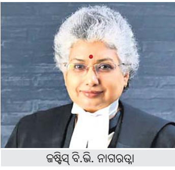
ଜଷ୍ଟିସ୍ ବି.ଭି. ନାଗରଘା

ସମ୍ପୂର୍ଣ୍ଣ ସିରିଜ୍‌କୁ ରଦ୍ଦ କରିବା ଭଳି ଗୁରୁତ୍ୱପୂର୍ଣ୍ଣ ନିଷ୍ପତ୍ତିରେ ପାର୍ଲିମେଣ୍ଟକୁ ବାଦ୍ ଦିଆଯାଇପାରିବ ନାହିଁ ବୋଲି ନାଗରଘା କହିଛନ୍ତି। କେନ୍ଦ୍ର ସରକାର ସମ୍ପୂର୍ଣ୍ଣ ସିରିଜ୍ ବ୍ୟାକ୍ ନୋଟ୍‌ସ୍ ରଦ୍ଦ କରିବେବା ଅତ୍ୟନ୍ତ ଗମ୍ଭୀର ପ୍ରସଙ୍ଗ। ଏହା ଦେଶର ଅର୍ଥନୀତି ଏବଂ ଦେଶବାସୀଙ୍କ ଉପରେ