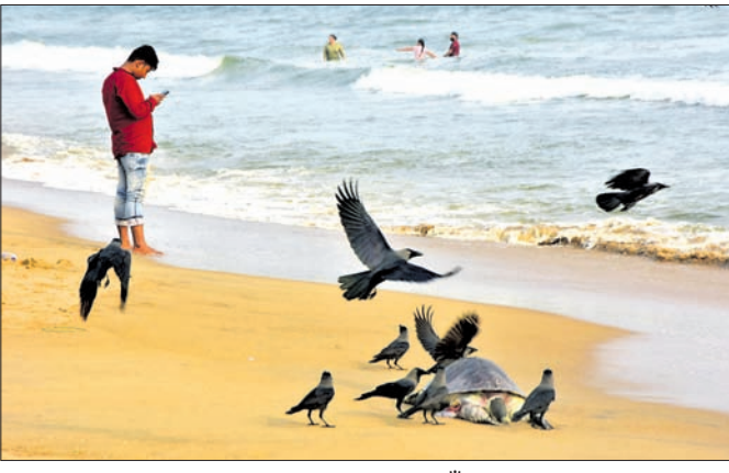
ବେଳାଭୂମିରେ ପଡ଼ିରହିଥିବା ମୃତ ଅଲିଭ୍ ରିଡ୍‌ଲେ କଳ୍ପକୁ ଛୁଆମାନେ ଖୁସି ଖାଉଛନ୍ତି।

ସମ୍ପ୍ରତି ବିରଳ ଅଲିଭ୍ ରିଡ୍‌ଲେ କଳ୍ପମାନଙ୍କ ଅଣ୍ଡାଦାନ ରତ୍ନ ଚାଲିଛି। ଗଭୀର ସମୁଦ୍ର ଅଲିଭ୍ ରିଡ୍‌ଲେ କଳ୍ପ ବେଳାଭୂମିକୁ ଆସି ଅଣ୍ଡାଦାନ କରୁଛନ୍ତି।