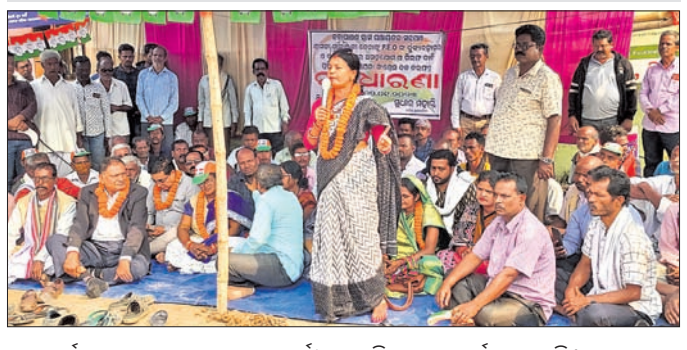
ବୁକ୍ କାର୍ଯ୍ୟାଳୟ ସମ୍ମୁଖରେ କଂଗ୍ରେସ କର୍ମୀମାନେ ବିକ୍ଷୋଭ ପ୍ରଦର୍ଶନ କରୁଛନ୍ତି ।