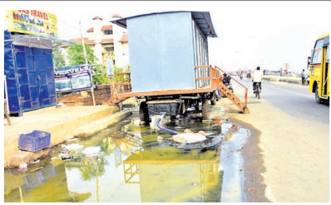
ପୁରୀ ବେଳାଭୂମି ନାଗରେ ଥିବା ଗ୍ରାମ୍ୟମାଣ ଶୈଳୀକନ୍ୟା ନିର୍ମିତ ଚୂଡ଼ିତ ଜଳ ରାସ୍ତାକୁ ବୋହି ଆସିଛି ।