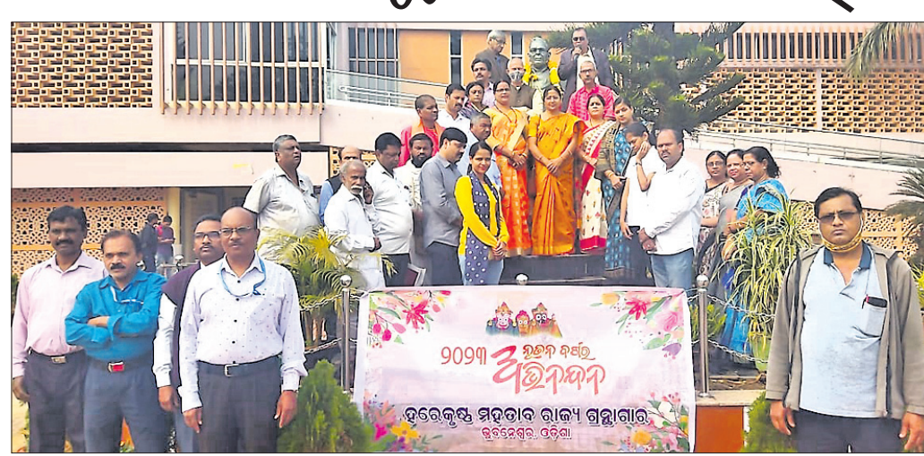
ହରେକୃଷ୍ଣ ମହତାବ ରାଜ୍ୟ ଗ୍ରନ୍ଥାଗାରସ୍ଥିତ ପ୍ରତିମୂର୍ତ୍ତିରେ ପାଳାଯାଉଥିବା ଅବସରରେ ଉପସ୍ଥିତ ଅତିଥି ଓ ଅନ୍ୟମାନେ।