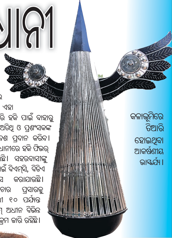
କଳାଭୂମିରେ ତିଆରି ହୋଇଥିବା ଆକର୍ଷଣୀୟ ଭାଷ୍ୟ।

ରାସ୍ତାକଡ଼ରେ ବିଭିନ୍ନ ପୁଲିଗଛ, ଅର୍ନାମେଣ୍ଟାଲ ଟ୍ରି ଏବଂ ଘାସ ବିଛାଇ ସବୁଜିମା ସୃଷ୍ଟି କରାଯାଇଛି। ଏହା ରାଜଧାନୀବାସୀ ବିଶେଷକରି ହକି ପାଇଁ ବାହାରୁ ଆସିବାକୁ ଥିବା ଖେଳାଳି, ଅତିଥି ଓ ପ୍ରଶଂସକଙ୍କ ପାଇଁ ଏକ ନୂତନ ପରିବେଶ ପ୍ରଦାନ କରିବ। ଅପରପକ୍ଷେ ଏବେଠୁ ରାଜଧାନୀରେ ହକି ଫିଭର୍ ମଧ୍ୟ ଆରମ୍ଭ ହୋଇଯାଇଛି। ସହରବାସୀଙ୍କୁ ଏଥିରେ ସାମିଲ କରିବା ପାଇଁ ବିଏମ୍.ପି. ବିଡିଏ ପକ୍ଷରୁ ଜୋରଦାର ପ୍ରୟାସ କରାଯାଇଛି। ସହରରେ ହକିର ପ୍ରଚାର ପ୍ରସାରକୁ ଦୃଷ୍ଟିରେ ରଖି ଜାନୁୟାରୀ ୧୦ ପର୍ଯ୍ୟନ୍ତ 'ବନ୍ଦେ ଭୁବନେଶ୍ୱର' ଥିଏଟ୍ର ଆଧୀନ ବିଭିନ୍ନ ମନୋରଞ୍ଜନ ଭିତ୍ତିକ କାର୍ଯ୍ୟକ୍ରମ ଜାରି ରହିଛି।