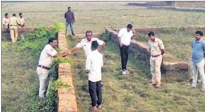
ପୋଲିସ ଘଟଣାସ୍ଥଳ ଆଖପାଖରେ ଚଢ଼ଢ଼ କରୁଛି ।

ଭୁବନେଶ୍ୱର ମହେଶ୍ୱର ଥାନା ଅନ୍ତର୍ଗତ କୋରଡ଼କଣ୍ଠା ଅଞ୍ଚଳରେ ଘଟଣା ଘଟିଥିବା ସମ୍ବନ୍ଧରେ ପୁଲିସ୍ ଚଳାଏ ଚଢ଼ଢ଼ କରୁଛି ।