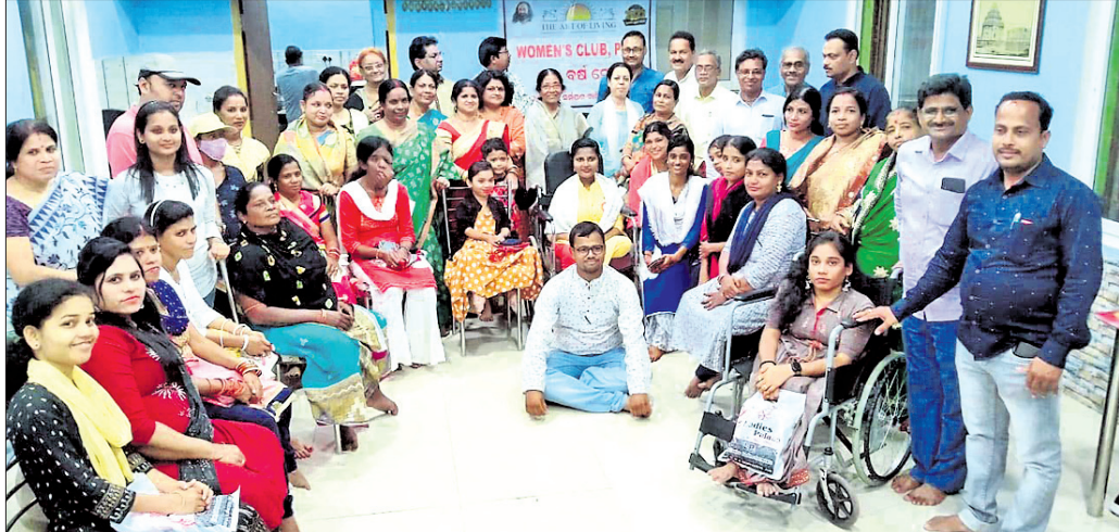
ପୁରୀ ଆର୍ଡ଼ ଅଫି ଲିଭିଙ୍ଗ ମହିଳା କ୍ଲବ୍ ପକ୍ଷରୁ ବିଦ୍ୟାଳୟମାନଙ୍କ ସହିତ ନବବର୍ଷ ପାଳନ କରାଯାଇଛି ।