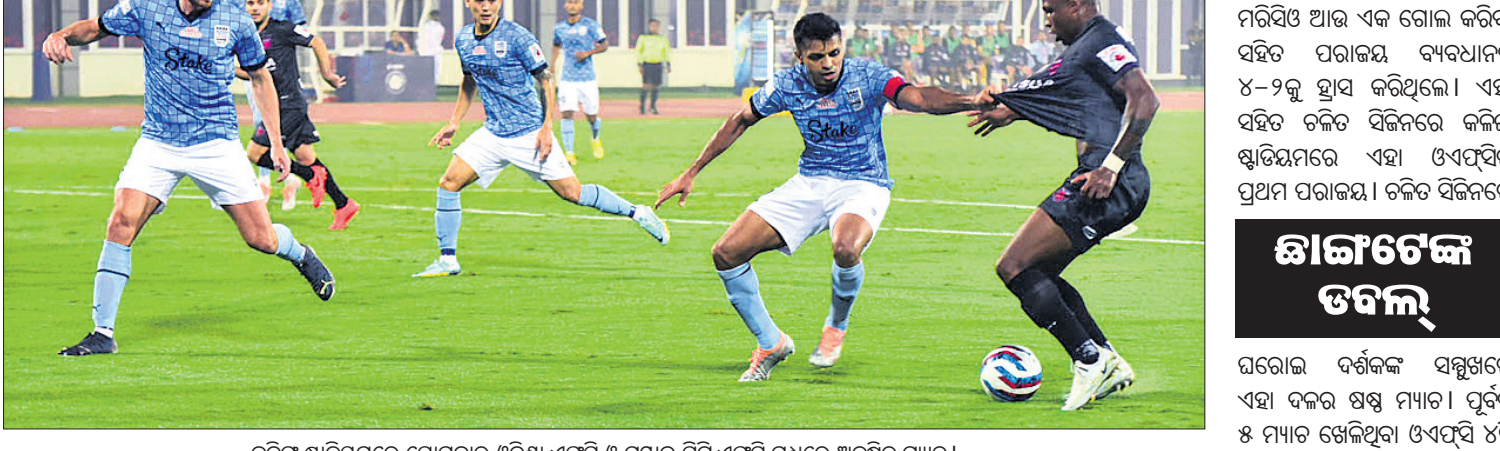
କଳିଙ୍ଗ ଷ୍ଟାଡ଼ିୟମରେ ସୋମବାର ଓଡ଼ିଶା ଏଫ୍‌ସି ଓ ମୁୟାଲ ସିଟି ଏଫ୍‌ସି ମଧ୍ୟରେ ଅନୁଷ୍ଠିତ ମ୍ୟାଚ।