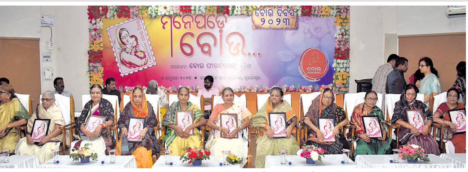
ବୋଇ ଫାଉଣ୍ଡେଶନ ପକ୍ଷରୁ ସୋମବାର ଗାତଗୋବିନ୍ଦ ସଦନରେ ବୋଇ ବିବସ ପାଳନ ଅବସରରେ ଅତିଥିଭାବେ ଯୋଗଦେଇଥିବା ବୋଉମାନେ।