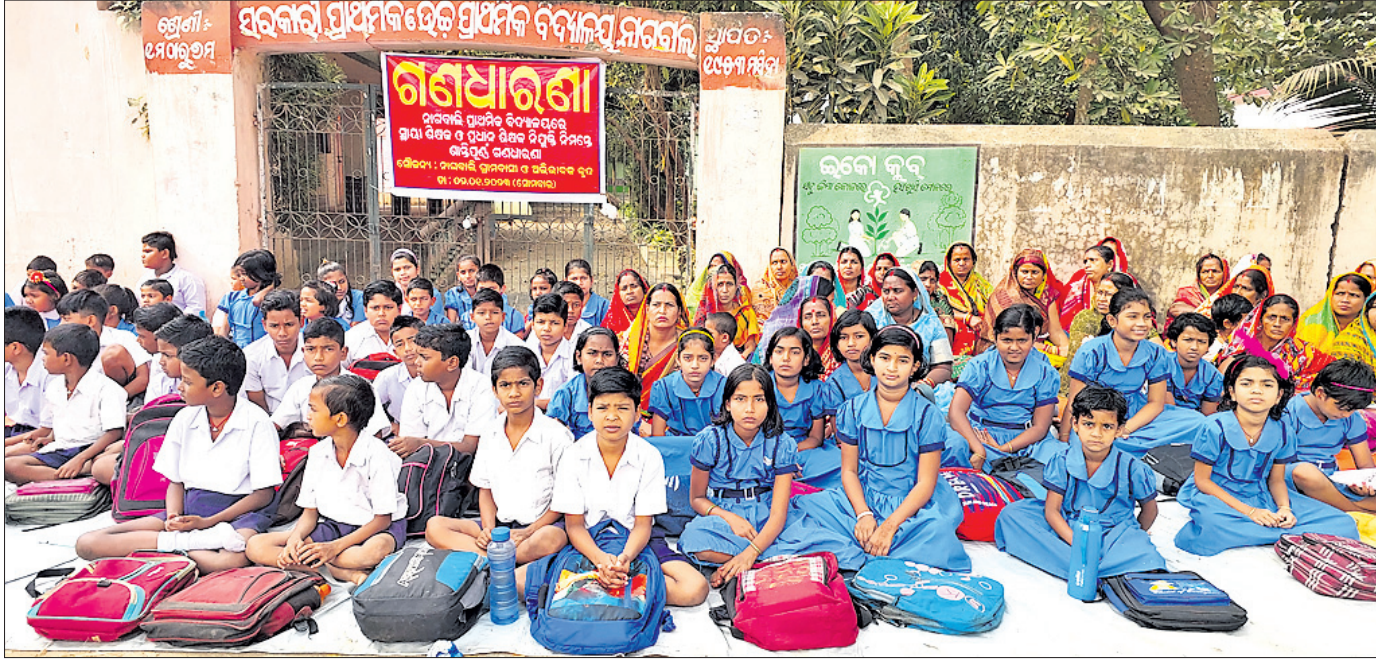
ନାଗବାଳି ପ୍ରାଥମିକ ବିଦ୍ୟାଳୟ ଆଗରେ ଛାତ୍ରଛାତ୍ରୀ, ଅଭିଭାବକ ଧାରଣା ଦେଇଛନ୍ତି।

ସରକାର ଗ୍ରାମରେ ଥିବା ବିଦ୍ୟାଳୟଗୁଡ଼ିକୁ ଉନ୍ନତମାନର କରିବା ସହ ଛାତ୍ରଛାତ୍ରୀଙ୍କ ଶିକ୍ଷାରେ ପରିବର୍ଦ୍ଧନଶୀଳ ଆଣିବା ପାଇଁ ୫-ଟି ଯୋଜନାରେ ରୂପାନ୍ତରକରଣ କରୁଛନ୍ତି। କିନ୍ତୁ ବାସ୍ତବରେ ତାହା କେତେ କାର୍ଯ୍ୟକାରୀ ହେଉଛି, ସେନେଇ ତକ୍ଷଣାତ୍ ଅନୁଧ୍ୟାନ କରାଯାଉ ନ ଥିବା ଅଭିଯୋଗ ହେଉଛି। ଏହି ପରିପ୍ରେକ୍ଷାରେ କଟକ ସଦର ଥାନା ଅନ୍ତର୍ଗତ ନାଗବାଳି ଗ୍ରାମରେ ଥିବା ସରକାରୀ ପ୍ରାଥମିକ ଓ ଉଚ୍ଚ ପ୍ରାଥମିକ ବିଦ୍ୟାଳୟରେ ଘାଣ୍ଟି ଶିକ୍ଷକ ଓ ପ୍ରଧାନ ଶିକ୍ଷକ ନ ଥିବାରୁ ଛାତ୍ରଛାତ୍ରୀଙ୍କ ପାଠପଢ଼ାରେ ଅସୁବିଧା ହେଉଛି। ଏ ନେଇ ଅଭିଭାବକ, ଗ୍ରାମବାସୀ ବାରମ୍ବାର ଉଚ୍ଚ କର୍ତ୍ତୃପକ୍ଷଙ୍କୁ ଜଣାଇଥିଲେ ମଧ୍ୟ କେହି ଚଳୁଥିବା ନ ଦେବାରୁ ସୋମବାର ଅଭିଭାବକ ଓ ଛାତ୍ରଛାତ୍ରୀମାନେ ସୋମବାର ବିଦ୍ୟାଳୟରେ ତାଲା ପକାଇ ପାଠକ ଆଗରେ ଗଣଧାରଣା କେଲେଥିଲେ।