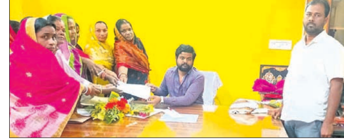
ମହିଳା ଗୋଷ୍ଠୀ ପକ୍ଷରୁ ସୋମବାର ବିତିଓଲୁ ଦାବିପତ୍ର ପ୍ରଦାନ କରାଯାଇଛି।