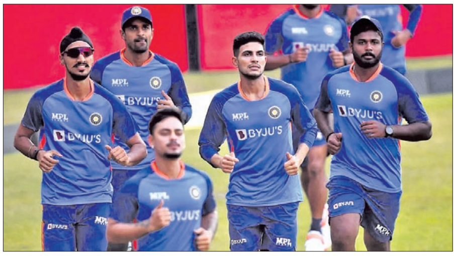
ସୋମବାର ଅଭ୍ୟାସ ସେସନରେ ଭାରତୀୟ ଖେଳାଳି।

ପୂର୍ଣ୍ଣ, ୨୧ (ପି.ଟି) ଟି୨୦ ବିଶ୍ୱକପ୍ ଆଉ ମାତ୍ର ୧୮ ମାସ ରହିଥିବା ବେଳେ ହାର୍ଦ୍ଦିକ ପାଣ୍ଡାଙ୍କ ନେତୃତ୍ୱରେ ମିଶନ୍ ୨୦୨୪ ପାଇଁ ପ୍ରସ୍ତୁତ ହେଉଛି ଭାରତ। ଭାରତୀୟ ଦଳର ୩ ବରିଷ୍ଠ ଖେଳାଳି ରୋହିତ ଶର୍ମା, ଲୋକେଶ ରାହୁଲ ଓ ବିରାଟ କୋହଲିଙ୍କ ବନା ହାର୍ଦ୍ଦିକଙ୍କ ନେତୃତ୍ୱରେ ଶ୍ରୀଲଙ୍କା ବିପକ୍ଷ ସିରିଜ ଖେଳିବ ଭାରତ। ୩ ମ୍ୟାଚ ବିଶିଷ୍ଟ ସିରିଜର ପ୍ରଥମ ଟି୨୦ ରୁପ୍ୟାଲର ଫାଇନାଲରେ ଖେଳାଯିବ। ଦିନିଆଁ ବିଶ୍ୱକପ୍ ବର୍ତ୍ତମାନ ଭାରତୀୟ ମ୍ୟାନେଜମେଣ୍ଟ ପାଇଁ ପ୍ରାଥମିକତା ରହିଥିବା ବେଳେ ହାର୍ଦ୍ଦିକଙ୍କ ନିକଟରେ ୨୦୨୪ର ଯୋଜନା ପ୍ରସ୍ତୁତ ପାଇଁ ସମୟ ମଧ୍ୟ ରହିଛି। ବରିଷ୍ଠ ଖେଳାଳିଙ୍କୁ ଶ୍ରୀଲଙ୍କା ସିରିଜରୁ ବାଦ ଦିଆଯାଇଥିବା ବେଳେ ଭାରତୀୟ ମ୍ୟାନେଜମେଣ୍ଟ ବର୍ତ୍ତମାନ ଭବିଷ୍ୟତ ଉପରେ ଲକ୍ଷ୍ୟ ରଖିଥିବା ସ୍ପଷ୍ଟ।