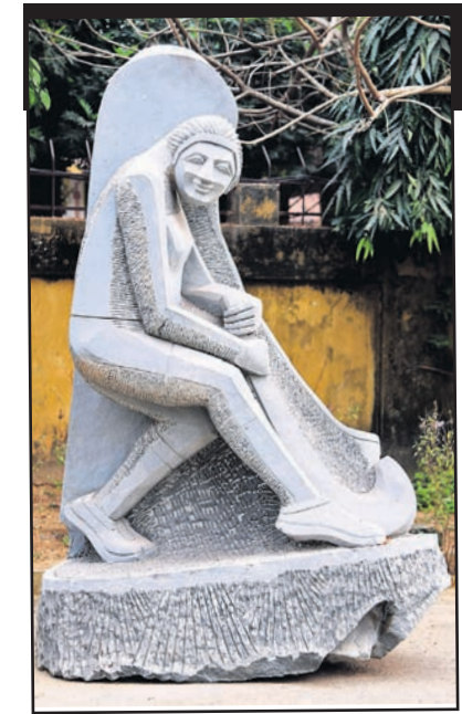
ଭୁବନେଶ୍ୱର, ୧୧ (ବୁଧବେଳା)

ରାଜଧାନୀର କାନ୍ଧ ବ୍ୟାଗ୍ରୁଛି ଓଡ଼ିଶାର ଐତିହ୍ୟ, ସଂସ୍କୃତି ଓ ପରମ୍ପରାର ଗାଥା। ଶିଳ୍ପୀଙ୍କ ରକ୍ଷାକାରରେ ସାଧବ ପୁଅଙ୍କ ବୋଇତଯାତରଠାରୁ ଆରମ୍ଭ କରି ପକ୍ଷଚିତ୍ର, ମିଠା, ଖଣ୍ଡଗିରି, ଉଦୟଗିରି, ଧଉଳି ଶାନ୍ତିସ୍ତୂପ ଭଳି ବିଭିନ୍ନ କଳାକୃତି ଜୀବନ୍ତ ପ୍ରତ୍ୟେକ ହେଉଛି। ସହରର ପ୍ରମୁଖ ରାସ୍ତାଗୁଡ଼ିକ ଦୂଆ ଦୂଆ ଲାଗୁଛି। ଆଗକୁ ହକି ବିଶ୍ୱକପ୍ ଥିବାରୁ ନବବଧୂ ପରି ସଜେଇ ହେଉଛି ସହର। ପାର୍କରୁ ଆରମ୍ଭ କରି ରାଜବାହା ପର୍ଯ୍ୟନ୍ତ ସବୁଟି ସାଜସଜା ରାଜିଛି। ବିଏମ୍.ପି. ବିଡିଏ, ପୁଲ୍ ବିଭାଗ, ପର୍ଯ୍ୟଟନ ବିଭାଗ, ଭୁବନେଶ୍ୱର ସ୍ମାର୍ଟସିଟି ଲିମିଟେଡ୍, ଏନ୍.ଏ.ସି.ଆଇ., ଡିସିପିଓଡିଏଲ୍, ଓପିଏସି, କୁଟ୍ ସମସ୍ତେ ମିଳିତ ଭାବେ କାମ କରୁଛନ୍ତି। ସହରର କାନ୍ଧବାଡ଼ରେ ଚିତ୍ର ଆଙ୍କିବା ପାଇଁ ମୋଡ ୨୮ଟି ଗ୍ରୁପ୍ରେ ପ୍ରାୟ