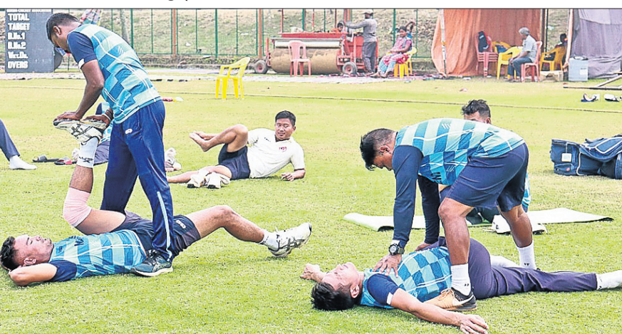
ଦ୍ରୁପ ଗ୍ରାଣ୍ଡସ୍ଲ୍ୟାମ୍ ସୋମବାର ନାଗାଲାଣ୍ଡ ଖେଳାଳିଙ୍କ ଶାରୀରିକ ଅଭ୍ୟାସ।