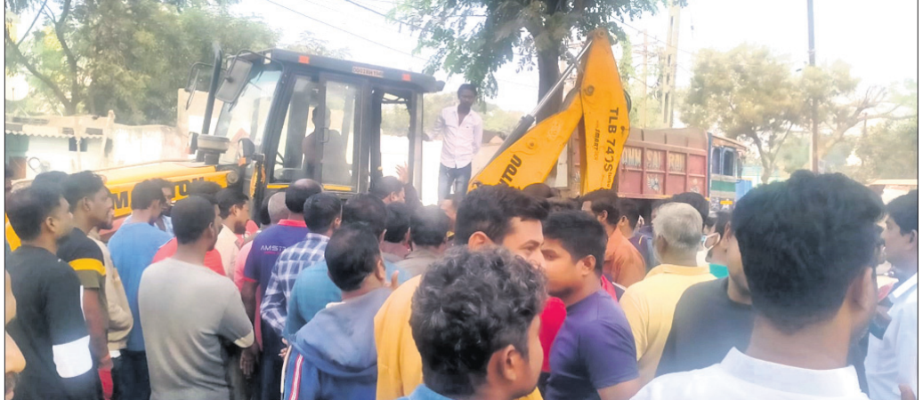
ଶିଖରଚଣ୍ଡୀରେ ଉଠା ଦୋକାନୀମାନେ ଉଚ୍ଛେଦକୁ ବିରୋଧ କରୁଛନ୍ତି ।

ଏଥିରେ ତାଙ୍କ ଗୋଡ଼ରେ ଗଭୀର ଆଘାତ ଲାଗିଥିବାରୁ ଅସ୍ତ୍ରୋପଚାର ସମୟରେ ତାଙ୍କୁ ଉଦ୍ଧାର କାଟି ଦେଇଥିଲେ ।