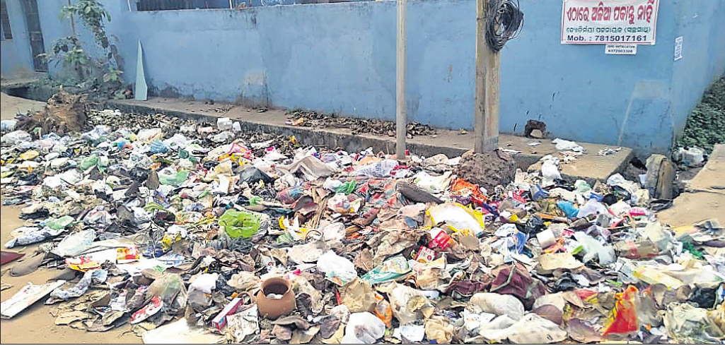
ଅଳିଆ ନ ପକାଇବାକୁ ବିଏମ୍‌ସି ପକ୍ଷରୁ ପୁରୀ ଫକ୍‌ସ ପାଖରେ ଲୋକେ ଆବର୍ତ୍ତନା ପକାଇଛନ୍ତି ।

ଭୁବନେଶ୍ୱର, ୨୧୧(ବୁଧବେ) ସ୍ୱାର୍ଷତି ବାସିନ୍ଦାଙ୍କ କାର୍ଯ୍ୟକ୍ରମକୁ ପୁରୀ ପୁରୀ ପାଇଁ ଭୁବନେଶ୍ୱର ମହାନଗର ନିଗମ (ବିଏମ୍‌ସି) ପକ୍ଷରୁ ଅନେକ ଯୋଜନା କରାଯାଇଛି ।