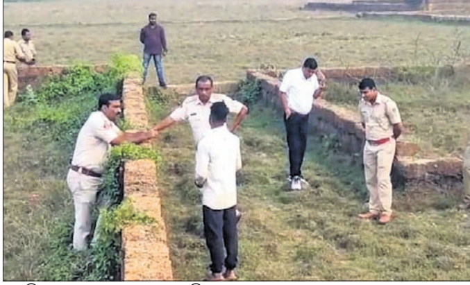
ପୋଲିସ୍ ଘଟଣା ସ୍ଥଳରେ ତଦନ୍ତ କରୁଛି।

ଭୁବନେଶ୍ୱର ମଞ୍ଚେଶ୍ୱର ଥାନା ଅନ୍ତର୍ଗତ କୋରଡ଼କଣ୍ଠା ଅଞ୍ଚଳରେ ଘଟଣା ଘଟିଥିବା ଜଣାପଡ଼ିଛି।