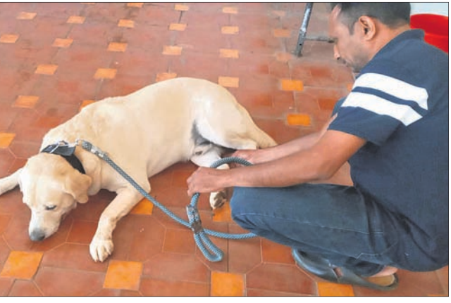
ଭୁବନେଶ୍ୱର, ୨୧ (ବୁଧବେଳା)