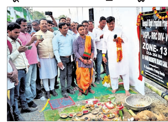
ଜଳ ଯୋଗାଣ ପ୍ରକଳ୍ପର ଶୁଭାରମ୍ଭ ଅବସରରେ ମନ୍ତ୍ରୀ ରଣେ ପ୍ରତାପ ସାହୁ ଓ ଅନ୍ୟମାନେ।