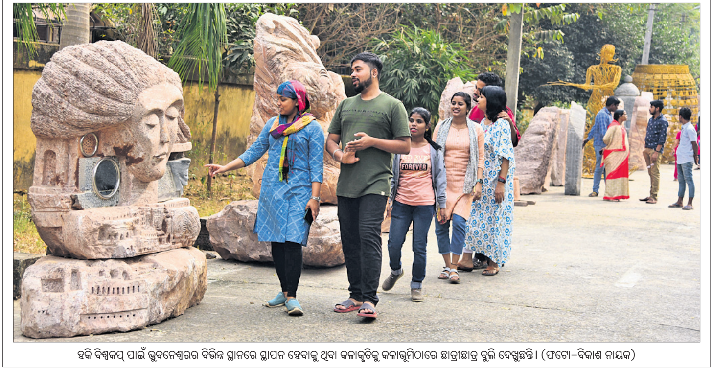
ହଳି ବିଶ୍ୱକର୍ମ ପାଇଁ ଭୁବନେଶ୍ୱରର ବିଭିନ୍ନ ସ୍ଥାନରେ ସ୍ଥାପନ ହେବାକୁ ଥିବା କଳାକୃତିକୁ କଳାଭୂମିଠାରେ ଛାତ୍ରାଛାତ୍ରୀ ବୁଲି ଦେଖୁଛନ୍ତି।