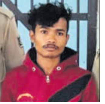
ଗିରଫ ଅଭିଯୁକ୍ତ, ଜବତ ଚାଲିଆ।