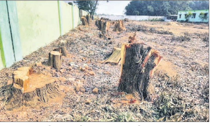
ଗଛଗୁଡ଼ିକୁ ମୂଳରୁ କାଟି ନେବାପରେ ଶ୍ରାହୀନ ପରିବେଶ।

ନବରଙ୍ଗପୁର, ୪୧ (ବି.ପ୍ର.) ନବରଙ୍ଗପୁର ଜିଲ୍ଲା ଡେପୁଟି ମ୍ୟୁନିସିପାଲ କମିଶନର ପ୍ରମୋଦଗଣ୍ଡା ଉଚ୍ଚ ବିଦ୍ୟାଳୟ ପରିସରରେ ବର୍ଷ ବର୍ଷ ଧରି ଠିଆ ହୋଇଥିବା ୧୦୦ରୁ ଊର୍ଦ୍ଧ୍ୱ ଗଛ କାଟି ନିଆଯାଇଛି। ପରିତାପର ବିଷୟ, ସ୍କୁଲ କର୍ତ୍ତୃପକ୍ଷ ଏହା ଜାଣିପାରିଲେନାହିଁ। ଏନିତକି ଜଣାପଡ଼ିବା ପରେ ମଧ୍ୟ ସ୍କୁଲ ପକ୍ଷରୁ ଏ ପର୍ଯ୍ୟନ୍ତ କୌଣସି ସଂକଳ୍ପ ନିଆଯାଇନାହିଁ। କୁଳୁଡ଼ାବାଇ ସ୍ଥିତ ଇନ୍ଦିରା ପ୍ରିୟଦର୍ଶିନୀ ଉଚ୍ଚ ବିଦ୍ୟାଳୟକୁ ୫-ଟି ଅନ୍ତର୍ଭୁକ୍ତ କରାଯାଇ ସୌନ୍ଦର୍ଯ୍ୟକରଣ ଓ ରୂପାନ୍ତରାକରଣ କାର୍ଯ୍ୟ ଆଗେଇ ଚାଲିଛି। ଏଠାରେ ନବମ ଶ୍ରେଣୀରେ ୬୮ ଓ ୧୦ମ ଶ୍ରେଣୀରେ ୬୭ ଛାତ୍ରାଛାତ୍ରୀ ପାଠ ପଢ଼ୁଛନ୍ତି। ବିଦ୍ୟାଳୟ ପରିସର ପାଟେରି ଚତୁଃପାର୍ଶ୍ୱରେ ୧୪୦ଟି ବିରାଟକାୟ ଆକାଶିଆ ଓ ଚାକ୍ଷୁଷ ଗଛ ଥିଲା। ଚାରାଚୋପଣ କରିବାଠାରୁ ଏହାର ଯତ୍ନ ନେଇ ବଡ଼ କରିବା ପର୍ଯ୍ୟନ୍ତ ଅନେକ ଶିକ୍ଷକଙ୍କ ହାତ ରହିଥିଲା। ଏହାସ୍ୱାରା ବିଦ୍ୟାଳୟ ପରିବେଶ ସୁନ୍ଦର ଲାଗିବା ସହ ଛାତ୍ରା ଏବଂ ଅମ୍ଳଜାନ ପୁଷ୍ଟା-୨