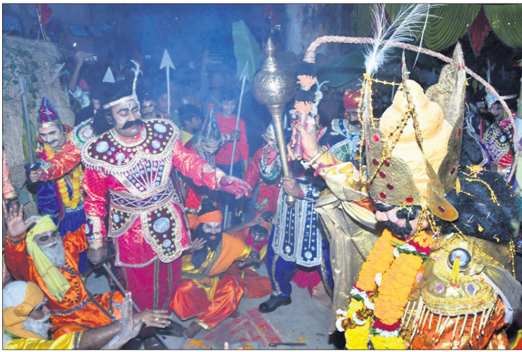
ପୂନିରଖିଲେ କଂସ ଚାକୁଳ ପ୍ରହାର କରୁଛନ୍ତି।

ବରଗଡ଼ ଧନୁଯାତ୍ରା ମହୋତ୍ସବର ରୂପବାର ନବମ ଦିବସରେ ଶ୍ରୀକୃଷ୍ଣ, ବଳରାମଙ୍କୁ ଧରି ଅକ୍ତର ନନ୍ଦବନରୁ ବାହାରିଥିଲେ। ନନ୍ଦରାଜା ବେନିଭାଇଙ୍କ ଶୁଭ ମନାସୀ ଥିଲେ। ଶ୍ରୀକୃଷ୍ଣ, ବଳରାମ ଗୋପ ପରିକ୍ରମା କରି ଗୋପ ମଣ୍ଡପରେ ପହଞ୍ଚିଥିଲେ। ଗୋପପୁର ପରିକ୍ରମାବେଳେ ପ୍ରତିଦିନ ସମ୍ପୂର୍ଣ୍ଣରେ ପୂର୍ଣ୍ଣ କଳସ ପ୍ଳାପନ କରି ଅକ୍ତରଙ୍କ ସହିତ ବେନିଭାଇଙ୍କୁ ପୂଜାର୍ଚ୍ଚନା କରାଯାଇଥିଲା। ଗୋପ ମଣ୍ଡପ ଦୃଶ୍ୟାଭିନୟରେ ଅକ୍ତର ଶ୍ରୀକୃଷ୍ଣ, ବଳରାମଙ୍କୁ ମଥୁରା ନେବା ପାଇଁ ନନ୍ଦରାଜା, ନନ୍ଦରାଜାଙ୍କୁ କହିଥିଲେ। ମାତ୍ର ନନ୍ଦରାଜା, ନନ୍ଦରାଜା ମନା କରିଥିଲେ। ତେବେ ଧନୁଯାତ୍ରା ସାରି ୪ଦିନ ପରେ ମଥୁରାରୁ ଫେରି ଆସିବେ ବୋଲି ଶ୍ରୀକୃଷ୍ଣ ନନ୍ଦରାଜା ଏବଂ ନନ୍ଦରାଜାଙ୍କୁ ବୁଝାଇଥିଲେ। ଶେଷରେ ନନ୍ଦରାଜା, ନନ୍ଦରାଜା ବେନିଭାଇଙ୍କ ବାଟ ଓଗାଳି ଥିଲେ। ଶ୍ରୀକୃଷ୍ଣଙ୍କୁ ମେଳାଣୀ ଦେବାବେଳେ ନନ୍ଦରାଜା, ନନ୍ଦରାଜାଙ୍କ ସମେତ ଗୋପବାସୀ କାନ୍ଦି ପକାଇଥିଲେ। ସେହିପରି ଶ୍ରୀକୃଷ୍ଣ ବିରହରେ ରାଧା ପଥରୋଧ କରିବାକୁ ଚେଷ୍ଟା କରି ବିଫଳ ହୋଇ ପଡ଼ିଥିଲେ। ବେନିଭାଇ ଗୋପପୁର ଛାଡ଼ିବା ପରେ ରାଧାଙ୍କ ସମେତ ସମସ୍ତ