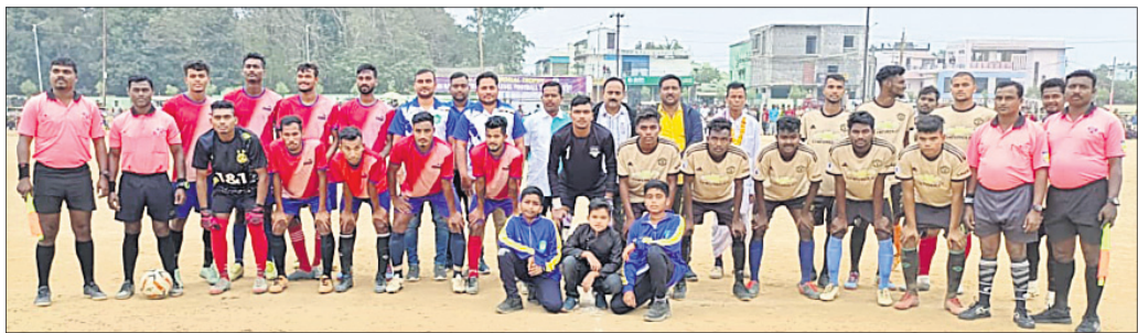
ଅତିଥିକ ଗହଣରେ ଭଉଣ୍ୟ ଦଳର ଖେଳାଳି।