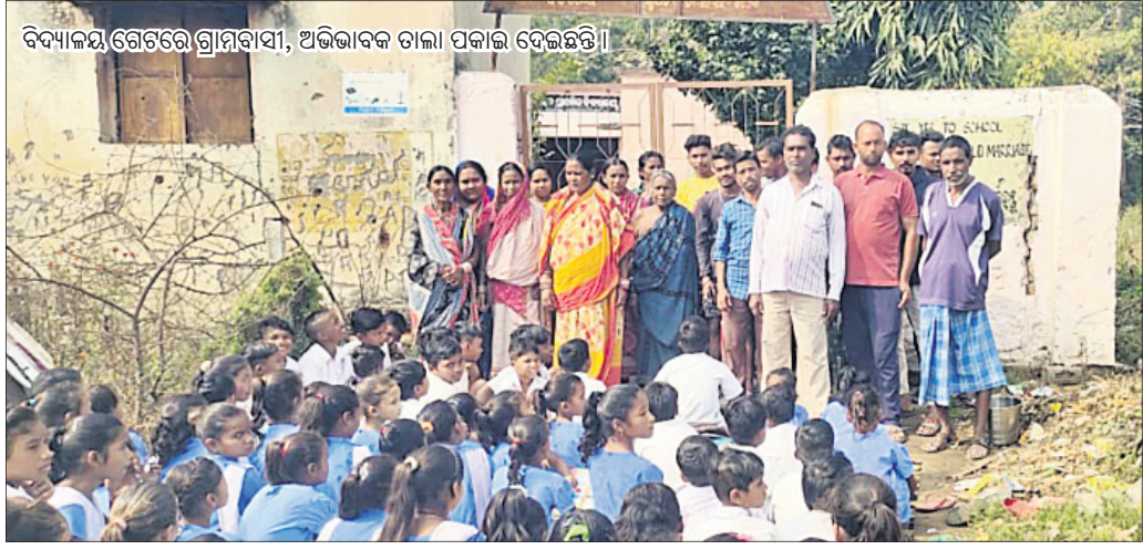
ବିଦ୍ୟାଳୟ ଗେଟରେ ଗ୍ରାମବାସୀ, ଅଭିଭାବକ ତାଲା ପକାଇ ଦେଇଛନ୍ତି।