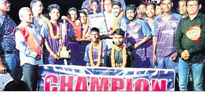
ଅତିଥି ଗଣରେ ତ୍ରୁଟି ସହ ଚାମ୍ପିୟନ ଖଲିଆଖମାର ଦଳ ଖେଳାଳିମାନେ।