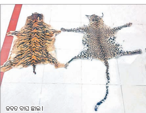
ଜବତ ବାଘ ଛାଳ।