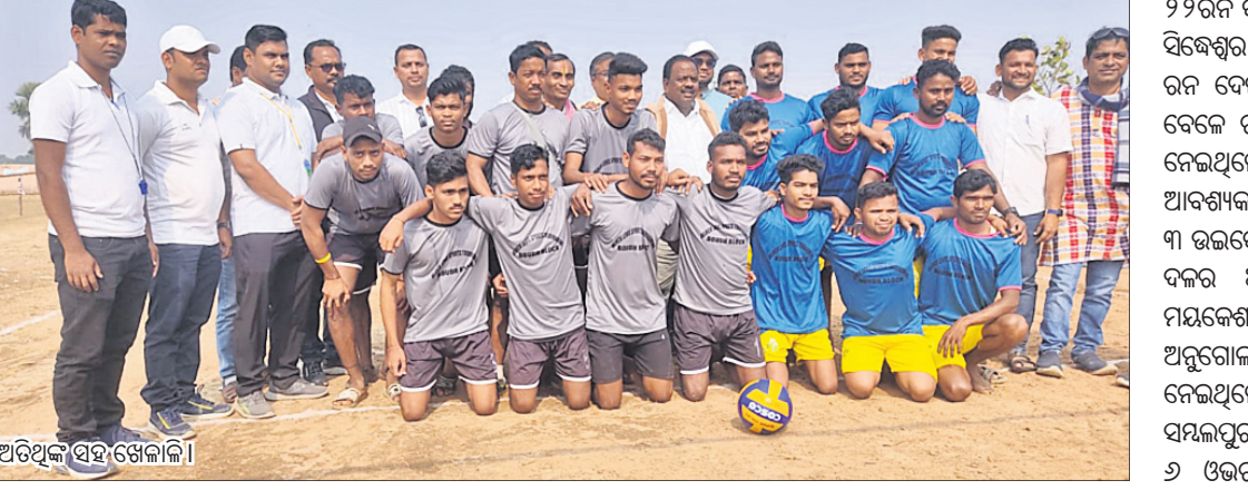
ଅତିଥିକ ସହ ଖେଳାଳି।