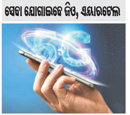
ସେବା ଯୋଗାଇଦେଉଛି ଡିଏ, ଏୟାରଟେଲ ପକ୍ଷରୁ ରୁପବାର ସମ୍ପର୍କରେ ରୁଚିତ କରାଯାଇଛି। ସୂଚନାଯୋଗ୍ୟ, ଦେଶବାସୀଙ୍କୁ ହାଲିଡିଡ ଲକ୍ଷ୍ମୀକେନ୍ଦ୍ର ଓ ଟେଲିକମ୍ ସେବା ଯୋଗାଇ ଦେବାକୁ କେନ୍ଦ୍ର ସରକାର ୫ଟି ସେବାକୁ ଗତ ଅକ୍ଟୋବରରେ ନୂଆଦିଲ୍ଲୀରେ ଆନୁଷ୍ଠାନିକ ଭାବେ ଶୁଭାରମ୍ଭ କରିଥିଲେ। ଏପରି କି ୫ଟି ସେବା ପରାମର୍ଶମୂଳକ ଭାବେ ଆରମ୍ଭ ହୋଇଥିଲା। ସେଥିରେ ଦେଶର ୧୨ଟି ସହର ସମେତ ଓଡ଼ିଶାର ମୟୂରଭଞ୍ଜ ଜିଲ୍ଲା ସାମିଲ ହୋଇଥିଲା। ଗତ ମାସରେ ଆୟୋଜିତ ଏକ କାର୍ଯ୍ୟକ୍ରମରେ କେନ୍ଦ୍ରମନ୍ତ୍ରୀ ଦେବୁର ଯୋଗଦେଇ ୨୦୨୩ ଜାନୁୟାରୀ ୨୬ ପୂର୍ବରୁ ଓଡ଼ିଶାରେ ୫ଟି ସେବା ଆରମ୍ଭ ହେବ ବୋଲି ସୂଚନା ଦେଇଥିଲେ। ତେବେ ଏହାର ଯଥେଷ୍ଟ ପୂର୍ବରୁ ଉଦ୍‌ଘାଟନ ହେବାକୁ ଯାଉଛି।

ରାଜ୍ୟରେ ପ୍ରଥମ କରି ୫ଟି ସେବା ଗୁରୁବାରଠାରୁ ଭୁବନେଶ୍ୱର ଏବଂ କଟକ ସହରରେ ଆରମ୍ଭ ହେବ। ପରବର୍ତ୍ତୀ ସମୟରେ ଏହାର ସମ୍ପ୍ରାପ୍ତ ରାଜ୍ୟର ଅନ୍ୟ ପ୍ରମୁଖ ସହର ଓ ଜିଲ୍ଲା ମୁଖ୍ୟାଳୟରେ ଉପଲବ୍ଧ ହେବ ବୋଲି ଟେଲିକମ୍ ବିଭାଗ(ଡଟ) ପକ୍ଷରୁ ସୂଚନା ଦିଆଯାଇଛି। ରିଲାଏନ୍ସ ଜିଓ ଓ ଭାରତୀ ଏୟାରଟେଲ ଓଡ଼ିଶାରେ ୫ଟି ସେବା ଯୋଗାଇଦେବେ। ଟେଲିକମ୍ ବିଭାଗ ପକ୍ଷରୁ ଗୁରୁବାର ସ୍ଥାନୀୟ ଶିକ୍ଷା ଓ ଅନୁସନ୍ଧାନ ବିଶ୍ୱବିଦ୍ୟାଳୟ (ସୋଆ) ପରିସରରେ ପୂର୍ବରୁ ସାଢ଼େ ୧୦ଟି ସେବା ସ୍ୱତନ୍ତ୍ର କାର୍ଯ୍ୟକ୍ରମ ଆୟୋଜନ କରାଯାଇଛି। ଏଥିରେ ରେଲ, ଯୋଗାଯୋଗ, ଇଲେକ୍ଟ୍ରୋନିକ୍ସ ଓ ସୂଚନା ପ୍ରଯୁକ୍ତିବିଦ୍ୟା ମନ୍ତ୍ରୀ ଅଶ୍ୱିନୀ ଦେବୁର ଯୋଗଦେଇ ୫ଟି ସେବାର ଶୁଭାରମ୍ଭ ସହ ରାଜ୍ୟର ଗ୍ରାମାଞ୍ଚଳସ୍ତରରେ ୧୦୦ରୁ ଅଧିକ ୫ଟି ଟେଲିକମ୍ ଚାଷୀର ମଧ୍ୟ ଉଦ୍‌ଘାଟନ କରିବେ। ଏହି କାର୍ଯ୍ୟକ୍ରମରେ ମୁଖ୍ୟମନ୍ତ୍ରୀ ନବୀନ ପଟ୍ଟନାୟକ ଏବଂ କେନ୍ଦ୍ରମନ୍ତ୍ରୀ ଧର୍ମେନ୍ଦ୍ର ପ୍ରଧାନ ପ୍ରମୁଖ ଯୋଗ ଦେବେ। ଏହି ଅବସରରେ ଡଟ ପକ୍ଷରୁ ଏକ ବୁଲ୍ ଦିନିଆ ଡିଜିଟାଲ ଯୋଗାଯୋଗ ପ୍ରଦର୍ଶନୀର ଆୟୋଜନ ମଧ୍ୟ କରାଯାଇଛି। ଉକ୍ତ ପ୍ରଦର୍ଶନୀରେ ବିଭିନ୍ନ ପ୍ରଯୁକ୍ତି କମ୍ପାନୀ, ଷ୍ଟାର୍ଟଅପ୍ ଯୁବକ, ସି-ଡଟ୍ ଏବଂ ଟେଲିକମ୍ ସେବା ପ୍ରଦାନକାରୀ(ଟିଏପ୍‌ସି) ସମ୍ମାନୀତ ମୁଖ୍ୟ ଅଂଶଗ୍ରହଣ କରିବେ ବୋଲି ଡଟ୍