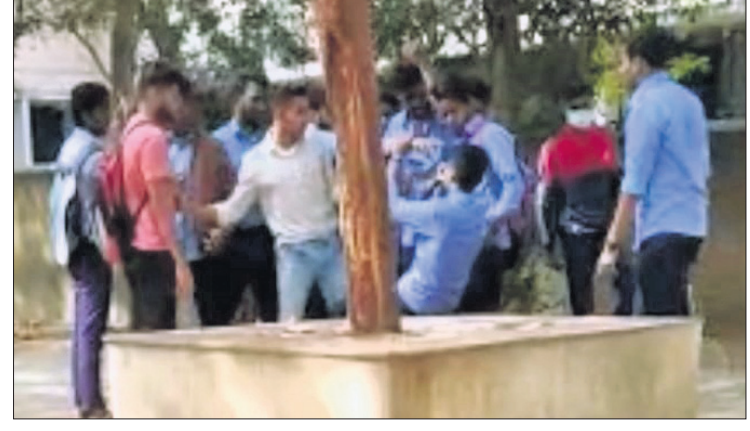
ଭାଇରାଲ ହୋଇଥିବା ଆକ୍ରମଣ ସମୟର ଭିଡ଼ିଓ।

ରାଜ୍ୟର ପ୍ରମୁଖ ଶିକ୍ଷାନୁଷ୍ଠାନ ବିଜେବି କଲେଜ ପୁଣି ଚର୍ଚ୍ଚାକୁ ଆସିଛି। ନିକଟରେ ରାଶି ଓ ଛାତ୍ରୀ ଆନ୍ଦୋଳନକୁ ନେଇ ବିବାଦରେ ଛବି ହୋଇଥିବାବେଳେ ଏବେ କ୍ୟାମ୍ପସ ଭିତରେ ଛାତ୍ରଙ୍କ ଆତଙ୍କରାଜ ଘଟଣା ପଦାକୁ ଆସିଛି। ରୁଧିର ଜଣେ ଜୁନିୟର ଛାତ୍ରଙ୍କୁ କେତେକ ସିନିୟର ଛାତ୍ର ଗାଳିଗୁଳିକ କରିବା ସହ ଗୋଡ଼ାଳ ମାଡ଼ ମାରିଛନ୍ତି। ଘଟଣାକୁ ନେଇ କ୍ୟାମ୍ପସରେ ଉତ୍ତେଜନା ଦେଖାଦେଇଥିବାବେଳେ ଏହାର ଭିତ୍ତି ଓ ଭାଇରାଲ ହୋଇଛି। ଆକ୍ରମଣର ଶିକାର ହୋଇଥିବା ଛାତ୍ର ମୁକ୍ତ ୨ ବିଜ୍ଞାନ ପ୍ରଥମ ବର୍ଷର ଓ ଆକ୍ରମଣକାରୀ ଛାତ୍ରମାନେ ମୁକ୍ତ ୨ କଳା ଓ ବିଜ୍ଞାନ ବିତାଣି ବର୍ଷର ହୋଇଥିବା ଜଣାପଡ଼ିଛି। ସବୁଠାରୁ ଉଦ୍‌ବେଗର ବିଷୟ ହେଲା ଘଟଣା ସମୟରେ ସେଠାରେ ବହୁ ଛାତ୍ର ଉପସ୍ଥିତ ରହି ଦେଖାଶାହାରୀ ସାଜିଥିଲେ। ପୁଣି ଦୀର୍ଘ ସମୟ ଧରି ଆକ୍ରମଣ କରାଯାଉଥିଲେ ମଧ୍ୟ କଲେଜ କର୍ତ୍ତୃପକ୍ଷ କିମ୍ବା କଲେଜ ପକ୍ଷରୁ ତୁରନ୍ତ ପଦକ୍ଷେପ ଗ୍ରହଣ କରାଯାଇ ନ ଥିଲା। ତେବେ ଆହତ ଛାତ୍ରଙ୍କ ବାପା ବଡ଼ଗଡ଼