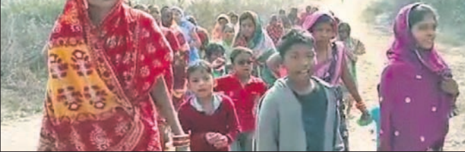
ନିଶା ନିବାରଣ ପାଇଁ ମହିଳାମାନେ ଏକାଠି ହୋଇଛନ୍ତି।

କାରବାର ବୃଦ୍ଧି ପାଇବାର ଭୀତିରେ ଏହାକୁ ନେଇ ପରିବାରରେ ଅଶାନ୍ତି ଦେଖାଦେଉଛି। ଏହି ପରିପ୍ରେକ୍ଷାରେ ତେଲେନ ଗ୍ରାମରେ ବେଆଇନ ନିଶାକାର