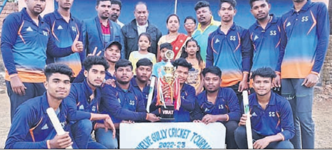
ଚାମ୍ପିୟନ ଦଳକୁ ତ୍ରୁଟି ପ୍ରଦାନ କରାଯାଉଛି।