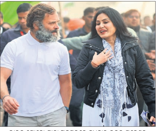
ଭାରତ ଯୋଡ଼ୋ ଯାତ୍ରା ଅବସରରେ ଭୁବନେଶ୍ୱର ଭରତ ପ୍ରଦେଶର ବାଗପତରେ ରାହୁଲ ଗାନ୍ଧୀଙ୍କ ସହ ଟିକି ଅଭିନେତ୍ରୀ କାମ୍ୟା ପଞ୍ଜାବୀ ।

ନୂଆଦିଲ୍ଲୀ, ୪।୧ ଆଗାମୀ ୨୦୨୪ ଲୋକ ସଭା ନିର୍ବାଚନ ଏବଂ ୨୦୨୫ ବିହାର ବିଧାନସଭା ନିର୍ବାଚନ ଲାଗି ଭାଜପା ରାଷ୍ଟ୍ରୀୟ ଅଧ୍ୟକ୍ଷ କେ.ପି. ନନ୍ଦା ବିହାର ପୂଜାଫରପୁର ଜିଲାରୁ ବିଚ୍ଛିନ୍ନ ବଜାଉଲାଇ ବିଶାଳାରେ ଏକ ସାଧାରଣ ସଭାକୁ ସମ୍ବୋଧିତ କରି ବିହାର ବଡ଼ ଧରଣର ପରିବର୍ତ୍ତନ ଚାହୁଁଥିବା ଦାବି କରିଥିଲେ । ସେଥିପାଇଁ ବିହାର ଜନସାଧାରଣ ପ୍ରଧାନମନ୍ତ୍ରୀ ନରେନ୍ଦ୍ର ମୋଦିଙ୍କ ରାଷ୍ଟ୍ରୀୟ ନେତୃତ୍ୱ ଉପରେ ଆଶ୍ରୟ ପ୍ରକଟ କରି ଭାଜପା ସରକାର ଆଣିବାକୁ ମନ ସ୍ଥିର କରିସାରିଲେଣି । ଭାଜପାଠାରୁ ସମ୍ପର୍କ ଛିନ୍ନ କରି ମହାମେଣ୍ଡ ସରକାର ଗଢ଼ିଥିବା ମୁଖ୍ୟମନ୍ତ୍ରୀ ନୀତୀଶ କୁମାରଙ୍କୁ ଭାଜପା ଅଧ୍ୟକ୍ଷ ସମାଲୋଚନା କରିଥିଲେ । ରାଜ୍ୟବାସୀ ତିଏନ୍‌ଏସୁ ଜନାଦେଶ ଦେଇଥିଲେ । ମେଣ୍ଡ ଭାଙ୍ଗି ନୀତୀଶ ରାଜ୍ୟବାସୀଙ୍କୁ ଅପମାନିତ