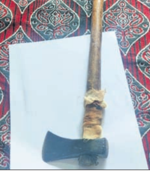
ମହାଦେବ ଓ ପୁରୁଷୋତ୍ତମଙ୍କ ମଧ୍ୟରେ କୌଣସି କାରଣରୁ ନେଇ ବତ୍ୟା କରି ଦୋଳିଥିଲା। ଏଥିରେ ଉଦ୍‌ସିପ ହୋଇ ମହାଦେବ ଏକ ଚାଲିଆରେ ପୁରୁଷୋତ୍ତମଙ୍କୁ ଆକ୍ରମଣ କରିଥିଲେ। ଅନୁପତରା ଜଙ୍ଗଲରେ ମଦ ପିଇଥିଲେ। ମଦ ପିଆ ସରିବା ପରେ ନିମ୍ନ ଘରକୁ ଚାଲି ଆସିଥିଲେ। ଏହାପରେ