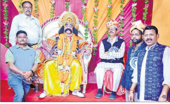
କଂସ ଦରବାରରେ ମହାସୀନ ଅତିଥିବୁଦ୍।

ବନ୍ଧବାହାଲ ଆଞ୍ଚଳିକ ଧନୁଯାତ୍ରା ମହୋତ୍ସବର ରୁଧିବାର ପଞ୍ଚମ ଦିବସରେ ଗୋପପୁରରେ କାଳୀୟ ଦଳନ, ଗୋପୀନାଥଙ୍କ ବସ୍ତ୍ର ହରଣ ଓ ଗୋପୀଙ୍କ ଦହିବିଦା ଆଦି କାର୍ଯ୍ୟକ୍ରମ ଅନୁଷ୍ଠିତ ହୋଇଥିଲା। କଲୋନୀ ଯୋଖରାରେ ପାରମ୍ପରିକ ରୀତିନୀତିରେ କୃଷ୍ଣ ନୈବାରେ ବସି କାଳୀୟ ଦଳନ କରିଥିଲେ। ଯୋଖରା କୂଳରେ ଗୋପୀଙ୍କ ବସ୍ତ୍ର ହରଣ ହୋଇଥିଲା। ସେହିପରି ମୟୁରାପୁରରେ କାଳୀୟ ଦଳନରେ କଂସ ମର୍ମାହତ, ନାରଦଙ୍କ ସହିତ ଆଲୋଚନା ଓ ରଙ୍ଗସଭା, ଧନୁଯାତ୍ରାର ଆଲୋଚନା, ଅକ୍ତୁରଙ୍କୁ ଗୋପପୁର ପ୍ରେରଣ ଆଦି କାର୍ଯ୍ୟକ୍ରମ