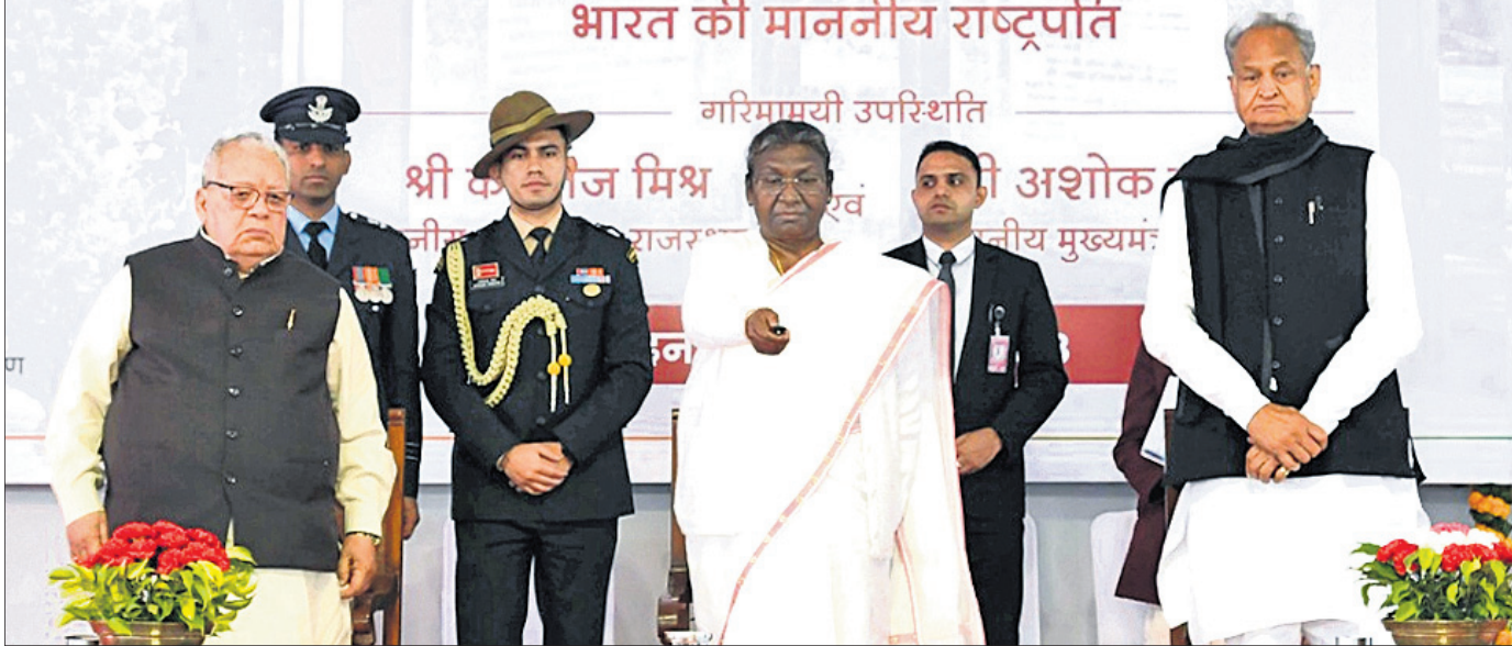
ରାଜସ୍ଥାନରେ ପାଞ୍ଚାମ ଗ୍ରାହ କର୍ପୋରେଶନ ଅଫ୍ ଇଣ୍ଡିଆ ଲିମିଟେଡ୍ ପକ୍ଷରୁ ଆୟୋଜିତ ଏକ ସ୍ଵତନ୍ତ୍ର କାର୍ଯ୍ୟକ୍ରମରେ ଯୋଗଦେଇ ରାଷ୍ଟ୍ରପତି କ୍ରୋମପା ମୁର୍ମୁ ପାଞ୍ଚାମ ଗ୍ରାହର ୮.୯ ଲକ୍ଷଙ୍କୁର ଯୋଗାଣ ପାଞ୍ଚାମ ଯୁନିଟ୍ ଶୁଭାରମ୍ଭ ରାଜସ୍ଥାନ ରାଜ୍ୟପାଳ କଳରାଜ ମିଶ୍ର, ମୁଖ୍ୟମନ୍ତ୍ରୀ ଅଶୋକ ଗେହଲଟଙ୍କ ଉପସ୍ଥିତରେ କରୁଛନ୍ତି।