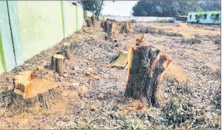
ଗଛଗୁଡ଼ିକୁ ମୂଳରୁ କାଟି ନେବାପରେ ଶ୍ରୀହୀନ ପରିବେଶ।

ନବରଙ୍ଗପୁର, ୪୧ (ବି.ପ୍ର.) ନବରଙ୍ଗପୁର ଜିଲ୍ଲା ଡେପ୍ୟୁଟି ମୁଖ୍ୟ ଲୁଗାବାହା ଲାଭି ପ୍ରୟୋଗନୀ ଉଚ୍ଚ ବିଦ୍ୟାଳୟ ପରିସରରେ ବର୍ଷ ବର୍ଷ ଧରି ଠିଆ ହୋଇଥିବା ୧୦୦ରୁ ଊର୍ଦ୍ଧ୍ୱ ଗଛ କାଟି ନିଆଯାଇଛି। ପରିତାପର ବିଷୟ, ସ୍କୁଲ କର୍ତ୍ତୃପକ୍ଷ ଏହା ଜାଣିପାରିଲେନାହିଁ। ଏନିତିକ ଜଣାପଡ଼ିବା ପରେ ମଧ୍ୟ ସ୍କୁଲ ପକ୍ଷରୁ ଏ ପର୍ଯ୍ୟନ୍ତ କୌଣସି ବଚଳା ଦିଆଯାଇନାହିଁ। କୁଲୁଡ଼ାବାଲ ସ୍ଥିତ ଲାଭି ପ୍ରୟୋଗନୀ ଉଚ୍ଚ ବିଦ୍ୟାଳୟକୁ ୫-ଟି ଅନ୍ତର୍ଭୁକ୍ତ କରାଯାଇ