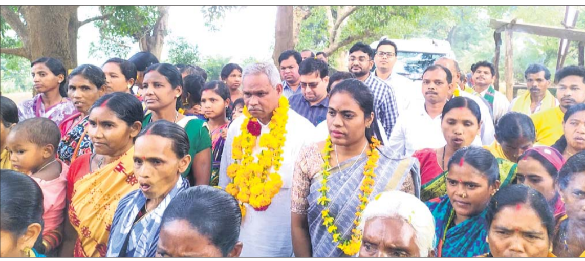
ଗ୍ରାମବାସୀଙ୍କ ଗହଣରେ ବିଧାୟକ ଏବଂ ରୁକ୍ମ ଅଧ୍ୟକ୍ଷା ।