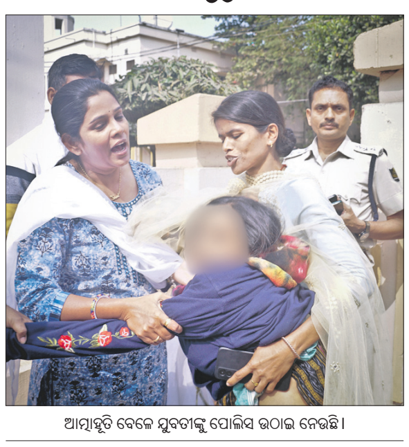
ଆତ୍ମାହୁତି ଦେଇ ମୁବତୀଙ୍କୁ ପୋଲିସ ଉଠାଇ ନେଇଛି।

କେନ୍ଦ୍ରାପଡ଼ା ଜିଲ୍ଲା ପଟ୍ଟାମୁଣ୍ଡା ଥାନା ଅନ୍ତର୍ଗତ ରାଜକନିକା ଅଞ୍ଚଳର ଜଣେ ମୁବତୀ ଦେହରେ କିରୋସିନ ତାଳି କଟକଣ୍ଡିତ ପୋଲିସ ମୁଖ୍ୟାଳୟ ସମ୍ମୁଖରେ ଆତ୍ମାହୁତି ଉଦ୍ୟମ କରିଥିଲେ।