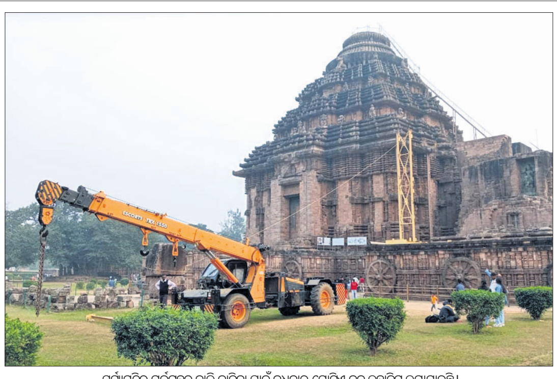
ସୂର୍ଯ୍ୟମନ୍ଦିର ଗର୍ଭଗୃହରୁ ବାଲି କାଢ଼ିବା ପାଇଁ ରୁଧିରୀ ଗୋଟିଏ ବଡ଼ ଲୁହାଦିନି ଲଗାଯାଇଛି।

କୋହଲିଙ୍କ ସହ ବୃନ୍ଦାବନରେ ଅନୁଷ୍ଠା ବଲିଉଡ୍ ଅଭିନେତ୍ରୀ ଅନୁଷ୍ଠା ଶର୍ମିଷ୍ଠା ସ୍ୱାମୀ ବିବାହ କୋହଲିଙ୍କ ସହ ବୃନ୍ଦାବନ ଭ୍ରମଣରେ ଯାଇଛନ୍ତି।