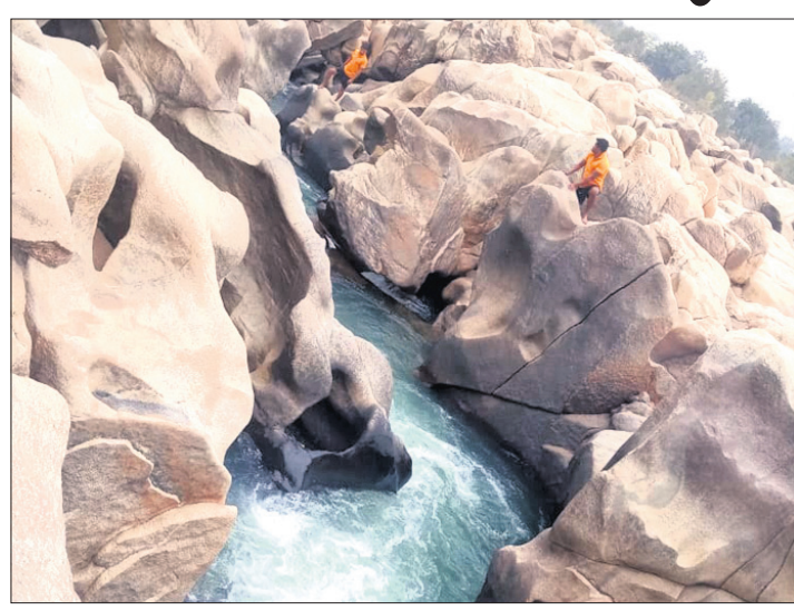
ଇନ୍ ନଦୀର କନାକୂଷ ଘାଟରେ ଅଗ୍ନିଶମ ବିଭାଗ ଖୋଜାଖୋଜି କରୁଛି।

ଭୁବନେଶ୍ୱର, ୪।୧ (ଡି.ଏନ.ଏ.): ଭୁବନେଶ୍ୱର ଜିଲ୍ଲା ତଳପାଟଣା ଥାନା ଇନ୍ ନଦୀର କନାକୂଷ ଘାଟରେ ବୁଧବାର ଭାସିଯାଇ ଜଣେ ମୃତ୍ୟୁ ଘଟିଛି।