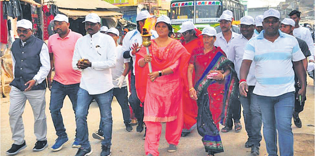
କ୍ରୀଡ଼ା ପ୍ରତିଯୋଗିତା ନିମନ୍ତେ ମଣ୍ଡଳ ଶୋଭାଯାତ୍ରା।