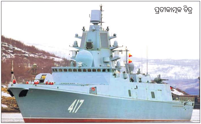
ପ୍ରତ୍ୟାକାଶିତ ରୁଷିଆର ପ୍ରତିରକ୍ଷା ବଳ

ରୁଷିଆର ପ୍ରତିରକ୍ଷା ବଳର ନୂଆ କାର୍ଯ୍ୟକ୍ରମରେ ଭିତ୍ତିପ୍ରତି କର୍ମରେ ଉନ୍ନତ ହୋଇଛି। ଏହି କାର୍ଯ୍ୟକ୍ରମରେ ସେ ପ୍ରତିରକ୍ଷା ମନ୍ତ୍ରୀ ସର୍ଗେୟ ଶୋଇଗୁ ଏବଂ ପ୍ରତିରକ୍ଷା କମିଶନର ଆଲୋଚନା କରିଛନ୍ତି। ପ୍ରତିରକ୍ଷା ମନ୍ତ୍ରୀ ହେଲେ, ଏହି ମୁକ୍ତାହାତରେ ସର୍ବମୁଖ୍ୟ ହାଇପରସୋନିକ୍ ମିଶାଇଲ ସିଷ୍ଟମ 'ଜିର୍କୋନ' ରହିଛି।