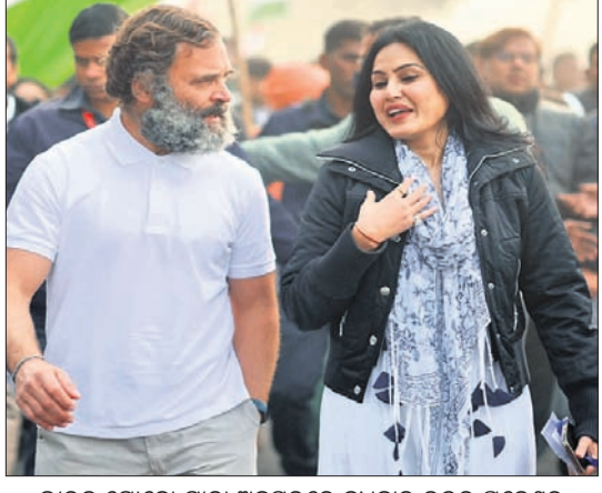
ଭାରତ ଯୋଡ଼ା ଯାତ୍ରା ଅବସରରେ ଭୁବନେଶ୍ୱରରେ ଭବିଷ୍ୟତ ପ୍ରଦେଶର ବାଗପତରେ ରାହୁଲ ଗାନ୍ଧୀଙ୍କ ସହ ଚିଲି ଅଭିନେତ୍ରୀ କାମ୍ୟା ପଞ୍ଜାବୀ ।