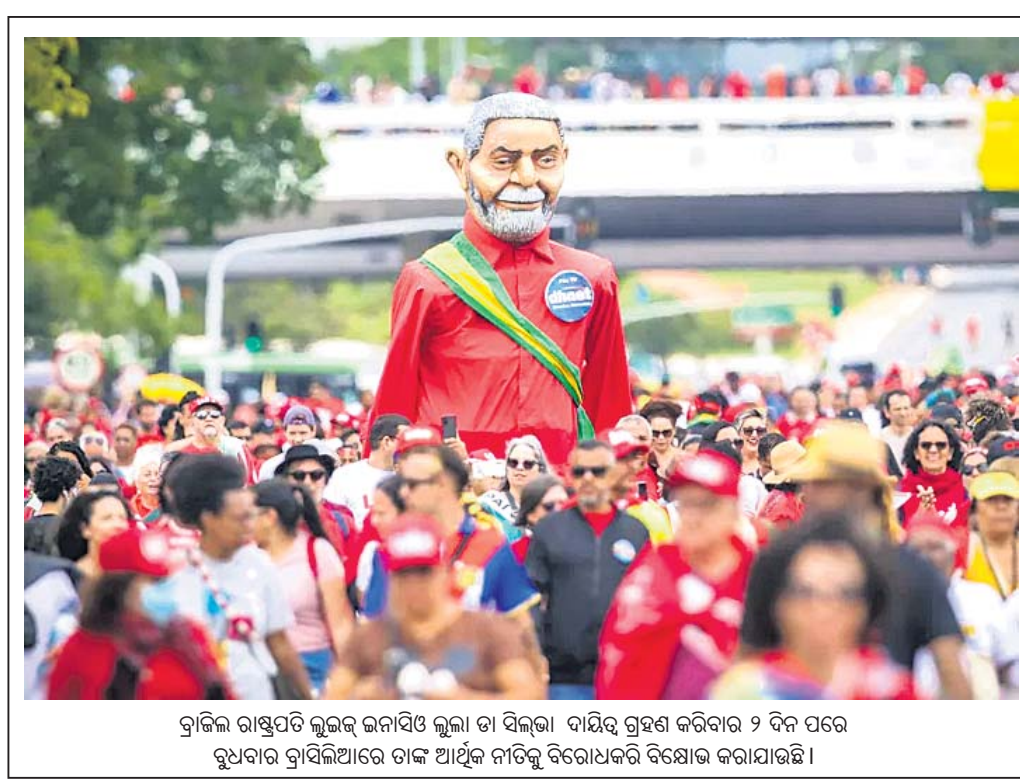
ବ୍ରାଜିଲ ରାଷ୍ଟ୍ରପତି ଜୁଲିଓ ଇନାସିଓ ଲୁଲ୍ଲା ତା ସ୍ତ୍ରୀ ସାହିତ୍ୟ ପଢ଼ିବା ପାଇଁ ୨ ଦିନ ପରେ ବୁଧବାର ବ୍ରାସିଲିଆରେ ଚାଳିଥିବା ଆର୍ଥିକ ନୀତିକୁ ବିରୋଧ କରି ବିକ୍ରମ କରାଯାଇଛି।

ଏମ୍ପି ସରକାରଙ୍କ ବିରୋଧରେ ୧୦ ହଜାର କୋଟିର ମାମଲା ଦାଖଲ ହୋଇଛି। ଏହି ମାମଲାରେ ଏମ୍ପି ସରକାରଙ୍କ ବିରୋଧରେ ୧୦ ହଜାର କୋଟିର ମାମଲା ଦାଖଲ ହୋଇଛି।