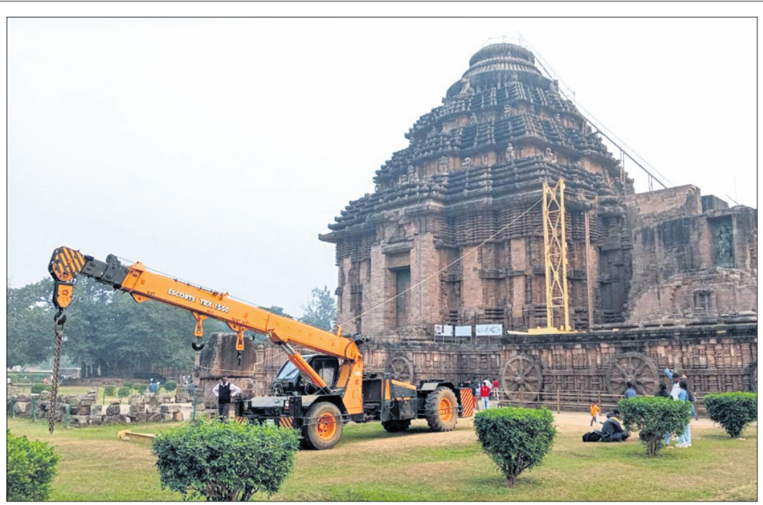
ସୂର୍ଯ୍ୟମନ୍ଦିର ଗର୍ଭଗୃହରୁ ବାଲି କାଢ଼ିବା ପାଇଁ ରୁଧିର ଗୋଟିଏ ବଡ଼ ଲୁହାବିମ୍ବ ଲଗାଯାଇଛି।

କୋହଲିଙ୍କ ସହ ବୃନ୍ଦାବନରେ ଅନୁଷ୍ଠା ବଲିଉଡ୍ ଅଭିନେତ୍ରୀ ଅନୁଷ୍ଠା ଶର୍ମା ସ୍ୱାମୀ ବିବାହ କୋହଲିଙ୍କ ସହ ବୃନ୍ଦାବନ ଭ୍ରମଣରେ ଯାଇଛନ୍ତି।