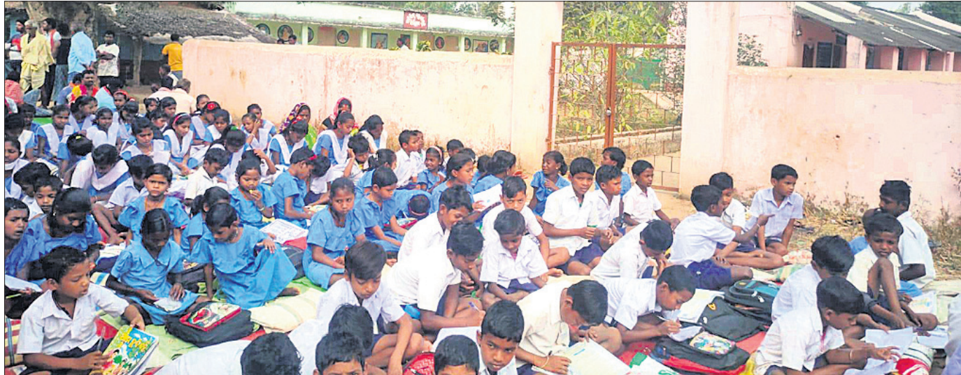
ଛାତ୍ରଛାତ୍ରୀ ସ୍କୁଲ ବାହାରେ ବସି ପାଠ ପଢ଼ୁଛନ୍ତି।