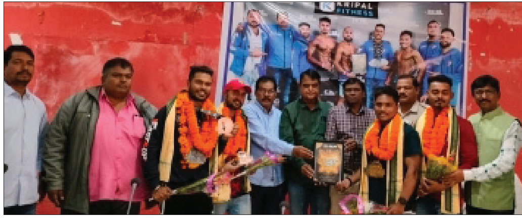
କୃତୀ ପ୍ରତିଯୋଗୀଙ୍କୁ ସମ୍ବର୍ଦ୍ଧିତ କରାଯାଇଛି । କୁସୁ, ଦୁବାଇର ଏକ ହଜାରରୁ ଅଧିକ ପ୍ରତିଯୋଗୀ ଅଂଶଗ୍ରହଣ କରିଥିଲେ।

ସୁବର୍ଣ୍ଣପୁର ଜିଲା ବୀରମହାରାଜପୁର ମୈତ୍ରୀ ସଦନରେ ଗୁରୁବାର ବଡ଼ି ବିଲ୍ଡିଂ ପଦକ ଜିତିଥିବା ଜିଲାର ୪ ଜଣଙ୍କୁ ସମ୍ବର୍ଦ୍ଧିତ କରାଯାଇଛି।