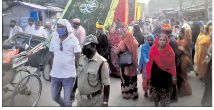
ଚରଭା ସହରରେ ବାହାରି ଥିବା ଚାନ୍ଦର ଶୋଭାଯାତ୍ରା ।

ଉତ୍କଳକେଟ ନେଇଥିଲେ। ଜବାବରେ ବଲାଙ୍ଗୀର ଦଳ ୧୦୭ଭରରେ ୪ ଉତ୍କଳକେଟ ହରାଇ ୧୨୪ଭର କରିଥିଲା।