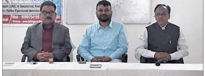
ଶିବିରରେ ମହାସାଧନ ତାଲୁକ ଓ ଅତିଥି ।

ବାର୍ଦ୍ଧଶ୍ରୀଣୀ ହାଇସ୍କୁଲ ଖେଳ ପଡ଼ିଆରେ ବୃକ୍ଷ ରୋପଣ ବାର୍ଦ୍ଧଶ୍ରୀଣୀ, ୫।୧ (ଡି.ଏନ.ଏ.): ବୌଦ୍ଧ ଜିଲା ବାର୍ଦ୍ଧଶ୍ରୀଣୀ ପଞ୍ଚାୟତ ବାର୍ଦ୍ଧଶ୍ରୀଣୀ ହାଇସ୍କୁଲ ଖେଳ ପଡ଼ିଆରେ ବୃକ୍ଷ ରୋପଣ କାର୍ଯ୍ୟକ୍ରମ ଅନୁଷ୍ଠିତ ହୋଇଯାଇଛି।