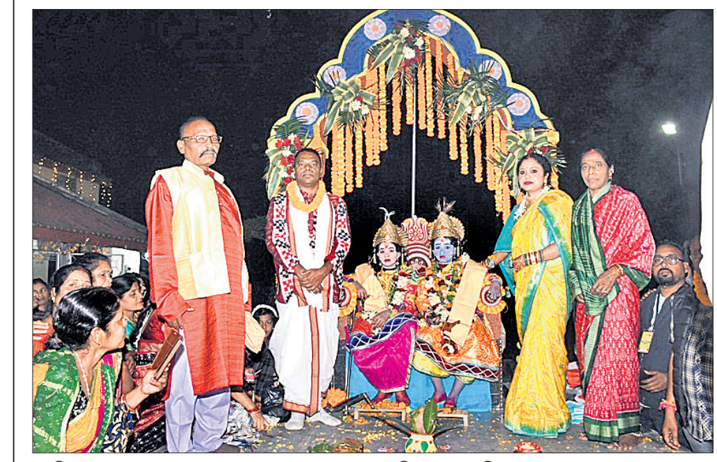
ଉପକ୍ରମାପାଳକ ସରକାରୀ ବାସଭବନରେ ଶ୍ରୀକୃଷ୍ଣ ଓ ବଳରାମଙ୍କୁ ବୋଲିରେ ଝୁଲାଇଯାଇଛି ।