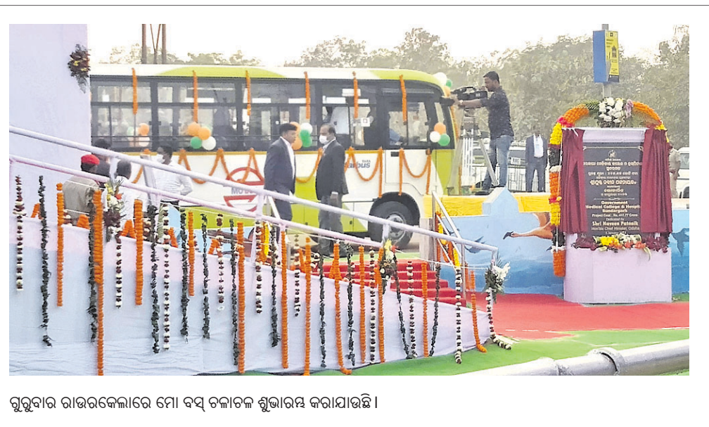
ଗୁରୁବାର ରାଉରକେଲାରେ ମୋ ବସ୍ ଚଳାଚଳ ଶୁଭାରମ୍ଭ କରାଯାଇଛି।

ଚିଲିକାଗଡ଼, ୫।୧ (ଡି.ଏନ.ଏ.) ଅସୁସ୍ଥ ହେବା ନେଇ ପରିବାର ଲୋକେ ତାହାରଖାନାକୁ ଆଣିଥିଲେ। ତେବେ ଜନେକ ଡାକ୍ତର ଏକ ଇଞ୍ଜେକ୍ସନ୍ ଦେବା ପରେ ତାଙ୍କର ମୃତ୍ୟୁ ଘଟିଥିବା ଅଭିଯୋଗ ହୋଇଥିଲା। ଏନେଇ ପରିବାର ଲୋକେ ମୃତ୍ୟୁକୁ ନେଇ ଗୁରୁତାର ଉତ୍ତେଜନା ପ୍ରକାଶ ପାଇଥିଲା। ଛାତ୍ରୀ ଜଣକ ଆସି ପାରିବୁଛନ୍ତି କରିଥିଲେ।