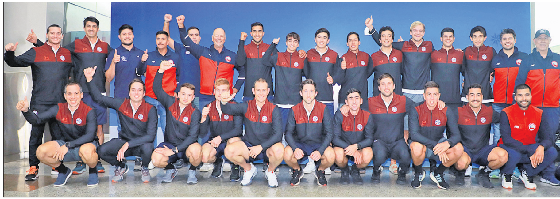
ପୁରୁଷ ହକି ବିଶ୍ୱକପ୍ ଖେଳିବା ଲାଗି ଭୁବନେଶ୍ୱରରେ ପହଞ୍ଚିଥିବା ଚିଲି ଦଳର ଖେଳାଳିମାନେ ।