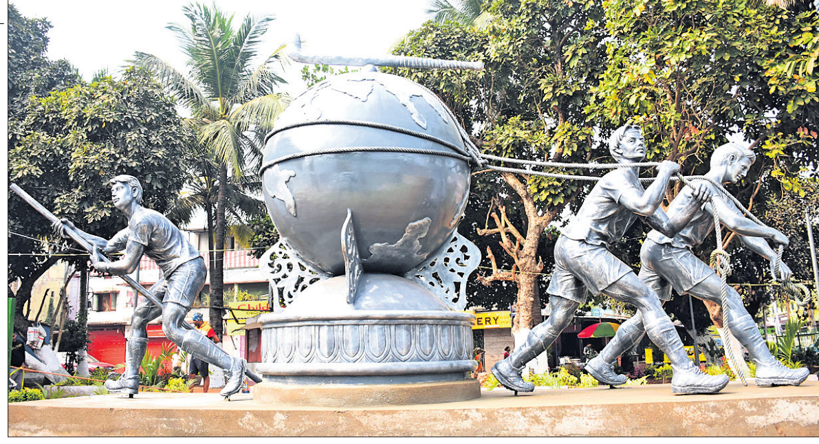
ଭୁବନେଶ୍ୱର ସୌନ୍ଦର୍ଯ୍ୟକରଣ ଅବସରରେ ହାଉସିଂବୋର୍ଡ୍ ଛକ ନିକଟରେ ହକି ବିଶ୍ୱକପ୍ ପ୍ରତିକୃତି ।

ପୁଣେ, ୫୧୧ (ପି.ଟି.) ଆଗାମୀ ପ୍ରାୟ ଯୋଗୁ ଗୀତ ଓପନ ମହାରାଷ୍ଟ୍ର ଚେନ୍ନି ପ୍ରତିଯୋଗିତାକୁ ଓହରିଯାଇଛନ୍ତି ଚପ୍ ସିଡ୍ ମାରିନ୍ ସିଲିକ୍ । ୨୦୧୪ ୟୁଏପ୍ ଓପନ ବିଜେତା କ୍ୱାର୍ଟରଫାଇନାଲରେ ନେଦରଲାଣ୍ଡର ଚଳନ ଟ୍ରିକ୍ସ୍ଟ୍ରେଲ୍ ଭେଟିଆଡୋ ମାତ୍ର ରୁରୁବାର ସକାଳେ ଖାର୍ଯ୍ୟ ଚେଲି ଟାକ୍ ଆଗୁରେ ଆଗାତ ଲାଗିଛି । କ୍ଲୋଏସିଆର ଏହି ୩୪ ବର୍ଷୀୟ ଖେଳାଳି ପୂର୍ବରୁ ୨୦୧୦ରେ