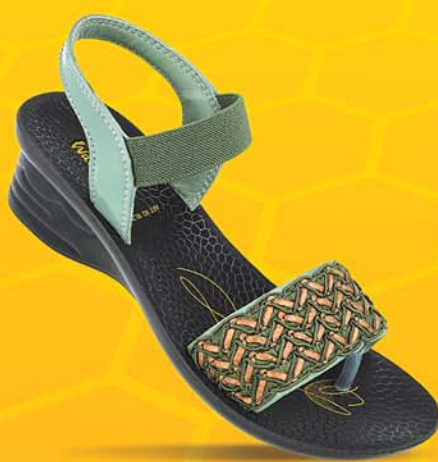
[WL7814 | ₹ 379.00*]