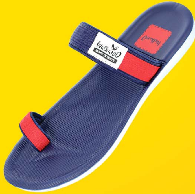
[WG5328 | ₹ 279.00*]