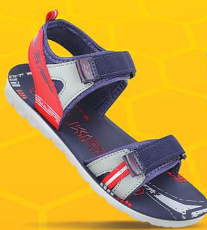
[WK788 | ₹ 299.00*]