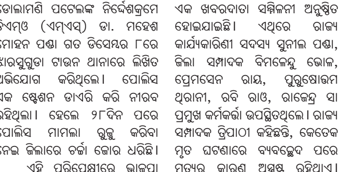
ସମଲପୁର, ୫୧୧ (ବ୍ୟୁରୋ)

ସମଲପୁର, ୫୧୧ (ବ୍ୟୁରୋ) ସମଲପୁର, ୫୧୧ (ବ୍ୟୁରୋ)