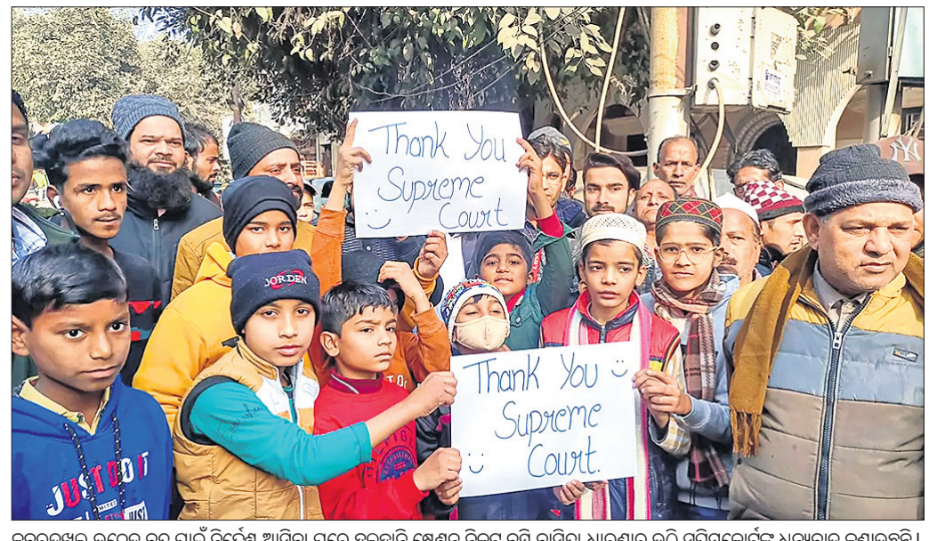
ଜବରଦଖାଳ ଉଚ୍ଛେଦ ବନ୍ଦ ପାଇଁ ନିର୍ଦ୍ଦେଶ ଆସିବା ପରେ ହଲ୍‌ହାଉସି ଷ୍ଟେଶନ ନିକଟ ବସ୍ତି ବାସିନ୍ଦା ଧାରଣାରୁ ଉଠି ସୁପ୍ରିମକୋର୍ଟକୁ ଧନ୍ୟବାଦ ଜଣାଉଛନ୍ତି।

ଅଭିଭାବକଙ୍କୁ ଶୁଣାଣି କରନ୍ତୁ। ଭାରତ ଓ ତାଇବା ଏକାଠି କାର୍ଯ୍ୟ କଲେ ବିଶ୍ଵ ଲାଭବାନ ହେବ ବୋଲି ଦଲାଇ ଲାମା କହିଛନ୍ତି।