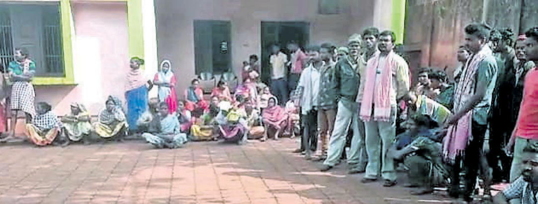
ଧାନା ଆଗରେ ଧାରଣାରେ ଗ୍ରାମବାସୀ।