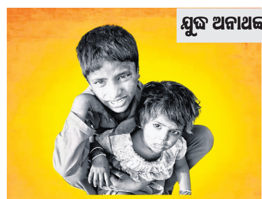
ମୁକ୍ତ ଅନାଥଙ୍କ ବିଶ୍ୱ ଦିବସ

ମୁମ୍ବାଇ ରେଲୱେ ପୋଲିସ୍ କମିଶନରେବା ରେଲୱେ ଟ୍ରାଇବ୍ କରି ଲେଖୁଛି, ଆପଣ ହେଉଛନ୍ତି ସମସ୍ତଙ୍କ ପାଇଁ ଆଦର୍ଶ। ଯଦି ଆପଣ ଟ୍ରେନ୍ ଡୋର ନିକଟରେ ଯାତ୍ରା କରିବା ବିପଜ୍ଜନକ ବୋଲି ଜାଣି ଏପରି କରିବେ, ତେବେ ଏହା ଆପଣଙ୍କ ପ୍ରଶଂସକମାନଙ୍କୁ ହୁଲ୍ ବାଢ଼ି ଦେଇପାରେ। ଆପଣ ଦୟାକରି ଏମିତି କରନ୍ତୁ ନାହିଁ। ବାସ୍ତବ ଜୀବନରେ ତାଙ୍କୁ ଏପରି କୋଣସି ଷ୍ଟକ୍ ନ କରିବାକୁ ପରାମର୍ଶ ଦେଇଛନ୍ତି।