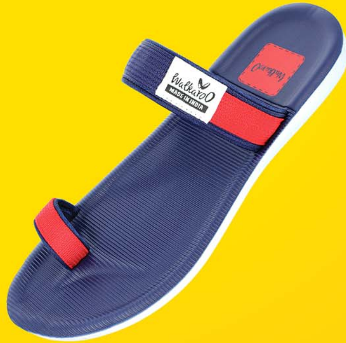
[WG5328 | ₹ 279.00*]