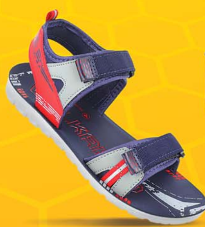
[WK788 | ₹ 299.00*]