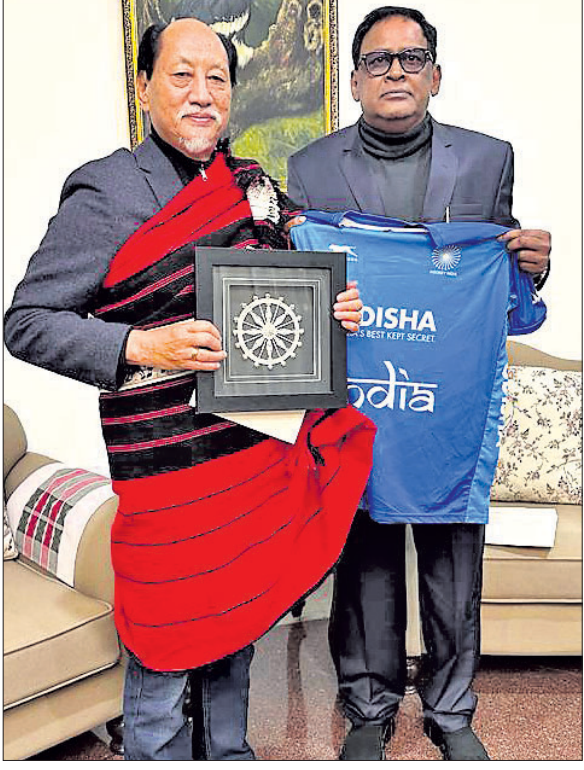
ନାଗାଲାଣ୍ଡ ପୁଖ୍ୟମନ୍ତ୍ରୀ ନିୟୁ ରିଓକୁ ମନ୍ତ୍ରୀ ନବକିଶୋର ଦାସ ନିମନ୍ତେ କବୁଛନ୍ତି