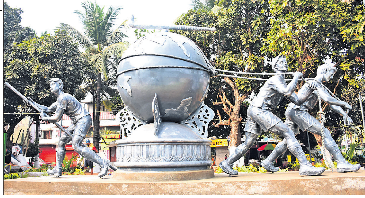
ଭୁବନେଶ୍ୱର ସୌନ୍ଦର୍ଯ୍ୟକରଣ ଅବସରରେ ହାଉସିଂବୋର୍ଡ୍ ଛକ ନିକଟରେ ହକି ବିଶ୍ୱକପ୍ ପ୍ରତିକୃତି ।

ଭୁବନେଶ୍ୱର, ୫୧୧ (ସି.ଟି.) ଆଗାମୀ ପ୍ରାୟ ଯୋଗୁ ଗାତା ଓପନ ମହାରାଷ୍ଟ୍ର ଚେନିସ ପ୍ରତିଯୋଗିତାକୁ ଓହରିଯାଇଛନ୍ତି ଚପ୍ ସିଡ୍ ମାରିନ୍ ସିଲିକ୍ । ୨୦୧୪ ୟୁଏସ୍ ଓପନ ବିଜେତା କ୍ୱାର୍ଟରଫାଇନାଲରେ ନେଦରଲାଣ୍ଡର ଚଳନ ଗ୍ରୁପ୍ରେ ଉଭେଥାଟେ । ମାତ୍ର ଗୁରୁବାର ସକାଳେ ଖାର୍ବିଆରେ ତାଙ୍କ ଆଶ୍ଚରେ ଆଗାତ ଲାଗିଛି । କ୍ରୋଏସିଆର ଏହି ୩୪ ବର୍ଷୀୟ ଖେଳାଳି ପୂର୍ବରୁ ୨୦୧୦ରେ ପ୍ରବେଶ କରିଛନ୍ତି ।