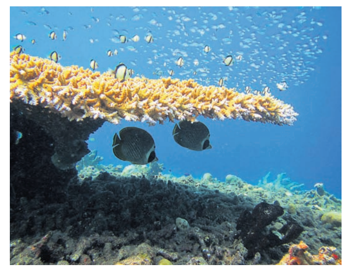
ଖାଲି ସେତିକି ନୁହେଁ ପ୍ରବାଳ ଖାଉଥିବା ପ୍ରାଣୀ ସେଠାରୁ ହଟାଯାଇବା ଲାଗି ଅନ୍ୟମାଛ ନିଜ ନାକ ଏବଂ ଡେଶର ବ୍ୟବହାର କରୁଥିବା ଦେଖାଯାଇଛି।