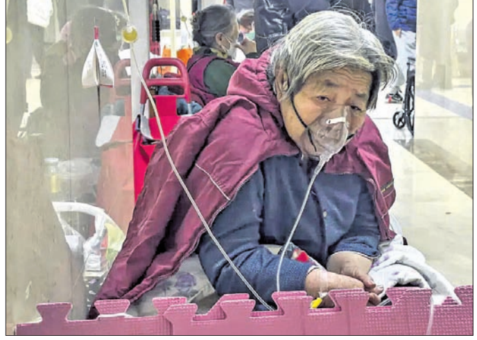
ବେଙ୍ଗି, ୫୧୧: ଚାଲନା ରାଜଧାନୀ ବେଙ୍ଗିରେ କୋଭିଡ୍ ସଂକ୍ରମଣ ଉଚ୍ଚତା ରୂପ ଧାରଣ କରିଛି।