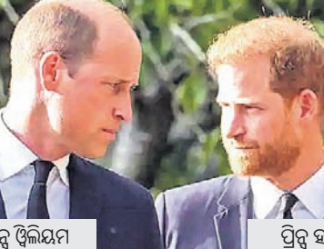
ପ୍ରିନ୍ସ ଫ୍ରିଲିୟମ ପ୍ରିନ୍ସ ହ୍ୟାରି

ଲଣ୍ଡନ, ୫୧୧ (ପି.ଟି.): ପ୍ରିନ୍ସ ହ୍ୟାରିଙ୍କ ଆମେରିକୀୟ ସ୍ତ୍ରୀ ମେଗାନ ମାର୍କେଲଙ୍କୁ ନେଇ ୨୦୧୯ରେ ବ୍ରିଟେନ ରାଜପରିବାରରେ ବିବାଦ ଦେଖାଦେଇଥିଲା।