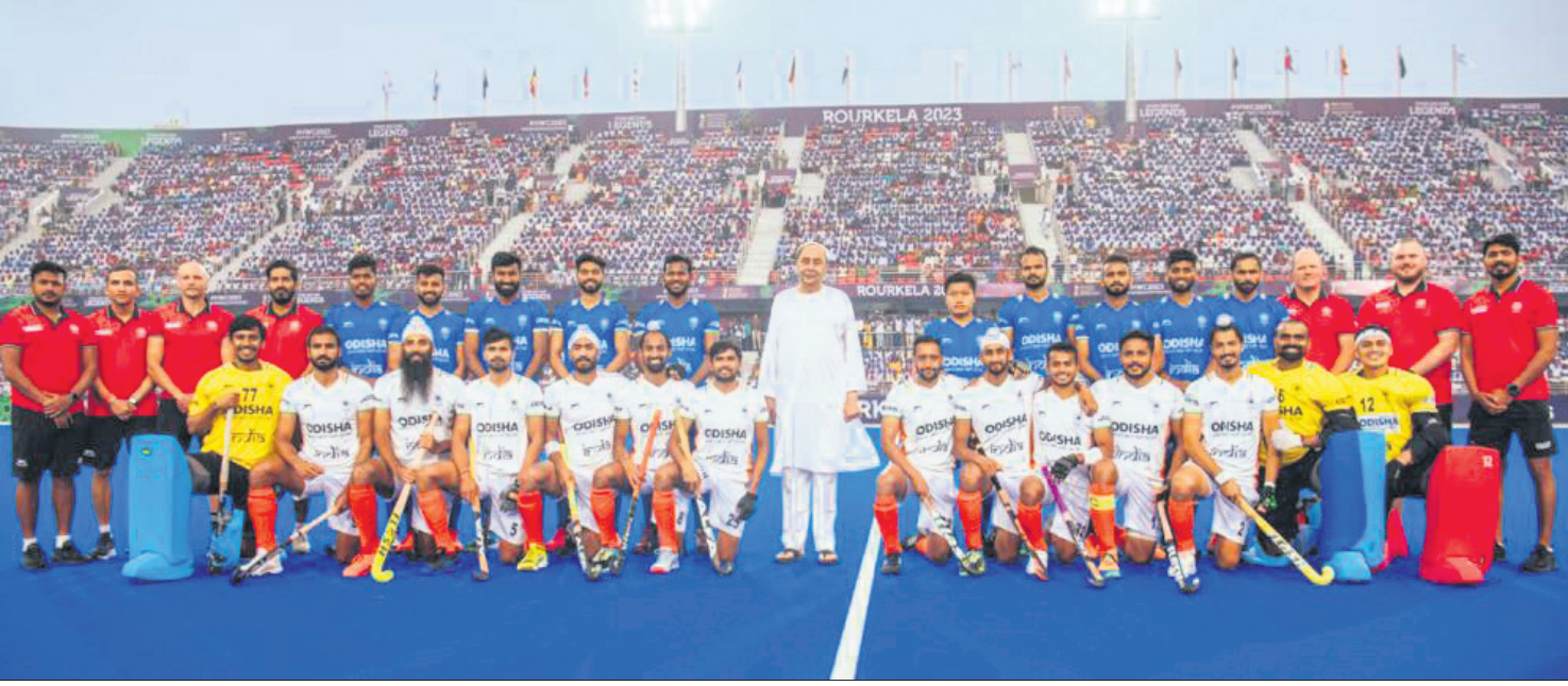
ରାଉରକେଲାସ୍ଥିତ ବର୍ଷା ପୁଣା ହକି ଷ୍ଟାଡ଼ିୟମର ଉଦ୍‌ଘାଟନୀ ଅବସରରେ ଖେଳାଳିମାନଙ୍କ ସହ ପୁଖ୍ୟମନ୍ତ୍ରୀ ନବୀନ ପଟ୍ଟନାୟକ ।

ନିକଟରେ ହୋଇଥିଲା। ଶେଷ ଆଡକୁ ଶିବମ ମାଠି ୨୬ ରନ୍ କରିଥିଲେ। ୩୦ ବଲକୁ ୬୫ ରନ୍ କରିଥିବା ଅକ୍ଷୟ ଶେଷ ଓଭରରେ ଆଉଟ ହେବାକୁ ଭାରତର ବିଜୟ ସମ୍ଭାବନା ଶେଷ ହୋଇ ଯାଇଥିଲା। ଶ୍ରୀଲଙ୍କା ପକ୍ଷରୁ କପୁର ରଜିଆ ଓ ଦିଲଶାନ ମହୁଶୀନଙ୍କ ୨ଟି ଲେଖାଉଁଟ ନେଇଥିଲେ। ସଂକ୍ଷିପ୍ତ ସ୍ୱରାଜ୍ୟ: ଶ୍ରୀଲଙ୍କା ୨୦ ଓଭରରେ ୨୦୬/୬ (ଦୀନୁସ ସନକା-୫୬*, କୁଶାଳ ମେଣ୍ଡିସ୍-୫୨, ଚୟି ଅସଲଙ୍କା-୩୭, ଉମ୍ମାୟାଲ୍-୩/୪୮, ଅକ୍ଷୟ ପଟେଲ-୨/୨୪, ହୁଜୁରୁଲ୍-୧/୩୦)। ଭାରତ ୨୦ ଓଭରରେ ୧୯୦/୮ (ଅକ୍ଷୟ ପଟେଲ-୬୫, ପୂର୍ଣ୍ଣିମାଙ୍କୁମାର ଯାଦବ-୫୧, ଶିବମ ମାଠି-୨୬, କପୁର ରଜିଆ-୨/୨୨, ଦିଲଶାନ ମହୁଶୀନ-୨/୪୫, ବ୍ୟାଟି ବଳରେ ଭାରତ ବିଜୟର ହସରଜା-୧/୪୧)।