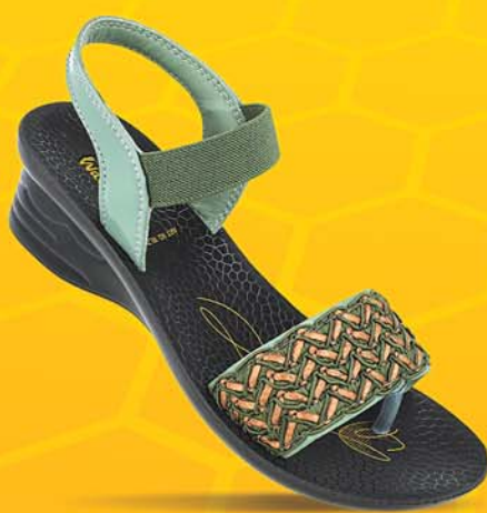
[WL7814 | ₹ 379.00*]