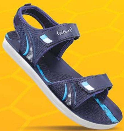
[WG5768 | ₹ 389.00*]