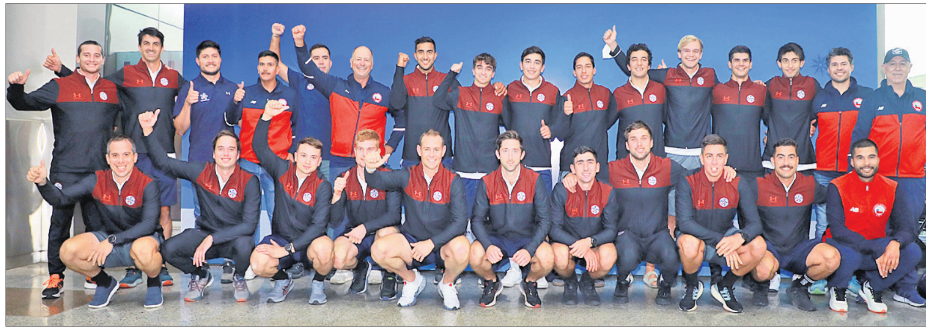
ପୁରୁଷ ହକି ବିଶ୍ୱକପ୍ ଖେଳିବା ଲାଗି ଭୁବନେଶ୍ୱରରେ ପହଞ୍ଚିଥିବା ଚିଲି ଦଳର ଖେଳାଳିମାନେ ।