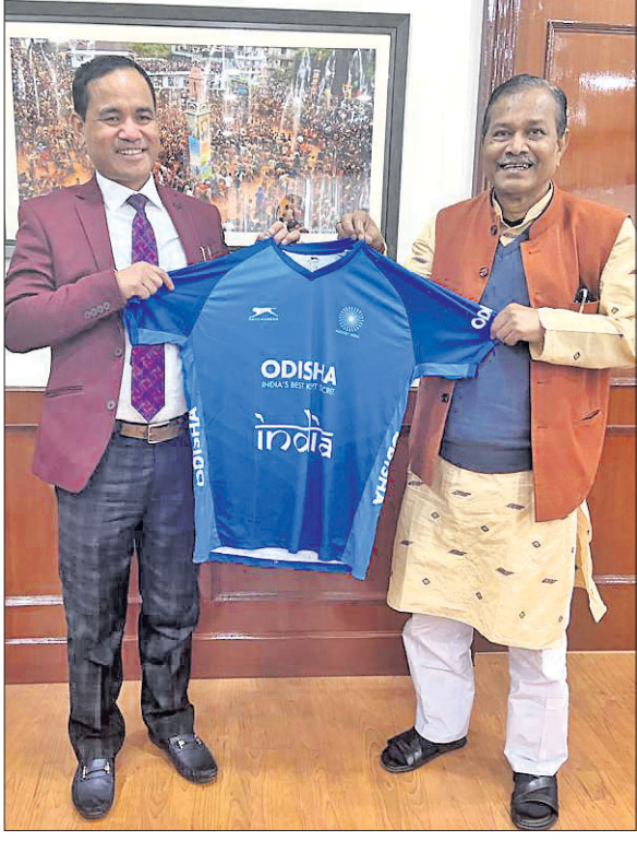
ମେଘାଳୟ ପୁଖ୍ୟମନ୍ତ୍ରୀ କରନାଡ଼ ସାଙ୍ଗାଙ୍କ ଚରଫରୁ କ୍ୟାବିନେଟ୍ ମନ୍ତ୍ରୀ ରେନିକଗୋନ ଲିଙ୍ଗତୋ ଚଣ୍ଡାଙ୍କ ମନ୍ତ୍ରୀ ପ୍ରତ୍ୟାପ ଅମାତ୍ୟଙ୍କଠାରୁ ନିମନ୍ତେ ଗ୍ରହଣ କରୁଛନ୍ତି