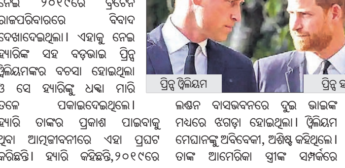
ପ୍ରିନ୍ସ ଓଲିୟମ ପ୍ରିନ୍ସ ହ୍ୟାରିଙ୍କୁ ଧକ୍କା ମାରିଥିଲେ।

ଓଲିୟମ ଗଣମାଧ୍ୟମ କଥାକୁ ବୋଧହୁଏ ଭଲପାଏ ବୋଲି ହ୍ୟାରି ଅଭିଯୋଗ କରିଥିଲେ।