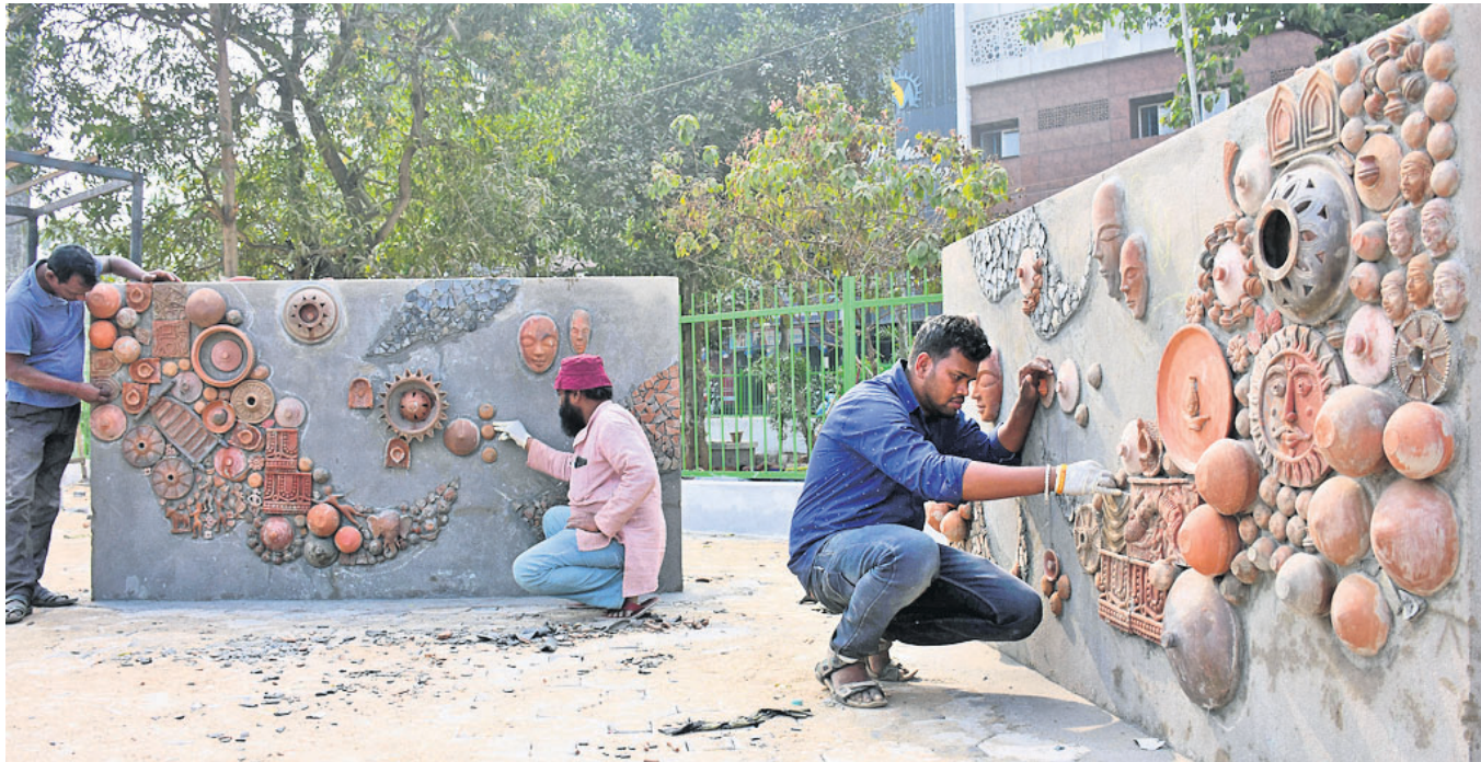
ଚନ୍ଦ୍ରଖେମବୁର ଅଞ୍ଚଳରେ ଚେରାକୋଟାକୁ ନେଇ ସୁନ୍ଦର କଳାକୃତି ତିଆରି କରାଯାଇଛି।