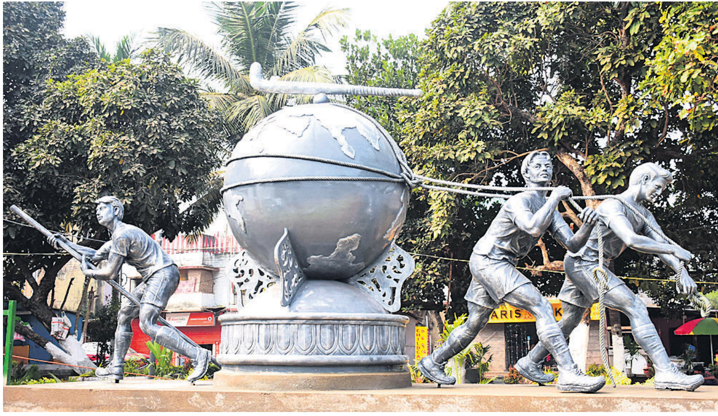
ହାଇସିଂବୋର୍ଡ ଛକ ନିକଟରେ ହକି ବିଶ୍ୱକପ୍ ମଡେଲକୁ ନେଇ ନିର୍ମିତ କଳାକୃତି।