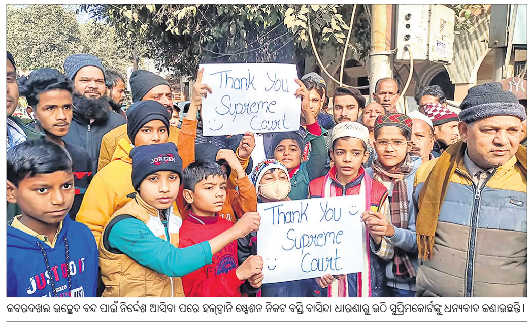
କବରଦଖାଳ ଉଚ୍ଛେଦ ବନ୍ଦ ପାଇଁ ନିର୍ଦ୍ଦେଶ ଆସିବା ପରେ ହଲ୍ଦ୍ଵାନୀ ଷ୍ଟେଶନ ନିକଟ ବସ୍ତି ବାସିନ୍ଦା ଧାରଣାରୁ ଉଠି ସୁପ୍ରିମକୋର୍ଟକୁ ଧନ୍ୟବାଦ ଜଣାଉଛନ୍ତି।

ବସ୍ତି ଓ ଇନ୍ଦିରା ନଗର ନାମରେ ୩ଟି କଲୋନି ରହିଛି। ୨ କି.ମି. ବସ୍ତିର ଏହି ଅଞ୍ଚଳରେ ପ୍ରାୟ ୫୦ ହଜାର ଲୋକ ଅନେକ ଦଶନ୍ଧି ଧରି ବସବାସ କରୁଛନ୍ତି।