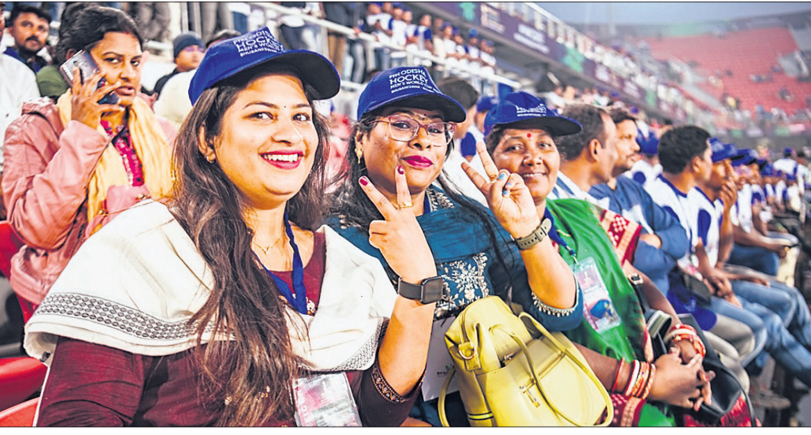
ରାଉରକେଲାସ୍ଥିତ ବିର୍ସା ମୁଣ୍ଡା ହକି ଷ୍ଟାଡ଼ିୟମ୍ ଲୋକାର୍ପଣ ଅବସରରେ ଆୟୋଜିତ ଅଭ୍ୟାସ ମ୍ୟାଚ୍‌କୁ ଦର୍ଶକ ଉପଭୋଗ କରୁଛନ୍ତି ।