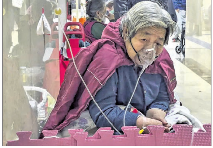
ବେଙ୍ଗି, ୫୧୧: ଚାଲନା ରାଜଧାନୀ ବେଙ୍ଗିରେ କୋଭିଡ୍ ସଂକ୍ରମଣ ଉଚ୍ଚତା ରୂପ ଧାରଣ କରିଛି।