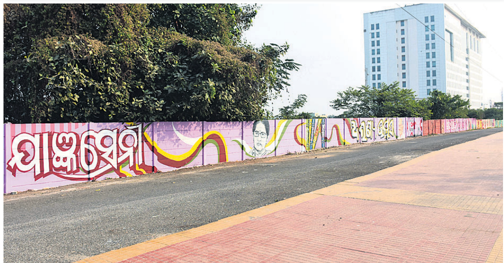
ଚନ୍ଦକା ଶିଳ୍ପାଞ୍ଚଳ ମୁଖ୍ୟ ରାସ୍ତା ଓ ପାର୍ଶ୍ୱସ୍ଥ ପାଚେରିକୁ ବିଭିନ୍ନ ଥିମରେ ଚିତ୍ରିତ କରାଯାଇଛି।