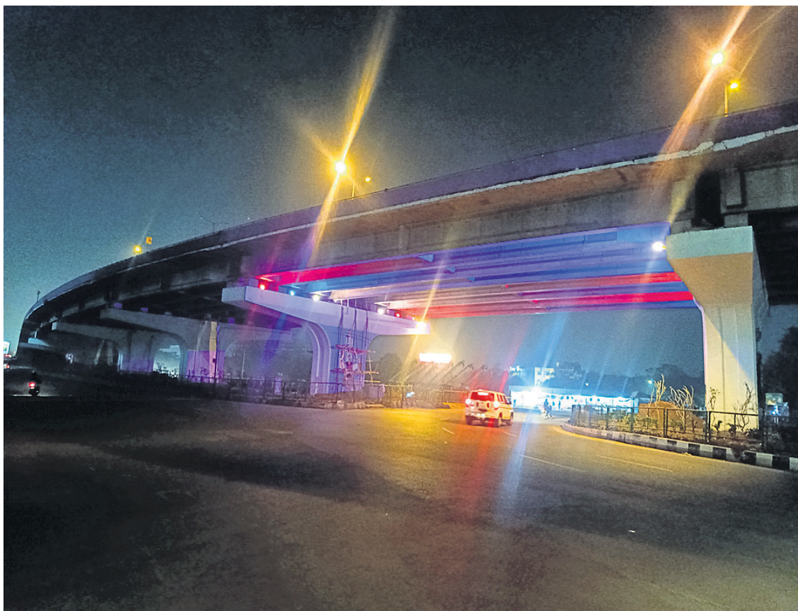
ରସୁଲଗଡ଼ ଛକସ୍ଥିତ ଓକରଡ୍ରିକ୍କୁ ଆଲୋକ ଓ ରଙ୍ଗରେ ରଙ୍ଗିନ କରାଯାଇଛି।