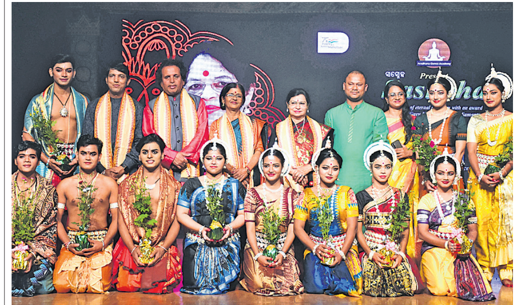
ଆରାଧନା ତ୍ୟାଗ ଏକାଡେମୀ ପକ୍ଷରୁ ଗୁରୁବାର ଭୁବନେଶ୍ୱର ଭାଙ୍ଗଳା ମଣ୍ଡପରେ ଅନୁଷ୍ଠିତ ସାଂସ୍କୃତିକ କାର୍ଯ୍ୟକ୍ରମ 'ସମ୍ବେଦ' ରେ ଅତିଥିକ ଗଣଶରେ ନୃତ୍ୟ ଶିଳ୍ପୀମାନେ।

ଖୋର୍ଦ୍ଧା ଜେନା ଜୟବ୍ରତ ନିଶା ସରକାରୀ ଉଚ୍ଚ ବିଦ୍ୟାଳୟରେ ଗୁରୁବାର ବିଦାୟ ସମର୍ପଣ କାର୍ଯ୍ୟକ୍ରମ ଅନୁଷ୍ଠିତ ହୋଇଯାଇଛି।