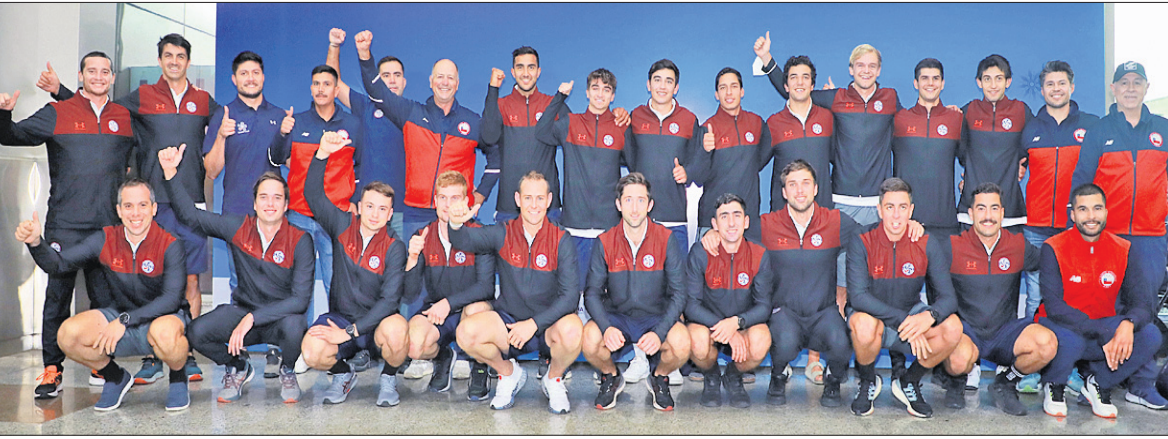
ପୁରୁଷ ହକି ବିଶ୍ୱକପ୍ ଖେଳିବା ଲାଗି ଭୁବନେଶ୍ୱରରେ ପହଞ୍ଚିଥିବା ଚିଲି ଦଳର ଖେଳାଳିମାନେ ।