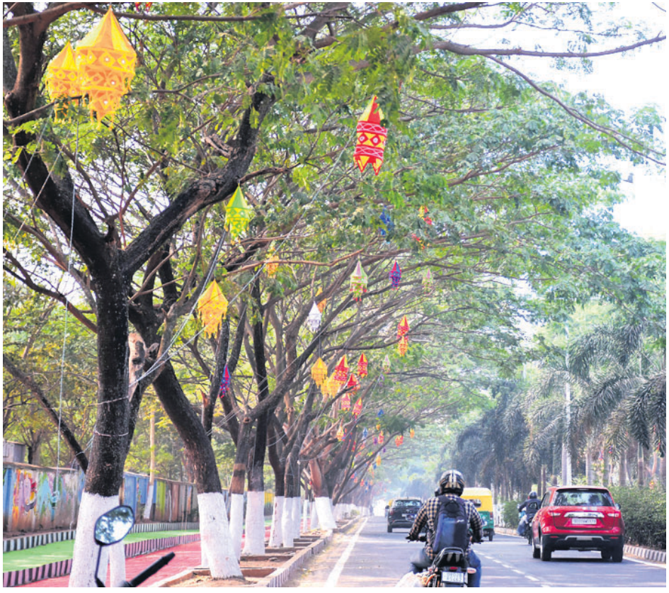
ହକି ପୁରୁଷ ବିଶ୍ୱକପ୍ ପାଇଁ ଭୁବନେଶ୍ୱର ରେଡକ୍ରସ୍ ହକି ଶାସ୍ତ୍ରାଳୟର ଛକ ପର୍ଯ୍ୟନ୍ତ ରାତ୍ରୀ ପାର୍ଶ୍ୱ ଗଛକୁ ଆଲୋକାକରଣ କରାଯାଇଛି।