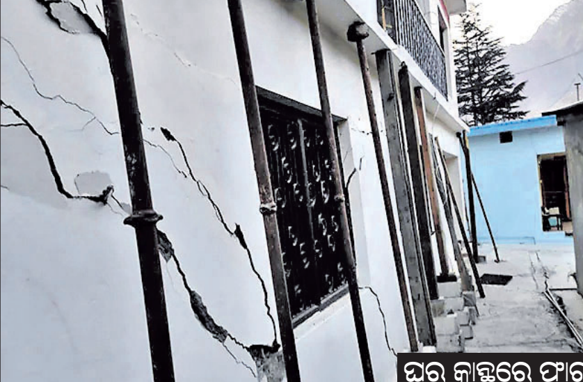
ଘର ନାକ୍ଷରେ ଫାଟ

ନୂଆଦିଲ୍ଲୀ/ଡେହାଡୁନ, ୬।୧ ଉତ୍ତରାଖଣ୍ଡର ଚାମୋଲି କିଲା ଅନ୍ତର୍ଗତ ଜୋଷୀମଠ ଅଞ୍ଚଳ ଦକ୍ଷିଣପାର୍ଶ୍ୱ ଶହ ଶହ ଘରେ ଏବଂ ରାସ୍ତାରେ ବିପଜ୍ଜନକାରୀ ଫାଟ ସୃଷ୍ଟି ହୋଇଛି।