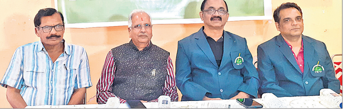
ଖବରଦାତା ସମ୍ମିଳନୀରେ ଶୁକ୍ରବାର ଆୟୋଜକମାନେ ଚୁନାମେଣ୍ଟ ସମ୍ପର୍କରେ ସୂଚନା ଦେଇଛନ୍ତି।

କରାଯାଇ ଗ୍ରୁପ୍ ପର୍ଯ୍ୟାୟ ଅନୁଷ୍ଠିତ ହେବ। ଲିଗ୍ ପର୍ଯ୍ୟାୟ ଶେଷରେ ପ୍ରତି ଗ୍ରୁପ୍‌ର ଶ୍ରେଷ୍ଠ ଦଳ ଓ ଦୁଇଟି ଶ୍ରେଷ୍ଠ ଦଳକୁ ଦଳକୁ କ୍ୱାର୍ଟର ଫାଇନାଲ୍‌ରେ ପ୍ରବେଶ ସୁଯୋଗ ମିଳିବ। ଏହାପରେ ନକ୍ୱାଆର ପର୍ଯ୍ୟାୟ ଆରମ୍ଭ ହେବ। ଚାମ୍ପିୟନ, ରନରଅପ୍ ଏବଂ ପରାଜିତ ଦୁଇ ଦଳକୁ ତୃତୀୟ ସ୍ଥାନୀୟ ଭାବେ ପୁରସ୍କୃତ କରାଯିବ ବୋଲି ଶୁକ୍ରବାର ଆୟୋଜିଟ୍ ଏକ ଖବରଦାତା ସମ୍ମିଳନୀରେ ସୂଚନା ଦିଆଯାଇଛି। ପ୍ରତିଯୋଗିତାର ସୁପରିଚାଳନା ପାଇଁ