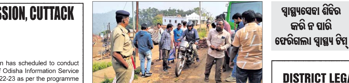
ଆନ୍ଧ୍ର ସ୍ୱାସ୍ଥ୍ୟ ଚିକିତ୍ସା ଅନୁପ୍ରବେଶକୁ ପୋଲିସ ପଞ୍ଚାଳି/କୋରାପୁଟ, ୨୧ (ଭୂ.ଏନ.ଏ./ସ.ପ୍ର.)