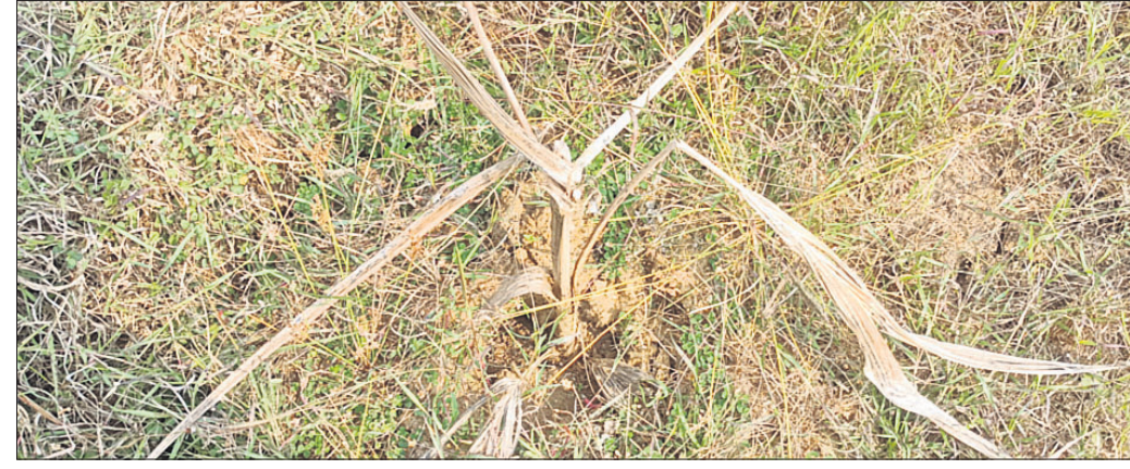
ଦାୟିତ୍ୱ ଅଭାବରୁ ନଡ଼ିଆ ଗଛ ସବୁ ଶୁଖିଯାଇଛି।

ନୟାଗଡ଼ ଜିଲା ନୂଆଗାଁ ବୁକରେ ମୂଲିକା ସଂରକ୍ଷଣ ଓ ଜଳ ବିଭାଜିକା ବିଭାଗ କର୍ମଚାରୀମାନେ ନଡ଼ିଆ ଚାଷ କରାଇବା ନାଁରେ ଲକ୍ଷ୍ୟଧିକ ଟଙ୍କା ଲୁଚୁଥିବା ଅଭିଯୋଗ ହୋଇଛି। ଚାଷୀଙ୍କ ସ୍ୱାର୍ଥ ପାଇଁ ସରକାର ମହାତ୍ମା ଗାନ୍ଧୀ ଗ୍ରାମୀଣ ନିଷ୍ଠିତ କର୍ମନିମ୍ବୁଦ୍ଧି ଯୋଜନା (ଏମ୍‌ଜିଏନ୍‌ଆର‌ଇଏଏ) ମାଧ୍ୟମରେ ଅନେକ ସୁବିଧା ସୁଯୋଗ ଯୋଗାଇ ଦେଇଛନ୍ତି। କିନ୍ତୁ କେତେଜଣ ଅଧିକାରୀଙ୍କ ଯୋଗୁଁ ସେସବୁ ବାଟବଣା ହେଉଛି। ମୂଲିକା ସଂରକ୍ଷଣ ଓ ଜଳ ବିଭାଜିକା ବିଭାଗ ମାଧ୍ୟମରେ ଏମ୍‌ଜିଏନ୍‌ଆର‌ଇଏଏରେ ଚାଷୀମାନେ ମାଗଣାରେ ପୋଖରୀ ଖୋଳିବା ସହ ଶ୍ରମିକମାନଙ୍କୁ ସରକାର କାମ ଯୋଗାଇ ଦେଇଛନ୍ତି। ବାରମ୍ବାର ଅଭିଯୋଗ ସତ୍ତ୍ୱେ ବିଭାଗ ପକ୍ଷରୁ କୌଣସି କାର୍ଯ୍ୟାନୁଷ୍ଠାନ ଗ୍ରହଣ କରାଯାଇନାହିଁ। ସେହିଭଳି ନଡ଼ିଆ ଚାଷ କରିବାକୁ ଏମ୍‌ଜିଏନ୍‌ଆର‌ଇଏଏ ମାଧ୍ୟମରେ ସରକାର ଅର୍ଥ ଦେଇଛନ୍ତି। ସେହି ଅର୍ଥକୁ ମଧ୍ୟ ବିଭାଗୀୟ ଅଧିକାରୀ, କର୍ମଚାରୀ ମିଳିମିଶି ଲୁଚୁଛନ୍ତି। ନୂଆଗାଁ ବୁକ ପାରାଡିପି ପଞ୍ଚାୟତ ମନ୍ଧାବାରୀ ଗାଁର ବାମଦେବ ନାୟକ ନଡ଼ିଆ ଚାଷ