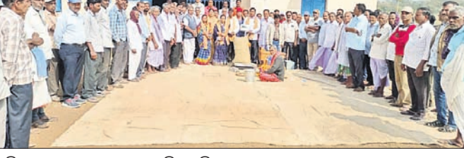
ମଣି ଉଦ୍‌ଘାଟନା ଉତ୍ସବରେ ଉପସ୍ଥିତ ଅତିଥି ଏବଂ ଚାଷୀ।