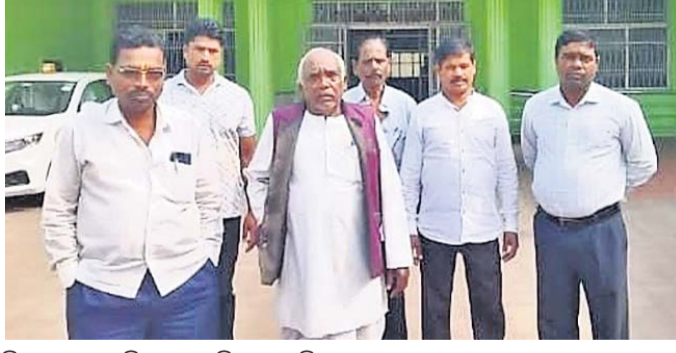
ଜିଲାପାଳଙ୍କୁ ଅଭିଯୋଗ କରିବାକୁ ଆସିଥିବା ଗ୍ରାମର ପୁରବାମାନେ ।

ନୟାଗଡ଼ ଅପିଏ,୨୧: ନୟାଗଡ଼ ଜିଲା ନୂଆଗାଁ ବ୍ଲକ୍‌ର ବଳଭଦ୍ରପୁର ଓ କୁମ୍ଭମାଳ ୬ କମି ରାସ୍ତାକୁ ନେଇ ଲାଗି ରହିଥିବା ବିବାଦ ପୂର୍ଣ୍ଣ ହେଉଛି। ଏ ନେଇ ଗରୁପାଳି ବନାମ ୧୭ ଖଣ୍ଡ ଗାଁ ମଧ୍ୟରେ ବିବାଦ ୨୦୧୭ରୁ ଲାଗି ରହିଥିଲା। ରାସ୍ତା ନିର୍ମାଣ ପାଇଁ ଡେକୋଣା ଓ ମାଳିସାହି ପଞ୍ଚାୟତରାଜ ୧୭ ଖଣ୍ଡ ଗାଁର କମିଟି କର୍ମକର୍ତ୍ତା ଶୁକ୍ରବାର ଜିଲାପାଳଙ୍କୁ ଭେଟି ରାସ୍ତା ନିର୍ମାଣ କାର୍ଯ୍ୟ ଆରମ୍ଭ କରିବାକୁ ଫେରାଦ ହୋଇଛନ୍ତି। ରାସ୍ତା ନିର୍ମାଣ ପାଇଁ କାଟାସ ଗ୍ରାମ୍ ଡିଭିଜନାଲ କ୍ଲୟରାଡ଼ ପାଇବା ପରେ ନୟାଗଡ଼ ଜିଲା ପ୍ରଶାସନ ୧ ବନାମ ୧୭ ଖଣ୍ଡ ଗାଁ ମଧ୍ୟରେ ଲାଗି ରହିଥିବା ବିବାଦୀୟ ବଳଭଦ୍ରପୁର ଓ କୁମ୍ଭମାଳ ୬ କମି ରାସ୍ତାକୁ ନିର୍ମାଣ କରିବାରେ ସଫଳ ହୋଇଥିଲା। ୨୦୨୨ ଜୁନ ୨୧ରେ ଆରମ୍ଭ ହୋଇଥିବା