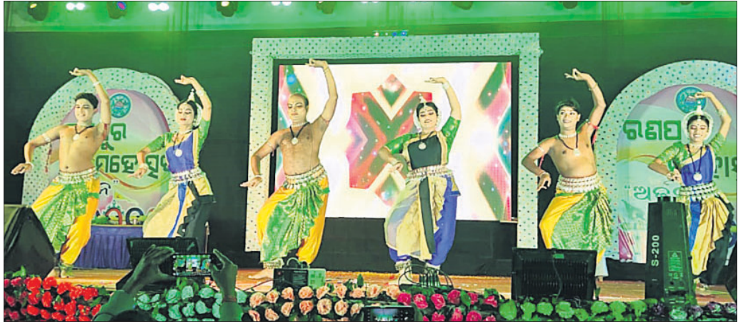
ମଞ୍ଚରେ କଳାକାରଙ୍କ ଦ୍ୱାରା ଓଡ଼ିଶୀ ନୃତ୍ୟ ପରିବେଷଣ କରାଯାଇଛି ।