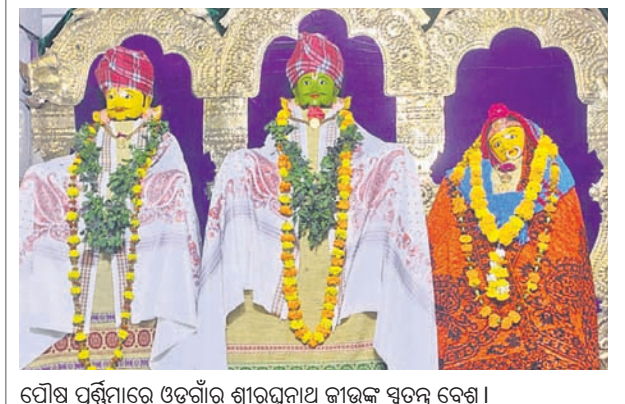
ପୌଷ ପୂର୍ଣ୍ଣିମାରେ ଓଡ଼ିଶାର ଶ୍ରୀରଘୁନାଥ ଜାଉଜ ସତ୍ୟ ବେଶ ।

ସ୍ୱାଇଁ ମା'ଙ୍କୁ ପ୍ରଥମ ଭେଟି ପ୍ରଦାନ ପରେ ମା'ଙ୍କୁ ପୂଜାର୍ଚ୍ଚନା କରି ଶ୍ରୀଜାଉଜ ନିକଟକୁ ନିମନ୍ତ୍ରଣ କରି ଆସିଥିଲେ। ଏହାକୁ ଦେଖିବା ଲାଗି ରାଜ୍ୟ ତଥା ରାଜ୍ୟ ବାହାରୁ ଶ୍ରୀଜାଉଜ ସେବାକ ହୋଇଥିଲା। ମା'ଙ୍କୁ ବିଜେ ହେବା ପରେ ଶ୍ରୀନୀଳମାଧବ ଜାଉଜ ଶ୍ରୀପ୍ରୟର ଲାଗି ଅଭିଷେକ ନୀତି ସୁନା ବେଶ ସମ୍ପନ୍ନ ହୋଇଥିଲା। ମଧ୍ୟାହ୍ନ ସାଢ଼େ ୧୨ଟାରେ ମଧ୍ୟାହ୍ନ ଧୂପ ନୀତି ଅନୁଷ୍ଠିତ ହୋଇଥିଲା। ଶ୍ରୀଜାଉଜ ପାଟବସ୍ତ୍ର ଲାଗି ହେବା ପରେ ଅପରାହ୍ଣ ୧୨ଟାରେ ଶ୍ରୀଜାଉଜ ଦର୍ଶନ ପାଇଁ ସାହାଗମେଲା ହୋଇଥିଲା। ଭକ୍ତମାନେ ଠାକୁରଙ୍କ ସୁନାବେଶ ଦର୍ଶନ କରିଥିଲେ। ଶାନ୍ତି ଶୁଖିଲା ରକ୍ଷା ପାଇଁ ପୋଲିସ୍ ମୁହଁଦଳ ହୋଇଥିଲେ।