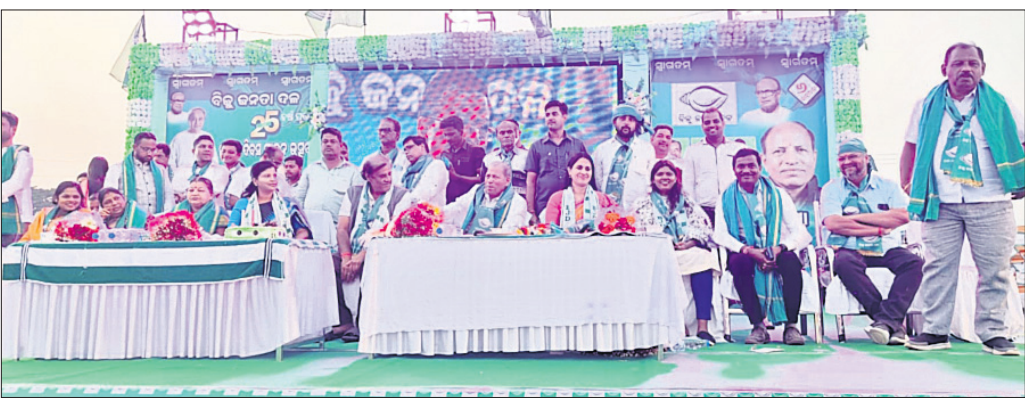
ବୈଠକରେ ଯୋଗଦେଇଥିବା ବିଜେଡି ନେତା ଓ କର୍ମକର୍ମୀ।