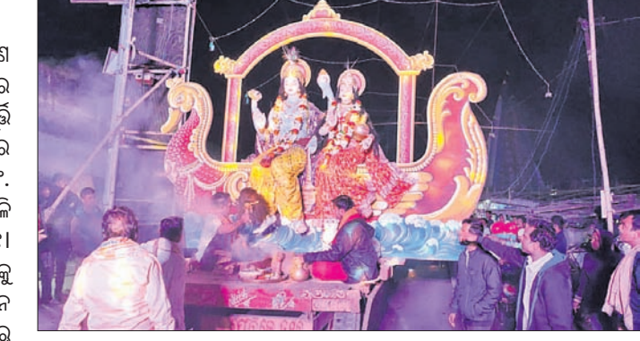
ଲକ୍ଷ୍ମୀ ନାରାୟଣଙ୍କୁ ମେଲାଣି ପାଇଁ ନିଆଯାଇଛି।

୬୮ତମ କୁଆଖିଆ ଲକ୍ଷ୍ମୀନାରାୟଣ ପୂଜା ଉଦ୍‌ଘାଟିତ ହେବାପରେ ଶୁକ୍ରବାର ସନ୍ଧ୍ୟାରେ ଲକ୍ଷ୍ମୀନାରାୟଣ ମୁରାକମୁଦ୍ରି ମେଲାଣି ନେଇଛନ୍ତି। ଭକ୍ତଙ୍କ ଗହଣରେ ଏକ ବିରାଟ ପଟୁଆରେ ପ୍ରଭୁଙ୍କୁ ୧୬ନଂ. ଜାତୀୟ ରାଜପଥ ପାର୍ଶ୍ୱରୁ ଓଡ଼ିଶା ପୁଷ୍ପଗଣରେ ବିସର୍ଜନ କରାଯାଇଛି। ପୂଜା କମିଟି ପକ୍ଷରୁ ଭବ୍ୟ ଯାତ୍ରାକୁ ଶାନ୍ତିଶୁଖିଳାରେ ସହ ସମାପନ କରାଯାଇଛି। ଏନେଇ ପୋଲିସ୍ ପକ୍ଷରୁ କଡ଼ା ସୁରକ୍ଷା ବ୍ୟବସ୍ଥା କରାଯାଇଥିଲା। ଭବ୍ୟ ଉତ୍ସବ ପୂର୍ବରୁ ଠାକୁରଙ୍କ ନିକଟରେ ସ୍ୱତନ୍ତ୍ର ପୂଜା ଅର୍ଚ୍ଚନା କରାଯାଇଥିଲା। ପୂଜା ନାଚି ସମ୍ପନ୍ନ ପରେ ଭବ୍ୟଯାତ୍ରା ପ୍ରସ୍ତୁତି କରାଯାଇଥିଲା। ଆଡ଼ସବାଜୀ ସହ ଶିବ୍, ଡୋଲ, ତେଲିଙ୍ଗି ବାଜା ବଜାଇ ପ୍ରଭୁଙ୍କୁ