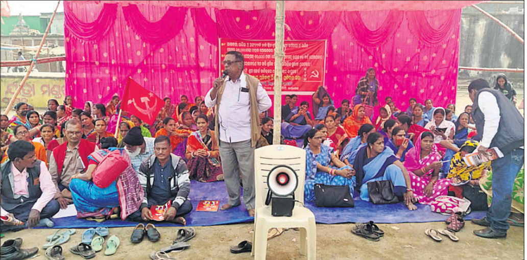
ମଞ୍ଚ ପକ୍ଷରୁ ଗଣଧାରଣା ଦିଆଯାଇଛି।