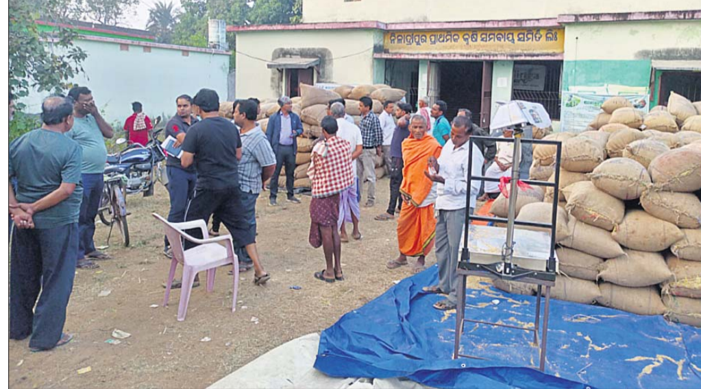
ନାକାପ୍ରିପୁର ପ୍ୟାକ୍‌ରେ ତହସିଲଦାର ଚାଷୀଙ୍କ କଥା ରୁଜୁକରିଛନ୍ତି ।

ଧାନ କରଜ କରି ଧାନ ଅମଳ କରିଥିବା ଚାଷୀ ମଣ୍ଡି ଖୋଲିବା ସମୟକୁ ଅପେକ୍ଷା କରି ଆସାନ୍ତି। ଚାଷୀ ଧାନ ବିକ୍ରି କରି କରଜ ଶୁଦ୍ଧିତା ଚିନ୍ତା କରିଥିବା ବେଳେ ମଣ୍ଡିର ଅବ୍ୟବସ୍ଥା ସେମାନଙ୍କୁ ହତାଶ କରିଛି। ସରକାର ଧାନ କ୍ରୟ କରିବାରେ କଟକଣାକ୍ରମେ ପାଇଁ ରୋକିଦେଇ ମନା କରି ଦେଇଛନ୍ତି। ହେଲେ କିଛି ପ୍ରଶାସନିକ ଅଧିକାରୀ, ପ୍ୟାକ୍ ସମ୍ପାଦକ ଓ ମିଲର ମିଶ୍ର ଚାଷୀ କୁଳକୁ ଲୁଚିବାର ଯୋଜନା କରିଛନ୍ତି। ମଣ୍ଡି ଖୋଲିବା ପୂର୍ବରୁ ପ୍ୟାକ୍ ସଭାପତି, ସମ୍ପାଦକ, ମିଲର ଚାଷୀଙ୍କୁ ଡାକି ଏକ ବୈଠକ କରିଥିଲେ। ସେଥିରେ ଚାଷୀଙ୍କୁ ବିଭିନ୍ନ ବିଭାଗିକ କଥା କହି କୁଳଖିଲ ପିଛା ୬ କେଜି ଧାନ କାଟିବାର ନିଷ୍ପତ୍ତି ଗ୍ରହଣ କରିଥିଲେ। ସେହି ଅନୁସାରେ, ନୂଆଗାଁ ବ୍ଲକ୍‌ର ପ୍ରତି ପ୍ରକ୍ରିୟା କାମର ବାକି ରହିଥିବାରୁ କାର୍ଯ୍ୟ ବନ୍ଦ ଅଛି। ଏଣୁ ରୁଜୁ ଗାଁର କାର୍ଯ୍ୟ ଆରମ୍ଭ କରିବାକୁ ଦାବି ରହିଛି।