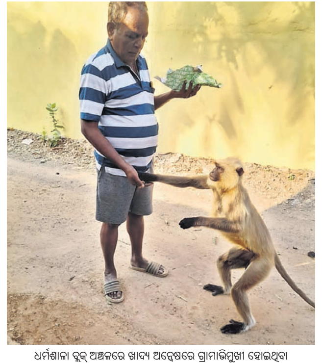
ଧର୍ମଶାଳା କୁ ଅଞ୍ଚଳରେ ଖାଦ୍ୟ ଅବେଷରେ ଗ୍ରାମାଭିବୃଦ୍ଧି ହୋଇଥିବା ଏକ ମାଙ୍କଡ଼କୁ ଜଣେ ବ୍ୟକ୍ତି ଖାଇବାକୁ ଦେଉଛନ୍ତି।