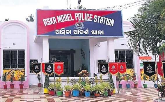
ଆସିକା, ୬।୧ (ବି.ଏନ୍.ଏ.)