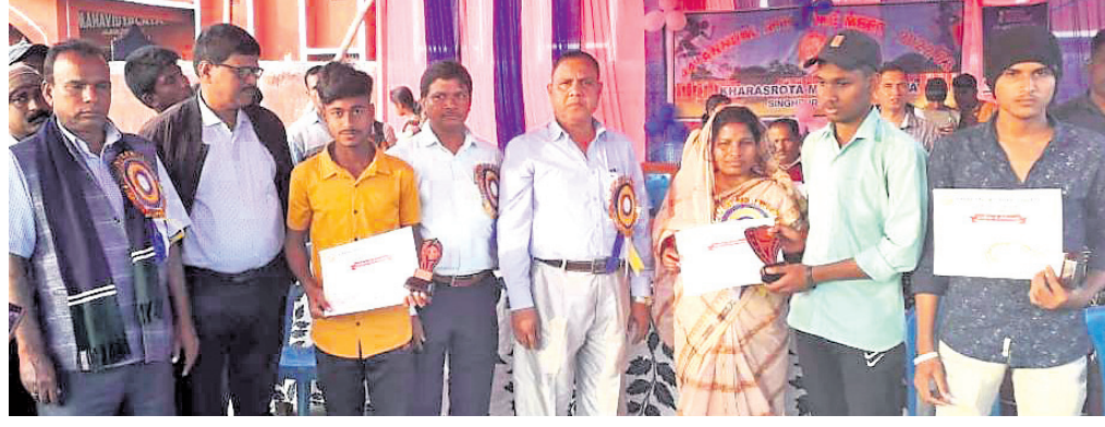
କ୍ରୀଡ଼ା ପ୍ରତିଯୋଗିତାରେ କୃତ୍ୱ ଅର୍ଜନ କରିଥିବା ବିଦ୍ୟାର୍ଥୀଙ୍କୁ ଅତିଥି ପୁରସ୍କୃତ କରୁଛନ୍ତି।

ନେଇ ୨୯୯ ପ୍ରତିଷ୍ଠା ପ୍ରଦାନ କରାଯିବ। ୯୦ଟିଖେଳରେ ଭୋଟକା ପଞ୍ଚାୟତ ଦଳ କୁଳସ୍ତରୀୟ ପ୍ରତିଯୋଗିତାରେ ଅଂଶ ଗ୍ରହଣ କରିବ ବୋଲି ପଞ୍ଚାୟତ ସମ୍ପର୍କ ପୂର୍ବନା ଦିଆଯାଇଛି। ପଞ୍ଚାୟତର ଖାଡ଼ିସଭ୍ୟାସଭ୍ୟା, ଅଜନସ୍ୱାତି କର୍ମୀ, ଏମ୍.ପି.ଏ. ସିଆରପି ଓ ଆଶାକର୍ମୀମାନେ ଅଂଶଗ୍ରହଣ କରି ଖେଳ ପରିଚାଳନାରେ ସହଯୋଗ କରିଥିଲେ।