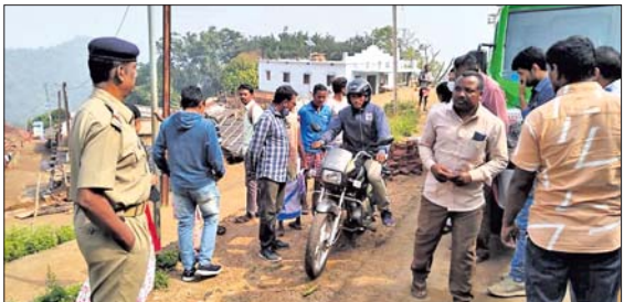
ଆନ୍ଧ୍ର ସ୍ଵାସ୍ଥ୍ୟ ଚିକିତ୍ସା ଅବକାଶିତ କୋଟିଆ ପୋଲିସ