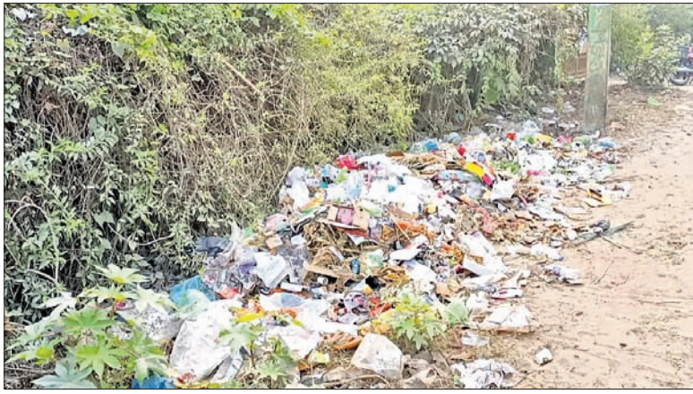
ରାସ୍ତାରେ ଅଳିଆ ଗଦା ହୋଇ ରହିଛି।

କେନ୍ଦ୍ର ଓ ରାଜ୍ୟ ସରକାର ସହରାଞ୍ଚଳ ପରିଷ୍କାର ପରିଚ୍ଛନ୍ନ ରଖିବା ଉପରେ ରୁଚୁଛନ୍ତି। ଏନେଇ ପ୍ରଚ୍ଛନ୍ନ ଅର୍ଥ ବ୍ୟୟ ହେଉଛି। ସ୍ୱଳ୍ପ ସର୍ବେକ୍ଷଣ ସହ ସ୍ୱଚ୍ଛତା ପାଇଁ ପ୍ରତି ବର୍ଷ ସର୍ବୁତ୍ତମ ଉତ୍ତମ ସମାପ୍ତ ହେବା ସହରକୁ ସାଫିପକେଟ୍ ଦିଆଯାଉଛି। କିନ୍ତୁ ଜଗତ୍‌ସିଂହପୁର ସହର କଥା ଦେଖିଲେ ଜଣାଯାଏ ସରକାରଙ୍କ ସ୍ୱଚ୍ଛତା ଅଭିଯାନ କେବଳ କାଗଜକଳମରେ ସୀମିତ ରହିଛି। ବର୍ଷାଦିନ କଥା ଛାଡ଼ି ଶୀତ ଓ ଖରାଦିନେ ସହରରେ ପାଣି ଜମି ରହିବା ସାଙ୍ଗକୁ ଗଦା ଗଦା ଅଳିଆ ପରିବେଶ ପ୍ରଦୂଷିତ କରୁଛି। ଅଳିଆ ଗଦା ଯୋଗୁ ମଶା ଉପଦ୍ରବ ତିକାର କାରଣ ହୋଇଛି। ମଶା ଧୂଆଁ ସାତ ସପନ ପାଇଛି। ଜନ ଅସବୋଷକୁ ବେଶ୍ ଜଗତ୍‌ସିଂହପୁର ପୌର ପରିଷଦ ପକ୍ଷରୁ ସହରର କେଲେକ୍ସନ ଛକ ନିକଟ ଅଳିଆଗଦାରେ ନିଆଁ ଲଗାଇ ଦିଆଯାଇଛି। ଏହାଦ୍ୱାରା ଅଳିଆ ତ କି ଅଂଶରେ ପୋଡ଼ିଯାଉଛି କିନ୍ତୁ ଧୂଆଁ ବଳୟରେ ସହରବାସୀ ଆଡ଼ରୁପାଉରୁ ହେଉଛନ୍ତି। ଏହାର ଘାୟା ପ୍ରତିକାର ନ ହେଲେ ଆଗାମୀ ଦିନରେ ଜନ ଆୟୋଜନ ଜୋରଦାର କରାଯିବ ବୋଲି କେତେଜଣ