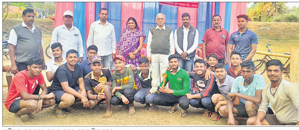
ଅତିଥିଙ୍କ ଗହଣରେ ଉତ୍ତମ ଦଳର ଖେଳାଳିମାନେ।

ରଘୁଲପୁର କୁ ଅନ୍ତର୍ଗତ ଭୋଟକା ପଞ୍ଚାୟତରେ ପଞ୍ଚାୟତସ୍ତରୀୟ କ୍ରୀଡ଼ା ପ୍ରତିଯୋଗିତା ଶୁକ୍ରବାର ଅନୁଷ୍ଠିତ ହୋଇଯାଇଛି। ଏହି ଅବସରରେ ଅନୁଷ୍ଠିତ କରାଯାଇଥିବା ପ୍ରତିଯୋଗିତାରେ ଭୋଟକା ଦଳ ବଡ଼ରମ୍ପେଇ ଦଳକୁ ହରାଇ ଚାମ୍ପିୟନ ହୋଇଛି। ଏଠାରେ ଅନୁଷ୍ଠିତ ଏକ ବିଏସ.ପି କ୍ରୀଡ଼ା ପ୍ରତିଯୋଗିତାରେ ପଞ୍ଚାୟତର ବିଲିପଡ଼ା, ଭୋଟକା, ଲକ୍ଷ୍ମୀପୁର, ବଡ଼ରମ୍ପେଇ ଓ ଅରଡ଼ା ଗ୍ରାମର ଦଳ ଯୋଗ ଦେଇଥିଲେ। ସେମାନଙ୍କ ମଧ୍ୟରେ ଅନୁଷ୍ଠିତ ମ୍ୟାଚ୍‌ରେ ବଡ଼ରମ୍ପେଇ ଓ ଭୋଟକା ଦଳ ଉତ୍ତମ କ୍ରୀଡ଼ା ପଦର୍ଶନ କରି ସେମି ଫାଇନାଲ ଖେଳିବାକୁ ଉତ୍ତର ହୋଇଥିଲେ। ଅପର ପକ୍ଷରୁ ଭୋଟକା ଦଳ ଉତ୍ତମ ଖେଳ ପ୍ରଦର୍ଶନ କରି ଉତ୍ତର ପକ୍ଷକୁ ଜିତିଥିବାର ଫାଇନାଲ ଖେଳିବାକୁ ମନୋନୀତ ହୋଇଥିଲା। ଫାଇନାଲ ମ୍ୟାଚ୍ ବଡ଼ରମ୍ପେଇ ଓ ଭୋଟକା ଦଳ ମଧ୍ୟରେ ଅନୁଷ୍ଠିତ ହୋଇଥିଲା। ଭୋଟକା