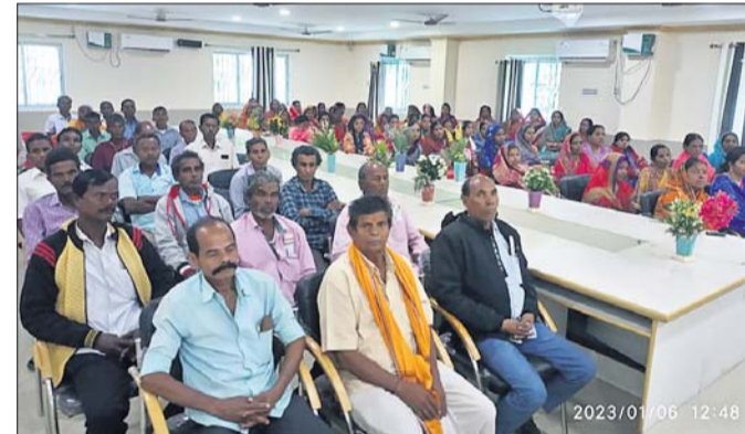
ନିର୍ବାଚନରେ ଉପସଭାପତି କଳାକାରମାନେ ।