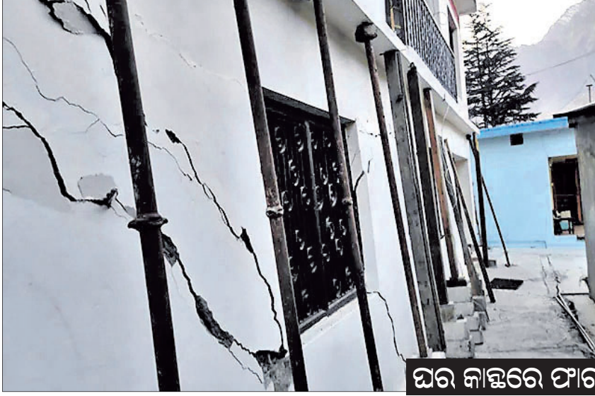
ଘର ନାକ୍ଷରେ ଫାଟ