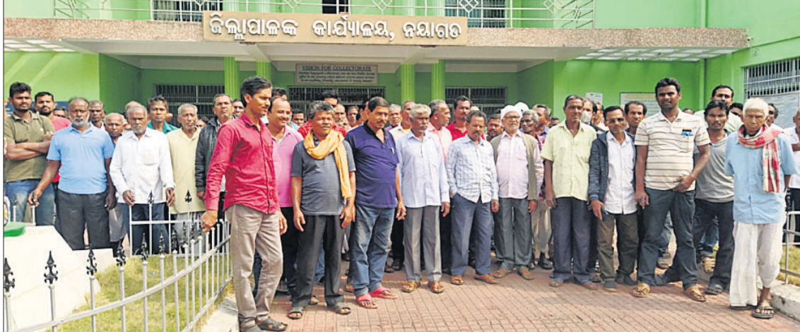
କାଳିକାପ୍ରସାଦ ସମିତି ପକ୍ଷରୁ ଜିଲାପାଳଙ୍କ ସମ୍ମୁଖରେ ବିରୋଧ ପ୍ରଦର୍ଶିତ କରାଯାଇଛି।