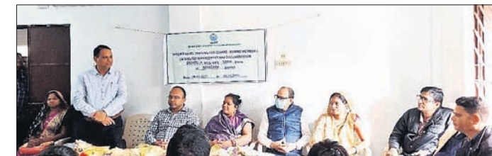
ତାଲିମ ଶିବିରରେ ଉପସ୍ଥିତ ଅତିଥିମାନେ।