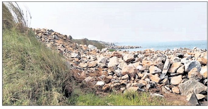
ପାରିଶିଖର ଗ୍ରାମ ନିକଟ ଦେବା ନଦୀରେ ବୁରୁଜ ନିର୍ମାଣ ଚାଲିଛି।

ଉପଖଣ୍ଡର ଯନ୍ତ୍ରୀ ତପନ ନାୟକଙ୍କ କୁଳାଳୀୟରେ ଏହି କାର୍ଯ୍ୟ ଉଦ୍‌ଘାଟନ ହେବା ପରେ ୨୦୨୨ରୁ ଆରମ୍ଭ କରାଯାଇଛି। ମାର୍ଚ୍ଚ ୨୦୨୪ରେ ଶେଷ ହେବ। ଏନେଇ ନଦୀ କୁଳଠାରୁ ଛିଡ଼ି ୨୦ ମିଟର ଉଚ୍ଚତାର ବୁରୁଜ ନିର୍ମାଣ କରାଯିବ। ଏହା ୨୫୦ ମିଟର ପଥର ପ୍ୟାକିଂ କରାଯିବ। ଏହି