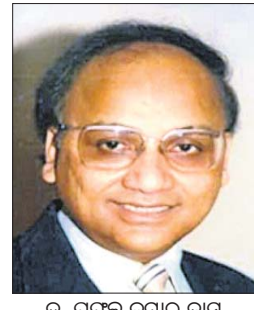
ଡ. ପ୍ରଫୁଲ୍ଲ କୁମାର ଦାସ

ଶୋକ ପ୍ରକାଶ କଲେ ପ୍ରଧାନମନ୍ତ୍ରୀଙ୍କ ପ୍ରମୁଖ ସଚିବ