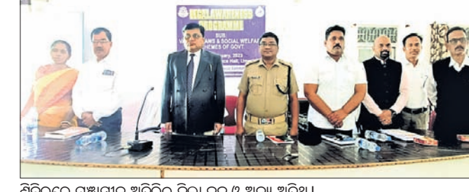
ଶିବିରରେ ମଞ୍ଚାସୀନ ଅତିରିକ୍ତ ଜିଲା କର୍ମ ଓ ଅନ୍ୟ ଅତିଥି ।