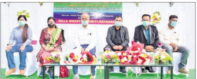
କାର୍ଯ୍ୟକ୍ରମରେ ସିଡିଏମ୍‌ଓ, ସ୍ତ୍ରୀଆଇଏଲ ଯୁକ୍ତ ମୁଖ୍ୟ ଓ ଅନ୍ୟ ଅତିଥି ।