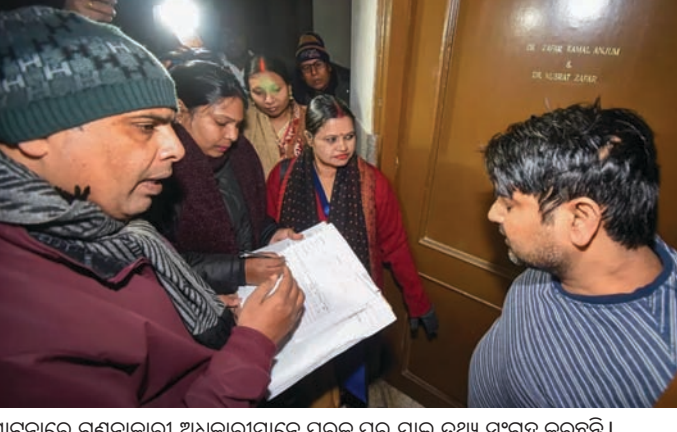
ପାଟନାରେ ଗଣନାକାରୀ ଅଧିକାରୀମାନେ ଘରକୁ ଘର ଯାଇ ତଥ୍ୟ ସଂଗ୍ରହ କରୁଛନ୍ତି।

ପାଟନା, ୨୧ ବିହାରରେ ଶନିବାରଠାରୁ ବହୁପ୍ରତୀକ୍ଷିତ ଜାତିଭିତ୍ତିକ ଜନଗଣନା ଆରମ୍ଭ ହୋଇଛି। ଗଣନାକାରୀ ଅଧିକାରୀମାନେ ଘରକୁ ଘର ଯାଇ ତଥ୍ୟ ସଂଗ୍ରହ କରୁଛନ୍ତି। ସବୁ ସମ୍ପ୍ରଦାୟର ଆର୍ଥିକ ସ୍ଥିତି ଆକଳନ କରିବା ସହିତ