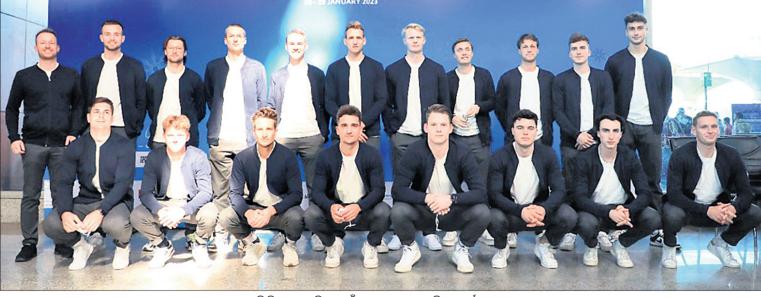
ହକି ବିଶ୍ୱକପ୍ ଖେଳିବା ପାଇଁ ଭୁବନେଶ୍ୱରରେ ପହଞ୍ଚିଥିବା ଜର୍ମାନୀ ଦଳ।