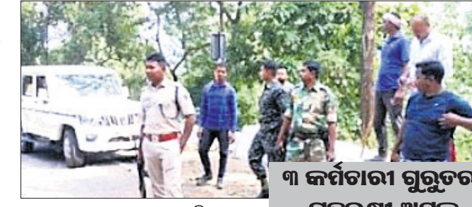
ରାଜ୍ୟର ଗ୍ରାମକୁ ଯାଇଥିବା ପୋଲିସ୍ ।