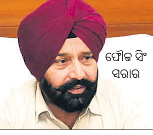
ଫୌଜ ସିଂ ସରୀର

୧୫ ଫେବୃଆରୀ, ୨୦୨୩ ଫୌଜ ସିଂଙ୍କ ଇସ୍ତଫା ଗ୍ରହଣ କରି ନେଇଛନ୍ତି। ଫୌଜ ସିଂଙ୍କ ଇସ୍ତଫା ଗ୍ରହଣ କରି ନେଇଛନ୍ତି। ଫୌଜ ସିଂଙ୍କ ଇସ୍ତଫା ଗ୍ରହଣ କରି ନେଇଛନ୍ତି।