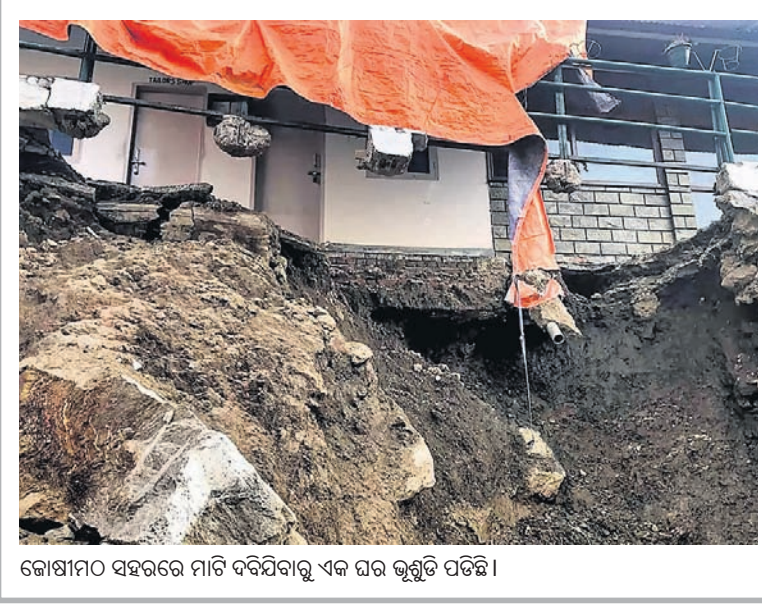
ଜୋଷୀମଠରୁ ଲୋକଙ୍କୁ ସ୍ଥାନାନ୍ତର

ଭାରତର ପ୍ରଧାନ ବିଚାରପତି (ସିଜେଆଇ) ଡି.ଓ.ଲ. ଚନ୍ଦ୍ରଚୁଡ଼ଙ୍କୁ ହାର୍ଡିଆ ଲିଡରଶିପ୍ ଆଫ୍ ପ୍ରଦାନ କରିବାକୁ ଯାଉଛି। ଆସନ୍ତା ୧୧ ତାରିଖରେ ଏକ ଅନ୍ତର୍ଜାତୀୟ କାର୍ଯ୍ୟକ୍ରମରେ ଏହି ପୁରସ୍କାର ପ୍ରଦାନ କରାଯିବ। ଦେଶ ତଥା ସାରା ବିଶ୍ୱରେ ଆଇନ ଅଧ୍ୟାୟ ପ୍ରତି ଜଷ୍ଟିସ୍ ଚନ୍ଦ୍ରଚୁଡ଼ଙ୍କର କାର୍ଯ୍ୟକ୍ରମୀୟା ସେବାର ସ୍ମାରକ ରୂପେ ଏହି ପୁରସ୍କାର ପାଇଁ ଚୟନ କରାଯାଇଛି। ଜଷ୍ଟିସ୍ ଚନ୍ଦ୍ରଚୁଡ଼ ଆମେରିକାର ହାର୍ଡିଆ ଲିଡରଶିପ୍ ଆଫ୍ ପ୍ରଦାନ କରିବାକୁ ଯାଉଛନ୍ତି। ଜଷ୍ଟିସ୍ ଚନ୍ଦ୍ରଚୁଡ଼ ଗତବର୍ଷ ନଭେମ୍ବର ୯ରେ ଭାରତର ୫୦ତମ ପ୍ରଧାନ ବିଚାରପତି ଭାବେ ଶପଥ ଗ୍ରହଣ କରିଥିଲେ।