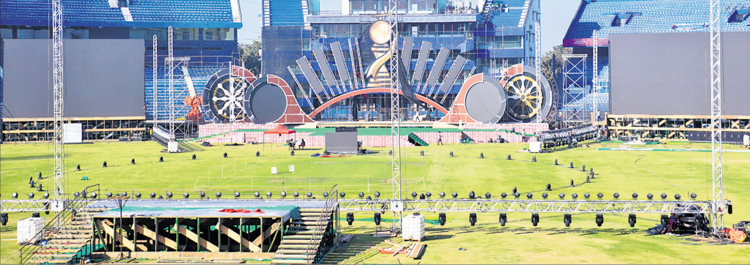
ହକି ବିଶ୍ୱକପ୍ ୨୦୨୩ ଉଦ୍‌ଘାଟନା ଉପରେ ପାଇଁ ପ୍ରସ୍ତୁତ ବାରବାଟୀ ଷ୍ଟାଡ଼ିୟମ।