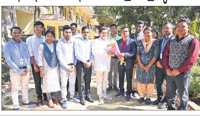
ଭୁବନେଶ୍ୱର, ୭୧୧ (ବ୍ୟବସାୟ)

ଚଳିତବର୍ଷ ଷ୍ଟେଟ୍ ସେଲେକ୍ସନ ବୋର୍ଡ (ଏସଏସବି) ପରୀକ୍ଷାରେ କିସର ୨୬ ଜଣ ଛାତ୍ରାଛାତ୍ରୀ କୃତକାର୍ଯ୍ୟ ହୋଇ ଅଧ୍ୟାପନା ପାଇଁ ମନୋନୀତ ହୋଇଛନ୍ତି। ଶନିବାର କିସ ପରିସରରେ କୃତକାର୍ଯ୍ୟ ହୋଇଥିବା ଛାତ୍ରାଛାତ୍ରୀ କିସ ଓ କିସ ପ୍ରତିଷ୍ଠା ଅନୁତ ସାମଗ୍ରୀ ଯୋଜନାମୂଳକ ସାକ୍ଷାତ କରିଥିଲେ। ଏହି ଅବସରରେ ସାମଗ୍ରୀ ସମଗ୍ର ଛାତ୍ରାଛାତ୍ରୀଙ୍କୁ ସମ୍ବର୍ଦ୍ଧିତ କରିଥିଲେ। ଏହି ଛାତ୍ରାଛାତ୍ରୀମାନେ ରାଜ୍ୟର ବିଭିନ୍ନ ସ୍ୱୟଂଶାସିତ ମହାବିଦ୍ୟାଳୟରୁ କିସରେ ଓଡ଼ିଆ, ଇତିହାସ, ବାଣିଜ୍ୟ, ଶିକ୍ଷା, ଅର୍ଥନୀତି, ଦର୍ଶନ ଓ ଗଣିତ ଆଦି ବିଷୟରେ ଅଧ୍ୟାପନା କରିବେ। ଏମାନଙ୍କ ମଧ୍ୟରେ ଆଦିମ ଜନଜାତି ସମ୍ପ୍ରଦାୟର ଛାତ୍ରାଛାତ୍ରୀ ମଧ୍ୟ ରହିଛନ୍ତି। କିସ ବିଶ୍ୱବିଦ୍ୟାଳୟରେ ଗୁଣାତ୍ମକ ଶିକ୍ଷା ଓ ଉତ୍ତମ ଶୈକ୍ଷିକ ପରିବେଶ ଯୋଗୁ ପ୍ରତିବର୍ଷ ଶତାଧିକ ଛାତ୍ରାଛାତ୍ରୀମାନେ ଉତ୍ତମ ସରକାରୀ ଓ ବେସରକାରୀ କ୍ଷେତ୍ରରେ ନିଯୁକ୍ତି ପାଇ ପ୍ରତିଷ୍ଠିତ ହୋଇପାରୁଛନ୍ତି। ଏଠାରୁ ଉତ୍ତୀର୍ଣ୍ଣ ହେବା ପରେ ଛାତ୍ରାଛାତ୍ରୀମାନେ ଡାକ୍ତର, ଇଞ୍ଜିନିୟର, ପ୍ରତିଷ୍ଠା ଅନୁତ ସାମଗ୍ରୀ, ଓଡ଼ିଶା ପ୍ରଶାସନିକ ସେବା ଅଧିକାରୀ, ସିଲ୍ଲିକ ଜଳ, ବ୍ୟାଙ୍କ, ଓପିଟିସିଏଲ୍, ପୋଲିସ୍ ଓ ଅନ୍ୟାନ୍ୟ କ୍ଷେତ୍ରରେ ମଧ୍ୟ ସଫଳତାର ସହ ଅବସ୍ଥାପିତ ହୋଇପାରିଛନ୍ତି। ପ୍ରତିଷ୍ଠା ଓ ସାମଗ୍ରୀ ସଂଗ୍ରହ କିସର ସହ କିସରେ ଗୁଣାତ୍ମକ ଶିକ୍ଷା ଓ ଉତ୍ତମ ଯତ୍ନ ଯୋଗୁ କିସର ଛାତ୍ରାଛାତ୍ରୀ ବିଭିନ୍ନ କ୍ଷେତ୍ରରେ ସଫଳତା ପାଇପାରୁଛନ୍ତି ବୋଲି କହିଛନ୍ତି।