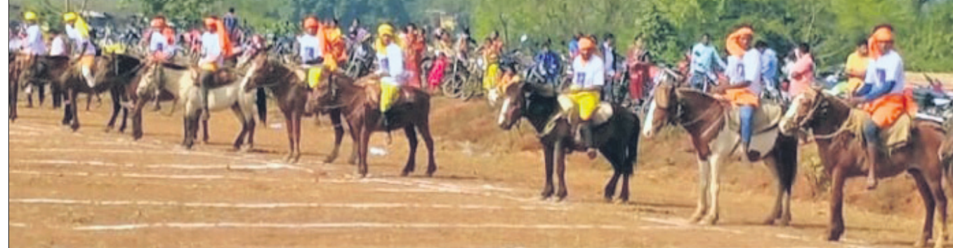
ପ୍ରତିଯୋଗିତାରେ ସାମିଲ ହୋଇଥିବା ଘୋଡ଼ା ।