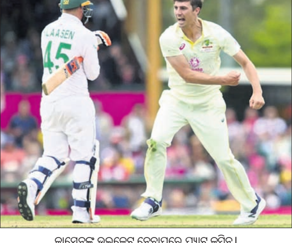
କ୍ଲବ୍ରେ ଉତ୍ତମ ନେତାପରେ ପ୍ୟାଟ୍ କୁନିନ୍।

ଭୁବନେଶ୍ୱର, ୭।୧ (ସ୍ପୋର୍ଟ୍ସ୍ ଡ୍ୟୁରୋ) ଦକ୍ଷିଣ ଆଫ୍ରିକା ବିପକ୍ଷରେ ଖେଳିବା ପାଇଁ ଯୋଗ୍ୟତା ଅର୍ଜନ କରିପାରିବ। ବର୍ଷା ଯୋଗୁ ଶୁକ୍ରବାର ଆଦୌ ଖେଳ ସମ୍ଭବ ହୋଇ ନ ଥିଲା। ଶନିବାର ମଧ୍ୟାହ୍ନ ଭୋଜନ ବିରତି ପୂର୍ବରୁ ମଧ୍ୟ ଖେଳ ହୋଇପାରି ନ ଥିଲା। ଫଳରେ ଅଷ୍ଟ୍ରେଲିଆ ଅଧିନାୟକ ପ୍ୟାଟ୍ କୁନିନ୍ ଇନିଂସ ଯୋଷଣା କରିବାକୁ ବାଧ୍ୟ ହୋଇଥିଲେ। ଫଳରେ ଉତ୍ତମାନ ଖାଜା ୧୯୫ ରନ୍ କରି ଅପରାଜିତ ରହିଥିଲେ ଏବଂ ସେ ଅକ୍ଟୋବର ଦିନରୁ ହାସଲ ହୋଇଥିଲେ।