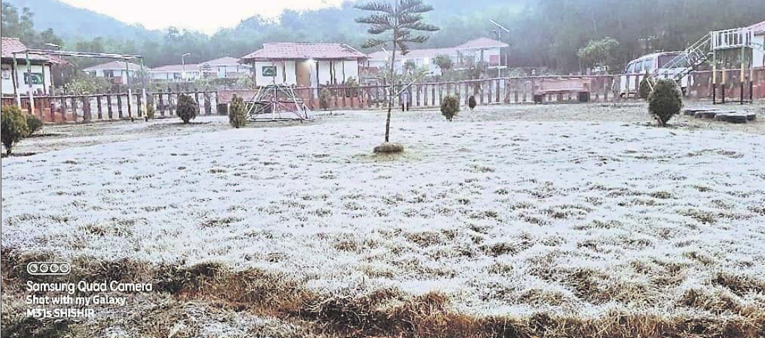
Samsung Quad Camera Shot with my Galaxy M53 5G SHIMILIPAL

ବାରମ୍ବାର ଅଫିସ, ୭୧୧ ଦିନକୁ ଦିନ ଶୀତ ଲହରୀ ବୁଦ୍ଧି ପାଉଥିବାବେଳେ ମୟୂରଭଞ୍ଜ ଜିଲାରେ ଏହାର ପ୍ରକୋପ ଅଧିକ ଅନୁଭୂତ ହେଉଛି। ଜଳେମଣ୍ଡଳ ଶିମିଳିପାଳରେ ପାରବ ଖସୁଛି। ଜିଲାରେ ସର୍ବନିମ୍ନ ୮ ଡିଗ୍ରୀ ତାପମାତ୍ରା ଥିବାବେଳେ ଶିମିଳିପାଳରେ ୫ ଡିଗ୍ରୀ ସେଲସିୟସ ରହିଛି। ଅଭୟାରଣ୍ୟର ଉପର ବାରହାକାମୁଡା, ଦେବଗୁଳା, ଜେନାବିଲ, ତାରାଶାବିଳା ଓ କୁମ୍ଭାରୀଠାରେ ସ୍ଥାନେ ସ୍ଥାନେ ଭୂସାରପାତ ଜାରି ରହିଛି, ଯାହାକି ଚଳିତବର୍ଷର ଅଦ୍ୟାବଧି ସର୍ବନିମ୍ନ ତାପମାତ୍ରା। ତାପମାତ୍ରା ହ୍ରାସ ପାଇ ଚୁହିନର ଆସୁରଣ ପଡ଼ିଥିବା ନେଇ ଶିମିଳିପାଳ ବ୍ୟାପ୍ତ ସଂରକ୍ଷଣ ପ୍ରକଳ୍ପ ଉତ୍ତର ବିଭକ୍ତ ପକ୍ଷରୁ ସୂଚନା ଦିଆଯାଇଛି। ଶିମିଳିପାଳ ଅଭୟାରଣ୍ୟର ପର୍ବତମାଳା ଯେଉଁ ଜିଲାରେ ଥିବା ୨୬ ବ୍ଲକ ମଧ୍ୟରୁ ଅଧିକାଂଶ ସ୍ଥାନରେ ୪ ଦିନ ଧରି ଜିଲାରେ ସର୍ବନିମ୍ନ ତାପମାତ୍ରା ୧୦ ଡିଗ୍ରୀ ତଳେ ରହୁଛି। ଗତ ୨୪ଘଣ୍ଟା ମଧ୍ୟରେ ସର୍ବନିମ୍ନ ୮.୨ ଡିଗ୍ରୀ ତଳକୁ ଖସି ୮.୫ ଡିଗ୍ରୀ ସେଲସିୟସ ଥିବା ରେକର୍ଡ ହୋଇଛି। ବିଗତ ବର୍ଷରୁ ଶିମିଳିପାଳ ଜିଲାରେ ଉତ୍ତର ବିଭକ୍ତ ପକ୍ଷରୁ ସୂଚନା ଦିଆଯାଇଛି। ଚଳିତବର୍ଷ ତାପମାତ୍ରା ଆହୁରି ଖସିବ ବୋଲି ଆକଳନ କରାଯାଇଛି। ଶିମିଳିପାଳ ଜିଲାରେ ରହୁଥିବା ପର୍ଯ୍ୟଟକଙ୍କ ଗାଡ଼ି, ନେତର କ୍ୟାମ୍ପ ଓ ପାଦ ଗାଲିକା ଉପରେ ଭୂସାରପାତ ଦେଖି ପର୍ଯ୍ୟଟକମାନେ ଚୁପି ହେବା ସହ ମଜା ଉଠାଇଛନ୍ତି। ରାତି ହେଲେ ଗାଁ ଗଣ୍ଡା ଲୋକେ ବୁଲି ମୁକ୍ତ କିମ୍ପା ଖୋଲା ସ୍ଥାନରେ ନିଆଁ ଜଳି ବସିରହୁଛନ୍ତି। ଉତ୍ତର-ଉତ୍ତର ପଶ୍ଚିମ ଦିଗରୁ ଅଧିକ ପ୍ରବାହ ହେଉଥିବାରୁ ଶୀତ ବଢ଼ିବାରେ ଲାଗିଛି। ସମୁଦ୍ର ସତ୍ତର ଖାତା ଜାରି ରହିବ ବୋଲି ଜରୁରୀକାଳୀନ କାର୍ଯ୍ୟକ୍ରମ ସୂଚନା ଜଣାପଡ଼ିଛି।