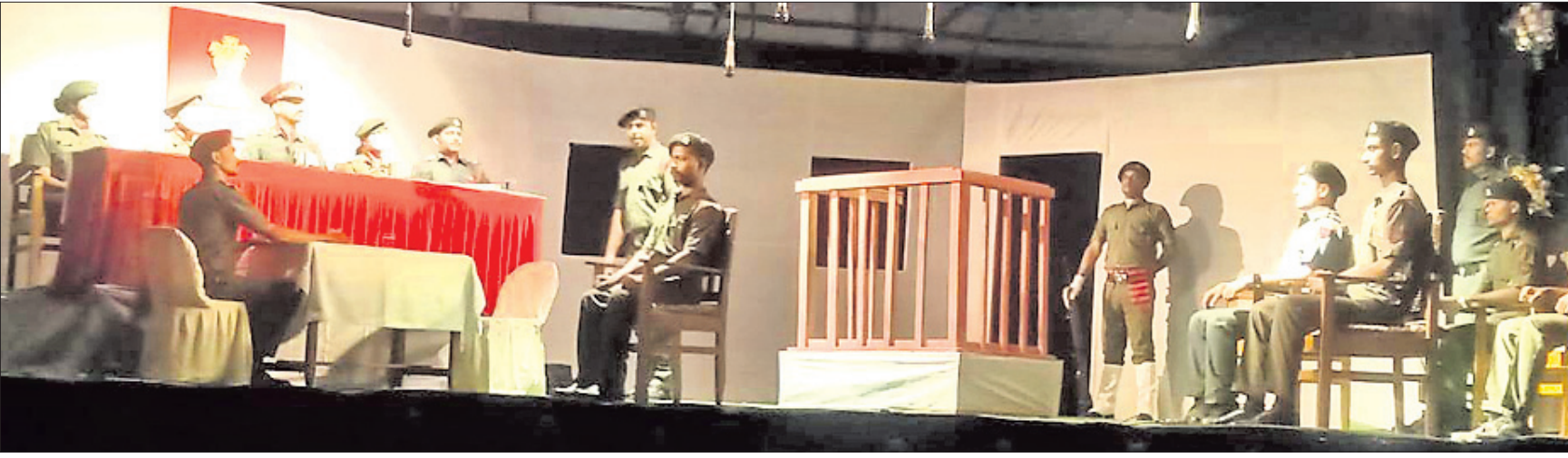
ଉଦ୍ଦେଶ୍ୟ ସମ୍ପାଦନା ପରିବେଶିତ ହିନ୍ଦୀ ନାଟକ କୋର୍ଟ ମାର୍ଗଲର ଏକ ଦୃଶ୍ୟ।