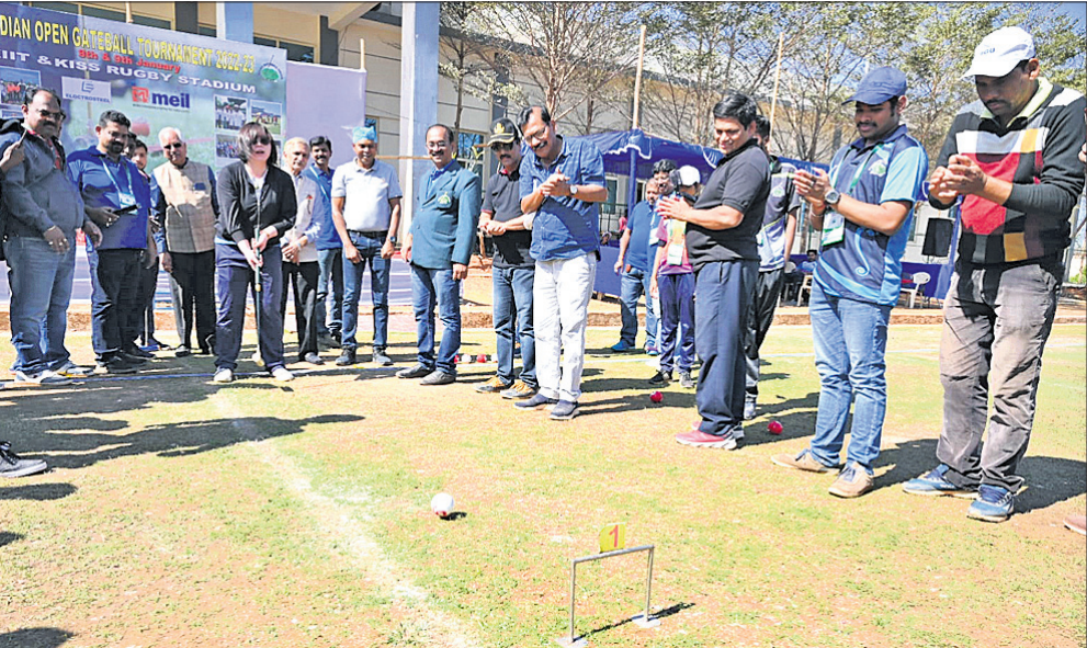
ଇଣ୍ଡିଆନ୍ ଓପନ୍ ଟେନିସ ଉଦ୍ଘାଟନ ଅବସରରେ ଖେଳାଳି ଓ କର୍ମଚାରୀଙ୍କ ଗହଣରେ ଅତିଥିମାନେ।

ଭୁବନେଶ୍ୱର, ଫିଏ(ବ୍ରାହ୍ମା ପ୍ରତିନିଧି) ଇଣ୍ଡିଆନ୍ ଓପନ୍ ଟେନିସ (ଆଇଜିଆ) ଚୁନାମାଣ୍ଡର ନବମ ସଂସ୍କରଣ ରବିବାର କିଏ ବିଶ୍ୱବିଦ୍ୟାଳୟ ପରିସରରେ ଉଦ୍ଘାଟିତ ହୋଇଯାଇଛି।