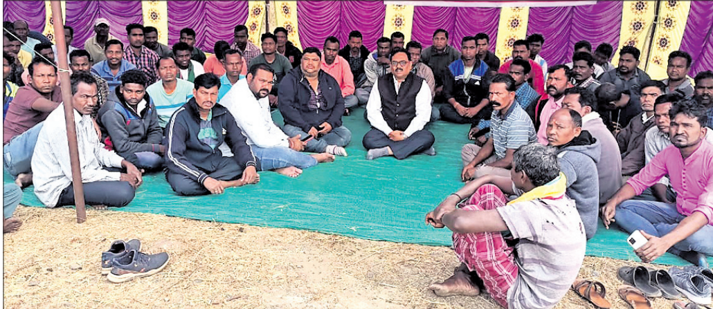
ପ୍ରକଳ୍ପ ସମ୍ବନ୍ଧରେ ଗଣଧାରଣାରେ ବସିଛନ୍ତି ଆୟୋଜନକାରୀମାନେ।

ଆରମ୍ଭରୁ ଲକ୍ଷନପୁର ବ୍ଲକ୍ କୁମାରବନ୍ଧୁ ପଞ୍ଚାୟତ ଅନ୍ତର୍ଗତ ସାହଜବାହାଲ ଛିତ ବନ୍ଦ ଥିବା ଆଇବିଇୟୁଏଲ୍ ପ୍ରକଳ୍ପକୁ ଏନ୍‌ସିଏଲ୍‌ଟି ଜରିଆରେ କେଏସ୍‌ଏସ୍‌ଏସ୍ ଏନର୍ଜି କମ୍ପାନୀ ଏହାକୁ କ୍ରୟ କରି ନେଇଛି। ଏହା ଜଣାପଡିବା ପରେ ୪ଦିନ ଦାବିନେଇ ସାହଜବାହାଲ ଗ୍ରାମ୍ୟ କମିଟି ତରଫରୁ ଗୁରୁବାରଠାରୁ ପ୍ରକଳ୍ପ ପାଟକ