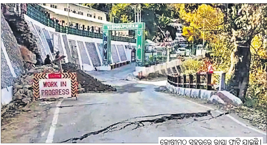
କୋଷାମଠ ସହରରେ ରାସ୍ତା ଫାଟି ଯାଇଛି।

ଦେବାକୁନି ରୂପେ ପରିଚିତ ଉତ୍ତରାଖଣ୍ଡର ଛୋଟ ସହର କୋଷାମଠ ଉପରେ ବଡ଼ ବିପଦ ଦେଖାଦେଇଛି। ତମୋଲି ଜିଲାର ଏହି ଅଞ୍ଚଳରେ ଲଗାତର ଭାବେ ଘର କାନ୍ଥ ଭାଙ୍ଗିବା ସହ ରାସ୍ତା ଧସିବାରେ ଲାଗିଥିବାରୁ ରବିବାର ଏହାକୁ 'ଡୁଙ୍ଗଳନ ପ୍ରବଣ କୋନ୍' ଘୋଷଣା କରାଯାଇଛି। ହିମାଳୟ ପାଦରେ ତଥା ସମୁଦ୍ର ପତ୍ତନଠାରୁ ୬,୧୫୦ ଫୁଟ ଉଚ୍ଚତାରେ ଅବସ୍ଥିତ କୋଷାମଠ ପ୍ରତି ବିପଦି ମାଡ଼ିଆସିଥିବାରୁ ଲୋକେ ଆତଙ୍କିତ ହୋଇ ଘରଦ୍ୱାର ଛାଡ଼ି ଅନ୍ୟତ୍ର ଆଶ୍ରୟ ନେଇଛନ୍ତି। ୬୦ ପରିବାରକୁ ସୁରକ୍ଷିତ ସ୍ଥାନକୁ ସ୍ଥାନାନ୍ତର କରାଯାଇଥିବାବେଳେ ଆହୁରି ଅନ୍ୟ ୯୦ ପରିବାରକୁ ଅସ୍ଥାୟୀ ରିଲିଫ୍ କ୍ୟାମ୍ପକୁ ନିଆଯିବ ବୋଲି ପ୍ରଶାସନ ପକ୍ଷରୁ କୁହାଯାଇଛି। ହାଡ଼ଭଙ୍ଗା ଶୀତରେ ଲୋକଙ୍କ ପାଇଁ ବଞ୍ଚିବା ଦୁର୍ଦ୍ଦିନ ହୋଇଯାଇଛି। ଏହାକୁ ଦୂରରେ ରଖି ପ୍ରଧାନମନ୍ତ୍ରୀଙ୍କ କାର୍ଯ୍ୟାଳୟ (ପିଏମଓ) ପକ୍ଷରୁ ଉଚ୍ଚସ୍ତରୀୟ ବୈଠକ କରାଯାଇଛି।