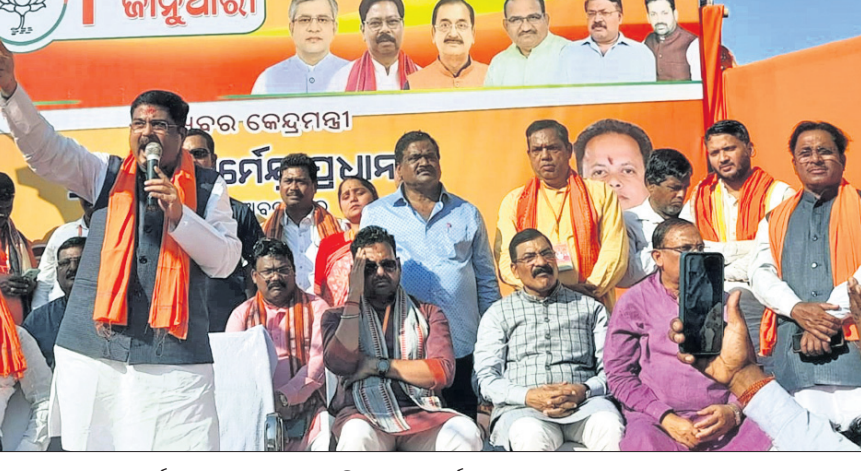
କର୍ମୀ ସମାବେଶରେ କେନ୍ଦ୍ର ଶିକ୍ଷାମନ୍ତ୍ରୀ ଧର୍ମେନ୍ଦ୍ର ପ୍ରଧାନ ଓ ଅନ୍ୟ ନେତୃମଣ୍ଡଳ।

ନିଶ୍ଚିତକୋଲି, ୮୧ (ସ.ପ୍ର.) ନିଶ୍ଚିତକୋଲି କଲ୍ୟାଣୀ ମଣ୍ଡପରେ ଭାଜପା ପକ୍ଷରୁ ସକଳ ଯାତ୍ରା ଓ କର୍ମୀ ସମାବେଶ ଅନୁଷ୍ଠିତ ହୋଇଯାଇଛି। ଏଥିରେ କେନ୍ଦ୍ର ଶିକ୍ଷା ମନ୍ତ୍ରୀ ଧର୍ମେନ୍ଦ୍ର ପ୍ରଧାନ ମୁଖ୍ୟ ଅତିଥିଭାବେ ଯୋଗଦେଇ ରାଜ୍ୟସରକାରଙ୍କୁ କୃତ୍ୱ ସମାଲୋଚନା କରିଛନ୍ତି। ରାଜ୍ୟ ସରକାର ଦୁର୍ନୀତିରେ ଲିପ୍ତ ଥିବାରୁ ସାଧାରଣ ଲୋକେ ନ୍ୟାୟ ପାଇବାରୁ ବଞ୍ଚିତ ହେଉଛନ୍ତି। ରାଜ୍ୟରେ ମହିଳାମାନେ ସ୍ୱର ଉତ୍ତୋଳନ କରନ୍ତୁ ବୋଲି ପ୍ରଧାନ ଆହ୍ୱାନ ଦେଇଛନ୍ତି। ମନ୍ତ୍ରୀ ପ୍ରଧାନ ପ୍ରଥମେ ପରିସଫଟିଆରେ ଥିବା ଏକ ମଣ୍ଡପରେ ପହଞ୍ଚି ୨୬ ନଂ. କୋନର କାର୍ଯ୍ୟକର୍ତ୍ତାଙ୍କୁ ସମୋ୍ଧନ