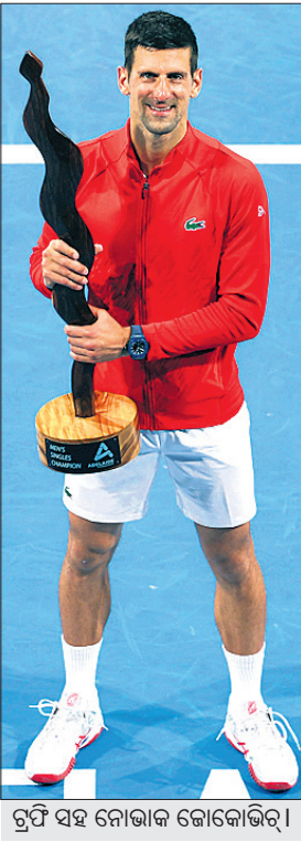
ଟ୍ରଫି ସହ ନୋଭାକ ଜୋକୋଭିଚ୍।

ଆତିକେତୁ, ଫିଏ(ପି.ଟି.): ସର୍ବଥା ଆର ନୋଭାକ ଜୋକୋଭିଚ୍ ରବିବାର ଆତିକେତୁ ଇଣ୍ଡରମ୍ୟାଶନାଲ ଟେନିସ ଟାଇଟଲ ବିଜୟୀ ହୋଇଛନ୍ତି।