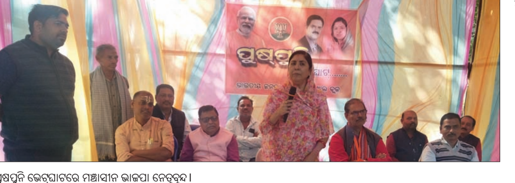
ପୁଷ୍ପପୁନି ଭେଟ୍ଘାଟରେ ମଞ୍ଚାସୀନ ଭାଜପା ନେତୃତ୍ୱ।

ସଭାପତି ତଥା ପୁଷ୍ୟମନ୍ତ୍ରୀ ନବୀନ ପଟ୍ଟନାୟକଙ୍କ ଜନକଲ୍ୟାଣ କାର୍ଯ୍ୟର ସୁଫଳ ସମଗ୍ରୁକ ପାଖ୍ୟର କିଲି ପହଞ୍ଚି ପାରିବ କର୍ମୀମାନେ କାର୍ଯ୍ୟ କରିବାକୁ ଆହ୍ୱାନ ଦିଆଯାଇଥିଲା। ଦଳର ପ୍ରତିଷ୍ଠା ଦିବସ ଆହୁତ୍ସାରେ ଶାସକ ଦଳ ଆଗାମୀ ନିର୍ବାଚନକୁ ଲାଗ୍ୟ ରଖି ଦମ ଦେଖାଇଥିବା ଦେଖିବାକୁ ମିଳିଥିଲା।