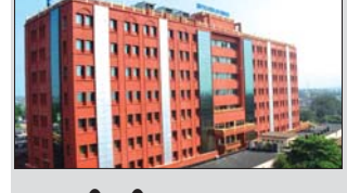
ମାନସିକ ବିକାରଗ୍ରସ୍ତ କର୍ମଚାରୀ ଚିକିତ୍ସା କରିବେ ଚାଲିଗପୁ ପ୍ରଗତି

ହେଲ୍ୟ ଆଣ୍ଡ୍ ଚୁରୋସାଇଟ୍ରେସ୍ (ଏ.ଏ.ଇ.ଏ.ଏ.ଏ.ଏ.ଏ.ଏ.ଏ.ଏ.ଏ.) ହିନ୍ଦିଗଲରେ ଏମିଟିଏସ୍ ତାଲୁକାମାନଙ୍କୁ ଚାଲିମ ଦିଆଯିବ । ସେମାନେ ଚାଲିମପ୍ରାପ୍ତ ହେବା ପରେ ଓଡ଼ିଶାକୁ ଆସି ଜେଲର ମାନସିକ ବିକାରଗ୍ରସ୍ତ କର୍ମଚାରୀ ଚିକିତ୍ସା ସେବା ଯୋଗାଇ ଦେବେ ବୋଲି ସ୍ୱାସ୍ଥ୍ୟ ବିଭାଗ ପକ୍ଷରୁ ଅନୁମୋଦିତ ଅନୁମତି କରାଯାଇଥିଲା । ଏହା ଉପରେ ୪ ସପ୍ତାହ ମଧ୍ୟରେ ପଦକ୍ଷେପ ନେବାକୁ ହାଇକୋର୍ଟ ରାଜ୍ୟ ସରକାରଙ୍କୁ ନିର୍ଦ୍ଦେଶ ଦେଇଛନ୍ତି । ମା'ଙ୍କୁ ୯ରେ ପରବର୍ତ୍ତୀ ଶୁଣାଣି ହେବ ବୋଲି ଧାର୍ଯ୍ୟ ହୋଇଛି ।