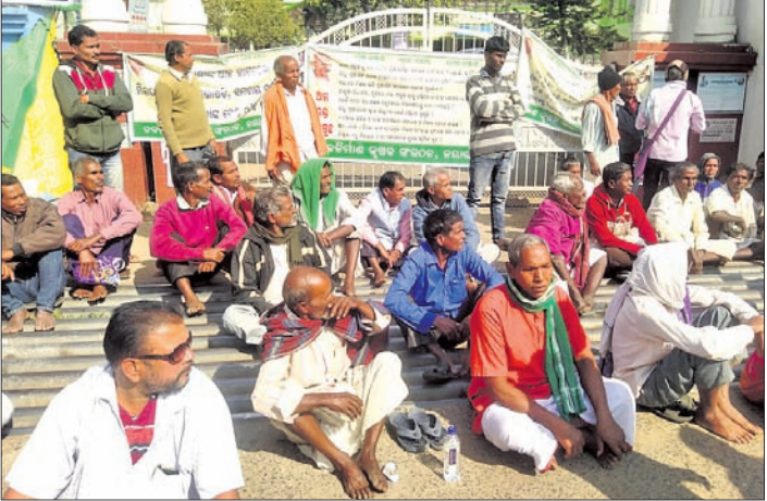
ଜିଲାପାଳ କାର୍ଯ୍ୟାଳୟ ଫାଟକ ବନ୍ଦ କରି ଚାଷୀମାନେ ଆନ୍ଦୋଳନ କରୁଛନ୍ତି।