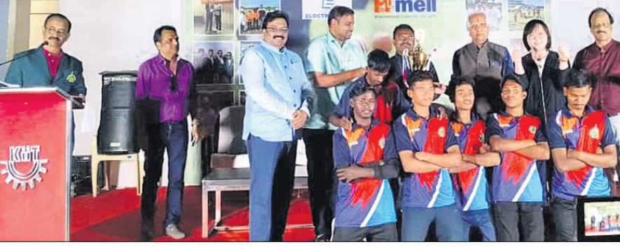
ଉଦ୍‌ଯାପନା ଉତ୍ସବରେ ଅତିଥିକ ଗଣଗଣେ କୃତୀ ଖେଳାଳିମାନେ।

ଭୁବନେଶ୍ୱର, ୯୧୧ (କ୍ରୀଡ଼ା ପ୍ରତିଧ୍ୱଜ) ମିଶ୍ର ଗାଜଲ ଚିତିଥିଲେ। ସେହିପରି ୫ ଜଣିଆ ଟିମ୍ ଗୋପେଶ ଆଇଜିୟୁ ବଳକୁ ହରାଇ ବନବାସୀ ଯୋଡ଼ା ଟିମ୍ ଗାମ୍ଭୀର ହୋଇଛି। ରାଜ୍ୟ ଗ୍ରାମୀଣ ମୁଖ୍ୟାଳୟ ବେହେରା ମୁଖ୍ୟଅତିଥି ଭାବେ ଯୋଗଦେଇ ବିଜୟା ଖେଳାଳି ମାନଙ୍କୁ ପୁରସ୍କାର ବିତରଣ କରିଥିଲେ।