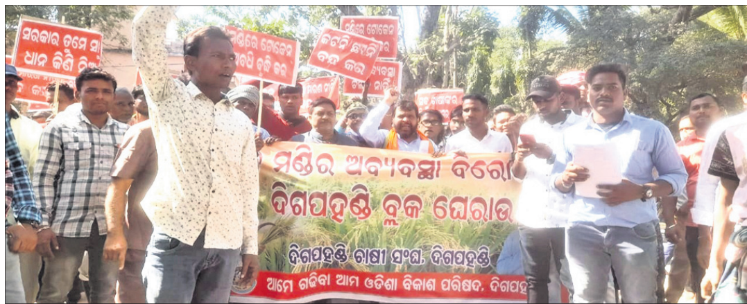
ଶୋଭାଯାତ୍ରାରେ ଚାଷୀ ସଙ୍ଗଠନର ନେତୃତ୍ୱ ।

ଦିଗପହଣ୍ଡି ବୁକ ଚାଷୀ ସଙ୍ଗଠନ ପକ୍ଷରୁ ଯୋଜନା କରାଯାଇଥିବା ଶୋଭାଯାତ୍ରା ହୋଇଯାଇଛି ।