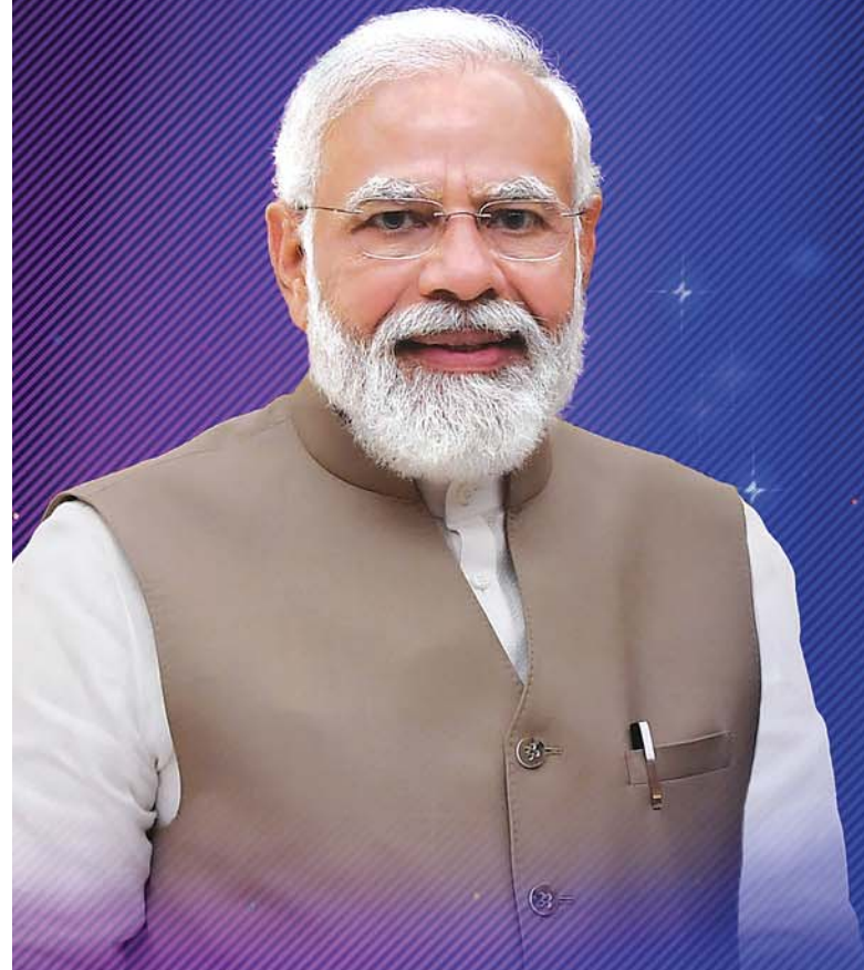
ଶ୍ରୀ ନରେନ୍ଦ୍ର ମୋଦୀ ମାନନୀୟ ପ୍ରଧାନମନ୍ତ୍ରୀ, ଭାରତ