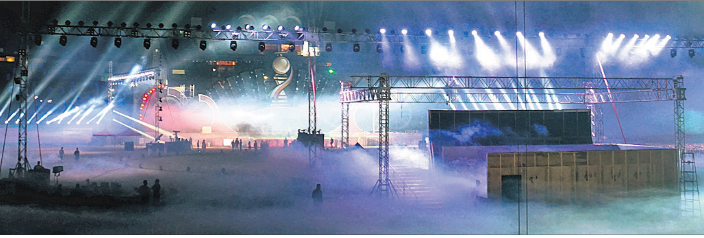
ହକି ବିଶ୍ୱକପର ଉଦ୍‌ଘାଟନୀ ସମାରୋହ ପାଇଁ କଳାକାରଙ୍କ ଅଭ୍ୟାସ ଅବସରରେ ଯୋଗବାର ଆଲୋକରେ ଉଦ୍‌ଘାଟିତ କରକର ବାରବାଟୀ ଷ୍ଟାଡ଼ିୟମ।