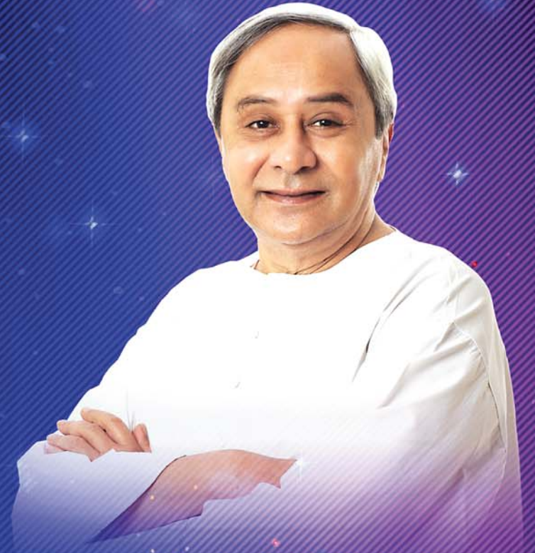
ଶ୍ରୀ ନବୀନ ପଟ୍ଟନାୟକ ମାନନୀୟ ମୁଖ୍ୟମନ୍ତ୍ରୀ, ଓଡ଼ିଶା

FIH ODISHA HOCKEY MEN'S WORLD CUP 2023 BHUBANESWAR - ROURKELA 13 - 29 JANUARY 2023