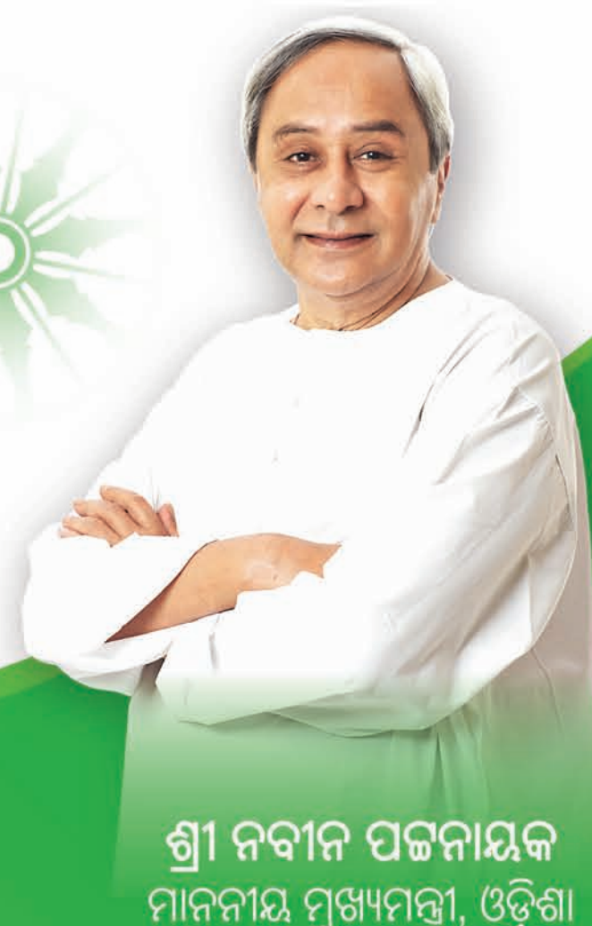
ଶ୍ରୀ ନବୀନ ପଟ୍ଟନାୟକ ମାନନୀୟ ମୁଖ୍ୟମନ୍ତ୍ରୀ, ଓଡ଼ିଶା