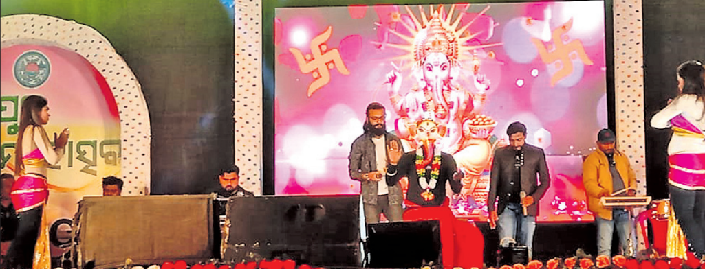
କଳାକାରମାନଙ୍କ ଦ୍ୱାରା ନୃତ୍ୟ ଓ ଗୀତ ପରିବେଷଣ କରାଯାଇଛି।

ନୟାଗଡ଼ ଜିଲା ରଣପୁର ବାଘସାମନ୍ତ ମିନି ଷ୍ଟୁଡିଓମର ମୁକ୍ତ ଆକାଶ ରଙ୍ଗମଞ୍ଚରେ ୧୨ତମ ରଣପୁର ମହୋତ୍ସବ ଅର୍ଜୁନ ଯୋମବାର ଉଦ୍‌ଯାପନା ସାଧ୍ୟାରେ ମେଲୋଡି ଓ ସିନେକଳାକାରଙ୍କ ଅଭିନୟ ଦର୍ଶକଙ୍କ ମନ ମୋହିଲା। ୪ଦିନ ମହୋତ୍ସବରେ ବିଭିନ୍ନ ବୋକାଳ ଓ ଷ୍ଟାଲରେ ୭୦ ଲକ୍ଷରୁ ଊର୍ଦ୍ଧ୍ୱ ଟଙ୍କାର ବ୍ୟବସାୟ ହୋଇଥିବା ଜଣାଯାଇଛି। ଶୀତୁଆ ପାଗରେ ମଧ୍ୟ ରାତି ପର୍ଯ୍ୟନ୍ତ ଦର୍ଶକମାନେ ବିଭିନ୍ନ ମନୋରଞ୍ଜନ କାର୍ଯ୍ୟକ୍ରମକୁ ଉପଭୋଗ କରିଥିଲେ। ମହୋତ୍ସବ ଉଦ୍‌ଯାପନା ହୋଇଥିବାରୁ ବିଭିନ୍ନ ବୋକାଳ ଓ ଷ୍ଟାଲକୁ ପ୍ରବଳ ଭିଡ ଦେଖିବାକୁ ମିଳିଥିଲା। ଘର କରଣା ସାମଗ୍ରୀକୁ ଲୋକମାନେ କିଣୁଥିବା ଦେଖିବାକୁ ମିଳୁଥିଲା। ବିଭିନ୍ନ ଲୋକମାନେ ଖାଦ୍ୟ ମଜା ନେଇଥିଲେ। ମହୋତ୍ସବରେ ପଢ଼ୁଥିବା ରାମବୋଲି ବିଭିନ୍ନ ପ୍ରକାର ଖେଳ ମଜା ଯୁବବର୍ଗଠାରୁ ପିଲାମାନେ ମଜା ଉଠେଇଥିଲେ। ଅଞ୍ଚଳର ହଜାର ହଜାର ଦର୍ଶକଙ୍କ ଭିଡ଼ ଜମିଥିଲା। ଉଦ୍‌ଯାପନା ସାଧ୍ୟାରେ ପୁଷ୍ପ