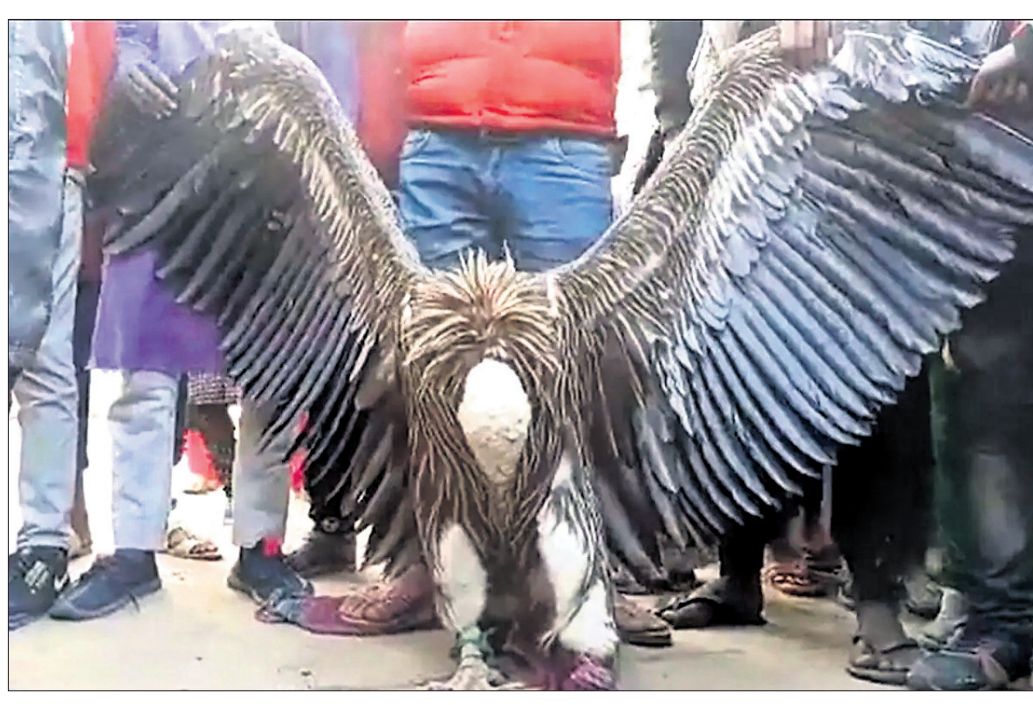
୫୫୦୦ ମିଟର ଉଚ୍ଚରେ ଅବସ୍ଥିତ । ଏପରି ଶାଗୁଣା ବିଶେଷକରି ପାକିସ୍ତାନ, ଉଲ୍ଲେଖଯୋଗ୍ୟ, ଡାକ୍ତରୀୟ, ନେପାଳ, ଭୁଟାନ ଏବଂ ତିବେଟରେ ବେଖାଯାଆନ୍ତି ।

ଲକ୍ଷ୍ଣୋ ପୃଥିବୀରେ ଅନେକ ପ୍ରାଣୀଙ୍କ ସଂଖ୍ୟା କମି କମି ବିଲୁପ୍ତହୁଏ । ସେଥିମଧ୍ୟରେ ଶାଗୁଣା ଅନ୍ୟତମ । ଭାରତ ପ୍ରଦେଶର କାନପୁର ଅଞ୍ଚଳରୁ ଏକ ଭିଡିଓ ସାମଗ୍ରୀ ଆସିଛି । ସେଥିରେ ହିମାଳୟର ବରଫ ଚୋଟିରେ ଶାଗୁଣା ବେଖୁବାକୁ ମିଳିଛି । କାନପୁରର କର୍ମଚାରୀମାନେ ଅଞ୍ଚଳର ଏକ ଶୁଖାନ୍ ସହ ଶାଗୁଣାକୁ ଘାଣ୍ଟି ଲୋକେ ଚାହୁଁନା ଲାଭେଇ । ଶାଗୁଣାକୁ ସଫା ହେବ ଶୁଖାନ୍ରେ ବୁଲୁଥିବା ନଜରକୁ ଆସିଥିଲା । ଶାଗୁଣା ତୋଷା ଲାଭ ୬ ଫୁଟ ହୋଇଥିବାବେଳେ ତାକୁ ୫ ଜଣ ମିଶି ଧରିଥିଲେ । ଏବେ ସେହି ଶାଗୁଣାକୁ ବନ୍ଦିଦାରକୁ ହସ୍ତାନ୍ତର କରାଯାଇଛି । ବିଭାଗ ତାକୁ ବାବାଝାଲନ୍ଦରେ ରଖିଛି । ଏପରି ଦୁର୍ଲଭ ଶାଗୁଣା ଏହି ଅଞ୍ଚଳକୁ କିପରି ଆସିଲା ତା’ ଉପରେ ବନ୍ଦିଦାର ନଜର ରଖିଛି । ରିପୋର୍ଟ ଅନୁସାରେ, ଏହି ହିମାଳୟାନ୍ ଶାଗୁଣା ପାହାଡ଼ ଅଞ୍ଚଳରେ ବେଖୁବାକୁ ମିଳିଥିଲା, ଯାହା ୧୨୦୦ରୁ ୫୫୦୦ ମିଟର ଉଚ୍ଚରେ ଅବସ୍ଥିତ । ଏପରି ଶାଗୁଣା ବିଶେଷକରି ପାକିସ୍ତାନ, ଉଲ୍ଲେଖଯୋଗ୍ୟ, ଡାକ୍ତରୀୟ, ନେପାଳ, ଭୁଟାନ ଏବଂ ତିବେଟରେ ବେଖାଯାଆନ୍ତି ।