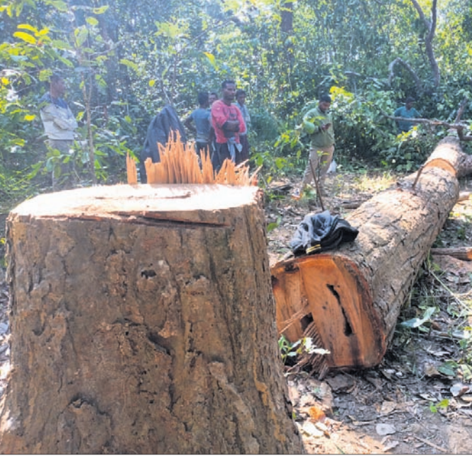
କଟା ଯାଇଥିବା ବିରାଟ ଶାଳ ଗଛ।