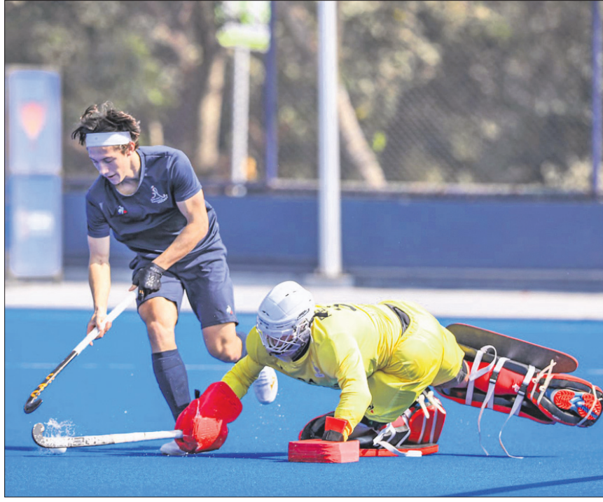
ରାଉରକେଲାର ବିର୍ଯ୍ୟାମୁଖୀ ଷ୍ଟାଡ଼ିୟମରେ ଯୋଗବାର ଭାରତ ଓ ଦୁଧିକିଲୀ ମଧ୍ୟରେ ଅନୁଷ୍ଠିତ ଅଭ୍ୟାସ ଦଳ।