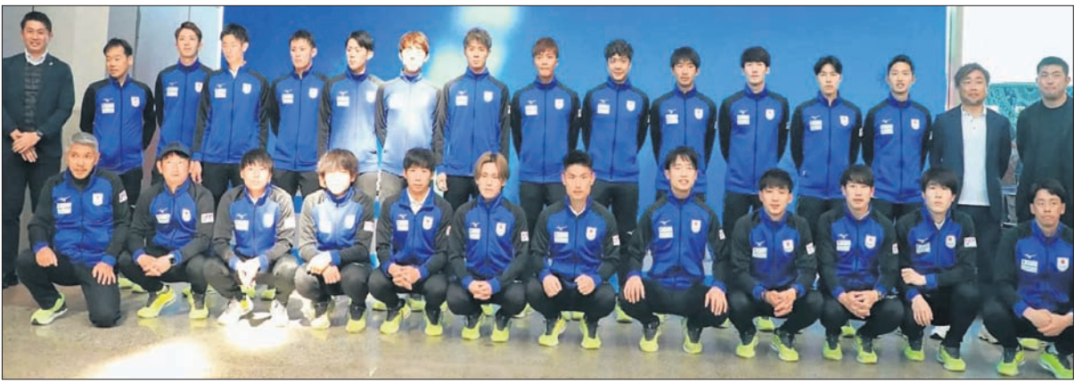
ଯୋଗବାର ଭୁବନେଶ୍ୱରରେ ପହଞ୍ଚିଥିବା ଜାପାନ ଦଳ।

ଚଳିତ ବିଶ୍ୱକପରେ ଭାରତର ସଫଳତା ନେଇ ଆଶାବାଦୀ ଅଛନ୍ତି ଏହି ୨୩ ବର୍ଷୀୟ ଫରାଓର୍ଡ। ବିଶ୍ୱକପକୁ ନେଇ ଉତ୍ସାହିତ ରହିଥିବା ବେଳେ ସମାନ ସମୟରେ ସାମାନ୍ୟ ନର୍ତ୍ତ୍ୟ ମଧ୍ୟ ରହିଛନ୍ତି। ଘରୋଇ ମାଟିରେ ବିଶ୍ୱକପ ଖେଳିବା ମୋ ପାଇଁ ସର୍ବଦା ସ୍ୱପ୍ନ ରହିଥିଲା। ଏକ ବୃହତ୍ ଦର୍ଶକଙ୍କ ଆଗରେ ଖେଳିବାର ଏହା ମୋର ପ୍ରଥମ ଅଭିଜ୍ଞତା। ଅଭିଷେକ ଭାରତୀୟ ଦଳ ପାଇଁ ୨୮ ଅନ୍ତର୍ଜାତୀୟ ମୁକାବିଲାରେ ୧୧ ଗୋଲ ଖୋର କରିଛନ୍ତି। ବିଗତ ବର୍ଷ ଏଫଆଇଏଚ୍ ପ୍ରୋ ଲିଗରେ ଭାରତୀୟ ପୁରୁଷ ହକି ଦଳ ପାଇଁ ପଦାର୍ପଣ କରିଥିଲେ ଫରାଓର୍ଡ ଖେଳାଳି ଅଭିଷେକ। ମନଦାପ ସିଂ, ଲଳିତ କୁମାର ଉପାଧ୍ୟାୟ ଓ ପୁଷ୍ପକିତ ସିଂହଙ୍କ ସହିତ ଭାରତୀୟ ଫରାଓର୍ଡର ଏକ ଅବିଚ୍ଛେଦ୍ୟ ଅଙ୍ଗ ପାଲଟିଥିବା ବେଳେ ଚଳିତ ବିଶ୍ୱକପରେ ପ୍ରଥମ ଥର ପାଇଁ ଭାରତୀୟ ଦଳରେ ସାମିଲ ଅଛନ୍ତି। ହରିୟାଣାର ସୋନେପଡରେ ୧୧ ବର୍ଷ ବୟସରେ ସାଙ୍ଗ ଦ୍ୱାରା ଅନୁପ୍ରାଣିତ ହୋଇ ଅଭିଷେକ ହକି ଖେଳ ପ୍ରତି ଆକୃଷ୍ଟ ହୋଇଥିଲେ।