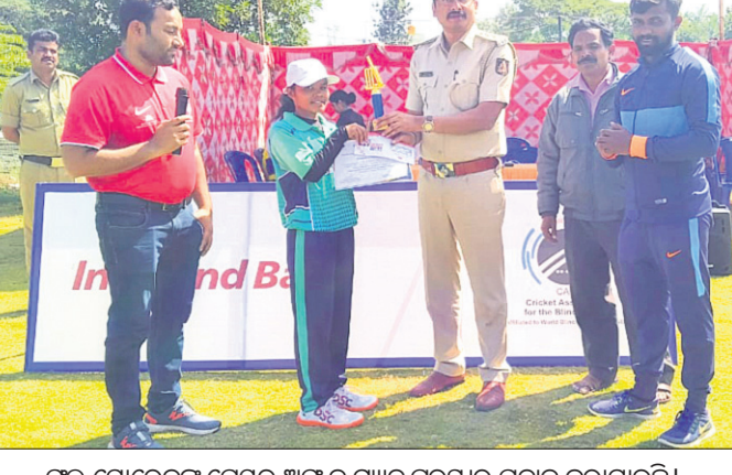
ଭୁବନେଶ୍ୱରରେ ଚଳିଥିବା ଜାତୀୟ ମହିଳା ଦୃଷ୍ଟିବାଧିତ କ୍ରିକେଟର ତୃତୀୟ ସଂସ୍କରଣରେ ଭୁବନେଶ୍ୱର ଦଳ ୧୦ ଉଇକେଟରେ ହରିୟାଣାକୁ ହରାଇଛି।

ଭୁବନେଶ୍ୱର, ୯୧୧ (ସ୍ପୋର୍ଟ୍ସ୍ ସ୍କ୍ୟୁରୋ) ଭୁବନେଶ୍ୱର ଅନୁଷ୍ଠିତ ଜାତୀୟ ମହିଳା ଦୃଷ୍ଟିବାଧିତ କ୍ରିକେଟର ତୃତୀୟ ସଂସ୍କରଣରେ ଭୁବନେଶ୍ୱର ଦଳ ୧୦ ଉଇକେଟରେ ହରିୟାଣାକୁ ହରାଇଛି।