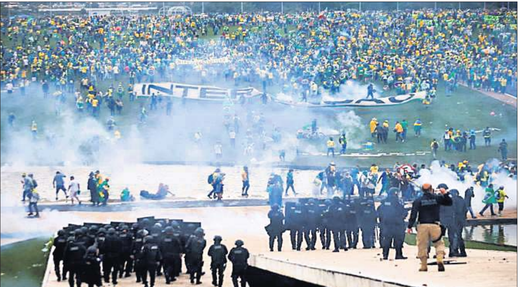
ବୋଲିଥିବାବେଳେ ସମର୍ଥକମାନେ ରବିବାର ରାଜଧାନୀ ଦ୍ରାଢ଼ିଲରେ ବିଶୋଭ ପ୍ରଦର୍ଶନ କରୁଛନ୍ତି।

ଦ୍ରାଢ଼ିଲ ଅବସରପ୍ରାପ୍ତ ସେନା ଅଧିକାରୀ ରାଜଧାନୀରେ କେବଳ ବୋଲିଥିବାବେଳେ ଦେଶର ୩୮ତମ ରାଷ୍ଟ୍ରପତି ଭାବେ ୨୦୧୯ରୁ ୨୦୨୨ କ୍ଷମତାରେ ରହିଥିଲେ। ଗତବର୍ଷ ଅକ୍ଟୋବରରେ ହୋଇଥିବା ସାଧାରଣ ନିର୍ବାଚନରେ ସେ ଲୁଲୁଚ୍ ଜନସଭାକୁ ହାରି ଶ୍ରୀଲଙ୍କାକୁ ହାରିଯାଇଥିଲେ। ବିଚାର ଥର ନିର୍ବାଚନ ପାଇଁ ପ୍ରତିବନ୍ଧିତ କରି ପରାଜିତ ହେବାରେ ବୋଲିଥିବାବେଳେ ପ୍ରଥମ ରାଷ୍ଟ୍ରପତି ପରାଜୟକୁ ସେ ସହଜେ ଗ୍ରହଣ କରିପାରି ନାହାନ୍ତି। କ୍ଷମତା ଯିବା ପରେ ବୋଲିଥିବାବେଳେ ବିଦ୍ରୋହ କରିଛନ୍ତି। ତାଙ୍କ ସମର୍ଥକମାନେ ରବିବାର ଦେଶର ପାଇଁମେଣ୍ଟ, ରାଷ୍ଟ୍ରପତି ଭବନ ଓ ସର୍ବୋଚ୍ଚ ଅଧିକାରରେ ଭଙ୍ଗାଚୁକା କରିଛନ୍ତି। ଏହା ଗଣତନ୍ତ୍ରରେ ଏକ ଖରାପ ପରମ୍ପରା ସୃଷ୍ଟି କରିଛି। ଦୁଇବର୍ଷ ପୂର୍ବେ ଆମେରିକା କ୍ୟାପିଟୋଲରେ ଅତ୍ୟୁତ ବିଦ୍ରୋହ ହୋଇଥିଲା। ତେଣୁ ଗୁମ୍ଫା ନିର୍ବାଚନ ହାରିଯିବା ପରେ ୨୦୨୧ ଜାନୁୟାରୀ ୬ରେ ତାଙ୍କ ସମର୍ଥକମାନେ ଆମେରିକା କ୍ୟାପିଟୋଲରେ ଧସାଇ ପଶି ଆକ୍ରମଣ କରିଥିଲେ।