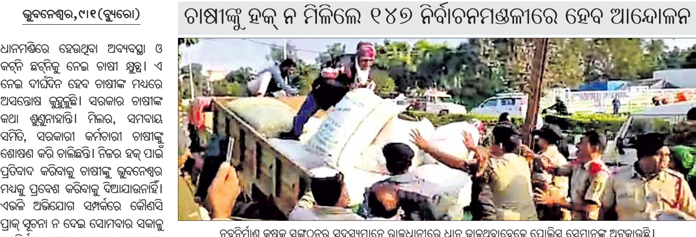
ନବନିର୍ମାଣ କୃଷକ ସଂଗଠନର ସଦସ୍ୟମାନେ ରାଜଧାନୀରେ ଧାନ ଭାଙ୍ଗିବାକୁ ପ୍ରତିବାଦ ପୋଲିସ୍ ସେମାନଙ୍କୁ ଅଟକାଇଛି।

ନବୀନ ନିବାସ ଘେରାଉ ଉଦ୍ୟମ କଲା ନବ ନିର୍ମାଣ କୃଷକ ସଂଗଠନ