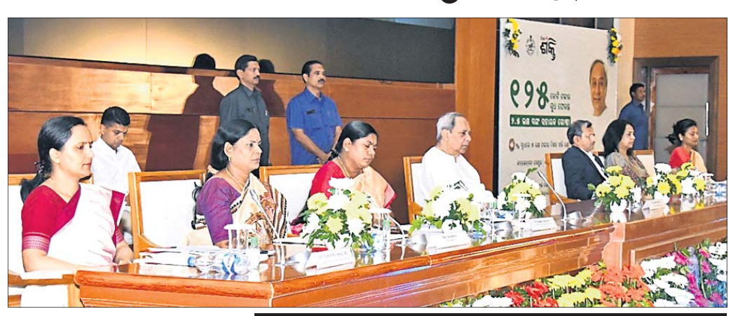
ଭୁବନେଶ୍ଵର, ୯/୧ (ବୁଧବେଳା)