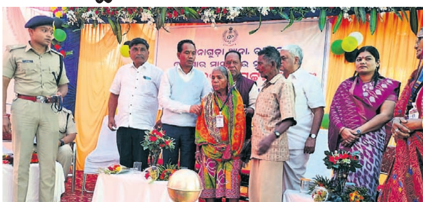
ରାମନାଗୁଡ଼ା, ୯ (ବି.ଏନ.ଏ.)

ରାୟଗଡ଼ା ଜିଲ୍ଲା ରାମନାଗୁଡ଼ା ଠାରେ ଥିବା ଫାଣ୍ଡି ଥାନାର ମାନ୍ୟତା ପାଇଛି। ନୂତନ ଥାନାକୁ ପୁଖ୍ୟମନ୍ତ୍ରୀ ସୋମବାର ଭାର୍ତ୍ତୀୟାଳରେ ଉଦଘାଟନ କରିଛନ୍ତି।