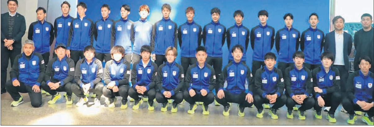
ଯୋଗବାର ଭୁବନେଶ୍ୱରରେ ପହଞ୍ଚିଥିବା ଜାପାନ ଦଳ।