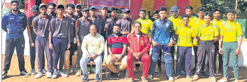
ଅତିଥିଙ୍କ ସହ ଖେଳାଳିମାନେ ।