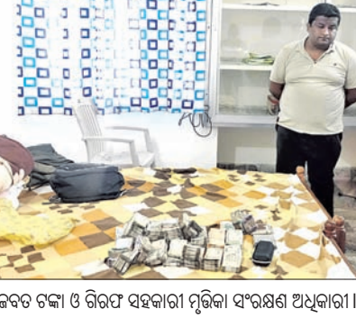
ଜବତ ଟଙ୍କା ଓ ଗିରଫ ସହକାରୀ ମୃତ୍ତିକା ସଂରକ୍ଷଣ ଅଧିକାରୀ

■ ଭୁଲେଟରେ ଲକ୍ଷାଧିକ ଟଙ୍କା ନେଇଥିବାବେଳେ ଧରାପଡ଼ିଲେ ■ ୧୧, ୮୪, ୫୬୦ ଟଙ୍କା ଜବତ