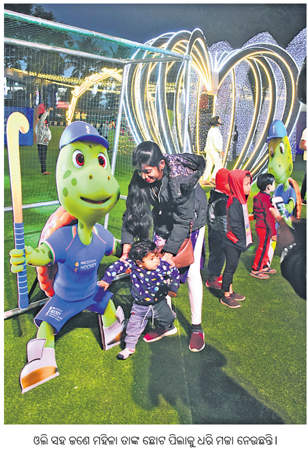
ଓଲି ସହ ଜଣେ ମହିଳା ତାଙ୍କ ଛୋଟ ପିଲାକୁ ଧରି ମଜା ନେଉଛନ୍ତି।