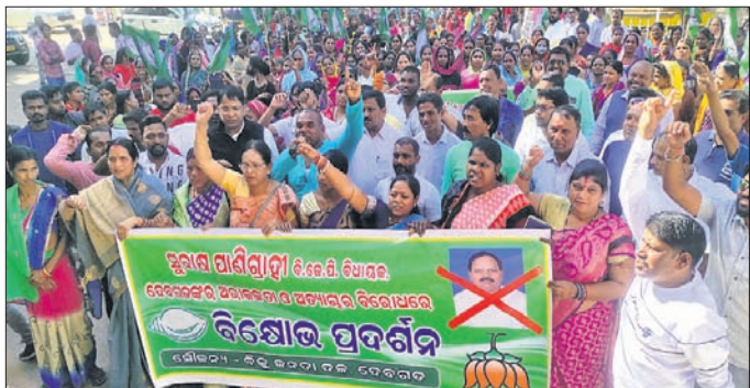
ବିଜେଡି କର୍ମୀ ଓ ମହିଳାମାନେ ବିରୋଧ ଶୋଭାଯାତ୍ରାରେ ଯାଉଛନ୍ତି।

ଦେବଗଡ଼/ଭୁବନେଶ୍ୱର (ସ୍ପେସାଲ), ୧୦।୧ (ପି.ଟି.ଏ.)