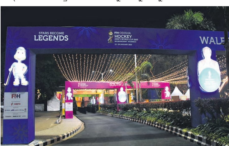
କଳିଙ୍ଗ ଷ୍ଟାଡ଼ିୟମ୍ ପ୍ରବେଶ ପଥକୁ ଆଲୋକମାଳାରେ ସଜାଯାଇଛି।