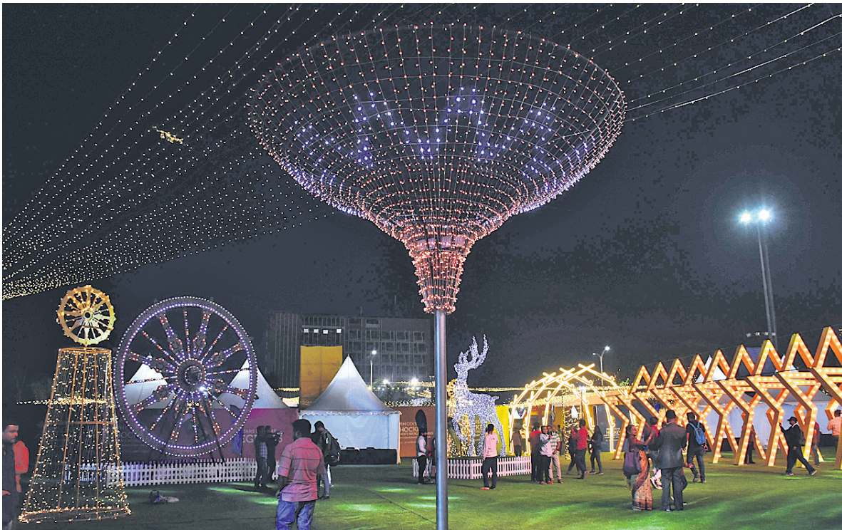
କଳିଙ୍ଗ ଷ୍ଟାଡ଼ିୟମ୍ ପରିସରରେ ବିଭିନ୍ନ ପ୍ରକାର ଆଲୋକମାଳାକୁ ଦର୍ଶକ ବୁଲି ଦେଖୁଛନ୍ତି।