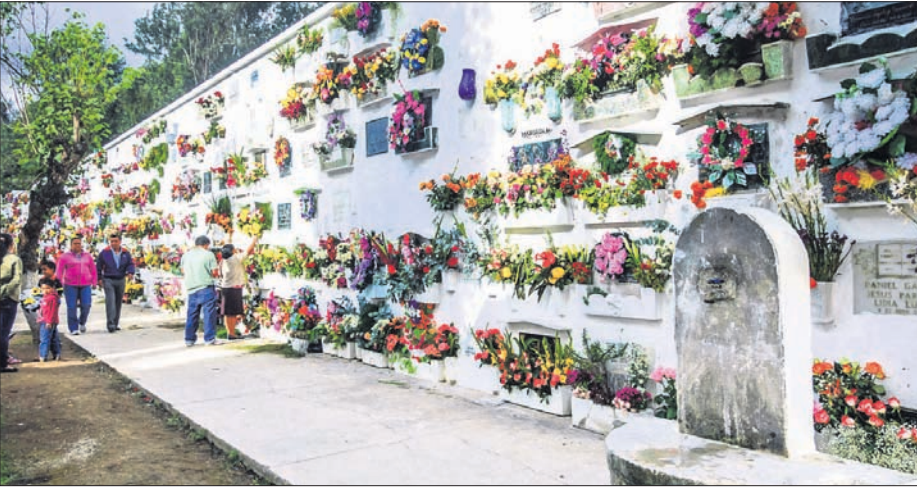
କବରର ମୃତଦେହକୁ ବାହାର କରି ସାମୁଦ୍ରିକ ସ୍ଥାନରେ କବର ଦିଆଯାଏ। ତା' ବଦଳରେ ଅନ୍ୟ ଏକ ମୃତଦେହକୁ ସେହି ସ୍ଥାନରେ କବର ଦିଆଯାଇଥାଏ। ପ୍ରକୃତରେ କବରସ୍ଥାନ କରାଯାଇ ଏପରି ନୀତି ଲାଗୁ କରାଯାଇଛି।

ଦୁନିଆର ବିଭିନ୍ନ ସ୍ଥାନରେ ଭିନ୍ନ ରୀତିନୀତି ରହିଥାଏ। ସେଥିମଧ୍ୟରୁ କିଛି ରୀତିନୀତି ବହୁତ ଅଜବ ହୋଇଥାଏ। ବିଦେଶରେ ଲୋକେ ମରିବା ପରେ ତାଙ୍କୁ କବର ଦିଆଯାଇଥାଏ। କିନ୍ତୁ ଏପରି ଏକ ସ୍ଥାନ ରହିଛି ଯେଉଁଠାରେ କବର ପାଇଁ ଭଡ଼ା ଦେବାକୁ ପଡ଼ିଥାଏ। ମଧ୍ୟଆମେରିକାର ଗୁଆଟେମାଲା ଦେଶରେ ଏପରି ରୀତିନୀତି ଦେଖିବାକୁ ମିଳେ। ସେଠାରେ ପ୍ରିୟଜନଙ୍କ ମୃତ୍ୟୁ ପରେ କବରସ୍ଥାନରେ କବର ଦିଆଯିବା ପରେ ଭଡ଼ା ଦେବାକୁ ପଡ଼ିଥାଏ। ଯଦି କେହି ଭଡ଼ା ଦେବାକୁ ସମର୍ଥ ନୁହେଁ, ତେବେ