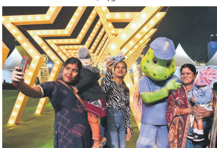
ଓଲି ମାସ୍କ୍ ସହ ମହିଳା ଓ ମୁଗଟା ସେକ୍ଟି ନେଉଛନ୍ତି।