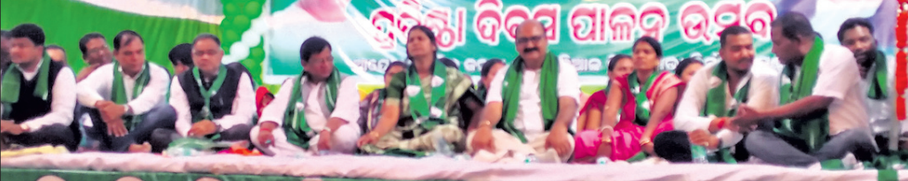
କାର୍ଯ୍ୟକ୍ରମରେ ଉପସ୍ଥିତ ଅତିଥିବର୍ଗ ।