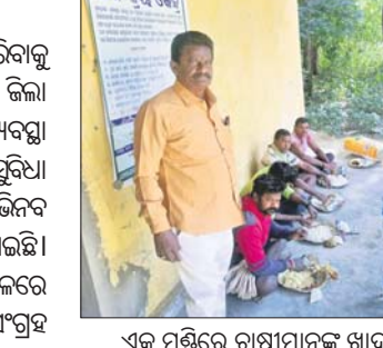
ଏକ ମଣ୍ଡିରେ ଚାଷୀମାନଙ୍କୁ ଖାଦ୍ୟ ଦିଆଯାଇଛି।