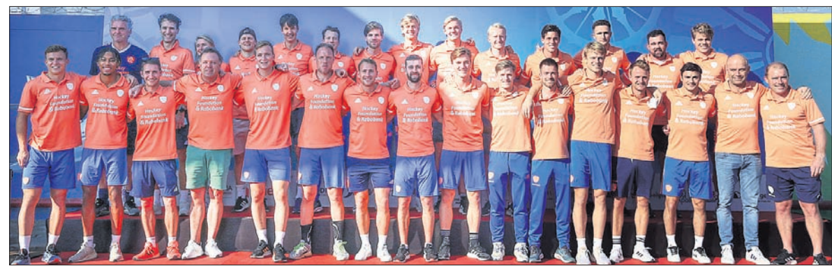
ମଙ୍ଗଳବାର ରାଉରକେଲାରେ ବିର୍ଯ୍ୟା ପୁଣ୍ଡା ହକି ଷ୍ଟାଡ଼ିୟମରେ ପହଞ୍ଚିବା ପରେ ନେଦରଲାଣ୍ଡ ଦଳ।

ହକି ବିଶ୍ୱକପ ଖେଳିବା ପାଇଁ କିଛି ଦିନ ପୂର୍ବରୁ ଭୁବନେଶ୍ୱର ଆସିଥିବା ଇଂଲଣ୍ଡ, ନେଦରଲାଣ୍ଡ ଓ ଚିଲି ଦଳ ମଙ୍ଗଳବାର ରାଉରକେଲାରେ ପହଞ୍ଚିଛନ୍ତି। ସେଠାରେ ଦଳ ଗୁଡ଼ିକର ଭବ୍ୟ ସ୍ୱାଗତ କରାଯାଇଛି। ଭାରତ ସୀମା ଥିବା ପୂର୍ବ 'ଡି'ରେ ରହିଛି ଇଂଲଣ୍ଡ। ଏହି ଗ୍ରୁପ୍‌ର ଅନ୍ୟ ୨ ଦଳ ହେଲେ ସେନ୍ ଓ ଫ୍ରେନ୍ସ। ଫ୍ରେନ୍ସ ବିପକ୍ଷରେ ଚଳିତ ମାସ ୧୩ ତାରିଖରେ ମ୍ୟାଚ ଖେଳି ଅଭିଯାନ ଆରମ୍ଭ କରିବ ଇଂଲଣ୍ଡ।