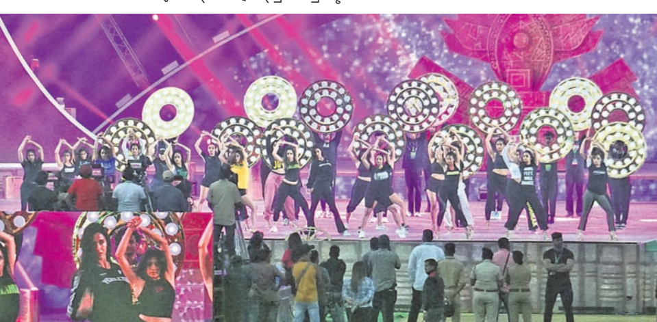
ବାରବାଟୀ ଷ୍ଟାଡ଼ିୟମରେ ବୁଧବାର ଆୟୋଜିତ ହେବାକୁ ଥିବା ସାଂସ୍କୃତିକ କାର୍ଯ୍ୟକ୍ରମ ପୂର୍ବରୁ ମଙ୍ଗଳବାର ଅଭ୍ୟାସ ଚାଲିଛି।