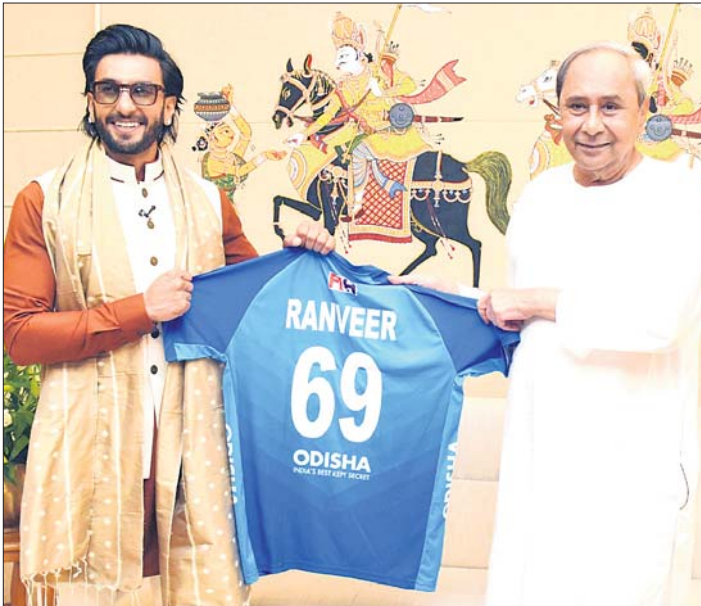
ନବୀନ ନିବାସରେ ପୁଣ୍ୟାମ୍ବୁ ନବୀନ ପଟ୍ଟନାୟକଙ୍କୁ ମଙ୍ଗଳବାର ସାକ୍ଷାତ କରିଛନ୍ତି ବଲିଉଡ୍ ଅଭିନେତା ରଣବୀର ସିଂ ଓ ଅଭିନେତ୍ରୀ ବିଶା ପଟ୍ଟନାୟ।

ଚଳିତବର୍ଷ ମୁକ୍ତ ପରୀକ୍ଷା ପରିଚାଳନାକୁ ଅଧିକ କଡ଼ାକଡ଼ି କରାଯିବ। ପରୀକ୍ଷାରେ ସ୍ୱଚ୍ଛତାକୁ ଗୁରୁତ୍ୱ ଦିଆଯାଇଥିବାବେଳେ ମୋଧାକୀ ପରୀକ୍ଷା ଯେପରି ଠିକ୍ ମାର୍କ ପାଇବେ ସେଥିଲାଗି ପ୍ରାଥମିକ ସ୍ତରରୁ ବ୍ୟବସ୍ଥା କଡ଼ାକଡ଼ି କରିବାକୁ ଉଚିତ୍ ମାଧ୍ୟମିକ ଶିକ୍ଷା ପରିଷଦ(ସିଏସ୍‌ଏସ୍) ପକ୍ଷର ପଦକ୍ଷେପ ନିଆଯାଇଛି। ଚଳିତବର୍ଷ ସମସ୍ତ ପରୀକ୍ଷା କେନ୍ଦ୍ରରେ ସିସିଟିଭି ବାଧ୍ୟତାମୂଳକ କରାଯାଇଛି। ଏବେକାଳ ଗତ ନଭେମ୍ବରରେ ସମସ୍ତ କଲେଜକୁ ଅବଗତ କରାଯାଇଥିବାବେଳେ ଡିସେମ୍ବର ୩୦ ପୂର୍ବା ସିଏସ୍‌ଏସ୍‌ର ନିୟମ ଶିକ୍ଷାନୁଷ୍ଠାନକୁ ମହଲତ ଦିଆଯାଇଥିଲା। ତେବେ ଡିସେମ୍ବର ୩୧ ପରେ କୋରୋନା ହୋଇଥିବା ଯାକ୍ଷି ରିପୋର୍ଟରେ ରାଜ୍ୟର ୪ଟି ଜୋନ୍‌ରେ ୪୨୯୮ ଉଚ୍ଚ ମାଧ୍ୟମିକ ବିଦ୍ୟାଳୟରେ ସିସିଟିଭି ନ ଥିବା ଦର୍ଶାଯାଇଥିଲା। ଏପରିକି ଅନେକ କେନ୍ଦ୍ରରେ ପୂର୍ବରୁ ଥିବା ସିସିଟିଭି ଅଟକ ହୋଇଥିବା ଜଣାପଡ଼ିଥିଲା। ତେଣୁ ଆସନ୍ତା ୧୩ତାରିଖ ପୂର୍ବା ସବୁ ଉଚ୍ଚ ମାଧ୍ୟମିକ ବିଦ୍ୟାଳୟରେ ସିସିଟିଭି ଜାରି ହେବା ସହ ଛୁଟି ସମ୍ପର୍କରେ ଜଣାଇବାକୁ ଅଧିକାରୀଙ୍କୁ ନିର୍ଦ୍ଦେଶ ଦିଆଯାଇଛି। ଏସବୁ ୧୫ତାରିଖ ପୂର୍ବା ଯେପରି ସମସ୍ତ କ୍ୟାମେରା କାର୍ଯ୍ୟକାରୀ ହେବ ସେବେକାଳ ପରିଷଦ ପକ୍ଷରୁ ତେଜାବନ୍ଦୀ ଦିଆଯାଇଛି। ଯଦି ଏପରି ନ କରନ୍ତି ତେବେ ପରିଷଦ ପକ୍ଷରୁ ଏ ସମ୍ପର୍କରେ ଗଣଶିକ୍ଷା ବିଭାଗକୁ ଅବଗତ କରାଯିବ। ସହ ସମ୍ପୂର୍ଣ୍ଣ ଉଚ୍ଚ ମାଧ୍ୟମିକ ବିଦ୍ୟାଳୟ ବିରୋଧରେ ଅଭିଯୋଗ ମଧ୍ୟ କରାଯିବ। ରାଜ୍ୟରେ ୨,୦୭୫ଟି ଉଚ୍ଚ ମାଧ୍ୟମିକ ବିଦ୍ୟାଳୟ ରହିଥିବାବେଳେ ଏଥର ୧,୯୫୦ରୁ ଅଧିକ ବିଦ୍ୟାଳୟରେ ସିସିଟିଭି କାର୍ଯ୍ୟକାରୀ କରାଯିବ। ପରୀକ୍ଷା କେନ୍ଦ୍ର, ଲାବରେଟୋରି ସମେତ ପରୀକ୍ଷା ପରିଚାଳନା ହବ୍‌ରେ କରାଯିବ।