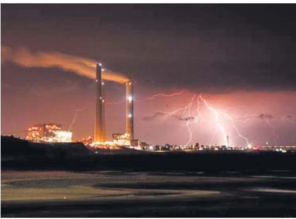
ଭୂପ୍ୟ ସାଗର ଉପରେ ବଜ୍ରପାତ ବେଳେ ଇସ୍ରାଏଲର ଉପକୂଳ ସହର ଆଣ୍ଟୋଲୋଗ୍ରେଟ୍ ରୁଷ୍ଟରୁ ପାଞ୍ଚାଳ ଷ୍ଟେସନର ଦୃଶ୍ୟ।

ଇସ୍ଲାମାବାଦ, ୧୦୧୧: ପାକିସ୍ତାନର ପୂର୍ବତନ ପ୍ରଧାନମନ୍ତ୍ରୀ ଇଫ୍ରାନ ଖାନ ଏବଂ ତାଙ୍କ ଦଳର ୪ ଜଣ ଶାଫି ନେତାଙ୍କ ବିରୋଧରେ ସେଠାର ନିର୍ବାଚନ କମିଶନ ମଙ୍ଗଳବାର କାମିନିୟୋଗ୍ୟ ଗିରଫ ପରାମର୍ଶ ଜାରି କରିଛନ୍ତି। ପାକିସ୍ତାନ ଚେନ୍ନାଇ-ର-ଇନ୍ଦିଆଫର ଏହି ନେତାମାନଙ୍କ ପାକିସ୍ତାନ ନିର୍ବାଚନ କମିଶନ ଏବଂ ମୁଖ୍ୟ ନିର୍ବାଚନ କମିଶନର ସିଦ୍ଧକର ସୁଲତାନ ରାଜାଙ୍କ ବିରୋଧରେ ମନ୍ତବ୍ୟ ଦେଇଥିବାରୁ ସେମାନଙ୍କ ବିରୋଧରେ ଅବମାନନା ମାମଲା ରୁଜୁ ହୋଇଛି। ନିଧାର ଦୁରାନ୍ତ ଅଧିକାର ୪ ସଦସ୍ୟ ବିଶିଷ୍ଟ ନିର୍ବାଚନ କମିଶନ ବେଙ୍ଗୁ ଇଫ୍ରାନ ଓ ତାଙ୍କ ସମ୍ପର୍କୀତ ସହଯୋଗୀ ଫାହ୍ମା ଚୌଧୁରୀ, ଅସାଦ ଉମରଙ୍କ ବିରୋଧରେ ପ୍ରାର୍ଥନା କାରି କରିଛି। ଗତବର୍ଷ ଅଗଷ୍ଟ ଓ ସେପ୍ଟେମ୍ବରରେ ନିର୍ବାଚନ କମିଶନ ସେମାନଙ୍କୁ ନୋଟିସ୍ କରିଥିଲା। ସେମାନେ ହାଜର ନ ହେବାରୁ ଗିରଫ ପରାମର୍ଶ ଜାରି ହୋଇଛି।