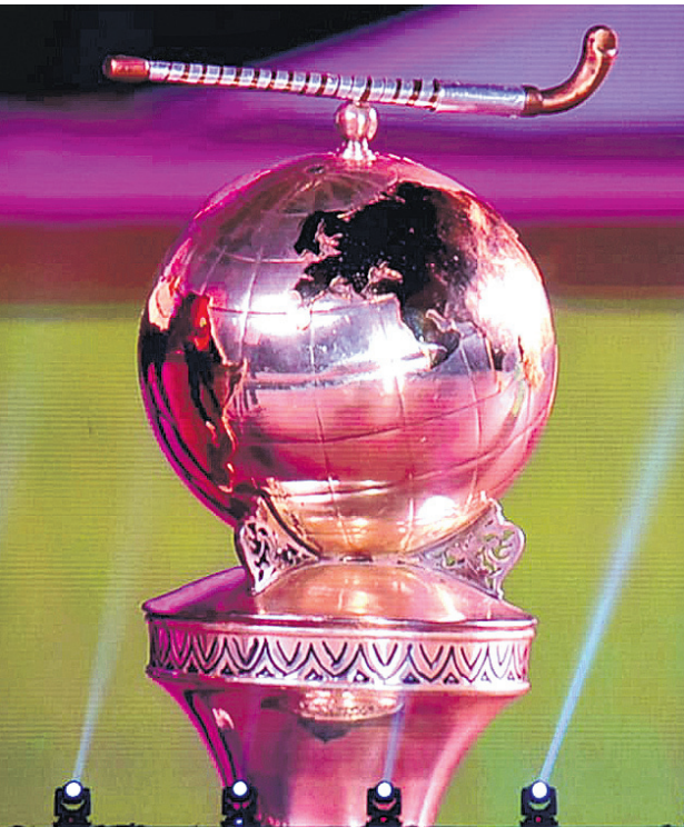
କଟକ ବାରବାଟୀ ଷ୍ଟାଡ଼ିୟମରେ ବିଶ୍ୱକପ ଟ୍ରଫିର ପ୍ରତିକୃତି।