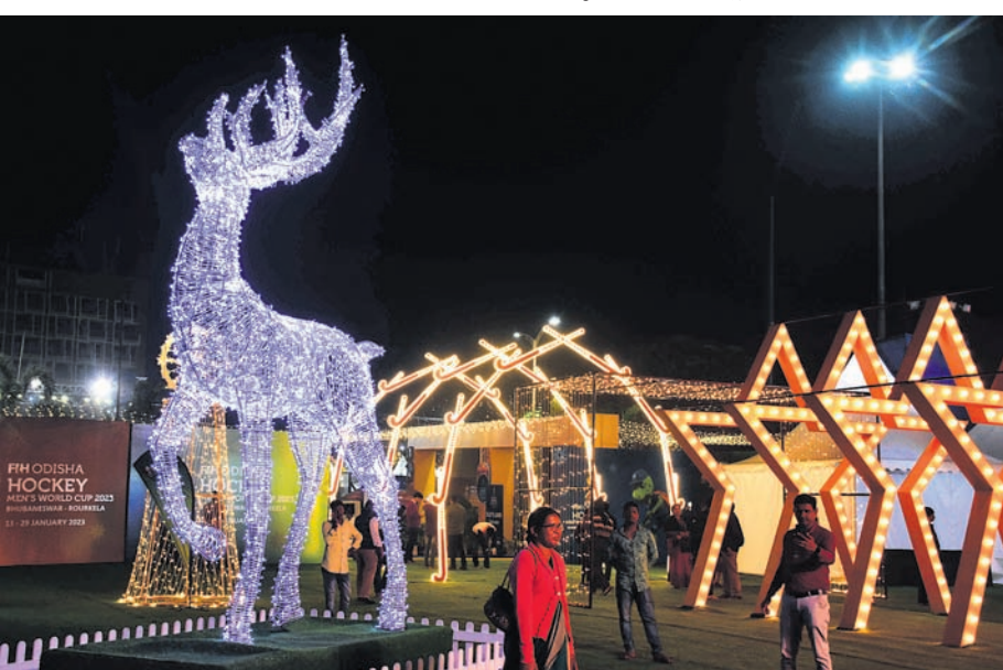
ବିଭିନ୍ନ ଆଲୋକମାଳାରେ ସଜ୍ଜିତ କଳିଙ୍ଗ ଷ୍ଟାଡ଼ିୟମ୍ ପରିସର।