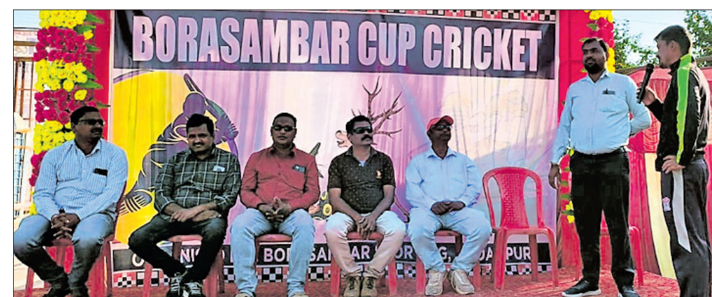
ମ୍ୟାଚ୍ ଅଫ୍ ଦି ମ୍ୟାଚ୍ ପୁରସ୍କାର ପ୍ରଦାନ କରାଯାଇଛି ।

ବରଗଡ଼ ଜିଲ୍ଲା ପଦ୍ମପୁର ରାଜବୋଡାସମ୍ବର ଖେଳପଡ଼ିଆରେ ଚାଲିଥିବା ୨୭ତମ ସର୍ବଭାରତୀୟ ବୋଡାସମ୍ବର କ୍ରିକେଟ୍ କପ୍ ମଙ୍ଗଳକାରୀ ଦିବସରେ ବରଗଡ଼ କ୍ରୀଡ଼ା ଓ ଆର୍‌ଉଆଇସିଭି ରାଉରକେଲା ମଧ୍ୟରେ ମ୍ୟାଚ୍ ଅନୁଷ୍ଠିତ ହୋଇଛି । ମ୍ୟାଚ୍ ଆରମ୍ଭରେ ପ୍ରଥମେ ବରଗଡ଼ ଦଳ ଟ୍ୟା ଝିଟିକି ରାଉରକେଲା ଦଳକୁ ବ୍ୟାଟିଂ କରିବାର ସୁଯୋଗ ଦେଇଥିଲା । ରାଉରକେଲା ଦଳ ନିର୍ଦ୍ଧାରିତ ୩୦ ଓଭରରେ ସମଗ୍ର ଉଇକେଟ ହରାଇ ୧୪୬ ରନ ସଂଗ୍ରହ କରିଥିଲା । ଜବାବରେ ବରଗଡ଼ ଦଳ ସମଗ୍ର ଉଇକେଟ ହରାଇ ମାତ୍ର ୭୪ ରନ ସଂଗ୍ରହ କରି ରାଉରକେଲା ଦଳକୁ ବିଜୟୀ ହୋଇଥିଲା । ଫଳରେ ଗ୍ରୁପ୍ 'ଏ'ରେ ରାଉରକେଲା ଦଳ ସେମିଫାଇନାଲରେ