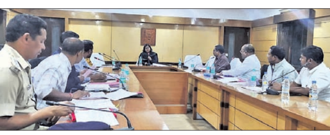
ଜିଲା ସ୍ତରୀୟ ସଡ଼କ ସୁରକ୍ଷା କମିଟି ବୈଠକରେ ଉପସ୍ଥିତ ଅଧିକାରୀ ।