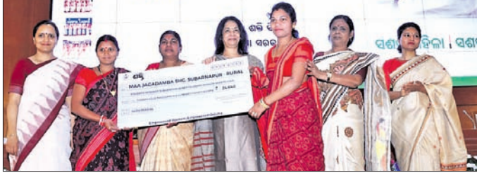
ଏସ୍‌ଏଚ୍‌ଡି କର୍ମକର୍ତ୍ତା ମିଶନ ଶକ୍ତି ବିଭାଗ ମନ୍ତ୍ରୀଙ୍କୁ ଚେକ୍ ଗ୍ରହଣ କରୁଛନ୍ତି ।

ଓଡ଼ିଶାରେ ମିଶନ ଶକ୍ତି ଗୋଷ୍ଠୀକୁ ସୁଧ ରିହାତି କାର୍ଯ୍ୟକ୍ରମରେ ସୁବର୍ଣ୍ଣପୁର ଜିଲ୍ଲାର ୩୬୫୦ ମିଶନ ଶକ୍ତି ଗ୍ରୁପ୍ ଉପକୃତ ହୋଇଛି । ସେମାନଙ୍କୁ ବ୍ୟାଙ୍କ୍‌ଗୁଡ଼ାକୁ ସିଧାସଳଖ ଏହି ସୁଧ ରିହାତି ପ୍ରଦାନ କରାଯାଇଛି । ୨୦୨୨ ଅପ୍ରେଲରୁ ସେପ୍ଟେମ୍ବର ମଧ୍ୟରେ ବିଭିନ୍ନ ଧର୍ମାତ୍ମକ କାର୍ଯ୍ୟ କରିବା ପାଇଁ ମହିଳାମାନେ ଯେଉଁ ରାଶି ନେଇଥିଲେ ସେହି ରାଶିର ସୁଧ ପରିମାଣ ପ୍ରଦାନ କରାଯାଇଛି । ୬ ମାସରେ ସରକାର ଜିଲ୍ଲାର ୩୫୫୦ ମିଶନ ଶକ୍ତି ଗ୍ରୁପ୍‌ର ବ୍ୟାଙ୍କ୍ ଖାତାକୁ ୧୫୦ଟି ଟାକ୍‌ସ ୯୧୫୦୦ରୁ ୧୭୧୫୦୦ ଟଙ୍କାର ସୁଧ ରିହାତି ପ୍ରଦାନ କରିଛନ୍ତି । ମୁଖ୍ୟମନ୍ତ୍ରୀ ନବୀନ ପଟ୍ଟନାୟକ ଗ୍ରୁପ୍‌କୁ ଚେକ୍ ପ୍ରଦାନ କରି କାର୍ଯ୍ୟକ୍ରମର