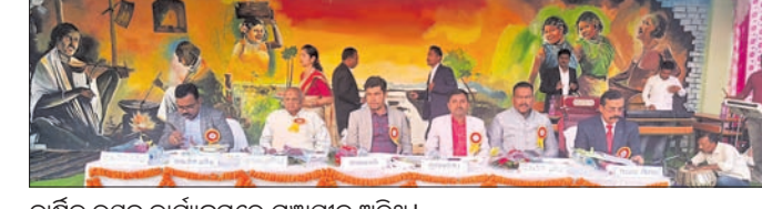
ବାର୍ଷିକ ଉତ୍ସବ କାର୍ଯ୍ୟକ୍ରମରେ ମଞ୍ଚାସୀନ ଅତିଥି ।