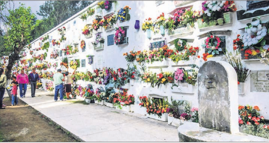
କବରରୁ ମୃତଦେହକୁ ବାହାର କରି ସାମୁଦ୍ରିକ ସ୍ଥାନରେ କବର ଦିଆଯାଏ। ତା' ବଦଳରେ ଅନ୍ୟ ଏକ ମୃତଦେହକୁ ସେହି ସ୍ଥାନରେ କବର ଦିଆଯାଇଥାଏ। ପ୍ରକୃତରେ କବରସ୍ଥାନ କରାଯାଇ ଏପରି ନୀତି ଲାଗୁ କରାଯାଇଛି।

ଦୁନିଆର ବିଭିନ୍ନ ସ୍ଥାନରେ ଭିନ୍ନ ରୀତିନୀତି ରହିଥାଏ। ସେଥିମଧ୍ୟରୁ କିଛି ରୀତିନୀତି ବହୁତ ଅଜବ ହୋଇଥାଏ। ବିଦେଶରେ ଲୋକେ ମରିବା ପରେ ତାଙ୍କୁ କବର ଦିଆଯାଇଥାଏ। କିନ୍ତୁ ଏପରି ଏକ ସ୍ଥାନ ରହିଛି ଯେଉଁଠାରେ କବର ପାଇଁ ଭଡ଼ା ଦେବାକୁ ପଡ଼ିଥାଏ। ମଧ୍ୟଆମେରିକାର ଗୁଆଟେମାଲା ଦେଶରେ ଏପରି ରୀତିନୀତି ଦେଖିବାକୁ ମିଳେ। ସେଠାରେ ପ୍ରିୟଜନଙ୍କ ମୃତ୍ୟୁ ପରେ କବରସ୍ଥାନରେ କବର ଦିଆଯିବା ପରେ ଭଡ଼ା ଦେବାକୁ ପଡ଼ିଥାଏ। ଯଦି କେହି ଭଡ଼ା ଦେବାକୁ ସମର୍ଥ ନୁହେଁ, ତେବେ