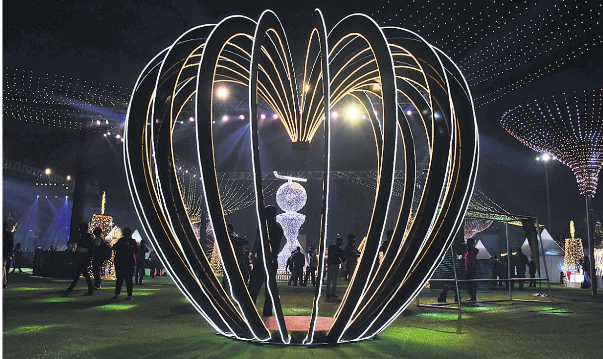
ପୁରୁଷ ହକି ବିଶ୍ୱକପ୍ ଅବସରରେ ଭୁବନେଶ୍ୱର କଳିଙ୍ଗ ଷ୍ଟାଡ଼ିୟମ ପରିସରରେ ମଙ୍ଗଳବାର ଖୋଲିଥିବା 'ଓଲି ରାଜକ' । (ଅଧିକ ଫଟୋ: ପୃଷ୍ଠା-୨)