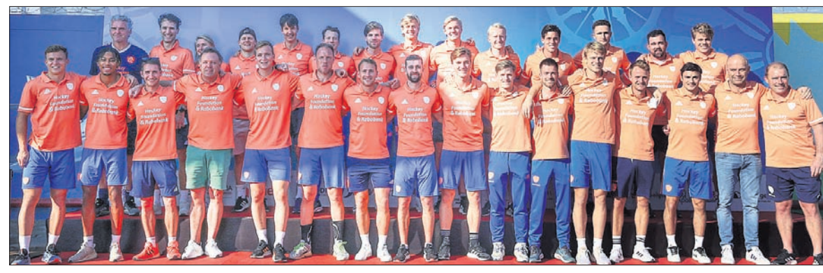
ମଙ୍ଗଳବାର ରାଉରକେଲାରେ ବିର୍ସା ପୁଷ୍ଟା ହକି ଷ୍ଟାଡ଼ିୟମରେ ପହଞ୍ଚିବା ପରେ ନେଦରଲାଣ୍ଡ ଦଳ ।