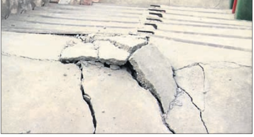
କର୍ଣ୍ଣପ୍ରୟାଗରେ ଏକ ଚଟାଣ ଫାଟି ଯାଇଛି।