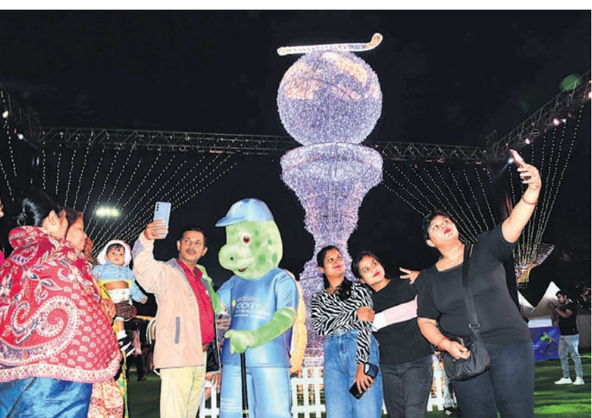
ଓଲି ସହ ସେକ୍ଟ୍ ନେଇ।