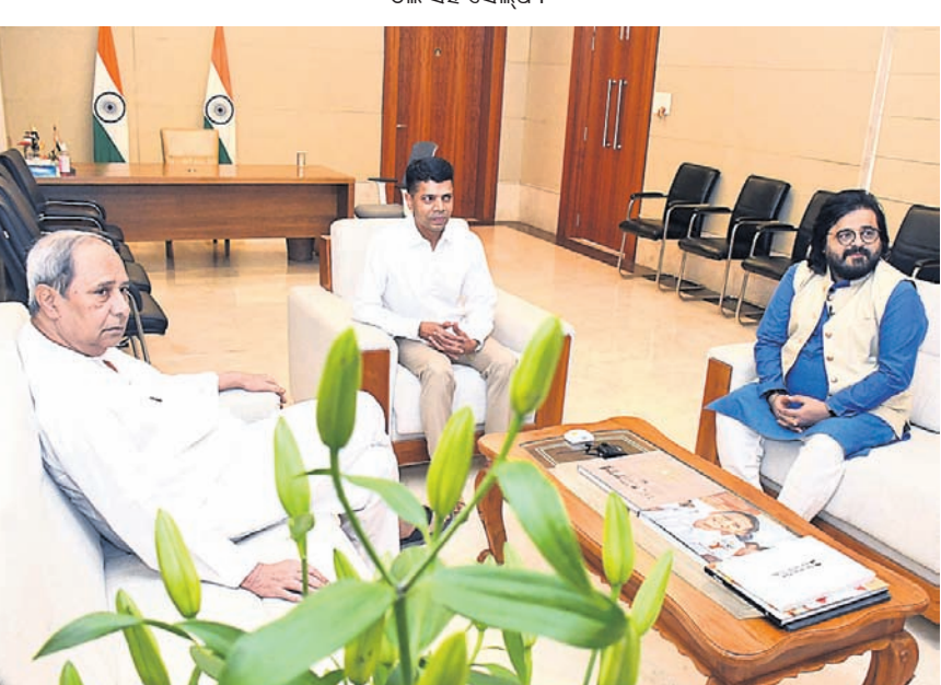
ନବୀନ ନିବାସରେ ପୁଖ୍ୟମନ୍ତ୍ରୀ ନବୀନ ପଟ୍ଟନାୟକଙ୍କୁ ଭେଟୁଛନ୍ତି ପୁଲିକ୍ କମ୍ପୋଜର ପ୍ରୀତମ ଚକ୍ରବର୍ତ୍ତୀ।