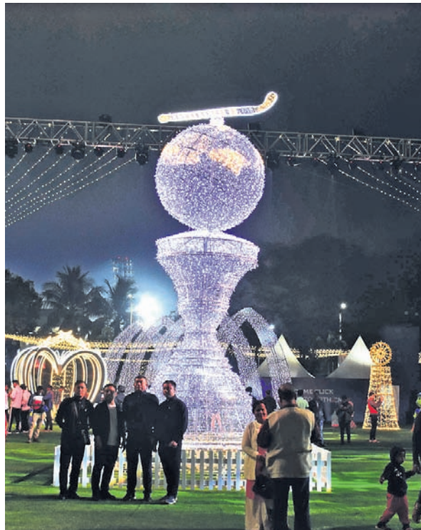
ଆଲୋକରେ ସଜ୍ଜିତ ବିଶ୍ୱକପ ଟ୍ରଫି ନିକଟରେ ଲୋକେ ଫଟୋ ଉଠାଉଛନ୍ତି।