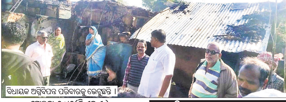
ବିଧାୟକ ଅଗ୍ନିବିପଦ ପରିବାରକୁ ଭେଟୁଛନ୍ତି

ମାଲକାନଗିରି ଜିଲ୍ଲା ଏମ୍ପଲି ୭୯ ଥାନା ଅନ୍ତର୍ଗତ ୧୪୨ ବାଗାଲିୟନରେ ମଙ୍ଗଳବାର ଅଭାବନା ଘଟଣା ଘଟିଛି।