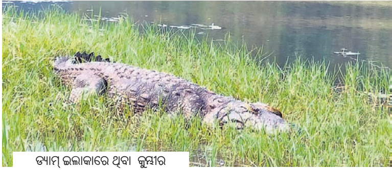
ତ୍ୟାଗ ଲଳାକାରେ ଥିବା କୁମ୍ଭୀର

ଗଞ୍ଜାମ-ଗଜପତି ଜିଲ୍ଲା ସୀମାନ୍ତ ଘୋଡ଼ାହାଡ଼ ତ୍ୟାଗରେ ଗତ ୩ ଦିନ ଧରି ଚାଲିଥିବା କୁମ୍ଭୀର ଗଣନା ମଙ୍ଗଳବାର ଶେଷ ହୋଇଛି।