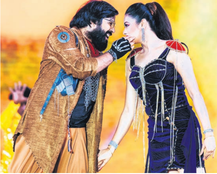
ଓଲିଭଲ୍ କଳାକାର ସଦ୍ୟସାଗା ଓ ଅର୍ଚ୍ଚିତାଙ୍କ ନୃତ୍ୟ ପରିବେଷଣ ।