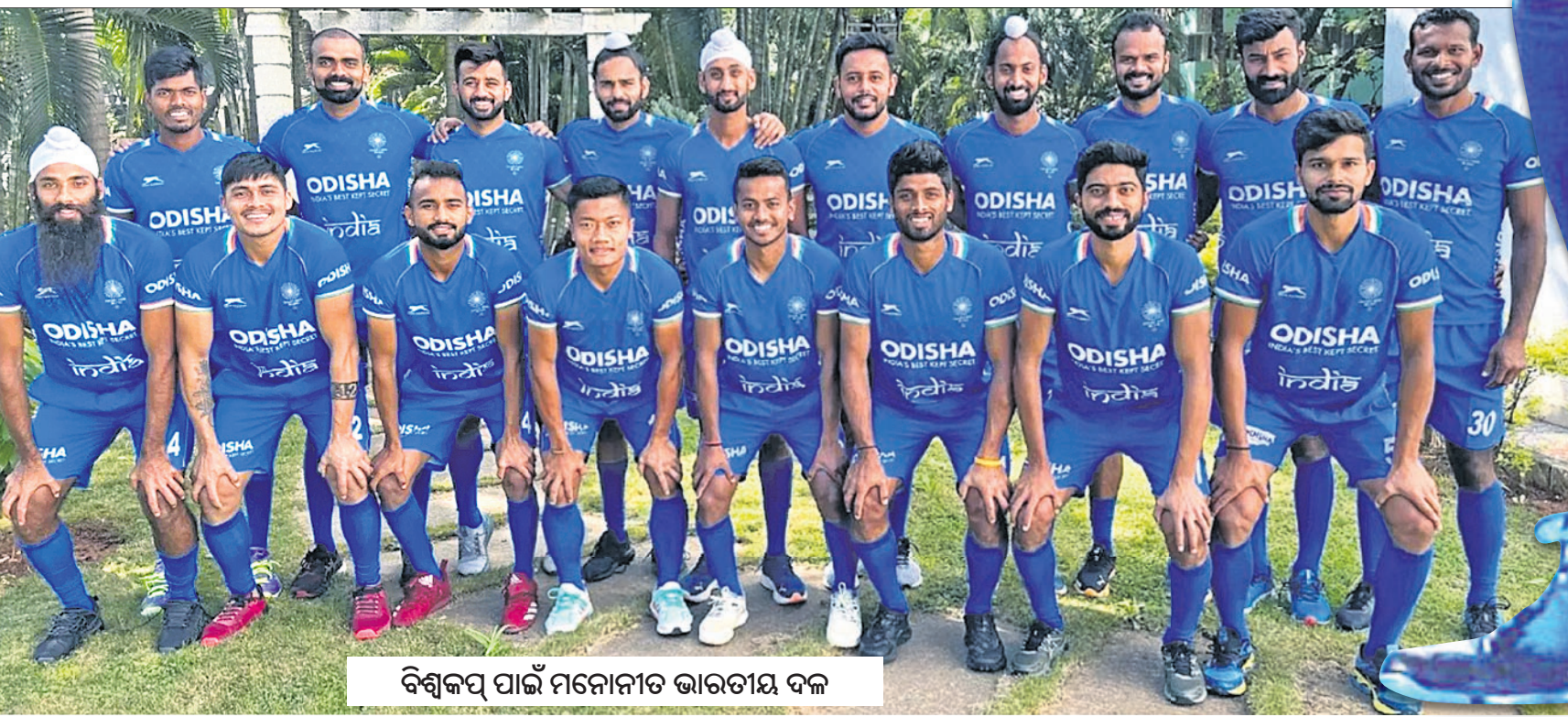
ବିଶ୍ୱକପ ପାଇଁ ମନୋନୀତ ଭାରତୀୟ ଦଳ