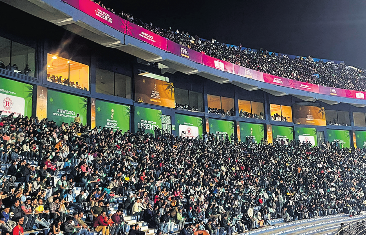
ଉଦ୍ଘାଟନା କାର୍ଯ୍ୟକ୍ରମ ଉପରେ କରିବାକୁ ଭରପୁର ବାରବାଟୀ ଷ୍ଟାଡ଼ିୟମ ।