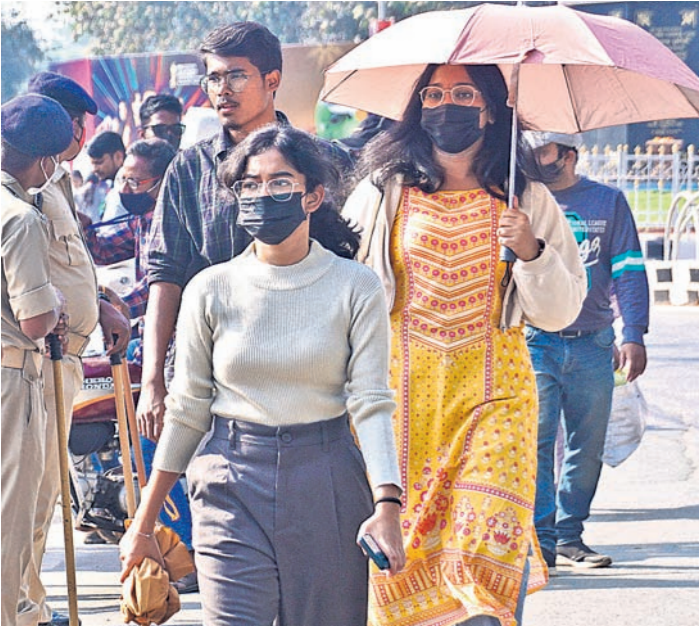
ଦର୍ଶକ ଷ୍ଟାଡ଼ିୟମକୁ ପ୍ରବେଶ କରୁଛନ୍ତି ।