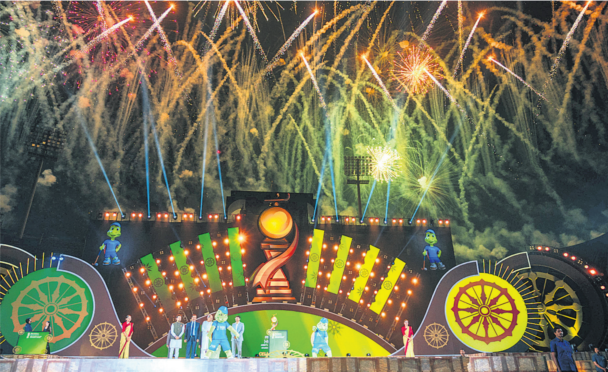
ବାରବାଟୀ ଷ୍ଟାଡ଼ିୟମରେ ହକି ଦିଶ୍ୱକାସ ମହାକୁସ୍‌ର ସଂସ୍କୃତିକ କାର୍ଯ୍ୟକ୍ରମକୁ ମୁଖ୍ୟମନ୍ତ୍ରୀ ନବୀନ ପଟ୍ଟନାୟକ ଉଦ୍ଘାଟନା କରୁଛନ୍ତି, ନିକଟରେ ଅଛନ୍ତି କେନ୍ଦ୍ର କ୍ରୀଡ଼ାମନ୍ତ୍ରୀ ଅନୁରାଗ ସିଂ ଠାକୁର ଓ ଅନ୍ତର୍ଜାତୀୟ ହକି ମହାସଂଘର ସଭାପତି ଚାୟାବ ଇକ୍ରାମ ।