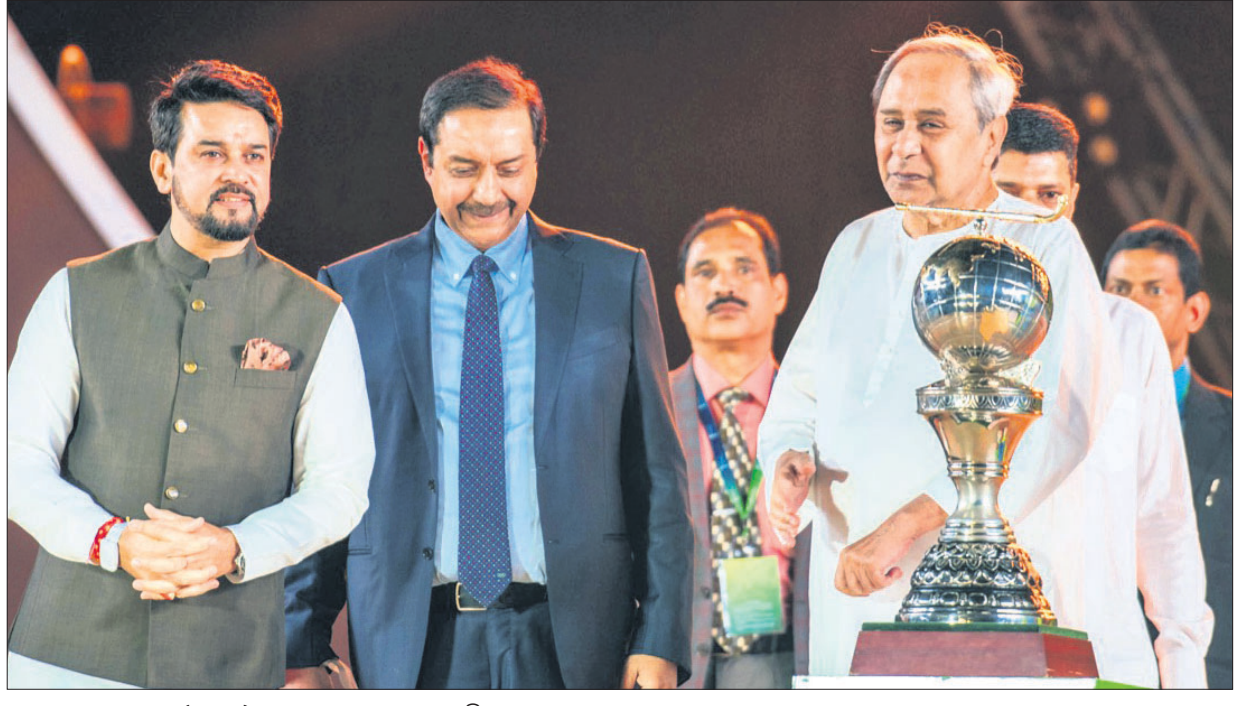
ଉଦ୍‌ଘାଟନା ଉତ୍ସବରେ (ବାମକୁ) କେନ୍ଦ୍ର କ୍ରୀଡ଼ାମନ୍ତ୍ରୀ ଅନୁରାଗ ସିଂ ଠାକୁର, ଏଫ୍‌ଆଇଏସ୍ ଚେୟାରମ୍ୟାନ ତଥା ବିଜ୍ଞାନ ଏବଂ ମୁଖ୍ୟମନ୍ତ୍ରୀ ନବୀନ ପଟ୍ଟନାୟକ।