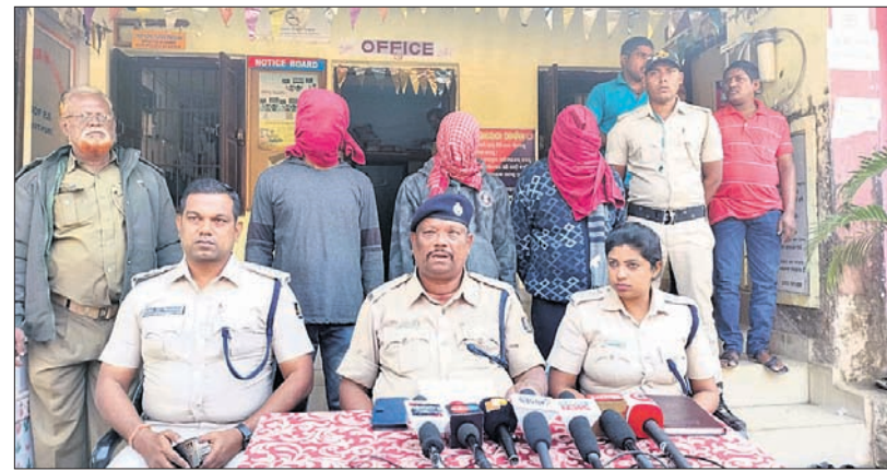
ଖବରଦାତା ସମ୍ମିଳନୀରେ ଯୋଗ୍ୟ ଅଧିକାରୀ ଗିରଫ ଅଭିଯୁକ୍ତଙ୍କ ସମ୍ପର୍କରେ ସୂଚନା ଦେଉଛନ୍ତି।