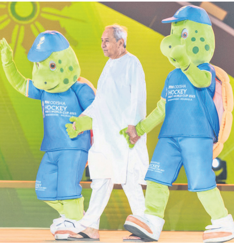
ମାଷ୍ଟର ଓଲିଭଲ୍ ଧରି ମୁଖ୍ୟମନ୍ତ୍ରୀ ନବୀନ ପଟ୍ଟନାୟକ ମଞ୍ଚକୁ ପ୍ରବେଶ କରୁଛନ୍ତି ।