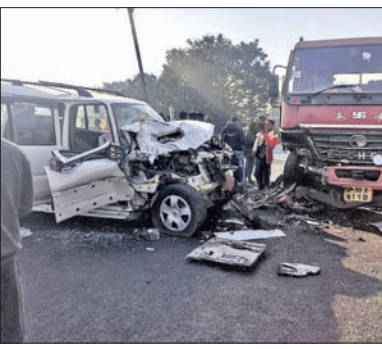
ଲୋଇସିଂହା, ୧୧।୧ (ଡି.ଏନ୍.ଏ.)

ବଲାଙ୍ଗୀର-ବରଗଡ଼ ୨୬ ନଂ. ଜାତୀୟ ରାଜପଥର ଲୋଇସିଂହା ଥାନା ଅନ୍ତର୍ଗତ ବୁର୍ତ୍ତା ଛକରେ ରୁଧିବାର ସକାଳେ ଏକ ଦୁର୍ଘଟଣା ଘଟିଛି। ରାସ୍ତାରେ ଛିଡ଼ା ହୋଇଥିବା ଟ୍ରେଲରରେ ଏକ ଷ୍ଟର୍ପିଓ ସାମ୍ମୁଖ୍ୟରେ ପିଟି ହୋଇଥିଲା।