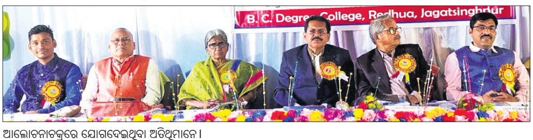
ଆଲୋଚନାଚକ୍ରରେ ଯୋଗଦେଇଥିବା ଅତିଥିମାନେ

ଏରସମା-କୁଜଙ୍ଗ ରାସ୍ତା ବିଶର ମହାକ୍ରିକା ନାମରେ ନାମିତ କରାଯାଉ