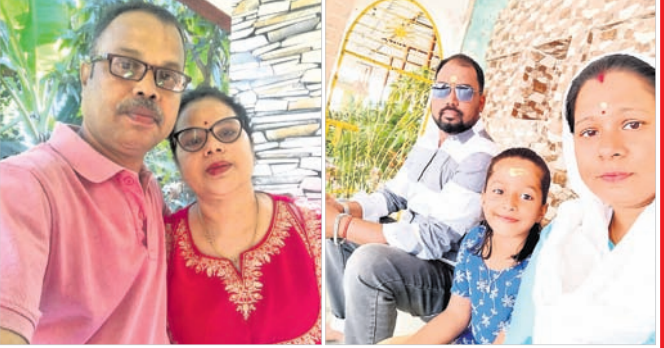
@ ଅସି ଓ @ ପ୍ରିୟନ୍ତ