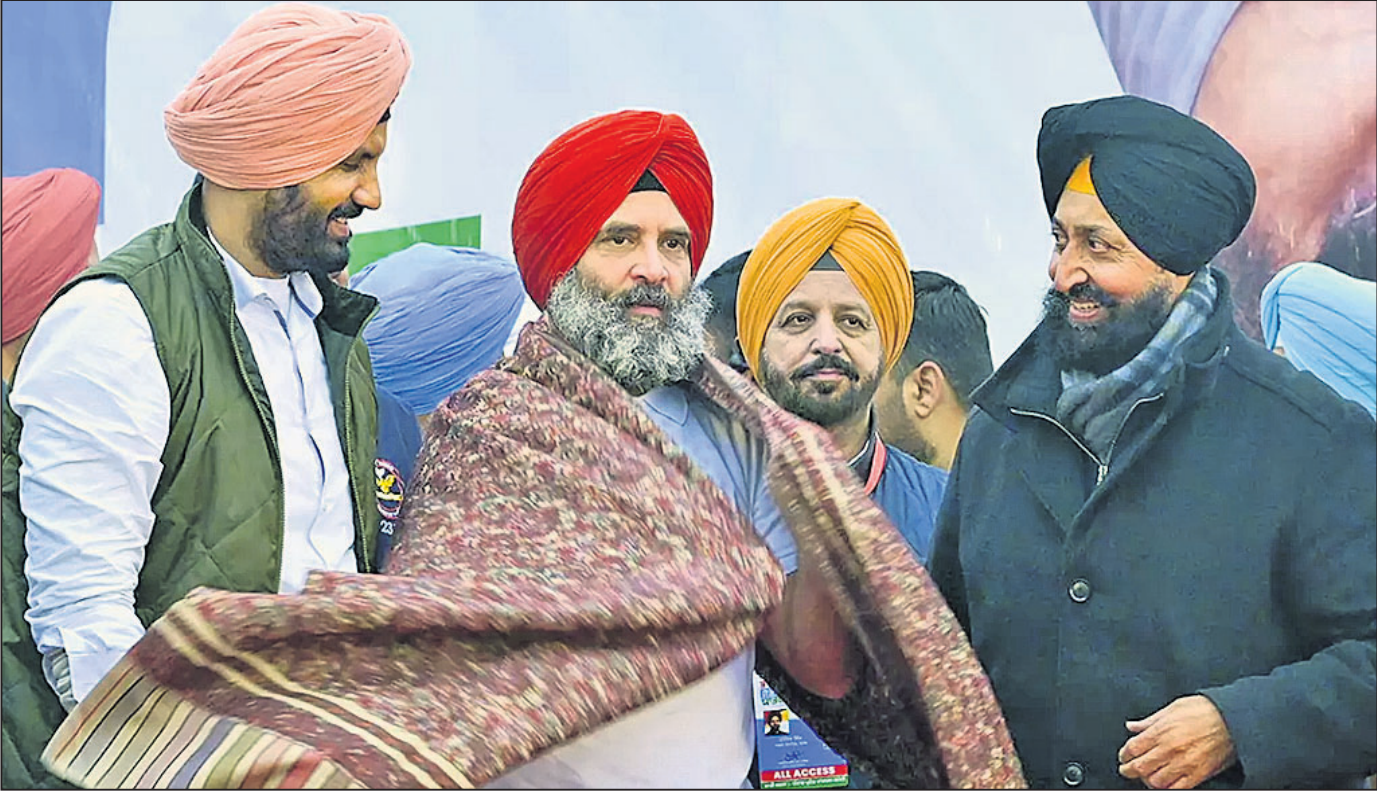
ଭାରତଯୋଡ଼ା ଯାତ୍ରା ଅବସରରେ ରୁଧିର ପଞ୍ଜାବର ଫଟୋଗ୍ରାଫି ସାହିବରେ କଂଗ୍ରେସ ନେତା ରାହୁଲ ଗାନ୍ଧୀ