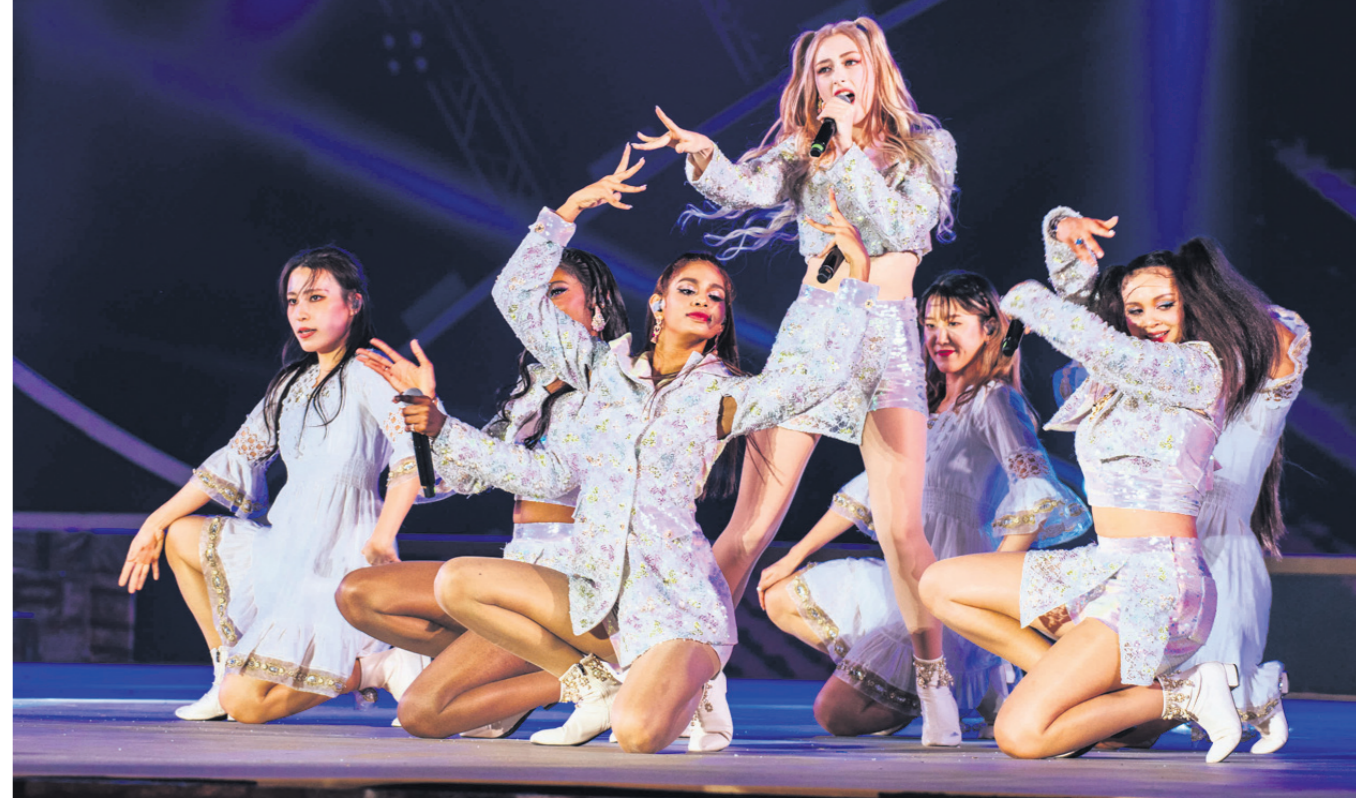
କୋରିଆର ସ୍ୱାନ୍ ସାନ୍ ଟ୍ରପ୍ ଦ୍ୱାରା ନୃତ୍ୟ ଓ ସଂଗୀତ ପରିବେଷଣ।