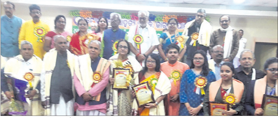
ରାଜ୍ୟପାଳଙ୍କ ଉପସ୍ଥିତିରେ ସମ୍ବର୍ଦ୍ଧିତ ପ୍ରତିଭା।