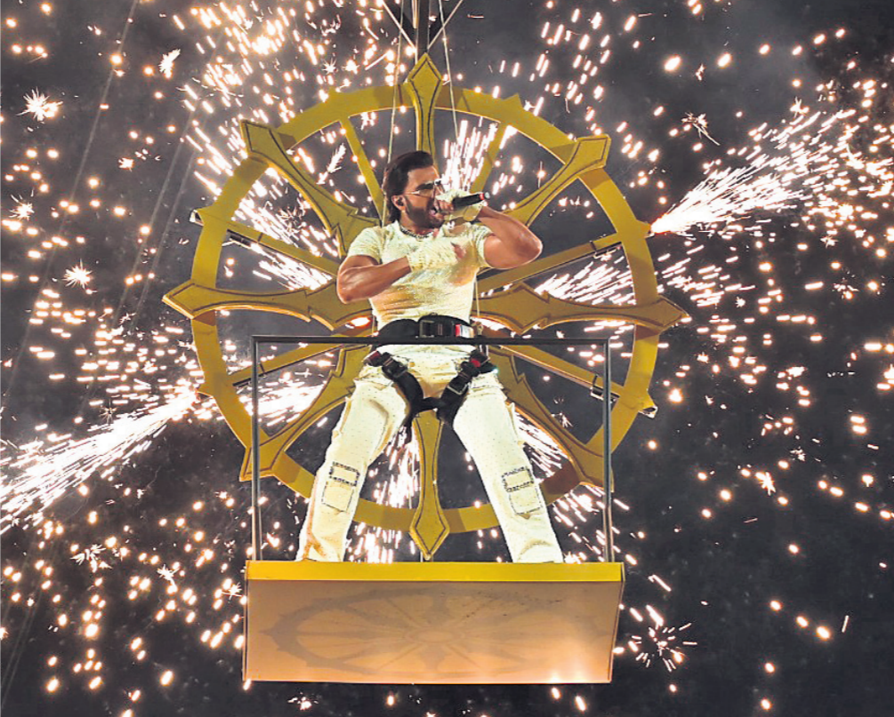
ବଲିଭଲ୍ କଳାକାର ରଣବୀର ସିଂ ନିଆରା ଶୈଳୀରେ ଷ୍ଟାଡ଼ିୟମକୁ ପ୍ରବେଶ କରୁଛନ୍ତି।