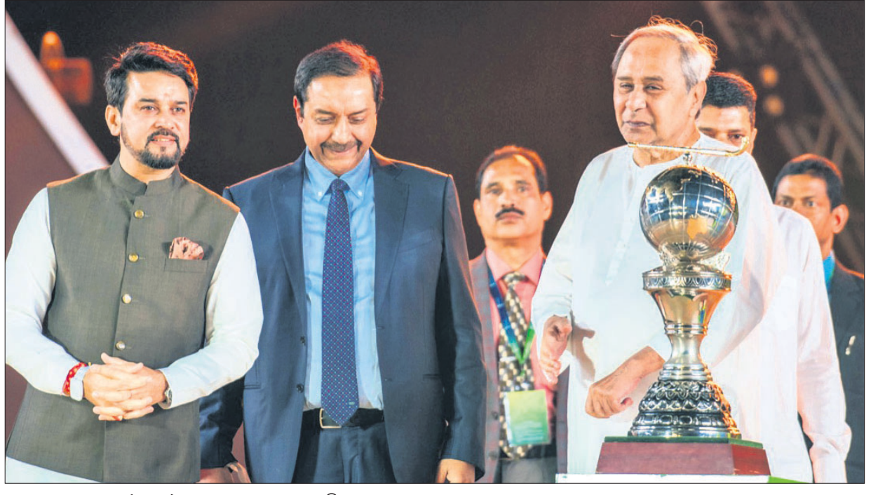
ଉଦ୍‌ଘାଟନା ଉତ୍ସବରେ (ବାମକୁ) କେନ୍ଦ୍ର କ୍ରୀଡ଼ାମନ୍ତ୍ରୀ ଅନୁରାଗ ସିଂ ଠାକୁର, ଏଫ୍‌ଆଇଏସ୍ ଚେୟାରମ୍ୟାନ ତଥା ବିଜ୍ଞାନ ଏବଂ ପୁଷ୍ପାଞ୍ଚଳୀ ନବୀନ ପଟ୍ଟନାୟକ।

କଟକ ଅଫିସ୍/ଭୁବନେଶ୍ୱର ୧୦।୧ (ବୁଧବେଳା) 'ଜୟ ଜଗନ୍ନାଥ, ଜୟ ଜଗନ୍ନାଥ। ମୋର ପ୍ରିୟ ଭାଇ ଓ ଭଉଣୀମାନେ। ଆପଣମାନଙ୍କୁ ସମସ୍ତଙ୍କୁ ମୋର ନମସ୍କାର। ଆପଣମାନଙ୍କୁ ମୋର ନୂଆ ବର୍ଷର ଅଭିନନ୍ଦନ। କେନ୍ଦ୍ରମନ୍ତ୍ରୀ ଅନୁରାଗ ଠାକୁର, ଇନ୍ଦ୍ରନିଧିଶିଳ୍ପୀ ହିନ୍ଦୀ ଫେଡେରେଶନ ଚେୟାରମ୍ୟାନ, ଅତିଥିମନ୍ତ୍ରୀ ପ୍ରତିଭା ଓ ଖେଳାଳିମାନଙ୍କୁ ଓଡ଼ିଶାକୁ ଅଭିନନ୍ଦନ। ବହୁ ପୂର୍ବରୁ ଓଡ଼ିଶା ସହାର ଆତିଥ୍ୟ ପାଇଁ ପରିଚିତ। ଏଠାକୁ ଆସିଥିବା ଦର୍ଶକମାନେ ଓଡ଼ିଶାର ଏହି ସ୍ଥଳ ଅନୁଭୂତିକୁ ନିଜ ଘରକୁ ନେଇଯିବେ ବୋଲି ମୋର ଆଶା। ସମସ୍ତ ପ୍ରକାର ସହଯୋଗ ପାଇଁ ମୁଁ ପ୍ରଧାନମନ୍ତ୍ରୀ ଓ କେନ୍ଦ୍ର ସରକାରଙ୍କୁ ଧନ୍ୟବାଦ ଜଣାଉଛି। ଓଡ଼ିଶାରେ ବିଶ୍ୱକପ୍ ପୁରୁଷ ହିନ୍ଦୀ ବିଶ୍ୱକପ୍ ହେଉଛି। ଆପଣମାନେ ଖୁସି ତା ଓଡ଼ିଶାର କଟକରେ ଉଦ୍‌ଘାଟନା ଉତ୍ସବ ହେଉଛି। ଆପଣମାନେ ଖୁସି ତା ମୁଁ ବି ବହୁତ ଖୁସି। ଧନ୍ୟବାଦ। ନମସ୍କାର। ବନ୍ଦେ ଭକ୍ତକ ଜନନୀ। ଜୟହିନ୍ଦ।' କଟକ ବାରବାଟୀ ସ୍ତ୍ରୀମାନଙ୍କ ଦ୍ୱାରା ପରିଚାଳିତ ହିନ୍ଦୀ ବିଶ୍ୱକପ୍ ଉଦ୍‌ଘାଟନା ସମାରୋହର ଉଦ୍‌ଘାଟନା ତଥା ପୁଷ୍ପାଞ୍ଚଳି ପୁଷ୍ପାଞ୍ଚଳୀ ନବୀନ ପଟ୍ଟନାୟକ ଏକାଧିକ ବସ୍ତ୍ରବଦ୍ଧ ହୋଇଛନ୍ତି। 'ଆପଣମାନେ ଖୁସି ତା' ବୋଲି ପୁଷ୍ପାଞ୍ଚଳୀ କହିବା ବେଳେ ସ୍ତ୍ରୀମାନଙ୍କ ପ୍ରକାଶ ହୋଇଥିଲା।