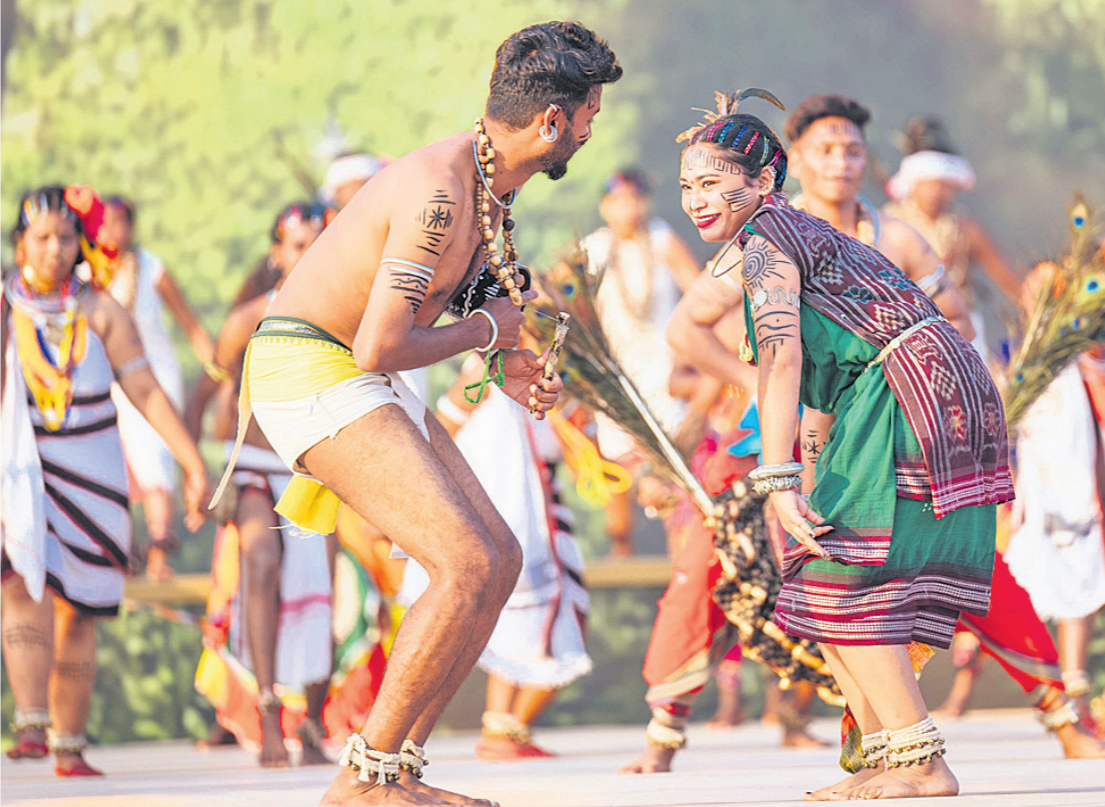
ଓଡ଼ିଶା କଳାକାରଙ୍କ ଦ୍ୱାରା ପାରମ୍ପରିକ ନୃତ୍ୟ ପରିବେଷଣ।