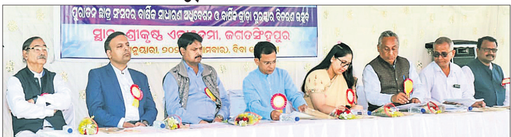
ଶ୍ରୀକୃଷ୍ଣ ଏକାଡେମୀର ୮୯ତ ପ୍ରତିଷ୍ଠା ଦିବସରେ ଉପସ୍ଥିତ ଅତିଥିମାନେ।