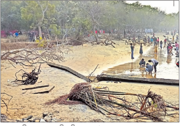
ତରରେ ପାଣି ମାଡ଼ରେ ଉପୁଡ଼ି ପଡ଼ିଥିବା ଗଛ।