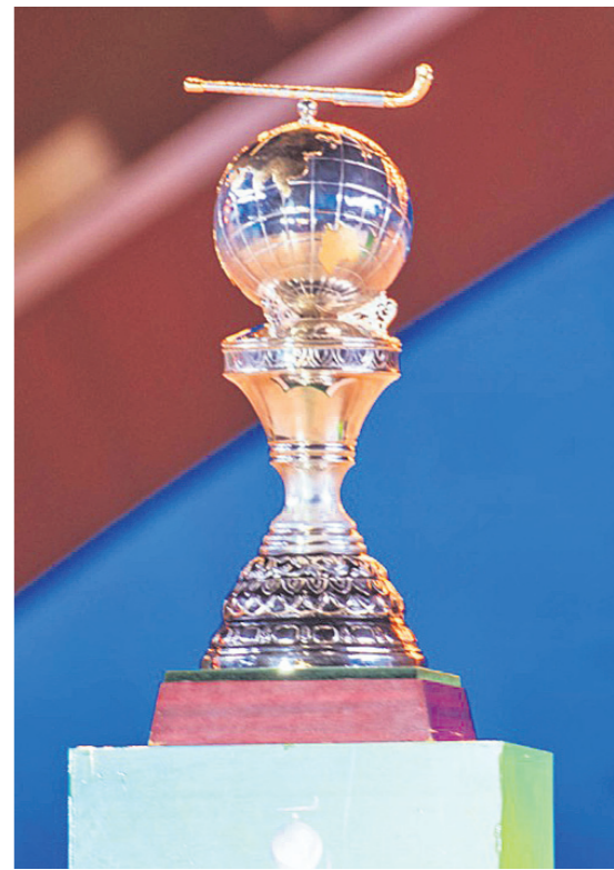
ଉଦ୍ଘାଟନା ସମାରୋହରେ ଟ୍ରଫି ପ୍ରଦର୍ଶିତ ହେଉଛି।