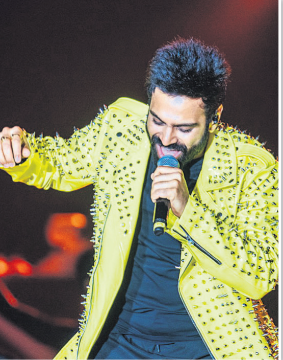
କଳାକାରଙ୍କ ଦ୍ୱାରା ସଂଗୀତ ପରିବେଷଣ।