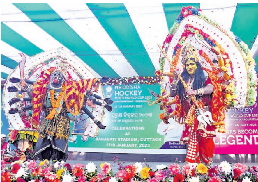
କଟକ ବାଲିଯାତ୍ରା ତଳ ପଡ଼ିଆରେ ଆୟୋଜିତ ସାଂସ୍କୃତିକ କାର୍ଯ୍ୟକ୍ରମ ।