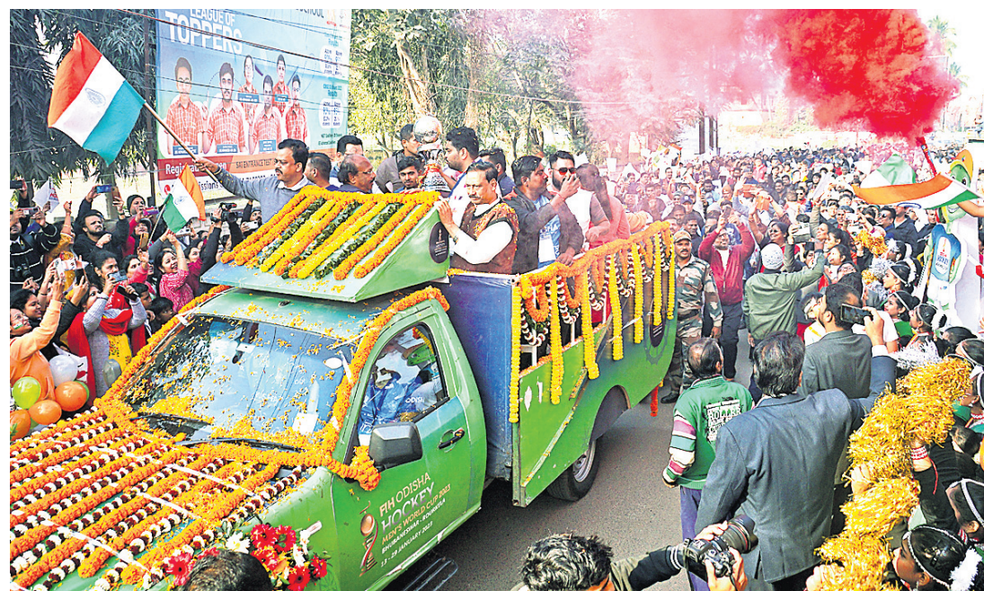
ବିଶ୍ୱକପ ଝୁନି ଟ୍ରଫିକୁ କଟକ ସହର ପରିକ୍ରମା କରାଯାଉଛି ।