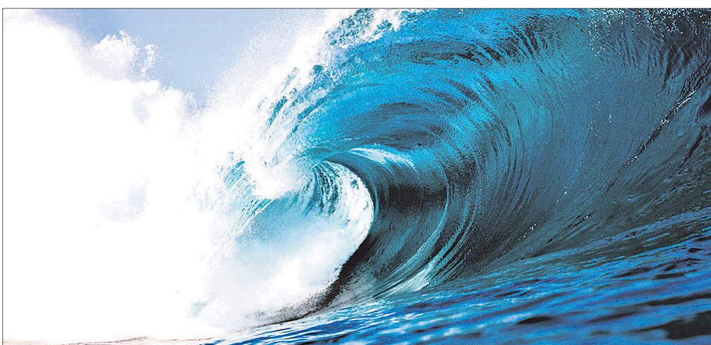
ଭାରତୀୟ ସମୁଦ୍ର ପ୍ରଶାସନ