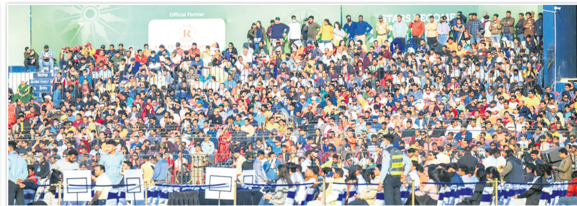
ଉଦ୍ଘାଟନା କାର୍ଯ୍ୟକ୍ରମ ଉପରେ କର୍ମଚାରୀଙ୍କୁ ଭରପୁର ବାରବାଟୀ ଷ୍ଟାଡ଼ିୟମ ।