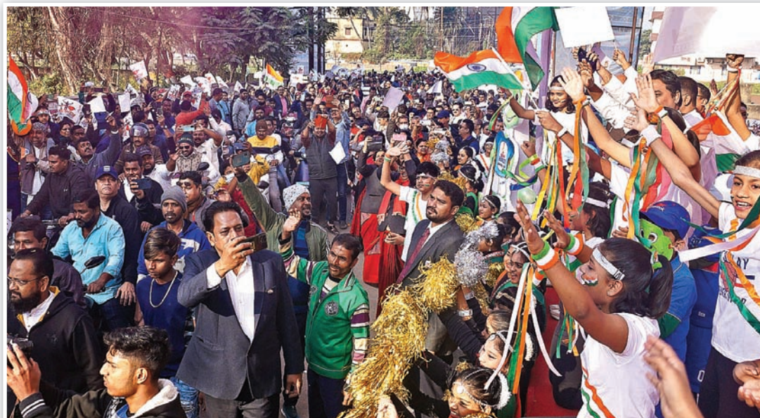
ଟ୍ରଫି ସାଗତ ଅବସରରେ ଭବ୍ୟ ମାହୋଳ ।