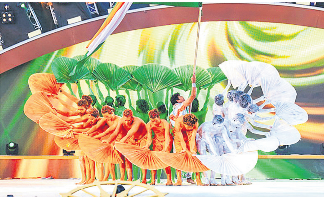
ପ୍ରିତ୍ ମ୍ୟାକ୍ ଗୁପ୍ତା ଦ୍ୱାରା ପରିବେଷିତ ସାଂସ୍କୃତିକ କାର୍ଯ୍ୟକ୍ରମ ।