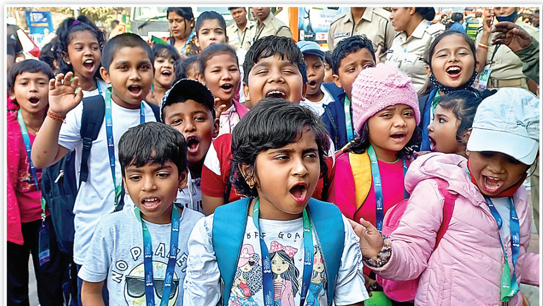
ଛୁନି ପିଲାମାନେ ଟ୍ରଫିକୁ ସାଗତ କରିବା ଅବସରରେ ।