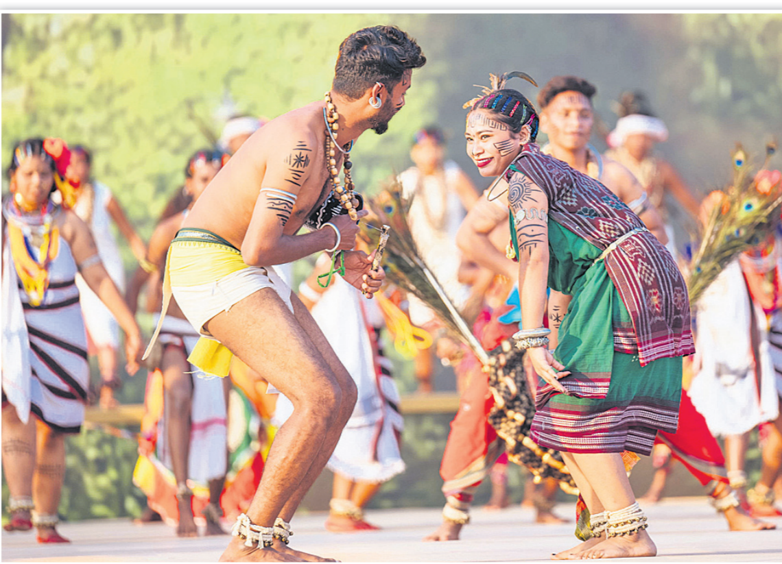
ଓଡ଼ିଶା କଳାକାରଙ୍କ ଦ୍ୱାରା ପାରମ୍ପରିକ ନୃତ୍ୟ ପରିବେଷଣ ।