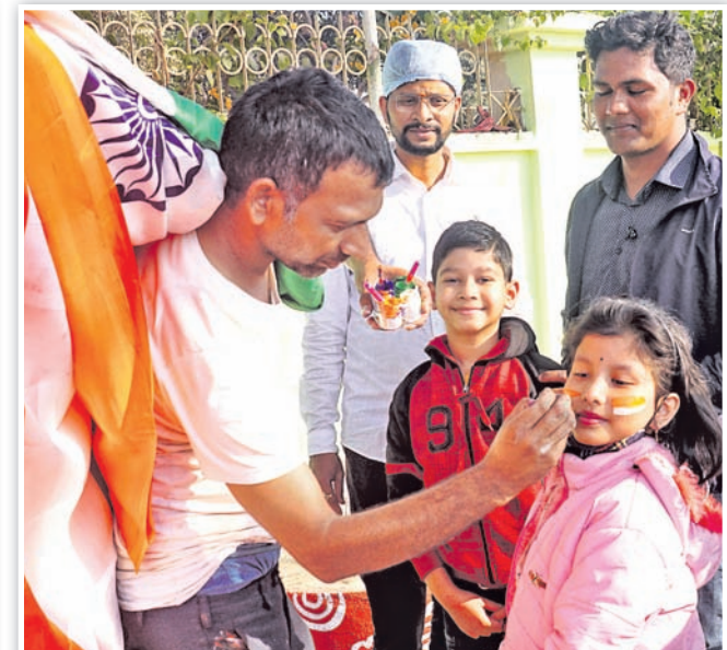
ଜଣେ ପିଲା ଗାଲରେ ଟ୍ରାଜା ଚିତ୍ର କରୁଛନ୍ତି ।