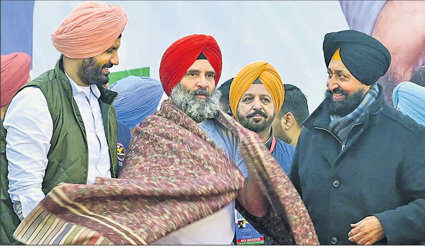
ଭାରତଯୋଡ଼ା ଯାତ୍ରା ଅବସରରେ ରୁଧିର ପଞ୍ଜାବର ଫଟେଗଡ଼ ସାହିବରେ କଂଗ୍ରେସ ନେତା ରାହୁଲ ଗାନ୍ଧୀ ।

ରାଜ୍ୟପାଳଙ୍କୁ କାର୍ଯ୍ୟକର୍ତ୍ତା ଭାବେ ବ୍ୟବହାର କରୁଥିବା କଂଗ୍ରେସ ଅଧ୍ୟକ୍ଷ ମଲ୍ଲିକାର୍ଜୁନ ଖାର୍ବେ ଅଭିଯୋଗ କରିଛନ୍ତି । କେତେକ ରାଜ୍ୟପାଳ ଭାରତୀୟ ରାଜନୀତିର ସଂଘୀୟ ଡାକ୍ତରୀ ପଦ୍ଧତିକୁ ନଷ୍ଟ କରି ସମ୍ପୂର୍ଣ୍ଣ ନିଜ ପକ୍ଷରେ ନିଜେ ହସ୍ତକ୍ଷେପ କରୁଥିବା କଂଗ୍ରେସ ନେତା କହିଛନ୍ତି । ବିରୋଧୀ ଦଳ ଶୀଘ୍ର ରାଜ୍ୟର ରାଜ୍ୟପାଳମାନଙ୍କୁ