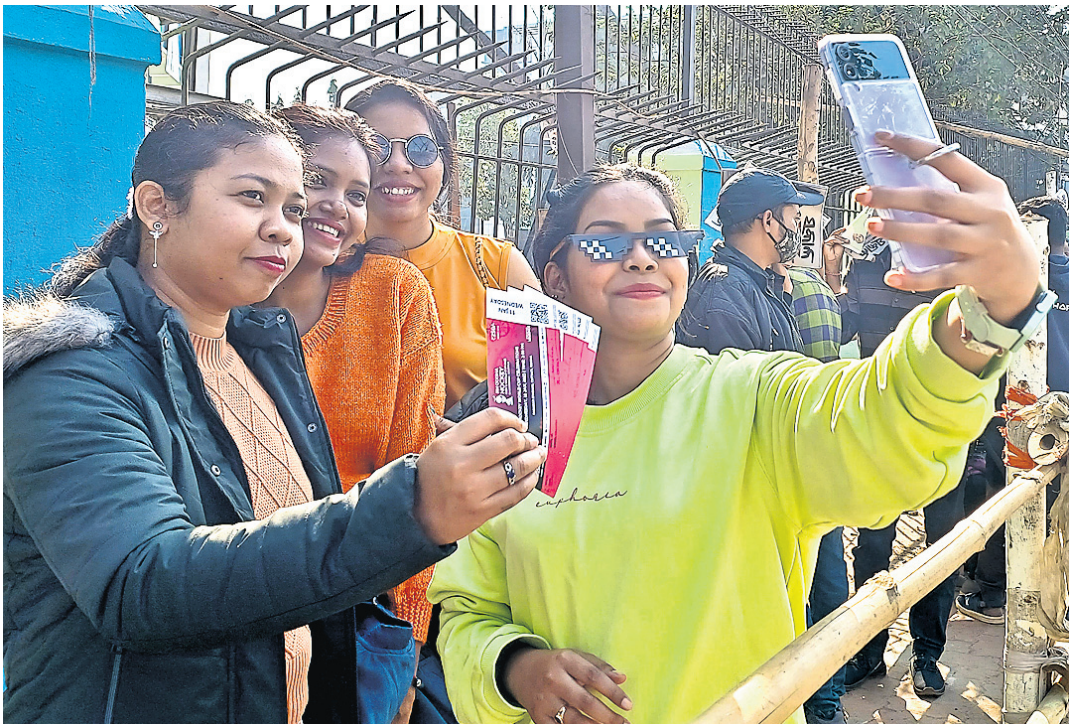
ଷ୍ଟାଡ଼ିୟମକୁ ଯିବା ପୂର୍ବରୁ ଟିକେଟ ସହ ସୁବତ୍ତାମାନେ ସେଲ୍ଫି ନେଉଛନ୍ତି ।