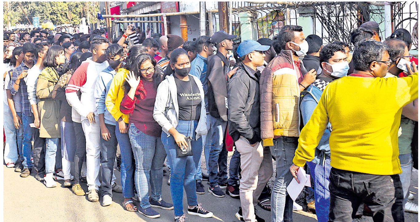
ବାରବାଟୀ ଷ୍ଟାଡ଼ିୟମ ଭିତରକୁ ପ୍ରବେଶ କରିବାକୁ ଦର୍ଶକଙ୍କ ଲମ୍ବା ଧାଡ଼ି ।