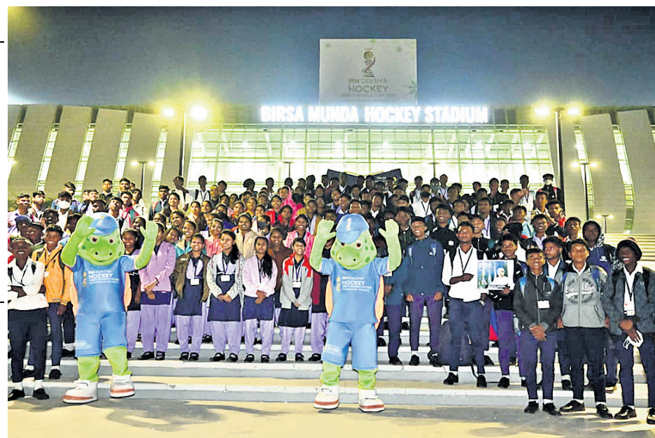
ରାଉରକେଲାର ବିର୍ସା ମୁଖ୍ୟ ଷ୍ଟାଡ଼ିୟମ ପରିବର୍ତ୍ତନରେ ଯାଉଥିବା ଭୁବନେଶ୍ୱର ତପୋବନ ସାଇକ୍ଲର ଛାତ୍ରାଛାତ୍ର ।