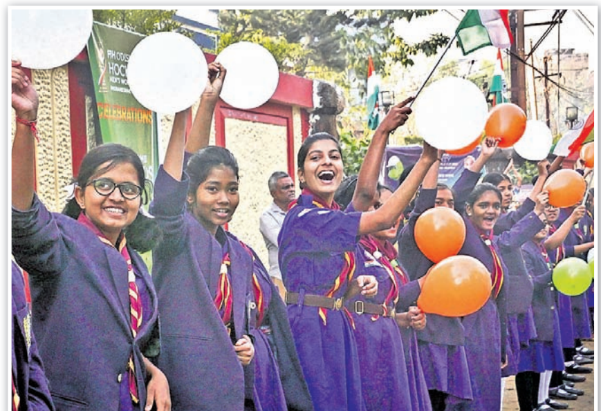
ବିଶ୍ୱକପ ଝୁନି ଟ୍ରଫିକୁ କଟକର ବିଭିନ୍ନ ସ୍କୁଲ ଓ କଲେଜ ଛାତ୍ରା ସାଗତ କରୁଛନ୍ତି ।