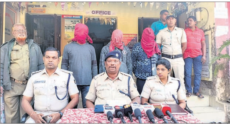
ଖବରଦାତା ସମ୍ମିଳନୀରେ ପୋଲିସ୍ ଅଧିକାରୀ ଗିରଫ ଅଭିଯୁକ୍ତଙ୍କ ସମ୍ପର୍କରେ ସୂଚନା ଦେଉଛନ୍ତି।