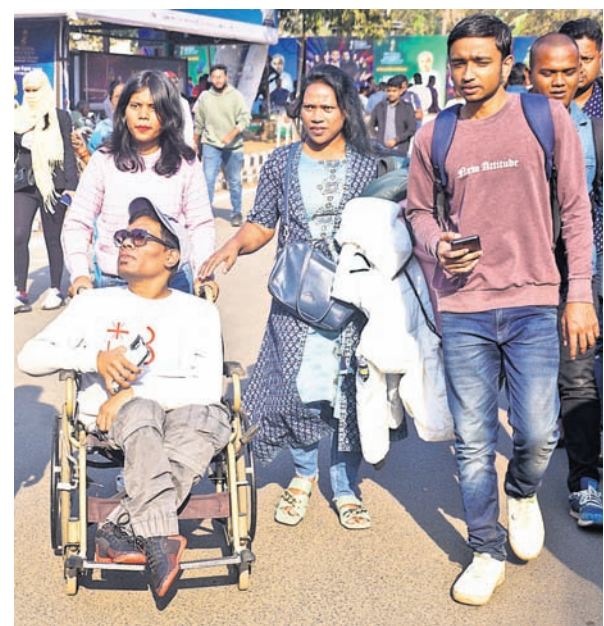
ଜଣେ ଦିବ୍ୟାଙ୍ଗ ବାରବାଟୀ ଷ୍ଟାଡ଼ିୟମ ମଧ୍ୟକୁ ପ୍ରବେଶ କରୁଛନ୍ତି ।