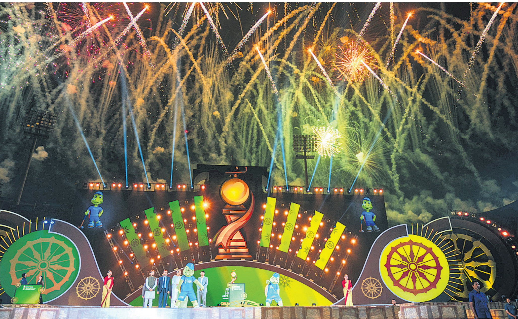
ବାରବାଟୀ ଷ୍ଟାଡ଼ିୟମରେ ହକି ଦିଶ୍ୱକାସ ମହାକୁସ୍‌ର ସାଂସ୍କୃତିକ କାର୍ଯ୍ୟକ୍ରମକୁ ପୁଞ୍ଜ୍ୟମନ୍ତ୍ରୀ ନବୀନ ପଟ୍ଟନାୟକ ଉଦ୍ଘାଟନା କରୁଛନ୍ତି, ଡିକନରେ ଅଛନ୍ତି କେନ୍ଦ୍ର କ୍ରୀଡ଼ାମନ୍ତ୍ରୀ ଅନୁରାଗ ସିଂ ଠାକୁର ଓ ଅନ୍ତର୍ଜାତୀୟ ହକି ମହାସଂଘର ସଭାପତି ତାୟାବ ଇକ୍ରାମ ।