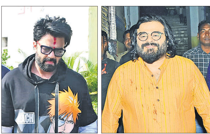
ମହାପ୍ରଭୁଙ୍କୁ ଦର୍ଶନ ପାଇଁ ଶ୍ରୀମନ୍ଦିର ଆସିଥିବା ଅଭିନେତା ମନୀଷ ପଲ ଏବଂ କଣ୍ଠଶିଳ୍ପୀ ପ୍ରୀତମ ଚକ୍ରବର୍ତ୍ତୀ।

ପୁରୀ ଅଫିସ, ୧୧୧୧ ଓଡ଼ିଶା ଗପ୍ଟ ଅବସରରେ ବଲିଉଡ୍ ଅଭିନେତା ମନୀଷ ପଲ ଏବଂ କଣ୍ଠଶିଳ୍ପୀ ପ୍ରୀତମ ଚକ୍ରବର୍ତ୍ତୀ କୁଧାରୀ ପୁରୀ ଆସି ମହାପ୍ରଭୁଙ୍କୁ ଦର୍ଶନ କରିଛନ୍ତି। ମନୀଷ ଓ ପ୍ରୀତମ ବାଇଶି ପାହାଚ ବେଳେ ଶ୍ରୀମନ୍ଦିରକୁ ପ୍ରବେଶ କରିଥିଲେ। ଭିତରବେଢ଼ା ନିକଟରେ ରତ୍ନସିଂହାସନାରୁ ଶ୍ରୀବିଗ୍ରହଙ୍କୁ ଦର୍ଶନ କରିଥିଲେ। ପରେ ବେଢ଼ା ପରିସରସ୍ଥ ମା' ମହାଲକ୍ଷ୍ମୀ, ମା' ବିନା, ବଚନଶେଖର ସମେତ ବିଭିନ୍ନ ଦେବଦେବୀଙ୍କୁ ଦର୍ଶନ କରିଥିଲେ। ଶ୍ରୀମନ୍ଦିର ଭିତରେ କିଛି ସମୟ ବିତାଇବା ପରେ ପ୍ରସ୍ଥାନ କରିଥିଲେ। ମନୀଷ ପ୍ରଥମ ଥର ପାଇଁ ପୁରୀ ଆସି ମହାପ୍ରଭୁଙ୍କୁ ଆଶିଷ ଛିଣ୍ଡା କରିବା ସହ ଦେଶର ମଙ୍ଗଳ କାମନା କରିଥିବା କହିଛନ୍ତି। ସେହିପରି କଣ୍ଠଶିଳ୍ପୀ ପ୍ରୀତମ ରାତିରେ ଆସି ମହାପ୍ରଭୁଙ୍କୁ ଦର୍ଶନ କରି ଫେରିଯାଇଛନ୍ତି।