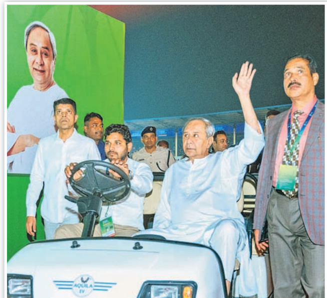
ମୁଖ୍ୟମନ୍ତ୍ରୀ ନବୀନ ପଟ୍ଟନାୟକ ଷ୍ଟାଡ଼ିୟମ ମଧ୍ୟକୁ ବ୍ୟାଚେରି ଚାଲିତ ଗାଡ଼ିରେ ପ୍ରବେଶ କରୁଛନ୍ତି ।