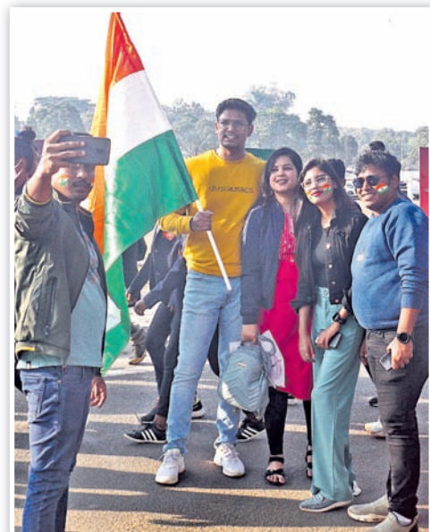
ଷ୍ଟାଡ଼ିୟମକୁ ଯିବା ପୂର୍ବରୁ ଜାତୀୟ ପତାକା ସହ ସେଲ୍ଫି ନେଉଛନ୍ତି ।