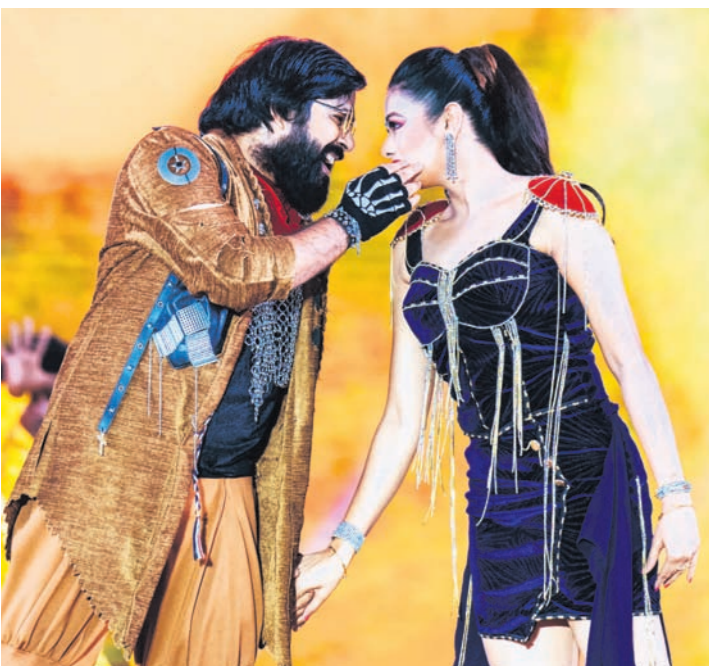
ଓଲିଭର୍ କଳାକାର ସବ୍ୟସାଚୀ ଓ ଅନ୍ତର୍ଜାତୀୟ ହକି ମହାସଂଘର ସଭାପତି ତାୟାବ ଇକ୍ରାମ ।