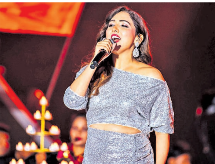
ବଲିଭଲ୍ ଗାୟିକା ନୀତି ମୋହନ ସଙ୍ଗୀତ ପରିବେଷଣ କରୁଛନ୍ତି ।