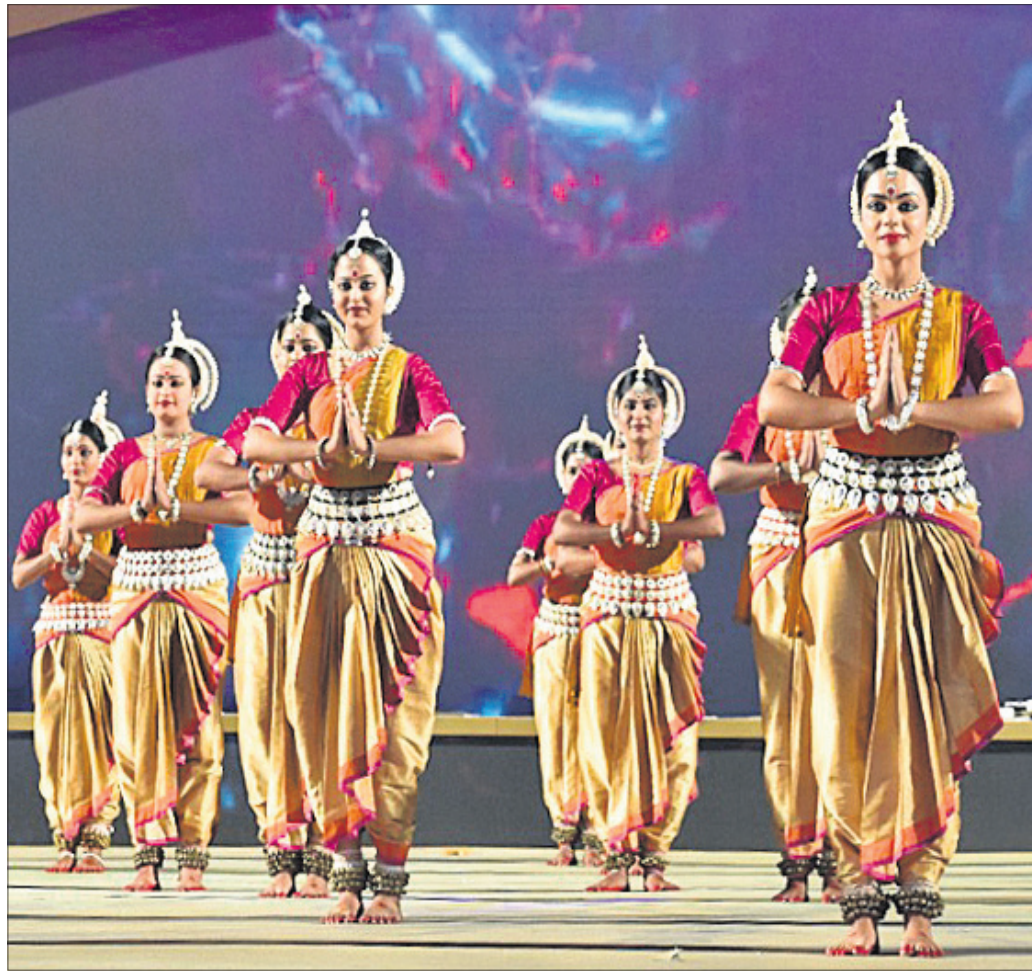
କଳାକାରଙ୍କ ସ୍ୱାରା ଓଡ଼ିଶୀ ନୃତ୍ୟ ପରିବେଷଣ।