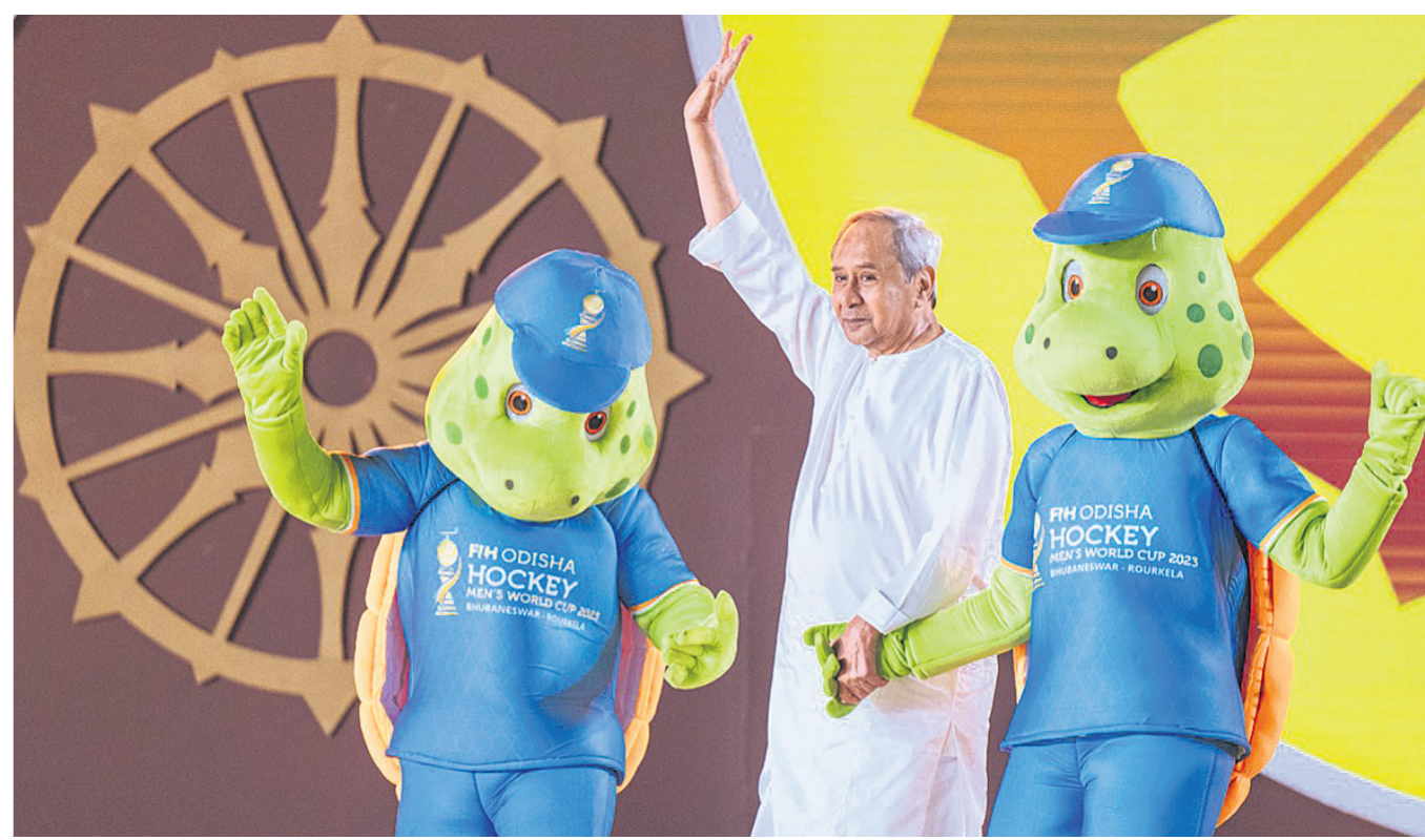
ମାୟକ୍ ଓଲିଭର୍ ଓ ବିଗ୍‌ସ୍‌ଟାର୍ ମୁଖ୍ୟମନ୍ତ୍ରୀ ନବୀନ ପଟ୍ଟନାୟକ ମଞ୍ଚକୁ ପ୍ରବେଶ କରୁଛନ୍ତି ।