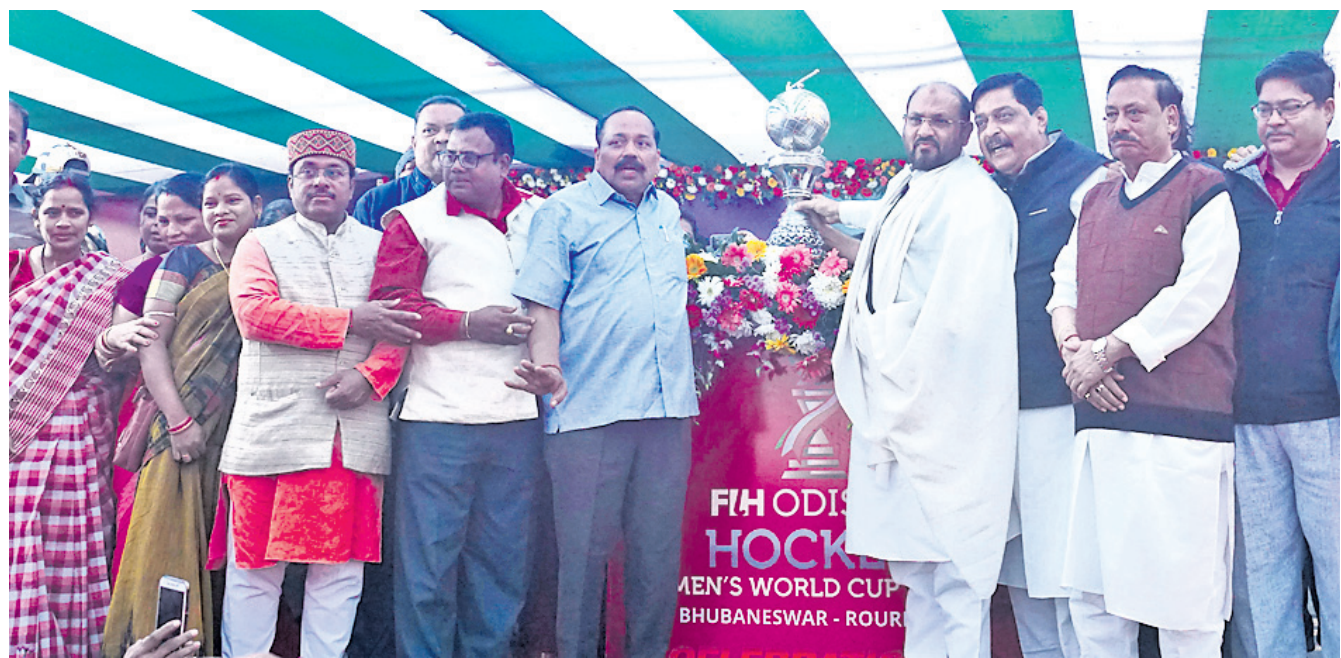
କଟକରେ ଟ୍ରଫିକୁ ସବୁ ବଳର ନେତୃମଣ୍ଡଳ ସାଗତ କରୁଛନ୍ତି ।