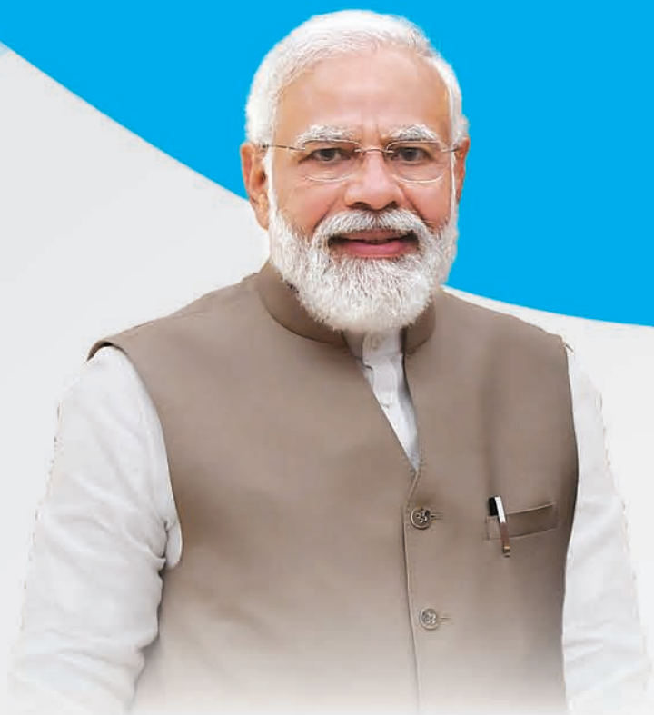
ଶ୍ରୀ ନରେନ୍ଦ୍ର ମୋଦୀ ମାନନୀୟ ପ୍ରଧାନମନ୍ତ୍ରୀ