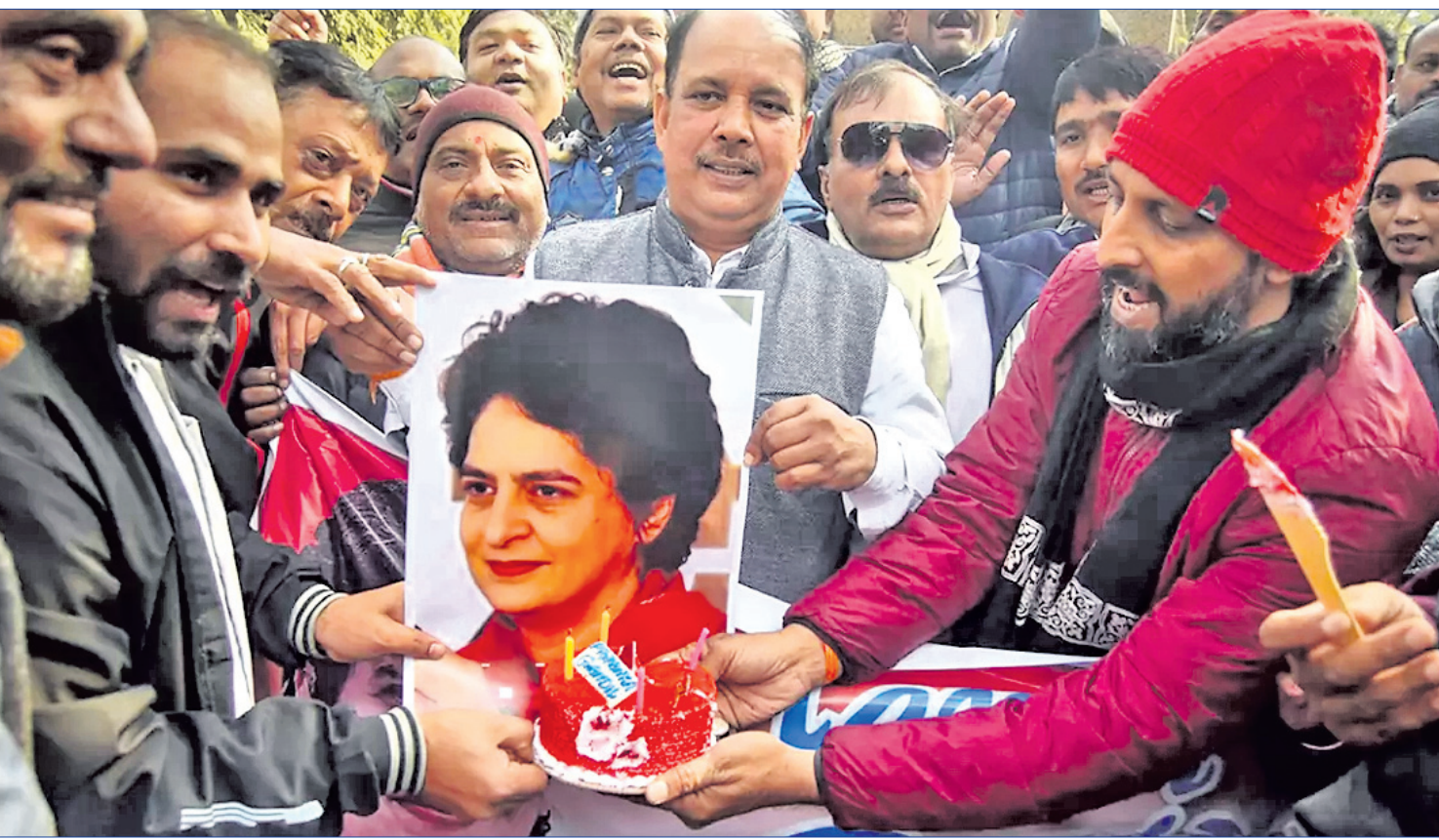
ଭରପୁରବେଶର ପ୍ରଧାନମନ୍ତ୍ରୀଙ୍କୁ କଂଗ୍ରେସ କର୍ମୀମାନେ ଗୁରୁବାର ଏଆଇସିସି ସାଧାରଣ ସମାବେଶ ପ୍ରୟୋଗୀ ଗାନ୍ଧୀଭଦ୍ରାଙ୍କ ଜନ୍ମଦିନ ପାଳନ କରୁଛନ୍ତି।