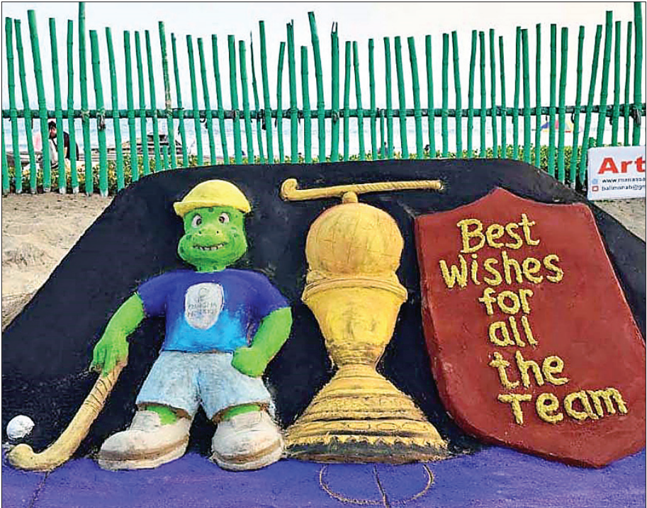
ପୁରୀ ବଳିଆପଣା ନିକଟ ବେଲୁଜୁରିରେ ରୁଧିର ଅନ୍ତର୍ଜାତୀୟ ବାଲୁକା ଶିଳ୍ପ ମାନସ ସାହୁ ବାଲୁକା କଳା ମାଧ୍ୟମରେ ହକି ବିଶ୍ୱକପ ସହ ଖେଳାଳିଙ୍କୁ ଶୁଭେଚ୍ଛା ଜଣାଇଛନ୍ତି।