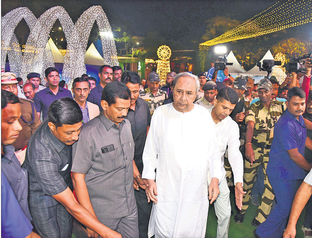
କଳିଙ୍ଗ ଷ୍ଟାଡିୟମରେ ମୁଖ୍ୟମନ୍ତ୍ରୀ ନବୀନ ପଟ୍ଟନାୟକ ଓଲି ରାଇଜ ବୁଲି ଦେଖିଛନ୍ତି।

ଭୁବନେଶ୍ୱର, ୧୨।୧ (ସୁଧାବତୀ) ଶୁକ୍ରବାରଠାରୁ ଆରମ୍ଭ ହେଉଛି ବିଶ୍ୱକପ୍ ହକି। ପ୍ରଥମ ଦିନର ମ୍ୟାଚ୍ କଳିଙ୍ଗ ଷ୍ଟାଡିୟମରେ ଖେଳାଯିବାକୁ ଥିବାବେଳେ ପ୍ରସ୍ତୁତି ଶେଷ ହୋଇଛି। ମ୍ୟାଚ୍ ପୂର୍ବରୁ ଗୁରୁବାର ସନ୍ଧ୍ୟାରେ 'ଓଲି ରାଇଜ' ବୁଲି ଦେଖିଛନ୍ତି ମୁଖ୍ୟମନ୍ତ୍ରୀ ନବୀନ