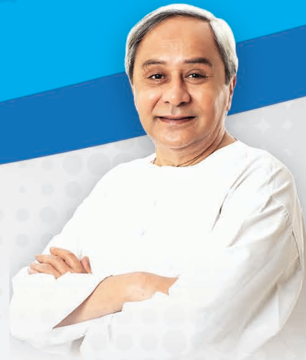
ଶ୍ରୀ ନବୀନ ପଟ୍ଟନାୟକ ମାନନୀୟ ମୁଖ୍ୟମନ୍ତ୍ରୀ, ଓଡ଼ିଶା