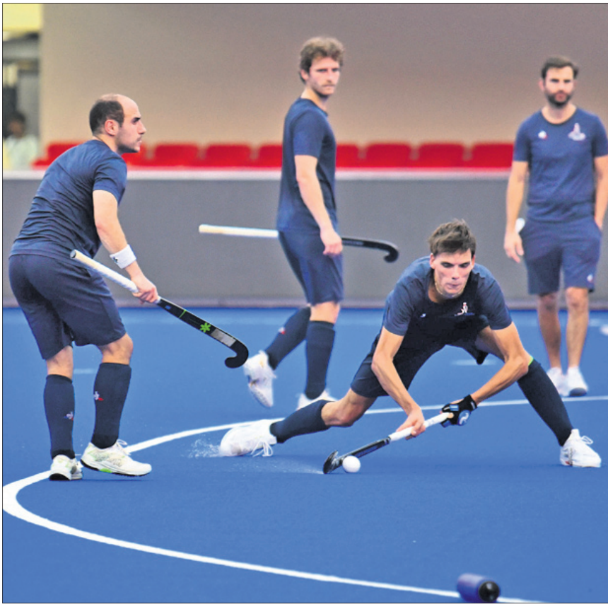
କଳିଙ୍ଗ ଖୁଡ଼ିମରେ ଗୁରୁବାର ଫ୍ରାନ୍ସ ଦଳର ଅଭ୍ୟାସ।

ହୋଇ ସାରିଥିବାବେଳେ ଆର୍ଜେଣ୍ଟିନା ୬ଟି ମ୍ୟାଚରେ ବିଜୟୀ ହୋଇଛି ଓ ଗୋଟିଏ ମ୍ୟାଚ ଡ୍ର ରହିଛି। ୧୯ଟି ବର୍ଷ ଉଭୟ ଦଳ ପରସ୍ପର ବିପକ୍ଷରେ ୨ଟି ମ୍ୟାଚ ଖେଳି ସାରିଛନ୍ତି। ଏଥିପାଇଁ ଏହା ଲିଗରେ ଅନୁଷ୍ଠିତ ପ୍ରଥମ ମୁକାବିଲାରେ ଆର୍ଜେଣ୍ଟିନା ୪-୩ ଗୋଲରେ ବିଜୟୀ ହୋଇଥିବାବେଳେ ଦ୍ୱିତୀୟ ମ୍ୟାଚଟି ୨-୨ ଗୋଲରେ ଡ୍ର ରହିଥିଲା। ଉଭୟ ମ୍ୟାଚରେ କିଛି ଆର୍ଜେଣ୍ଟିନାକୁ କଡ଼ା ଚକ୍କର ଦେଇଥିଲା ଦକ୍ଷିଣ ଆଫ୍ରିକା। ଶେଷ ମ୍ୟାଚରେ ଆର୍ଜେଣ୍ଟିନାର ଶତଚେଷ୍ଟା ସତ୍ୟ ହେବାକୁ ଦେଇ ନ ଥିଲା ଆଫ୍ରିକାର ଦଳ। ତେଣୁ ସକାରାତ୍ମକ ଫଳାଫଳ ସହ ବିଶ୍ୱକପ ଆରମ୍ଭ ଲକ୍ଷ୍ୟରେ ରହିଛି ଦକ୍ଷିଣ ଆଫ୍ରିକା। ୨୦୧୪ରେ ବ୍ରୋଞ୍ଜ ପଦକ ଜିତିଥିବା ଆର୍ଜେଣ୍ଟିନା ଏଥର ମଧ୍ୟ ପୋଡ଼ିମ ପିନିଶ୍ ଆଖାରେ ଥିବାରୁ ମ୍ୟାଚ ଦେଖି ସଂପୂର୍ଣ୍ଣ ହେବା ଆଶା କରାଯାଉଛି।