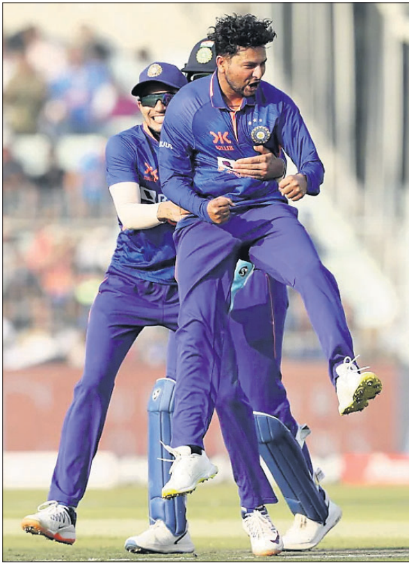
ବାସୁନ ଶନକାଙ୍କୁ ଆଉଟ କରିବା ପରେ କୁଲଦୀପ ଯାଦବ।

ଭାରତ ଶ୍ରୀଲଙ୍କା ବିପକ୍ଷ ଦ୍ୱିତୀୟ ଦିନକିଆ କ୍ରିକେଟ ମ୍ୟାଚକୁ ଜିତି ୨-୦ରେ ଅଗ୍ରଣୀ ସହ ୩ ମ୍ୟାଚ୍ ବିଶିଷ୍ଟ ସିରିଜକୁ ଆଗୁଆ କବ୍ଜା କରିନେଇଛି। ଗୁରୁବାର ଐତିହାସିକ ଇଡେନ୍ ଗାଡେନ୍ସରେ ଅନୁଷ୍ଠିତ ଏହି ମ୍ୟାଚରେ ବୋଲରଙ୍କ ସଫଳତା ଓ ଲୋକେଶ ରାହୁଲଙ୍କ ଲକ୍ଷ୍ମୀ ଅର୍ଦ୍ଧଶତକ ବଳରେ ଭାରତ ୪ ଉଇକେଟରେ ବିଜୟ ହୋଇଛି। ଚନ୍ଦ୍ର କିତି ଶ୍ରୀଲଙ୍କା ପ୍ରଥମେ ବ୍ୟାଟି ନିଷ୍ପତ୍ତି ନେଇଥିବା ବେଳେ ଗୋଟିଏ ପରିବର୍ତ୍ତନ ସହିତ ପଡିଆକୁ ଓହ୍ଲାଇଥିଲା ଭାରତ। ଯୁଦ୍ଧବେଳେ ଚଳାଇବା ପାଇଁ କୁଲଦୀପ ଯାଦବ ଏହି ମ୍ୟାଚ ଖେଳିଥିଲେ। ଶ୍ରୀଲଙ୍କାର ଚନ୍ଦ୍ର ୩ ବ୍ୟାଟରଙ୍କ ଠାରୁ ଭଲ ଅବଦାନ ମିଳିଥିଲା। ତେବେ ଦିଲି ଓଭରରେ କୁଲଦୀପ ଯାଦବ ଓ ଉମ୍ରାନ ମଲିକଙ୍କ ଘାତକ ବୋଲିଂ ବଳରେ ଶ୍ରୀଲଙ୍କା ମାତ୍ର ୨୧୫ ରନରେ ସୀମିତ ରହିଥିଲା। ଦିନକିଆ ପଦାର୍ପଣ କରିଥିବା ଓଡ଼ିଶା ଫର୍ମାଟରେ ଚନ୍ଦ୍ର ଖୋରର ରହିବା ସହିତ ୫୦ ରନ୍ ଖୋର କରିଥିଲେ। ଅନ୍ୟ ମାନକ ମଧ୍ୟରେ କୁଶଳ ମେଣ୍ଡସ ୩୪ ଓ ଦୁନିଥ ଫୋଲୋରେ ୩୨ ରନ୍ର ଇନିଂସ ଖେଳିଥିଲେ। ଏକଦା ୧ ଉଇକେଟରେ ୧୦୨ ରନ୍ କରିଥିବା ବେଳେ ଶ୍ରୀଲଙ୍କା ପରବର୍ତ୍ତୀ ୫୧ ରନରେ ୨ ଉଇକେଟ ହରାଇଥିଲା।