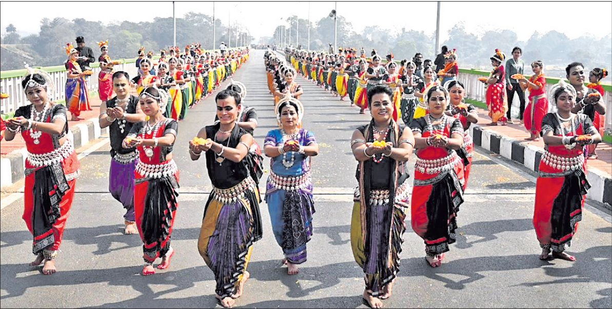
ବିଶ୍ୱକପ୍ ସକ୍ରିୟତାକୁ ସ୍ୱାଗତ କରିବା ପାଇଁ ଗୁରୁବାର ରାଉରକେଲା ବ୍ରାହ୍ମଣୀ ବ୍ରିଜ୍ ଉପରେ କଳାକାରମାନଙ୍କ ଓଡ଼ିଶୀ ନୃତ୍ୟ ପରିବେଷଣ।