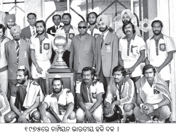
୧୯୭୫ରେ ଚାମ୍ପିୟନ ଭାରତୀୟ ହକି ଦଳ ।

ଅତୀତକାଳୀନ ହକି ଫେଡ଼େରେଶନ (ଏଫଆଇଏଚ୍) ଆନୁକୁଲ୍ୟରେ ୧୯୭୧ରେ ଆରମ୍ଭ ହୋଇଥିଲା ହକି ବିଶ୍ୱକପ। ପ୍ରତିଯୋଗିତାର ସର୍ବ ପ୍ରଥମ ସଂସ୍କରଣରେ ପାକିସ୍ତାନ ପିକ୍ସିଥିଲା ବିଜୟ ପୁରୁଟା। ସ୍ପେନ୍‌ର ବାସିଲୋନାରେ ଅନୁଷ୍ଠିତ ଏହି ମେଗା ପ୍ରତିଯୋଗିତାର ଫାଇନାଲରେ ସ୍ପେନ୍‌କୁ ହରାଇ ପାକିସ୍ତାନ ଚାମ୍ପିୟନ ହୋଇଥିଲା। ଫ୍ରେ-ଅଫରେ କେନିୟାକୁ ହରାଇ ଭାରତ ବ୍ରୋଜା ପଦକ ହାସଲ କରିଥିଲା। ୧୯୭୩ ନେଦରଲାଣ୍ଡର ଆମଷ୍ଟେରଡ଼ିଠାରେ ଅନୁଷ୍ଠିତ ଦ୍ୱିତୀୟ ସଂସ୍କରଣରେ ଘରୋଇ ନେଦରଲାଣ୍ଡ ଗାଜେଲ ହାସଲ କରିଥିଲା। ଏଥିରେ ଭାରତ ଚମତ୍କାର ପ୍ରଦର୍ଶନ କରିଥିଲେ ହେଁ ଫାଇନାଲରେ ନେଦରଲାଣ୍ଡଠାରୁ ଯେନାଲ୍ ଷ୍ଟେକ୍ ୨-୪ ଗୋଲରେ ହାରି ରୌପ୍ୟ ପଦକରେ ସମ୍ବୃଷ୍ଟ ହୋଇଥିଲା। ପଶ୍ଚିମ ଜର୍ମାନୀ ତୃତୀୟ ଓ ପାକିସ୍ତାନ ୪ର୍ଥ ସ୍ଥାନ ପାଇଥିଲା। ୧୯୭୫ ମାଲେସିଆର କୁଆଲାଲମ୍ପୁରରେ ଅନୁଷ୍ଠିତ ୩ୟ ସଂସ୍କରଣରେ ଭାରତ ହୋଇଥିଲା ବିଶ୍ୱ ବିଜୟୀ। ଅନିତ ପାକିସ୍ତାନ ନେତୃତ୍ୱାଧୀନ ଭାରତୀୟ ଦଳ ଫାଇନାଲରେ ପାରମ୍ପରିକ ପ୍ରତିଦ୍ୱନ୍ଦ୍ୱୀ ପାକିସ୍ତାନକୁ ୨-୧ ଗୋଲରେ ହରାଇ ଚାମ୍ପିୟନ ହୋଇଥିଲା। ପଶ୍ଚିମ ଜର୍ମାନୀ ଓ ମାଲେସିଆ ପରିବର୍ତ୍ତୀ ୨ ସ୍ଥାନ ଅଧିକାର କରିଥିଲେ। ୧୯୭୮ରେ ପାକିସ୍ତାନ, ନେଦରଲାଣ୍ଡ, ଅଷ୍ଟ୍ରେଲିଆ, ପଶ୍ଚିମ ଜର୍ମାନୀ, ୧୯୮୨ରେ ପାକିସ୍ତାନ, ପଶ୍ଚିମ ଜର୍ମାନୀ, ଅଷ୍ଟ୍ରେଲିଆ,