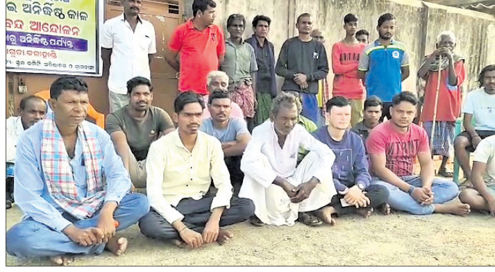
ଗ୍ରାମବାସୀ ଧାରଣାରେ ବସିଛନ୍ତି।

କଳାହାଣ୍ଡି ଜିଲ୍ଲା ଧର୍ମଗଡ଼ ବ୍ଲକ୍ ବେହେରାଗୁଡ଼ା ଗ୍ରାମର ସରକାରୀ ଉଚ୍ଚ ବିଦ୍ୟାଳୟରେ ଶିକ୍ଷକ ଦାବି ନେଇ ଚାଲିଥିବା ତାଲା ବନ୍ଦ ଆନ୍ଦୋଳନକୁ ୧୧ ଦିନ ବିତଯାଇଛି।