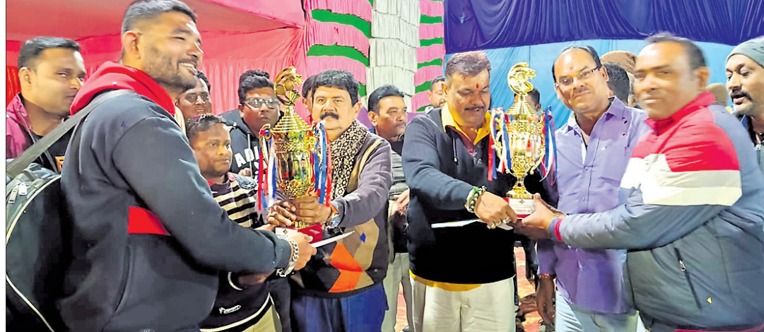
ଖେଳାଳିଙ୍କୁ ପୁରସ୍କୃତ କରାଯାଇଛି। ଖଡ଼ିଆଳ, ୧୩।୧ (ଡି.ଏନ.ଏ.)

ନୂଆପଡ଼ା ଜିଲ୍ଲା ଖଡ଼ିଆଳ ସମ୍ବଲପୁର ମନ୍ଦିରଠାରେ ଖଡ଼ିଆଳ ମୁଦ୍ରା ମୋର୍ଟା ପକ୍ଷରୁ ଚାଲିଥିବା ଡକ୍ଟର ବ୍ୟାଞ୍ଜନିଷ୍ଟନ ଚାମ୍ପିୟନଶିପ ଉଦ୍‌ଘାଟିତ ହୋଇଯାଇଛି।