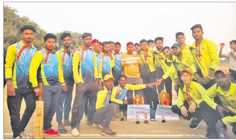
ପ୍ରତି ସହିତ ଭଲ ଯତ୍ନ ଗେଜେଟି ।