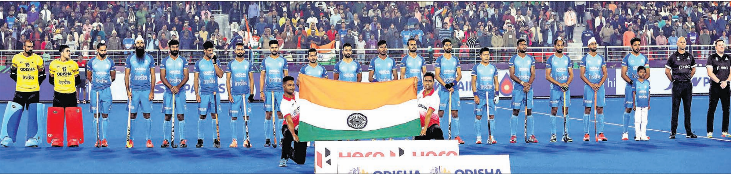
ସ୍ନେହ ବିପକ୍ଷ ମ୍ୟାଚ୍ ଆରମ୍ଭ ପୂର୍ବରୁ ଭାରତୀୟ ସଞ୍ଚାପ ଗାନ ସମୟରେ ଭାରତୀୟ ଖେଳାଳି ।