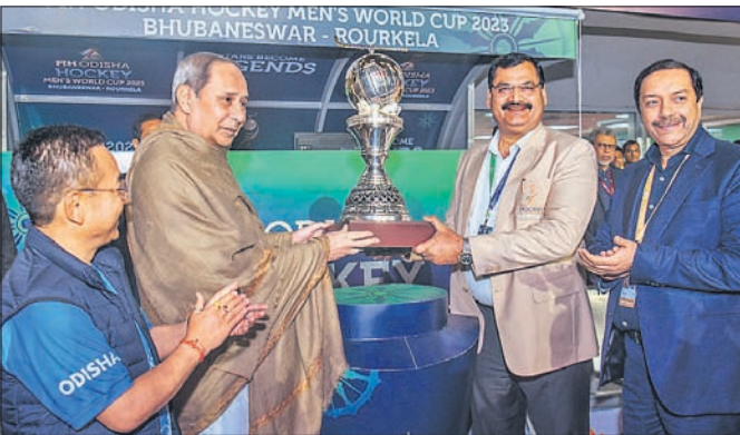
ବିର୍ସା ମୁଣ୍ଡା ହକି ଷ୍ଟାଡ଼ିୟମରେ ଶୁକ୍ରବାର ବିଶ୍ୱକପ ଗ୍ରୁପ୍ ସହ ମୁଖ୍ୟମନ୍ତ୍ରୀ ନବୀନ ପଟ୍ଟନାୟକ, ହକି ଇଣ୍ଡିଆ ଓ ଅନ୍ତର୍ଜାତୀୟ ହକି ଫେଡେରେଶନ (ଏଫଏଚଆଇ)ର ଅଧିକାରୀମାନେ।

ଦେଇ ଉପଅଧିନାୟକ ଦାୟିତ୍ୱ ସେ ସଫଳତାର ସହ ଝୁଲାଇଛନ୍ତି। ପ୍ରତିଯୋଗିତାର ଅନ୍ୟତମ ଚାଲେଳା ଦାବିଦାର ଖେଳକୁ ୨-୦ ଗୋଲରେ ହରାଇ ଅଭିଯାନ ଆରମ୍ଭ କରିଛନ୍ତି ଭାରତ।