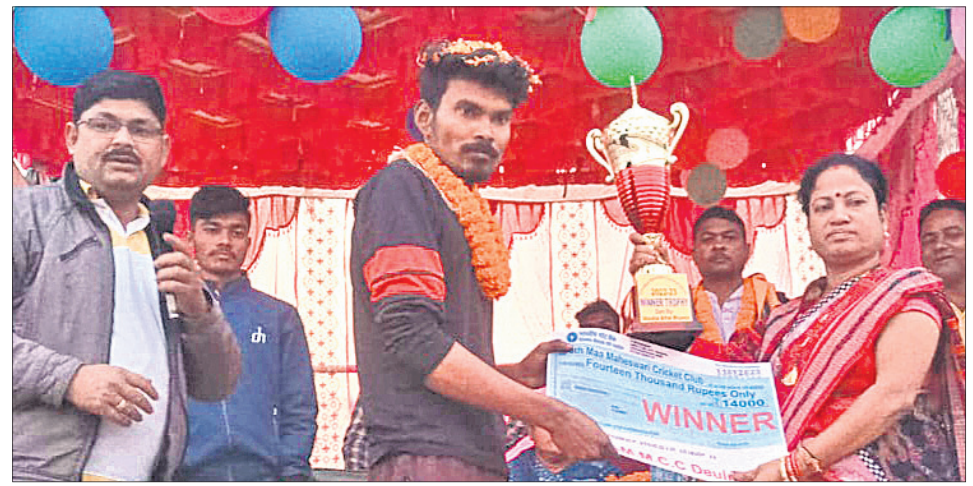
ଚାମ୍ପିୟନ ଦଳକୁ ପୁରସ୍କୃତ କରାଯାଇଛି ।